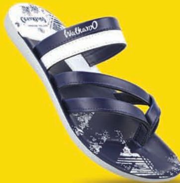
[ Art No : WG5449 ]