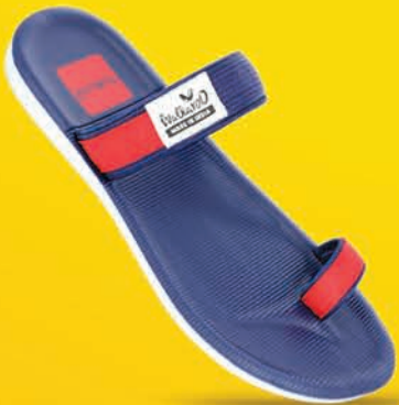
[ Art No : WG5328 ]