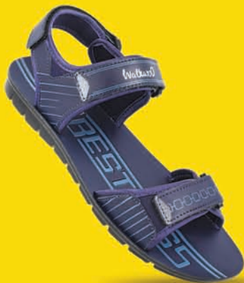
[ Art No : WG5759 ]