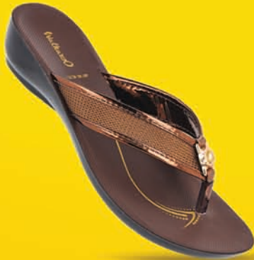
[ Art No : WL7072 ]