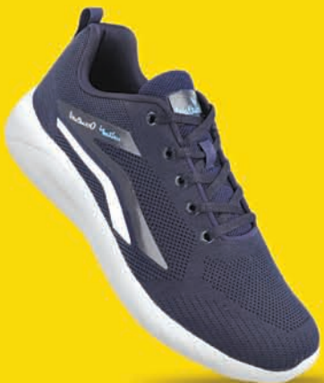
[ Art No : XS9764 ]