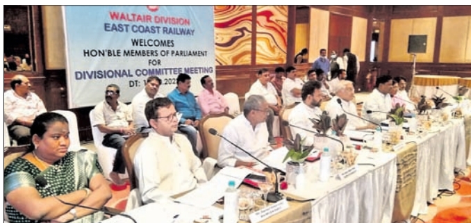
ବୈଠକରେ କୋରାପୁଟ ଏମ୍ପି ସପ୍ଲିମେଣ୍ଟ ଉଲ୍ଲାସ ଓ ଅନ୍ୟମାନେ ।