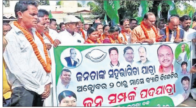
ପଦଯାତ୍ରାରେ ବିଜେଡି ନେତା ଓ କର୍ମୀମାନେ ।