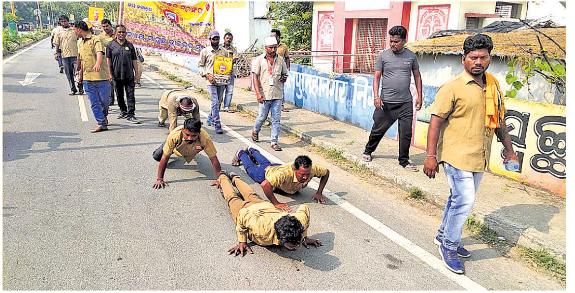
ସମଲେଇ ମନ୍ଦିର ନିକଟରୁ ଦେଖାଯାଉଥିବା ନବୀନ ନିବାସ ନିର୍ମାଣ କରାଯାଇଛି ।