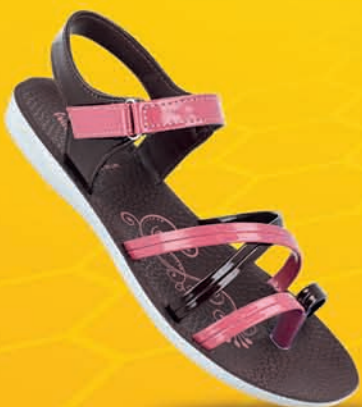
[ Art No : WL7812 ]