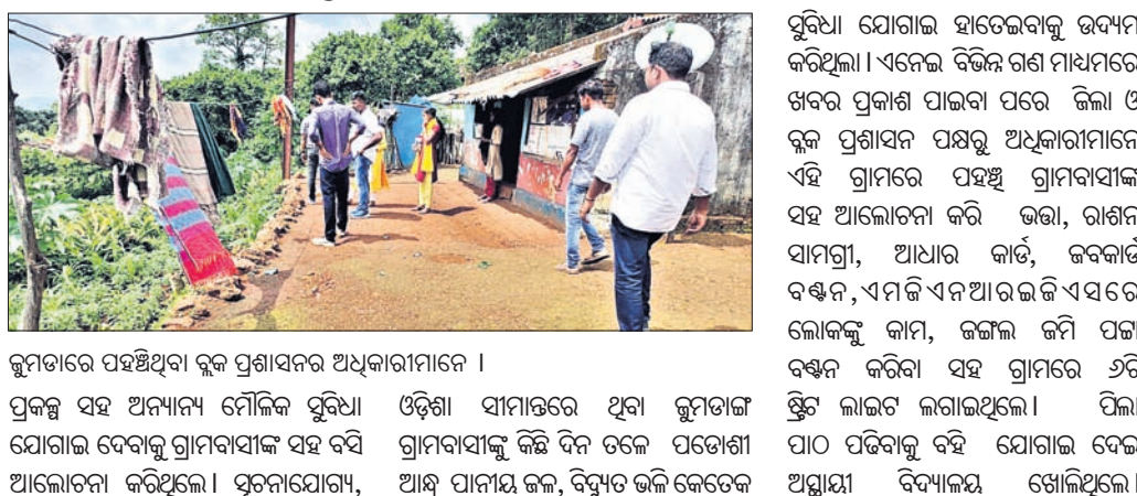
ଜୁମ୍ପାଟାରେ ପହଞ୍ଚିଥିବା ବୁଦ୍ଧ ପ୍ରଶାସନ ଅଧିକାରୀମାନେ ।

ସ୍ଵାଭିମାନ ଅଞ୍ଚଳର ଜୁମ୍ପାଟାରେ ବୁଦ୍ଧ ପ୍ରଶାସନ ଆରମ୍ଭ ହୋଇଛି । ସ୍ଵାଭିମାନ ଅଞ୍ଚଳର ଲୋକମାନଙ୍କୁ ଉଦ୍‌ଧାରଣ ପ୍ରଦାନ କରିବାକୁ ଅନୁରୋଧ କରିଥିଲେ ।