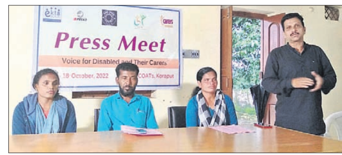
ଓସବରପା ସମ୍ମିଳନୀରେ କର୍ମକର୍ମୀମାନେ ସୂଚନା ଦେଇଛନ୍ତି ।

ରାଜ୍ୟରେ ପ୍ରଥମ କରି ପାଳିତ ହେବ ଭିନ୍ନଭିନ୍ନ ମତ୍ସ୍ୟକାରୀ ଦିବସ । ମତ୍ସ୍ୟକାରୀଙ୍କୁ ଉଦ୍‌ଧାରଣ ପ୍ରଦାନ କରିବାକୁ ଅନୁରୋଧ କରିଥିଲେ ।