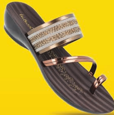
[ Art No : WL7435 ]