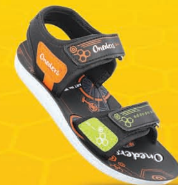
[ Art No : WK636 ]