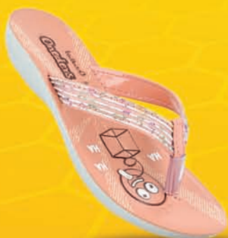
[ Art No : WK635 ]