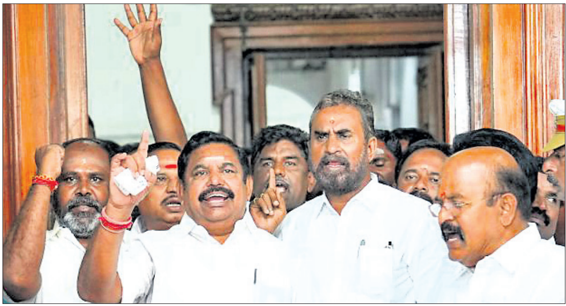
ତାମିଲନାଡୁ ବିଧାନସଭାରେ ମଙ୍ଗଳବାର ବିଶ୍ୱଜିତ ଆଚରଣ ପାଇଁ ବିରୋଧୀ ଦଳ ନେତା କେ. ପଲାନିସାମୀ ଓ ତାଙ୍କ ଏଥାଇସ୍‌ଏମ୍‌ସିଏସ୍ ବିଧାୟକମାନଙ୍କୁ ଗୃହସ୍ଥ ବାହାର କରିଦିଆଯାଇଛି। ବିରୋଧୀ ଦଳ ସଦସ୍ୟମାନେ ହତଗୋଳ କରି ଗୃହ ଚଳାଇ ନ ଦେବାକୁ ବାଚସ୍ପତି ଏମ୍. ଅପାଭୁଙ୍କ ନିର୍ଦ୍ଦେଶକ୍ରମେ ମାଣିଲମାନେ ସେମାନଙ୍କୁ ଗୃହସ୍ଥ ବାହାର କରିଦେଇଥିଲେ।