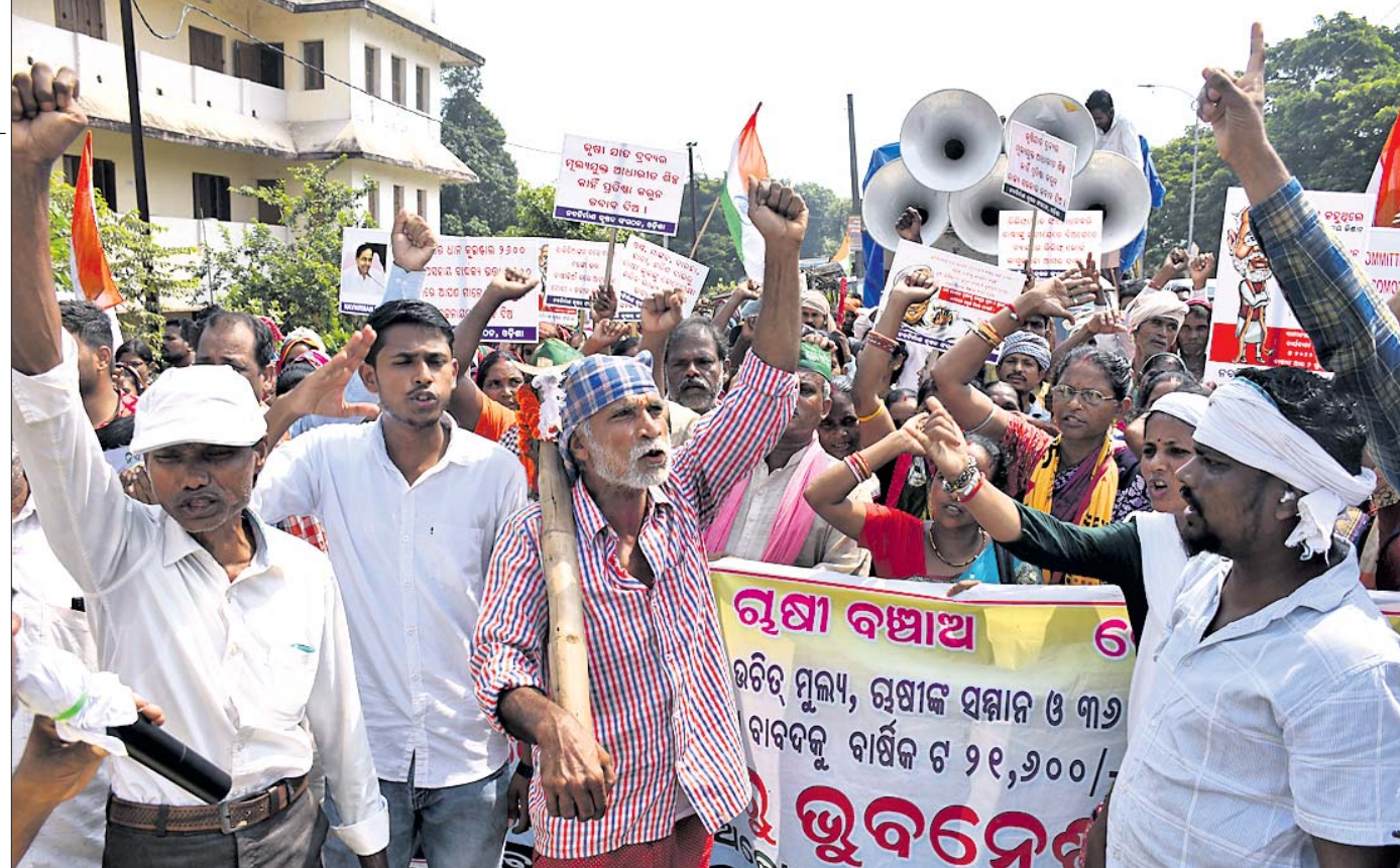
ବିଭିନ୍ନ ଦାବି ନେଇ ନବନିର୍ମାଣ କୃଷକ ସଙ୍ଗଠନ ପକ୍ଷରୁ ଭୁବନେଶ୍ୱର ହଂସପାଳ ନିକଟରେ ମଙ୍ଗଳବାର ଆୟୋଜିତ ପଦଯାତ୍ରା।