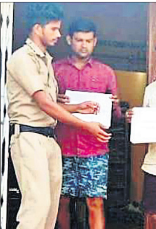
ଗିରଫ ଅଭିଯୁକ୍ତ ।

ଭିତରକନିକା ଜାତୀୟ ଉଦ୍ୟାନ ନିକଟସ୍ଥ ରାଜନଗର ନିକଟସ୍ଥ ମାଟିଆ ଗାଁ ତିନୁପଡ଼ା କାଳୁ ଜଙ୍ଗଲ ଭିତରେ ଫାସ ବସାଇ ଗୋଟିଏ ଜଙ୍ଗଲୀ ବାରୁହାକୁ ଶିକାରୀ କରିଥିଲେ ।