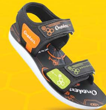
[ Art No : WK636 ]