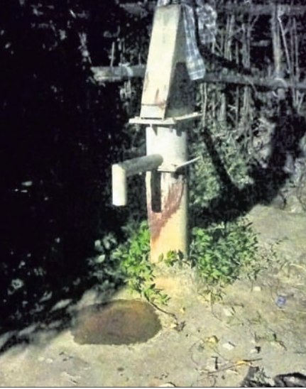
ଅବନ ହୋଇ ପଡ଼ିଥିବା ନଳକୂପ ।