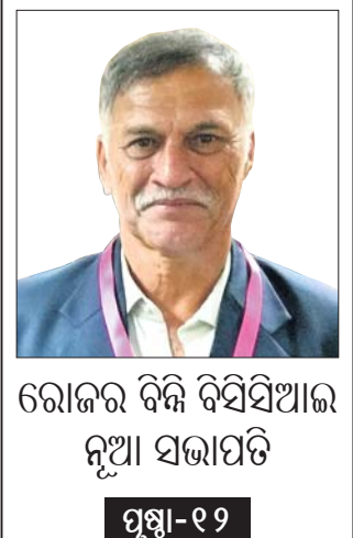
ରୋଜଗାର ବିକଳ ବିସିସିଆଇ ନୂଆ ସଭାପତି

ଅଞ୍ଚଳ ଉତ୍ପାଦନରେ ବହୁ କ୍ଷେତ୍ରର ଚାଷୀ ରହିଛନ୍ତି। ସେମାନଙ୍କ ଚାଷକର୍ମୀ ପରିମାଣ ମଧ୍ୟ କମ୍। ଅଳ୍ପ ଚାଷକର୍ମୀ ଉପରେ ବହୁ ଲୋକ ନିର୍ଭର କରୁଛନ୍ତି। ଚାଷ ବାବଦ ଖର୍ଚ୍ଚ ବହୁଥିବାରୁ ଚାଷୀଙ୍କ ଆୟ ହ୍ରାସ ହେବା ସ୍ୱାଭାବିକ। କିନ୍ତୁ ଯେଉଁ ରାଜ୍ୟଗୁଡ଼ିକରେ କୃଷିକ୍ଷେତ୍ରରୁ ଅଧିକ ଆୟ ହେଉଛି, ସେଠାରେ ଅଣକୃଷିକ୍ଷେତ୍ରରୁ ଆୟ ପଛା ମଧ୍ୟ ଅଧିକ ରହିଥିବା ଚେଷ୍ଟା ରାଜ୍ୟ ସରକାର ଅଣକୃଷି ଆୟପଛା ବୃଦ୍ଧି ନିମନ୍ତେ ପ୍ରୋତ୍ସାହନ ଦେବା ଉଚିତ। ଏଥିପାଇଁ ଉଭୟ ସେବା କ୍ଷେତ୍ର ଏବଂ ଉତ୍ପାଦନଭିତ୍ତିକ ଶିଳ୍ପ ବିକାଶ ନିମନ୍ତେ ଉପଯୁକ୍ତ ବାତାବରଣ ଓ ଭିତ୍ତିଭୂମି ସୃଷ୍ଟି କରାଯିବା କରୁଣା ନାବାତ ଚର୍ଚ୍ଚା ଅନୁଯାୟୀ କୃଷିକ୍ଷେତ୍ରରୁ ହାରାହାରି ମାସିକ ଆୟରେ କେବଳ ଦେଶରେ ତୃତୀୟ ଗ୍ଲାନ (୧୬,୯୨୭ଟଙ୍କା)ରେ ଥିବାବେଳେ ଅଣକୃଷି କ୍ଷେତ୍ରରୁ ପ୍ରତି ପରିବାରର ହାରାହାରି ମାସିକ ଆୟ ପୃଷ୍ଠା-୨