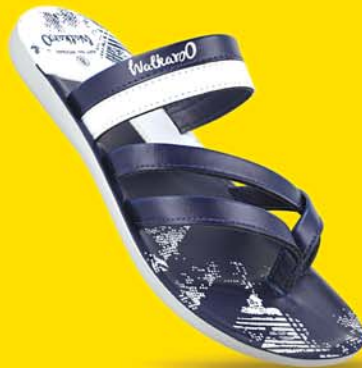
[ Art No : WG5449 ]