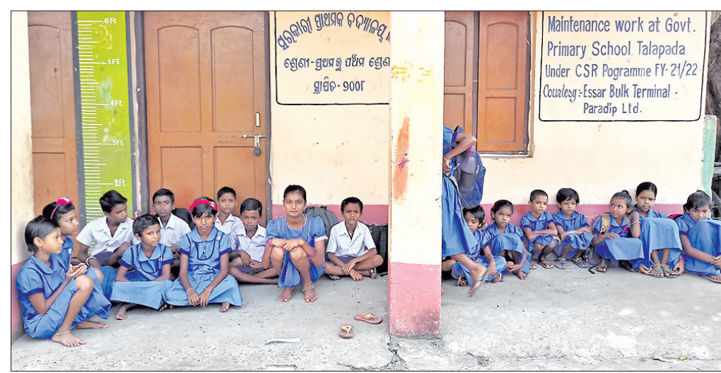
ବିଦ୍ୟାଳୟରେ ତାଲା ପଡ଼ିଥିବାରୁ ବାରଣ୍ଡାରେ ଛାତ୍ରଛାତ୍ରୀମାନେ ବସିଛନ୍ତି।

ନିର୍ଦ୍ଧାରିତ ସମୟରେ ଖୋଲୁନି ସ୍କୁଲ ଶିକ୍ଷା ବିଭାଗ ପକ୍ଷରୁ ଗୃହ ନିର୍ମାଣ କରାଯାଇଛି