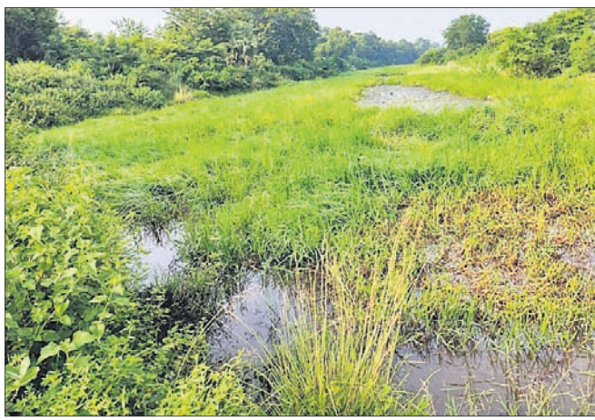
ବ୍ୟାରେଜ ଓ ପୋତା କେନାଲ ।