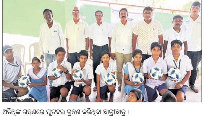
ଅତିଥିକ ଗହଣରେ ପୁଟବଲ ଗ୍ରହଣ କରିଥିବା ଛାତ୍ରଛାତ୍ରୀ ।

୨୦୨୨ ସମୟରେ ବ୍ରାହ୍ମଣବାଡ଼ ଗ୍ରାମରେ ଗୋଷ୍ଠୀ ବିବାଦ ଉତ୍ପତ୍ତି ହୋଇଥିଲା । ଏହାକୁ କେନ୍ଦ୍ରକରି ଚଳିତମାସ ୨୫ରୁ ଆରମ୍ଭ ହେବାକୁ ଥିବା ପକ୍ଷରୁ ୧୪୪ ଧାରା ଲାଗୁ କରିବା ପାଇଁ ଉପଜିଲ୍ଲାପାଳଙ୍କ କୋର୍ଟରେ ଆବେଦନ କରାଯାଇଥିଲା । ଏନେଇ କୋର୍ଟ ପକ୍ଷରୁ ଥାନାରେ ଅଭିଯୋଗ ହୋଇଥିଲା । ଅଭିଯୋଗ ଆଧାରରେ ପୋଲିସ୍ ପକ୍ଷରୁ କୁଆଖିଆ ଥାନାକୁ ଅଟକାଇ କରାଯାଇଛି ।