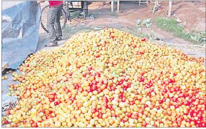
ଶୀତଳ ଭଣ୍ଡାର ନ ଥିବାରୁ ସହରର ଗୋପ ହାଟରେ ରହିତ ଚମାଟୋ । (ଫାଇଲ ଫଟୋ)

ବଜାର ଦର ବୃଦ୍ଧି ଯୋଗୁ ଚିନ୍ତାରେ ଖାଉଟି ପଡ଼ିଛନ୍ତି । କାର୍ତ୍ତିକ ମାସ ଯୋଗୁ ନିରାମିଷ ଖାଇବାକୁ ଲୋକେ ପସନ୍ଦ କରୁଥିବା ବେଳେ ପରିବା ଦର ଆକଶ ଛୁଆଁ ହୋଇଛି । ଏହାର ପ୍ରଭାବ ହାଣ୍ଡିଶାଳ ଉପରେ ପଡ଼ିଛି । ମାସକ ମଧ୍ୟରେ ପରିବା ଦର ୨୫ ପ୍ରତିଶତରୁ ଅଧିକ ବଢ଼ିଛି । ପେଟୋଲ, ଡିଜେଲ, ଗ୍ୟାସ, ଖାଇବା ତେଲ, ଡାଲି, ପିଆଜ ଦର ନିୟନ୍ତ୍ରଣ ହରାଇଛି । କ୍ରମବଦ୍ଧିତ ଭାବେ ନିୟନ୍ତ୍ରଣ ପାଇଁ ଶାସକ, ପ୍ରଶାସକ ଓ ବିରୋଧୀଙ୍କ ମଧ୍ୟରେ କୌଣସି ଯୋଜନା ନାହିଁ । କରୋନା କାରଣରୁ ସବୁବର୍ଗ ଲୋକଙ୍କ ଜୀବନ ଜୀବିକା ପ୍ରଭାବିତ ହୋଇଥିବାବେଳେ ମହଙ୍ଗା ମାତ୍ର ଆର୍ଥିକ ମେରୁଦଣ୍ଡକୁ ଦୁର୍ବଳ କରୁଛି । କେନ୍ଦ୍ରାପଡ଼ା ଜିଲ୍ଲା ପ୍ରଶାସନ ପକ୍ଷରୁ ବଜାର ଦର ନିୟନ୍ତ୍ରଣ ପାଇଁ ପଦକ୍ଷେପ ନେବାକୁ ଦାବି ହୋଇଛି । ସେହିପରି ବ୍ୟବସାୟୀମାନେ ପରିବହନ ଖର୍ଚ୍ଚ ଅଧିକ ହେଉଥିବା ମତ ରଖିଛନ୍ତି । ଏ ସମ୍ପର୍କରେ ଶ୍ୟାମସୁନ୍ଦରପୁରର