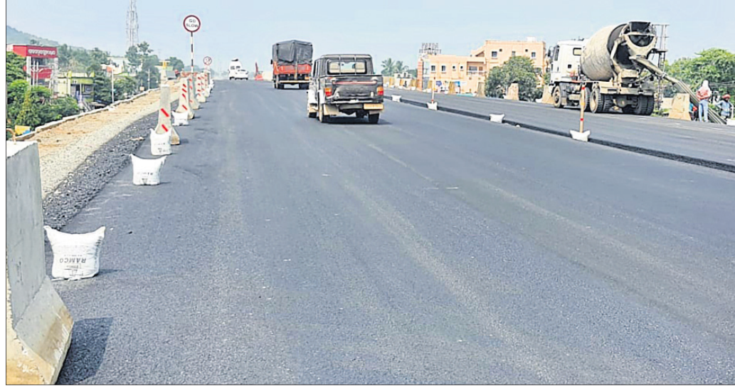
୧୬ନଂ. ଜାତୀୟ ରାଜପଥର ଜାରକା ଛକରେ ନିର୍ମିତ ଉତ୍ତର ବ୍ରିଜ୍‌ରେ ମଙ୍ଗଳବାରଠାରୁ ଗାଡ଼ି ଚଳାଚଳ ଆରମ୍ଭ ହୋଇଛି ।