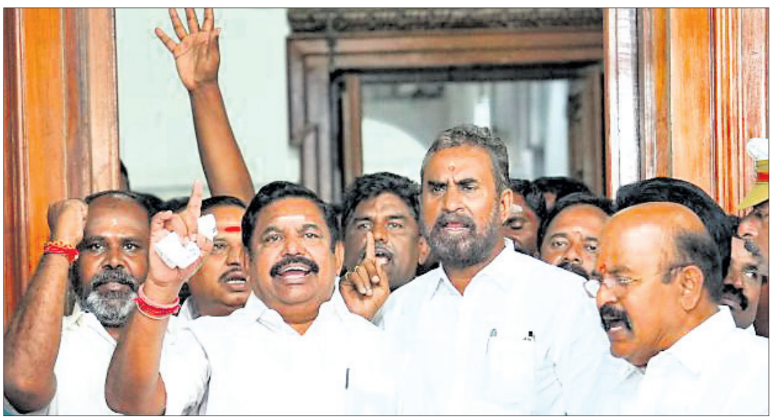
ତାମିଲନାଡୁ ବିଧାନସଭାରେ ମଙ୍ଗଳବାର ବିଶ୍ୱଜିତ ଆଚରଣ ପାଇଁ ବିରୋଧୀ ଦଳ ନେତା କେ. ପଲାନିସାମୀ ଓ ତାଙ୍କ ଏଥାଇସ୍‌ଏମ୍‌ସିଏସ୍‌ସି ବିଧାୟକମାନଙ୍କୁ ଗୃହସ୍ଥ ବାହାର କରିଦିଆଯାଇଛି। ବିରୋଧୀ ଦଳ ସଦସ୍ୟମାନେ ହତଗୋଳ କରି ଗୃହ ତଳାଢ଼ି ନ ଦେବାକୁ ବାଚସ୍ପତି ଏମ୍. ଅପାଭୁଙ୍କ ନିର୍ଦ୍ଦେଶକ୍ରମେ ମାଣିଲମାନେ ସେମାନଙ୍କୁ ଗୃହସ୍ଥ ବାହାର କରିଦେଇଥିଲେ।