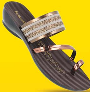
[ Art No : WL7435 ]