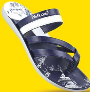
[ Art No : WG5449 ]