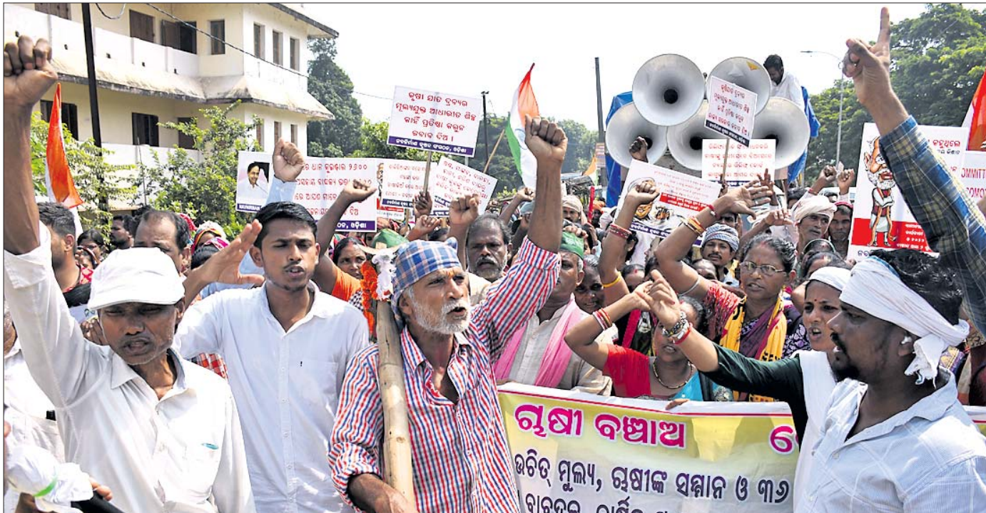
ବିଭିନ୍ନ ଦାଦି ନେଇ ନବନିର୍ମାଣ କୃଷକ ସଙ୍ଗଠନ ପକ୍ଷରୁ ଭୁବନେଶ୍ୱର ହଂସପାଳ ନିକଟରେ ମଙ୍ଗଳବାର ଆୟୋଜିତ ପଦଯାତ୍ରା।

ମାର୍ଗାଦାନ, ୧୮୧୦(ଡି.ଏନ.ଏ.) କେନ୍ଦ୍ରାପଡ଼ା ଜିଲ୍ଲା ମାର୍ଗାଦାନ ଆନ ଅନ୍ତର୍ଗତ କଣକସତି ଗାଁରେ ମା' ଗଜଲକ୍ଷ୍ମୀଙ୍କ ଭସାଣି ଶୋଭାଯାତ୍ରା ବେଳେ ଏକ ଗୁଡ଼ିକ ଘଟଣା ଘଟିଛି। ଶୋଭାଯାତ୍ରୀଙ୍କ ମଧ୍ୟରେ ଥିବା ଗାଡ଼ି ଲୁହା ଆଙ୍ଗେଲରେ ୩୩ କେଡ଼ି ବିଦ୍ୟୁତ୍ ତାର ଲାଗିବାକୁ ଜଣେ ଯୁବକଙ୍କ ମୃତ୍ୟୁ ଘଟିଥିବା ବେଳେ ୪ ଜଣ ଗୁରୁତର ହୋଇଛନ୍ତି।