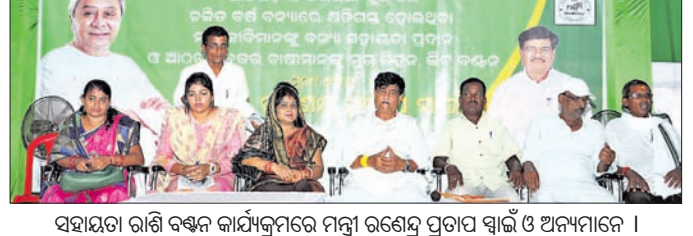
ସହାୟତା ରାଶି ବଣ୍ଟନ କାର୍ଯ୍ୟକ୍ରମରେ ମନ୍ତ୍ରୀ ରଣେନ୍ଦ୍ର ପ୍ରତାପ ସାହି ଓ ଅନ୍ୟମାନେ।

ଆଠଗଡ଼, ଡିସେମ୍ବର ୨୩ କୃଷି ସୁଚନା, ପରାମର୍ଶ କେନ୍ଦ୍ର ଓ ଜିଲ୍ଲା ମହ୍ୟ ବିଭାଗ ପକ୍ଷରୁ ଗତ ବନ୍ୟା କ୍ଷତିଗ୍ରସ୍ତ ମହାତାପୀଙ୍କୁ ବିଚ୍ଛିନ୍ନ ଓ ମହାତାପୀଙ୍କୁ ସହାୟତା ରାଶି ବଣ୍ଟନ କରାଯାଇଛି।