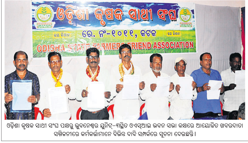
ଓଡ଼ିଶା କୃଷକ ସାଥୀ ସଂଘ ପକ୍ଷରୁ ଭୁବନେଶ୍ୱର ସୂନି-୨ ଗ୍ରାମପଞ୍ଚାୟତ ଓ ଏସ୍.ଆଇ.ଭି. ଭବନ ସଭା କକ୍ଷରେ ଆୟୋଜିତ ଖବରବାତୀ ସମ୍ମିଳନୀରେ କର୍ମକର୍ତ୍ତାମାନେ ବିଭିନ୍ନ ଦାବି ସମ୍ପର୍କରେ ସୂଚନା ଦେଇଛନ୍ତି।

ପରିବାରଲୋକଙ୍କ ଅଭିଯୋଗକ୍ରମେ ମଙ୍ଗଳବାର ପୋଲିସ ଏକ ନିଖୋଜ ମାମଲା ରୁଜୁକରି ତଦନ୍ତ ଚଳାଇଛି। ଅଭିଯୋଗ ପ୍ରତ୍ୟାଖ୍ୟାନ, କ୍ରୀଡ଼ିତ ଖାଉଦେବ ନଗର ଅଞ୍ଚଳରେ ଥିବା ମାମୁ ଘରେ ପଳାଇଛନ୍ତି। ସେ ହେଲେ ଖାଉଦେବ ନଗର ଥାନା ଅଞ୍ଚଳରେ ରହୁଥିବା କ୍ରୀଡ଼ିତ ବିଂ। ଏନେଇ ନିୟମିତ