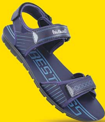
[ Art No : WG5759 ]