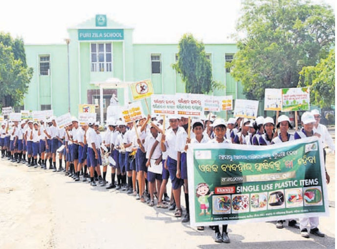
ଏକକ ବ୍ୟବହାର ପ୍ଲାଷ୍ଟିକ୍ ବର୍ଜନ କରିବା ପାଇଁ ପୁରୀ ଜିଲ୍ଲା ସ୍କୁଲର ଛାତ୍ରଛାତ୍ରୀମାନେ ମଜକଦାର ସଚେତନତା ଶୋଭାଯାତ୍ରାରେ ସହର ପରିକ୍ରମା କରୁଛନ୍ତି ।

କର୍ମଚାରୀମାନଙ୍କୁ ୧୯ କୋଟି ୮୩ ଲକ୍ଷ ୮୬ ହଜାର ଟଙ୍କା ପ୍ରଦାନ କରାଯିବ ବୋଲି ଆକଳନ କରାଯାଇଥିଲା । ଅଧିକାରୀଙ୍କୁ ନିର୍ଦ୍ଦେଶ ଦେଇଥିଲା । ଉକ୍ତ ହିସାବ ଅନୁଯାୟୀ ଓଡ଼ିଶାରେ ୧୪୭ କୋଟି ୬୨ ଲକ୍ଷ ୬୩ ହଜାର ୯୬ ଟଙ୍କା ଶୁଦ୍ଧିପାତ୍ର ପଡ଼ିବ । ଏଥିରେ ଯେଉଁ କର୍ମଚାରୀମାନଙ୍କ