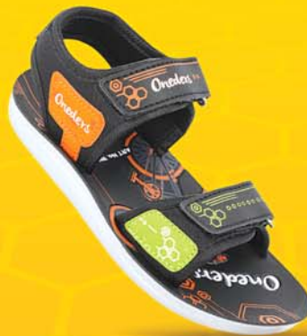
[ Art No : WK636 ]