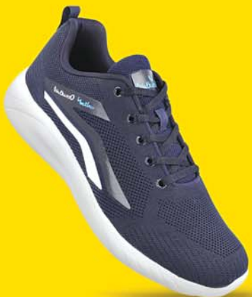
[ Art No : XS9764 ]