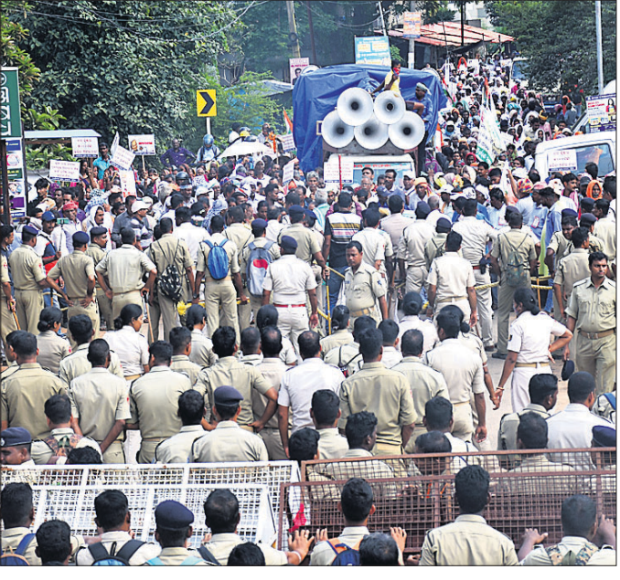
ଚାଷୀଙ୍କୁ ଯେତେବେଳେ ପ୍ରଦାନ ଏବଂ ଅନ୍ୟାନ୍ୟ ଦାବିରେ ନବ ନିର୍ମାଣ କୃଷକ ସଂଗଠନ ପକ୍ଷରୁ ବାଲିଅଟାଠାରେ ଆନ୍ଦୋଳନ ଚାଲିଛି। ଆନ୍ଦୋଳନକାରୀଙ୍କୁ ପୋଲିସ ଅଟକାଇଛି।