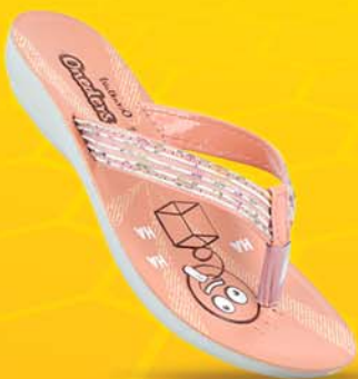
[ Art No : WK635 ]