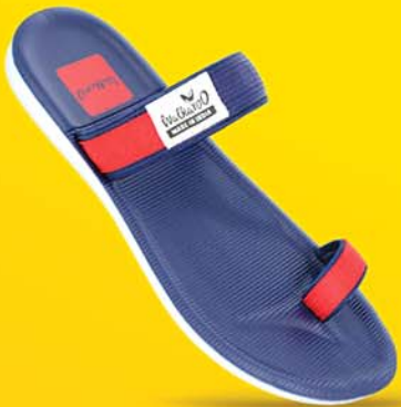
[ Art No : WG5328 ]