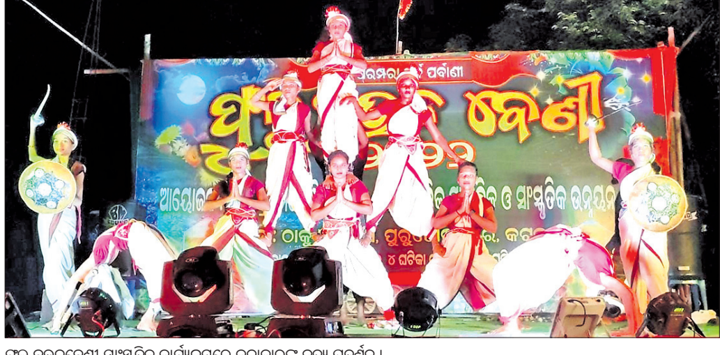
ଫୁଲ ବଉଳବେଣୀ ସାଂସ୍କୃତିକ କାର୍ଯ୍ୟକ୍ରମରେ କଳାକାରଙ୍କ ନୃତ୍ୟ ପ୍ରଦର୍ଶନ।

ଅଭିଯୁକ୍ତ ବ୍ରହ୍ମକୁ ବିଚାର ବିଭାଗୀୟ ହାଜତକୁ ପଠାଇ ଦିଆଯାଇଛି। ଏଥିସହ ପୋଲିସ୍ ଘଟଣାର ଅଧିକ ତଦନ୍ତ ଚଳାଇଛି। ସୁଚନାନୁଯାୟୀ, ନିଶା କାରବାର ବିରୋଧରେ କ୍ରାନ୍ତଚିନ୍ତା ଷ୍ଟେସନରୁ ବାଲେଶ୍ୱର ନିକଟରୁ ୧୯୧୧ କୁଇଣ୍ଟାଲରୁ ଅଧିକ ଗଞ୍ଜେଇ ୭୪୦ ଗ୍ରାମ ଅଧିକ ଜବତ କରାଯାଇଥିବା ଏବଂ ୨ ଜଣଙ୍କୁ ଗିରଫ କରାଯାଇଛି।