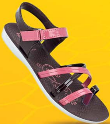
[ Art No : WL7812 ]