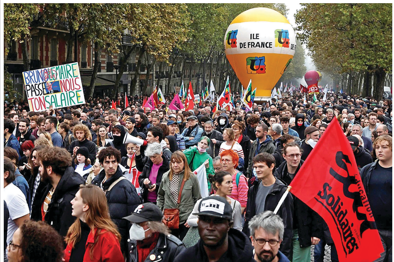
ପ୍ରାୟ ୨୦୦୦ ଲୋକ ଓ ଅନ୍ୟ ଅତ୍ୟାଧିକ ସାମଗ୍ରୀକର ଦରଦର ବଢ଼ିବାରେ ଲାଗିଛି। ପ୍ରତ୍ୟାକ୍ଷିତ ବୃଦ୍ଧି ହେଉଛି ଲୋକମାନଙ୍କର ଦରଦର ବଢ଼ିବାରେ ଲାଗିଛି।

ଜାତିସଂଘ ମହାସଭାରେ ଆନ୍ତର୍ଜାତୀୟ ଗୁରୁତ୍ୱରେ ଅନୁମୋଦିତ ହେଉଛି। ଏହି ପ୍ରକାରର ସମ୍ମାନ ଓ ସମ୍ମାନ ଦେବା ପ୍ରତି ଭାରତର ପ୍ରତିବଦ୍ଧତା ଦେଖାଇବାକୁ ହେଉଛି। ଏହି ସମ୍ମାନ ଓ ସମ୍ମାନ ଦେବା ପ୍ରତି ଭାରତର ପ୍ରତିବଦ୍ଧତା ଦେଖାଇବାକୁ ହେଉଛି।