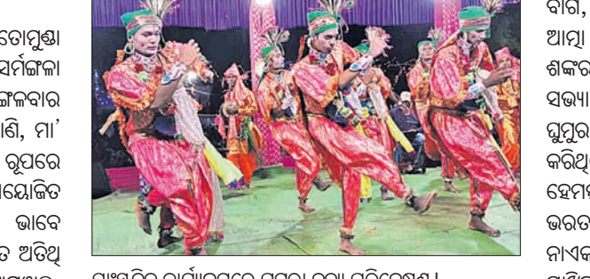
ସାଂସ୍କୃତିକ କାର୍ଯ୍ୟକ୍ରମରେ ପୁରୁଣା ନୃତ୍ୟ ପରିବେଷଣ।