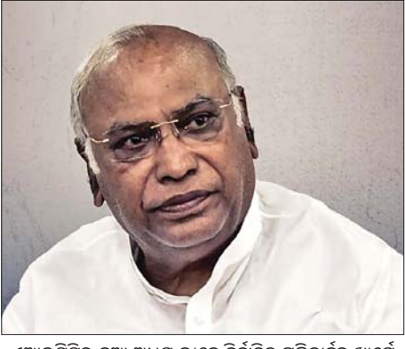
ଏଆଇସିସିର ନୂଆ ଅଧକ୍ଷ ଭାବେ ନିର୍ବାଚିତ ମଲିକାର୍ଜୁନ ଖାର୍ଚ୍ଚେ ନୂଆଦିଲ୍ଲୀ, ୧୯/୧୦

■ ଖାର୍ଚ୍ଚେଙ୍କ ସପକ୍ଷରେ ୭,୮୯୭ ଭୋଟ ■ ଶଶୀ ଅରୁର ପାଇଲେ ୧,୦୭୨ ଭାବେ ଖାର୍ଚ୍ଚେ ଆସନ୍ତା ୨୩ରେ ଦାୟିତ୍ୱ ଗ୍ରହଣ କରିବେ। ୨ ଦଶନ୍ଧିରୁ ଉର୍ଦ୍ଧ୍ୱ ସମୟ ପରେ ଜଣେ ଅଣଗଣ୍ୟ ପରିବାରର ବ୍ୟକ୍ତି ଦେଶର ସର୍ବପୁରାତନ ଦଳର ମଙ୍ଗ ଧରିବାକୁ ଯାଉଛନ୍ତି। ଏହାକୁ ନେଇ ଉଲ୍ଲସିତ ତାଙ୍କ ସମର୍ଥକମାନେ ଏଆଇସିସି ପୁଖ୍ୟାଳୟରେ ବାଣୀ ପୁଟାଇ ଉତ୍ସବ ମନାଇଛନ୍ତି। ଅନ୍ୟପକ୍ଷେ ବିଦାୟୀ ଅନ୍ତରାଣ ଅଧକ୍ଷ ସାହିଆ ଗାନ୍ଧୀ ଓ ପରାଜିତ ପ୍ରାର୍ଥୀ ଅରୁର ଖାର୍ଚ୍ଚେଙ୍କୁ ଚାଳି ବାଦଭବନରେ ଭେଟି ଅଭିନନ୍ଦନ ଜଣାଇଛନ୍ତି। ଅରୁର ନିଜ ପରାଜୟ ସ୍ୱୀକାର କରିବା ସହ ଖାର୍ଚ୍ଚେଙ୍କୁ ସବୁ ପ୍ରକାର ସହଯୋଗ ଦେବେ ବୋଲି ଘୋଷଣା କରିଛନ୍ତି। ପ୍ରଧାନମନ୍ତ୍ରୀ ନରେନ୍ଦ୍ର ମୋଦି ମଧ୍ୟ ବିରୋଧୀ ଦଳର ନୂଆ ଅଧକ୍ଷକୁ ଶୁଭେଚ୍ଛା ଜଣାଇଛନ୍ତି। ଖାର୍ଚ୍ଚେଙ୍କ କାର୍ଯ୍ୟକାଳ ସମ୍ପର୍କରେ ବୋଲି ପ୍ରଧାନମନ୍ତ୍ରୀ ଭୁଲ୍ଲ କରିଛନ୍ତି। ୨୦୧୯ ଲୋକ ସଭା ନିର୍ବାଚନରେ କଂଗ୍ରେସର ପରାଜୟ ପରେ ଅଧକ୍ଷ ପଦରୁ ରାଜୁଲ।