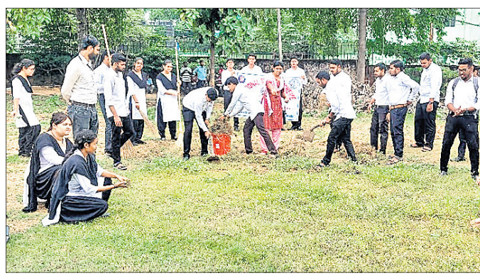
ଆୟୁର୍ବେଦ କଲେଜ ପରିସରରେ ଜାତୀୟ ସେବା ଶିବିର ଜରିଆରେ ସଫେଇ କରାଯାଇଛି ।

ବଲାଙ୍ଗୀର ଅଫିସ୍, ୧୯୧୦: ବଲାଙ୍ଗୀର ସରକାରୀ ଆୟୁର୍ବେଦିକ ମହାବିଦ୍ୟାଳୟ ଏବଂ ଚିକିତ୍ସାଳୟ ପରିସରରେ ଜାତୀୟ ସେବା ଶିବିର (ଏନ୍ଏସ୍ଏସ୍) ଜରିଆରେ ସଫେଇ ଅଭିଯାନ କରାଯାଇଥିଲା ।