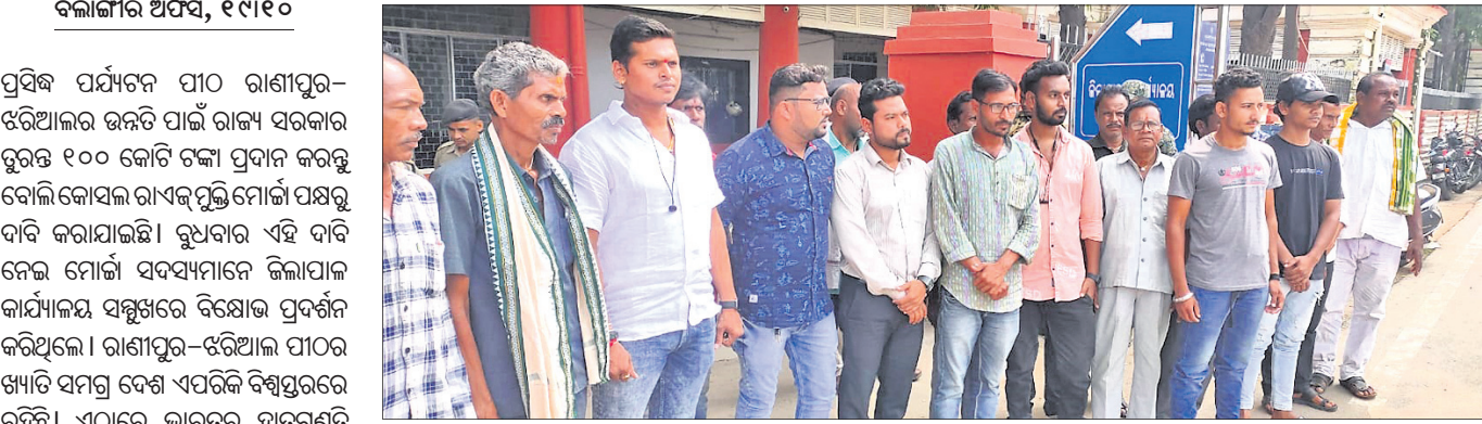
ଜିଲ୍ଲାପାଳ କାର୍ଯ୍ୟାଳୟ ସମ୍ମୁଖରେ କୋସଲ ବାଏକ୍ସ୍ ମୁକ୍ତି ମୋର୍ଚ୍ଚା ପକ୍ଷରୁ ବିରୋଧ ପ୍ରଦର୍ଶନ କରାଯାଇଛି ।

ବଲାଙ୍ଗୀର ଅଫିସ୍, ୧୯୧୦: ପ୍ରସିଦ୍ଧ ପର୍ଯ୍ୟଟନ ପୀଠ ରାଣୀପୁର-ଝରିଆଲ ଉନ୍ନତି ପାଇଁ ରାଜ୍ୟ ସରକାର ତୁରନ୍ତ ୧୦୦ କୋଟି ଟଙ୍କା ପ୍ରଦାନ କରନ୍ତୁ ବୋଲି କୋସଲ ବାଏକ୍ସ୍‌ପୁଲି ମୋର୍ଚ୍ଚା ପକ୍ଷରୁ ଦାବି କରାଯାଇଛି ।