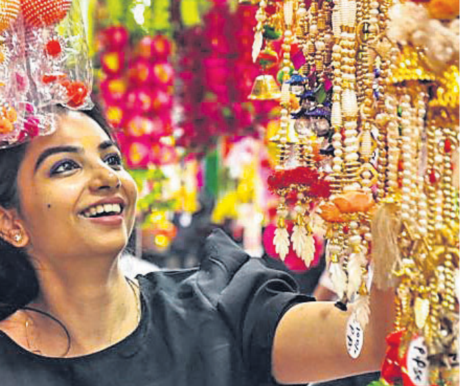
ଦୀପାବଳୀ ପାଇଁ ଉତ୍ତରପ୍ରଦେଶର ମୋରଦାବାଦରେ ଜଣେ ମହିଳା କିଣାକିଣି କରୁଛନ୍ତି।

ଦିଲ୍ଲୀର ଏକ ସରକାରୀ ସ୍କୁଲରେ ୭ମ ଶ୍ରେଣୀ ପଢ଼ାଉଥିବା ପ୍ରଶ୍ନପତ୍ରରେ କର୍ମଚାରୀ ଉପରେ ପରୋପାୟକ ପ୍ରଶ୍ନକୁ ନେଇ ବିବାଦ ଦେଖାଦେଇଛି।