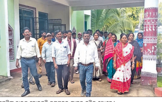
ଏସ୍‌ପିଙ୍କୁ ବାରମ୍ବ ହୋଇଛନ୍ତି ତମପଦର ଗ୍ରାମର ଦଳିତ ଲୋକେ।

ସେଠାରେ ଏକ ବୈଠକ ହୋଇଥିଲା। ରାଜନେତାମାନେ ସମ୍ପାଦନ ସୁରକ୍ଷା ପାଇଁ ପ୍ରତିଜ୍ଞା କରି ଅପବ୍ୟବହାର କରିବା, ଦରଦାମ ବୁଦ୍ଧି, କେକାରି ସମସ୍ୟା, ନିମ୍ନସ୍ତରୀୟ ସୁରକ୍ଷା ହେବା ଫଳରେ ଏହାର ସିଧା ପ୍ରଭାବ ଲୋକଙ୍କ ଜୀବନ ଜୀବିକା ଉପରେ ପଡ଼ୁଛି। ସମ୍ପାଦନ ପ୍ରଶ୍ନୋତ୍ତର ବାସାସାହେବ ଆୟୋଜକଙ୍କ ସ୍ୱପ୍ନକୁ ଅପ ବ୍ୟବହାର ହେବା ପ୍ରତିବାଦରେ ଏବଂ ନିର୍ବାଚିତ ଛାତ୍ର, ସମ୍ପାଦନ ବଞ୍ଚାଅ, ଏକତା, ସମାନତା, ସ୍ୱତନ୍ତ୍ରତା ଓ ନ୍ୟାୟ ପାଇଁ ସଚେତନତା ବାଣୀ ସହ ସରକାର ପ୍ରକୃତିକୁ ବଢ଼େଇ କମ୍ପାନୀ ହାତରେ ତେଜି ଦେଉଥିବା ଅଭିଯୋଗ ନେଇ ଏହି ପଦଯାତ୍ରା କରାଯାଇଥିବା ନିୟମଗିରି ସୁରକ୍ଷା ସମିତି ଆବାହକ କହିଛନ୍ତି। ପଦଯାତ୍ରାରେ ନିୟମଗିରି ସୁରକ୍ଷା ସମିତି ଅନେକ କର୍ମକର୍ମୀଙ୍କ ସମେତ ନିୟମଗିରି ବାସିନ୍ଦା ସାମିଲ ହୋଇଥିଲେ।