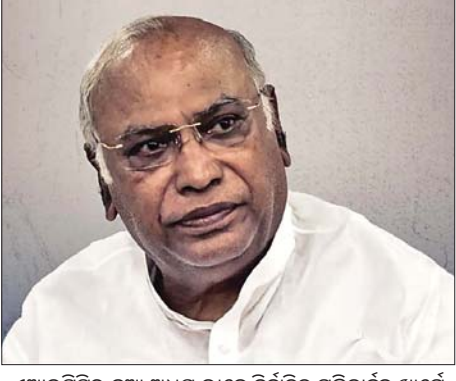
ଏଆଇସିସିର ନୂଆ ଅଧକ୍ଷ ଭାବେ ନିର୍ବାଚିତ ମଲିକାର୍ଜୁନ ଖାର୍ଗେ ନୂଆଦିଲ୍ଲୀ, ୧୯/୧୦

■ ଖାର୍ଗେଙ୍କ ସପକ୍ଷରେ ୭,୮୯୭ ଭୋଟ ■ ଶଶୀ ଅରୁର ପାଇଲେ ୧,୦୭୨