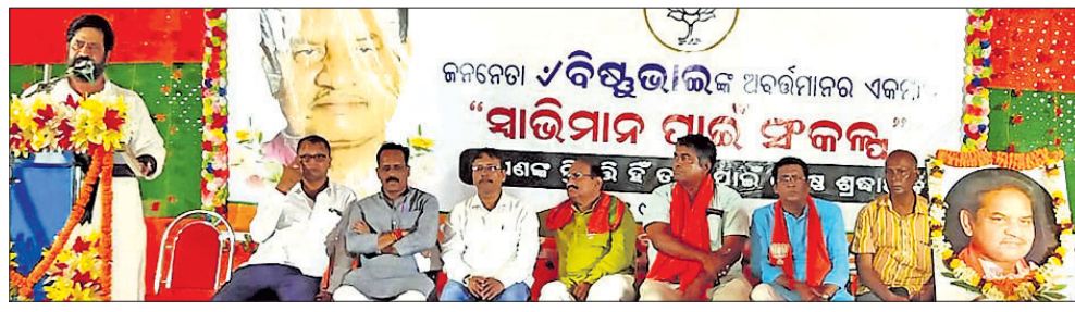
ଧାମନଗର ବିଜୁ ପଟ୍ଟନାୟକ ଛକଠାରେ ଆୟୋଜିତ ସଭା ।