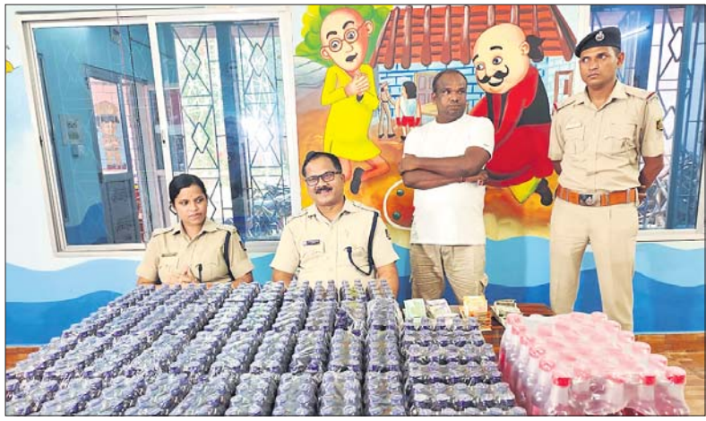
କବଚ କର୍ମ ସିରସ୍ତ ସହ ଅଭିଯୋଗ ପ୍ରଶାନ୍ତ ଜେନା ।

ବାପ, ପୁଅଙ୍କୁ ଧରିଲା ଯୋଲିଏ କର୍ମ ସିରସ୍ତ ସହ ୯୨ ହଜାର ଟଙ୍କା କବଚ ଅଭିନବ ଉପାୟରେ ଚଳାଇଥିଲେ ନିଶା କାରବାର