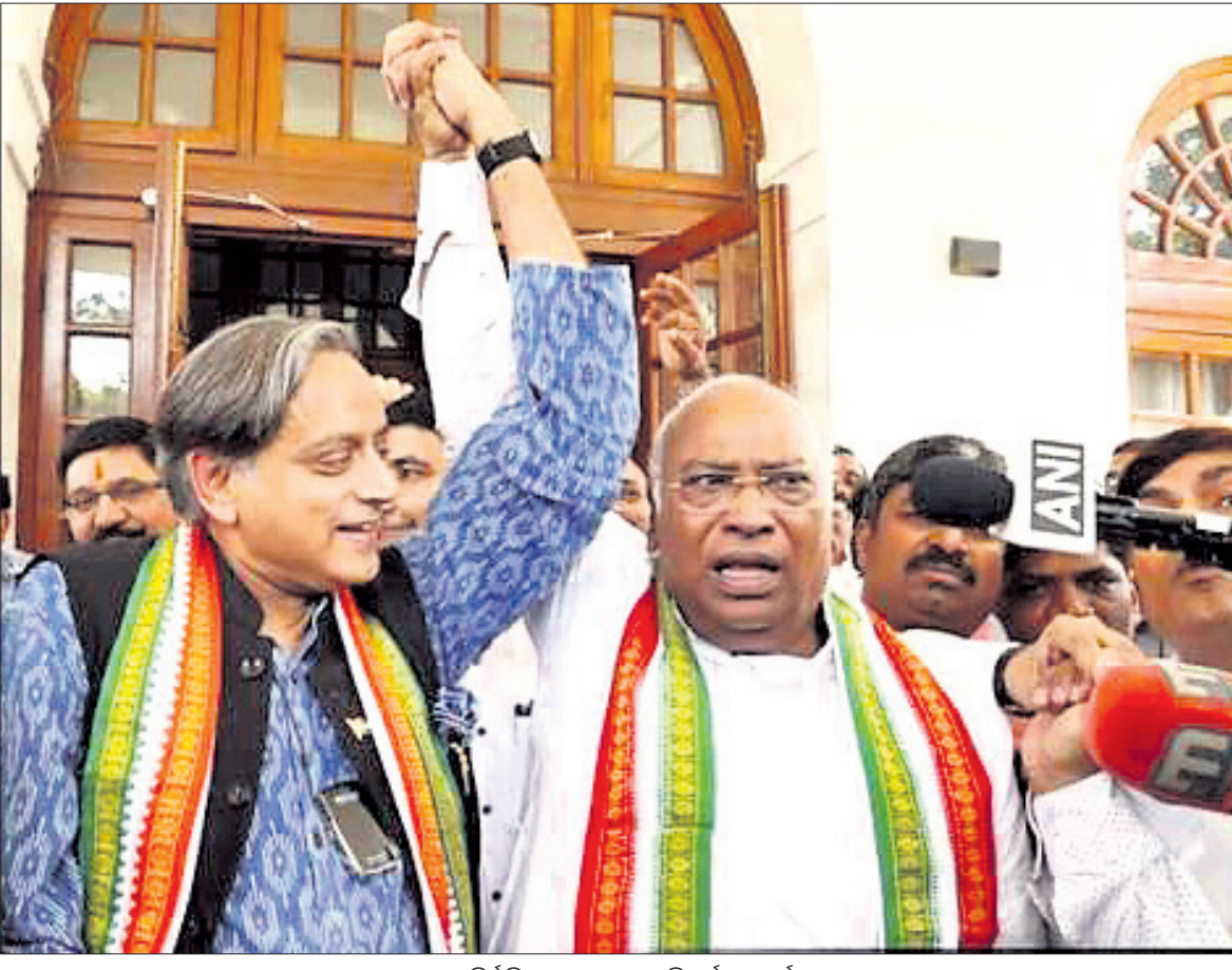
କଂଗ୍ରେସ ଅଧ୍ୟକ୍ଷ ଭାବେ ନିର୍ବାଚିତ ହେବା ପରେ ମଲ୍ଲିକାର୍ଜୁନ ଖାରୋଳ ସହ ଶଶୀ ଅରୁର।

ଦଳର ଅନ୍ୟ ନେତାମାନଙ୍କ ଭଳି ଖାରୋଳ ମଧ୍ୟ ବିଶ୍ୱାସ କରନ୍ତି ଯେ, କଂଗ୍ରେସକୁ ବାଦ ଦେଇ ବିରୋଧୀ ଏକତା ଅସମ୍ଭବ। କିନ୍ତୁ ଏହି ଡାଇନାମିକ୍ ବା ଗତିଶୀଳ ବଦଳିଗଲାଣି। ସମ୍ପ୍ରତି ଏକାଧିକ ଆଞ୍ଚଳିକ ଦଳର ଜାତୀୟ