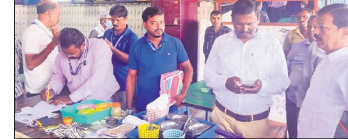
ଚଢ଼ାଉରେ ସାମିଲ ହୋଇଥିବା ଅଧିକାରୀ ।