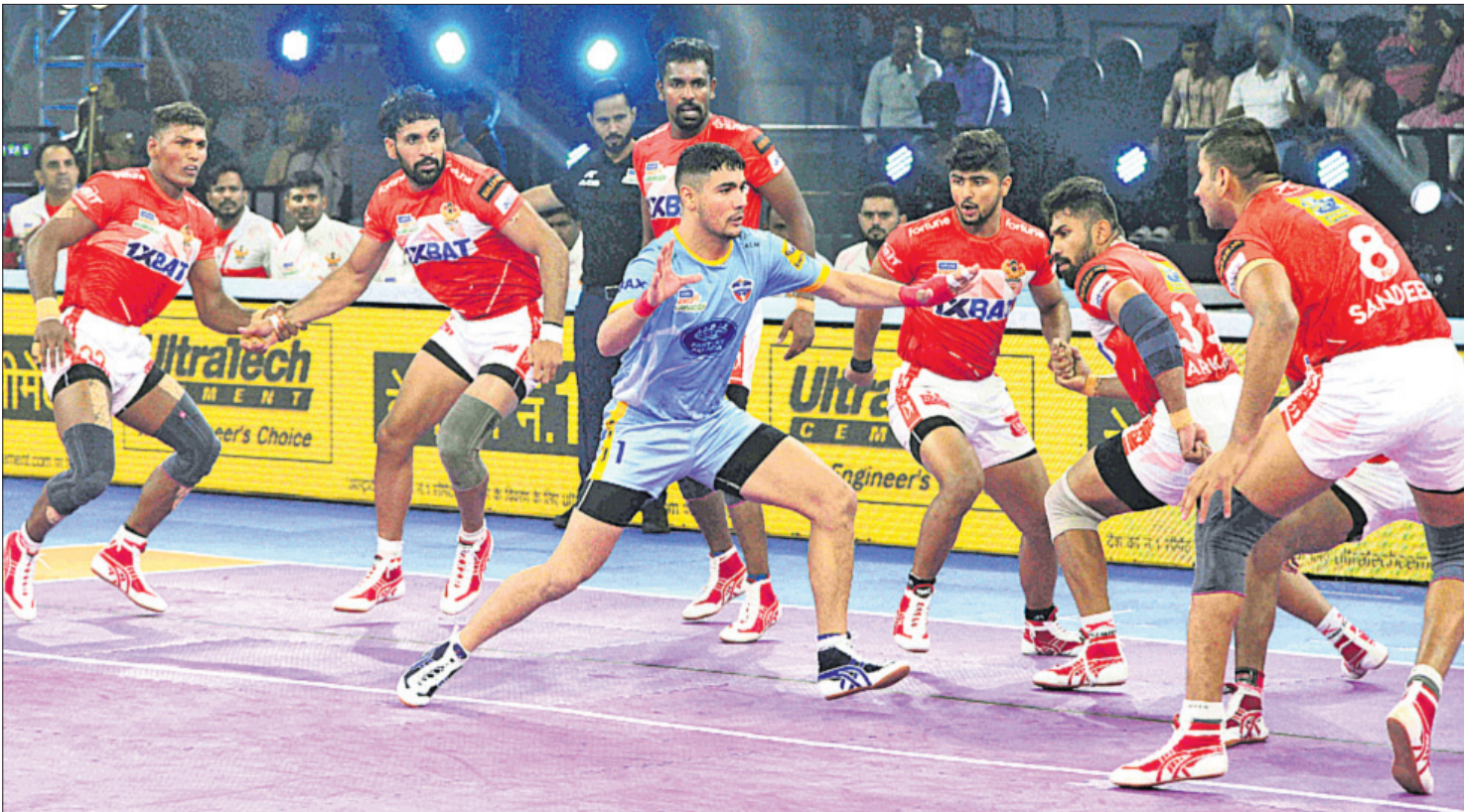
ପ୍ରୋ-କବାଡ଼ି ଲିଗ୍‌ରେ ବୁଧବାର ଯୁଦ୍ଧ ଯୋଦ୍ଧାଙ୍କୁ ଓ ଗୁଜରାଟ ଜାଏଣ୍ଟ୍ସ ମଧ୍ୟରେ ଅନୁଷ୍ଠିତ ମ୍ୟାଚ ।