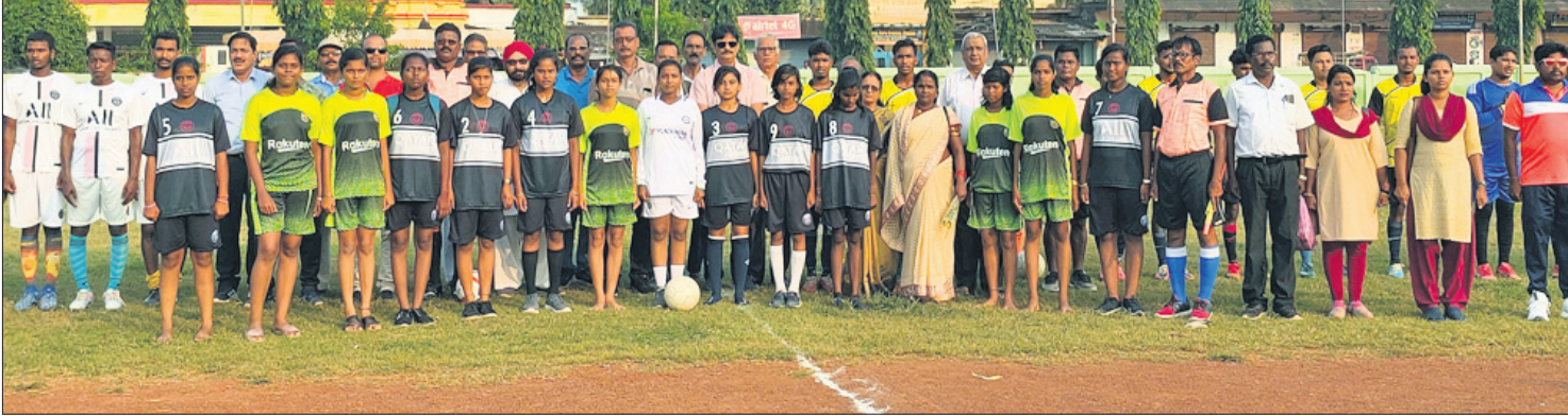
ନିମାପଡ଼ା ପ୍ରିମିୟର ପୁରୁଷ ଲିଗ୍‌ର ଉଦ୍‌ଘାଟନା ଉତ୍ସବରେ ଅତିଥିଙ୍କ ଗହଣରେ ଖେଳାଳିମାନେ ।