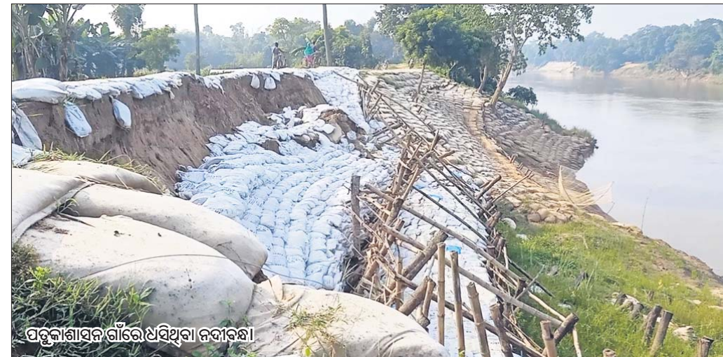
ପଡ଼ୁକାଶାସନ ଗାଁରେ ଥିଥିବା ନଦୀକୂଳ।