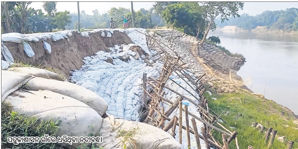
ପଡ଼ୁକାଶାସନ ଗାଁରେ ଥିଥିବା ନଦୀକୂଳ