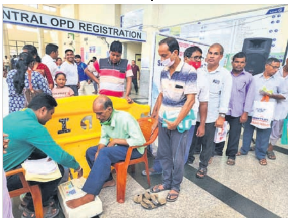
ଡକ୍ଟର ସାହାଯ୍ୟରେ ରୋଗୀଙ୍କ ଓଷ୍ଠିଓପୋରୋସିସ୍ ପରୀକ୍ଷା କରାଯାଇଛି।

ଭୁବନେଶ୍ୱର, ୨୦୧୦ (ଭୁବନେଶ୍ୱର): ବୟସ ଆଧିକ ହେଲେ ମଣିଷ ଶରୀରରେ ଓଷ୍ଠିଓପୋରୋସିସ୍ (ହାଡ଼ଫୋରାଣିଆ ବା ପୋଲି ହାଡ଼) ଏକ ସାଧାରଣ ସମସ୍ୟା।