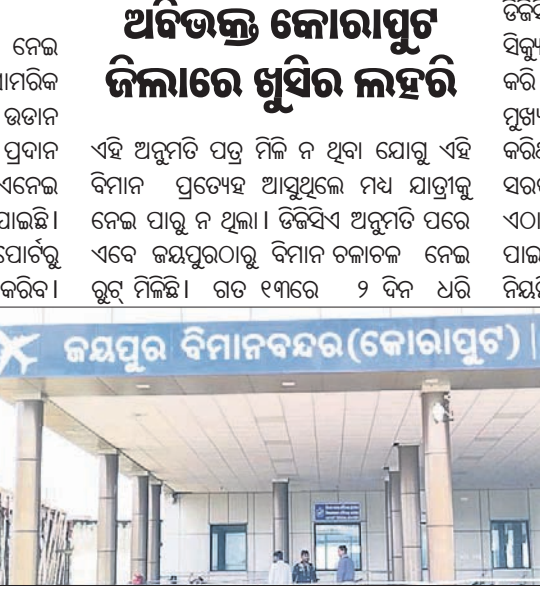
ଅଧିଭକ୍ତ କୋରାପୁଟ ଜିଲ୍ଲାରେ ଖୁସିର ଲହରୀ

ଜୟପୁରରୁ ସବୁଦିନିଆ ବିମାନ ଉଡ଼ିବା ନେଇ ଅନୁମତି ମିଳିଛି। ଗୁରୁବାର କେନ୍ଦ୍ର ବେସାମରିକ ବିମାନ ଚଳାଚଳ ମନ୍ତ୍ରଣାଳୟ ପକ୍ଷରୁ ଉଡ଼ାନ ଯୋଜନାରେ ତିନିସିଏ ଏହି ଅନୁମତି ପ୍ରଦାନ କରାଯାଇଛି। ଅନୁମତି ପତ୍ର ବିଭାଗ ପକ୍ଷରୁ ଏନେଇ ଓଡ଼ିଶା ସରକାରଙ୍କୁ ଅବଗତ କରାଯାଇଛି। ଅନୁମତି ଅନୁସାରେ ଜୟପୁର ଏୟାରପୋର୍ଟରୁ ପ୍ରତ୍ୟହ ଯାତ୍ରାକୁ ନେଇ ଚଳପ୍ରଚଳ କରିବ। ଗତ ଅଗଷ୍ଟ ମାସେ ରାଜ୍ୟ ସରକାରଙ୍କ ପରିବହନ ବିଭାଗ ଲକ୍ଷ୍ମଣା ଓ୍ୱାନ ଏୟାର ନାମକ ଏକ ସଂଗ୍ରାହୀ ଜୟପୁର-ଭୁବନେଶ୍ୱର ଓ ଜୟପୁର-ବିଶାଖାପାଟଣା ମଧ୍ୟରେ ୯ ସିଡି ବିଶିଷ୍ଟ ବିମାନ ଚଳାଇବାକୁ ନନ ସିଦ୍ଧି ଲକ୍ଷ୍ମଣା କରୁଥିଲେ। ମାତ୍ର କେନ୍ଦ୍ର ସରକାରଙ୍କ ତିନିସିଏ ପକ୍ଷରୁ