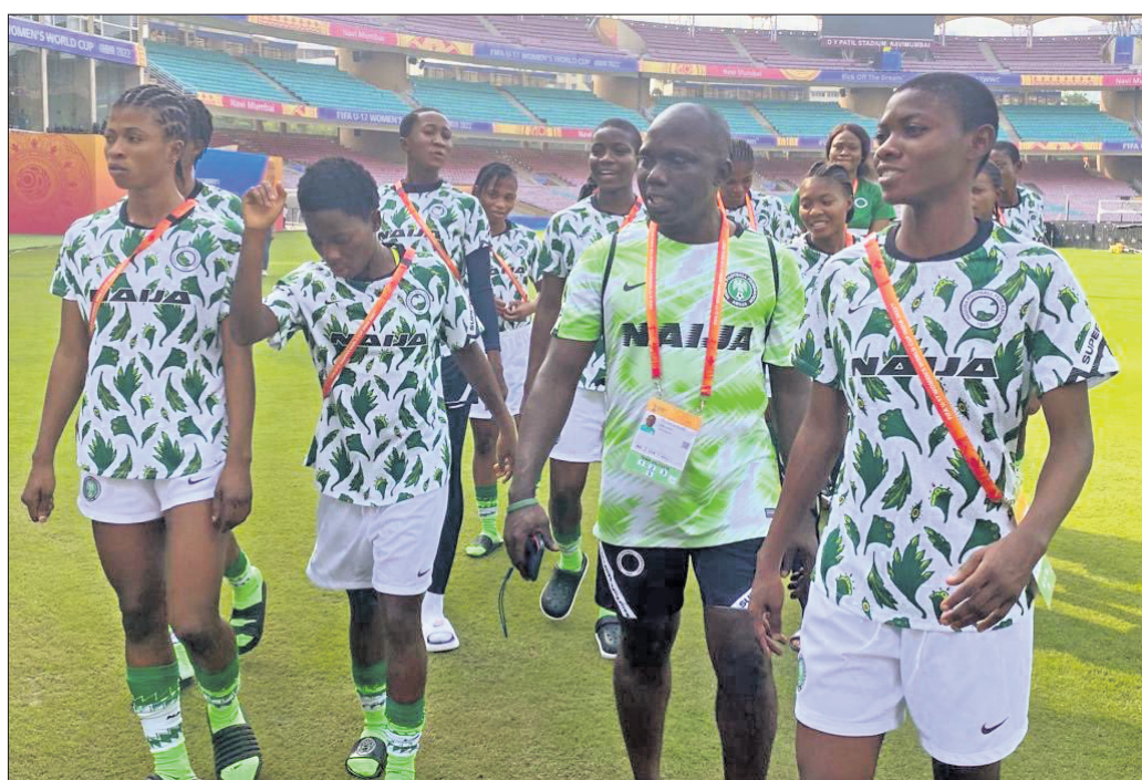
ଆମେରିକା ବିପକ୍ଷ କ୍ୱାର୍ଟର ଫାଇନାଲ ପୂର୍ବରୁ କୋର୍ ଓଲୋଓକେରେ ବାଙ୍କୋଲୋକ୍ ସହ ନାଇଜେରିଆ ଖେଳାଳି।

ଭୁବନେଶ୍ୱର, ୨୦୧୦ (କ୍ରୀଡ଼ା ପ୍ରତିନିଧି) ଚଳିତ ୧୭ ବର୍ଷରୁ କମ୍ ମହିଳା ଫିଫା ବିଶ୍ୱକପ୍ରେ ୨ଟି କ୍ୱାର୍ଟର ଫାଇନାଲ ଖୁବ୍‌ବୀର ନିଜ ମୁଖ୍ୟ ଭାବେ ତିଆରି ପାରିବ। କ୍ୱାର୍ଟରରେ ଆମେରିକାକୁ ଭେଟିବ କୋରୀଆ। ସେହିପରି ବ୍ରୀତ୍ୟା, ନାଇଜେରିଆ। ସେହିପରି ବ୍ରୀତ୍ୟା, ନାଇଜେରିଆ। ସେହିପରି ବ୍ରୀତ୍ୟା, ନାଇଜେରିଆ।