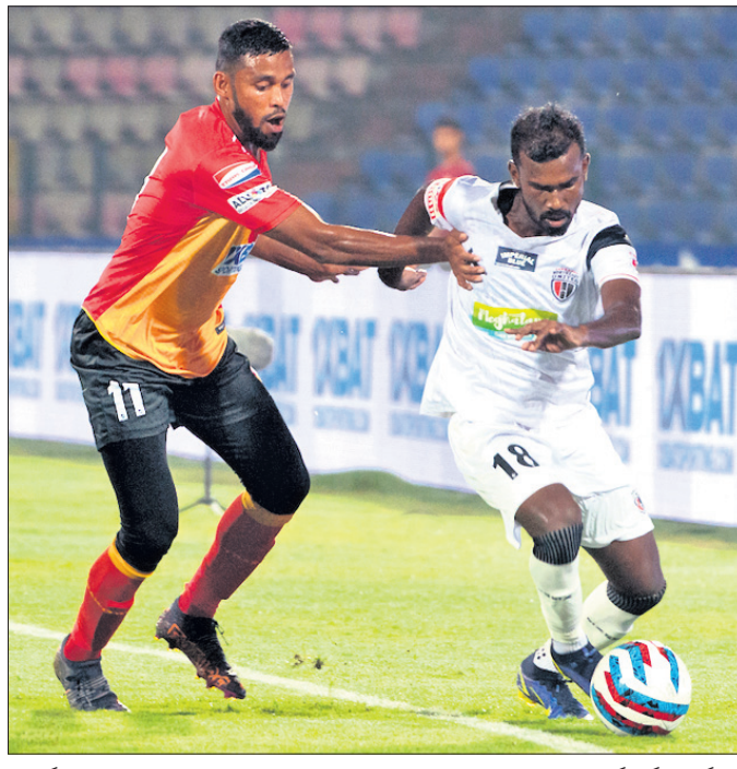
ନର୍ଥଇଷ୍ଟ ବନାମ ଇଷ୍ଟ ବେଙ୍ଗାଲ ଇଣ୍ଡୋନେସିଆର ପ୍ରଥମ ଲିଗ୍ ମ୍ୟାଚର ଏକ ସଂଘର୍ଷପୂର୍ଣ୍ଣ ମୁହୂର୍ତ୍ତ।