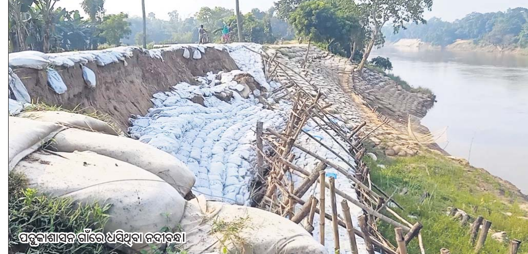
ପଡ଼ୁକାଶାସନ ଗାଁରେ ଅଧିକାରୀଙ୍କ ଦ୍ୱାରା ନିର୍ମାଣ କରାଯାଇଥିବା ବନ୍ଧ।