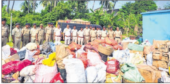
କବଚ କରାଯାଇଥିବା ବାଣି

୪୫ ଲକ୍ଷ ଟଙ୍କାର ବାଣି, ପିକ୍‌ଅପ୍ ଭ୍ୟାନ୍ କବଚ: କଣେ ରିଭର୍ସ