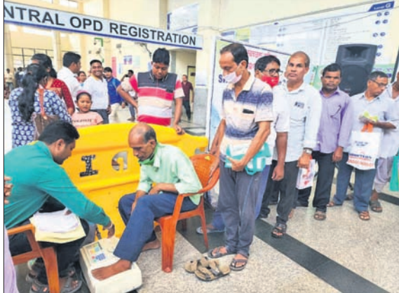
ଡ଼େକ୍ଟା ଷ୍ଟାନ୍ ଦ୍ୱାରା ରୋଗୀଙ୍କ ଓଷ୍ଠିଓପୋରୋସିସ୍ ପରୀକ୍ଷା କରାଯାଇଛି।

ଭୁବନେଶ୍ୱର, ୨୦୧୦ (ଭୁବନେଶ୍ୱର): ବୟସ ଆଧିକ ହେଲେ ମଣିଷ ଶରୀରରେ ଓଷ୍ଠିଓପୋରୋସିସ୍ (ହାଡ଼ଫୋରିଆ ବା ପୋଲି ହାଡ଼) ଏକ ସାଧାରଣ ସମସ୍ୟା।