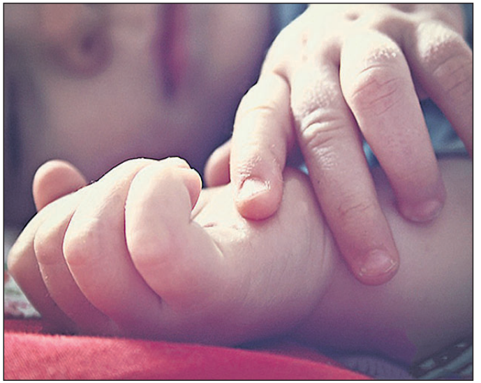
ଦେବା ପାଇଁ ଉଦ୍ଦିଷ୍ଟ ଆଇନ ପୋଲିସ୍ ଦ୍ଵାରା ବଳାକ୍ରୁର କରାଯାଇଥିବା ଏକ ୪ ବର୍ଷୀୟା ଶିଶୁଙ୍କୁ ବଳାକ୍ରୁର କରାଯାଇଥିଲା ।

ହାଇଦ୍ରାବାଦ, ୨୧।୧୦ ହାଇଦ୍ରାବାଦସ୍ଥିତ ଏକ ଉପକ୍ରମ ଶିକ୍ଷା ପ୍ରଦାନ କରୁଥିବା ଏକ ୪ ବର୍ଷୀୟା ଶିଶୁଙ୍କୁ ତାଙ୍କ ଶିକ୍ଷା ପ୍ରଦାନ କରୁଥିବା ଏକ ୪ ବର୍ଷୀୟା ଶିଶୁଙ୍କୁ ବଳାକ୍ରୁର କରାଯାଇଥିଲା । ଉପକ୍ରମ ଶିକ୍ଷା ପ୍ରଦାନ କରୁଥିବା ଏକ ୪ ବର୍ଷୀୟା ଶିଶୁଙ୍କୁ ବଳାକ୍ରୁର କରାଯାଇଥିଲା ।