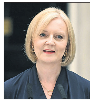
କୋଟିଟଙ୍କା ପର୍ଯ୍ୟନ୍ତ ଉପସାଧାରଣ ସ୍ମାରକ ସମ୍ପାଦନା କାର୍ଯ୍ୟ ସମାପ୍ତ ହୋଇଛି । ମହାରାଷ୍ଟ୍ରର କୋଟିଟଙ୍କା ପର୍ଯ୍ୟନ୍ତ ଉପସାଧାରଣ ସ୍ମାରକ ସମ୍ପାଦନା କାର୍ଯ୍ୟ ସମାପ୍ତ ହୋଇଛି ।

କୋଟିଟଙ୍କା ପର୍ଯ୍ୟନ୍ତ ଉପସାଧାରଣ ସ୍ମାରକ ସମ୍ପାଦନା କାର୍ଯ୍ୟ ସମାପ୍ତ ହୋଇଛି । ମହାରାଷ୍ଟ୍ରର କୋଟିଟଙ୍କା ପର୍ଯ୍ୟନ୍ତ ଉପସାଧାରଣ ସ୍ମାରକ ସମ୍ପାଦନା କାର୍ଯ୍ୟ ସମାପ୍ତ ହୋଇଛି । ମହାରାଷ୍ଟ୍ରର କୋଟିଟଙ୍କା ପର୍ଯ୍ୟନ୍ତ ଉପସାଧାରଣ ସ୍ମାରକ ସମ୍ପାଦନା କାର୍ଯ୍ୟ ସମାପ୍ତ ହୋଇଛି ।