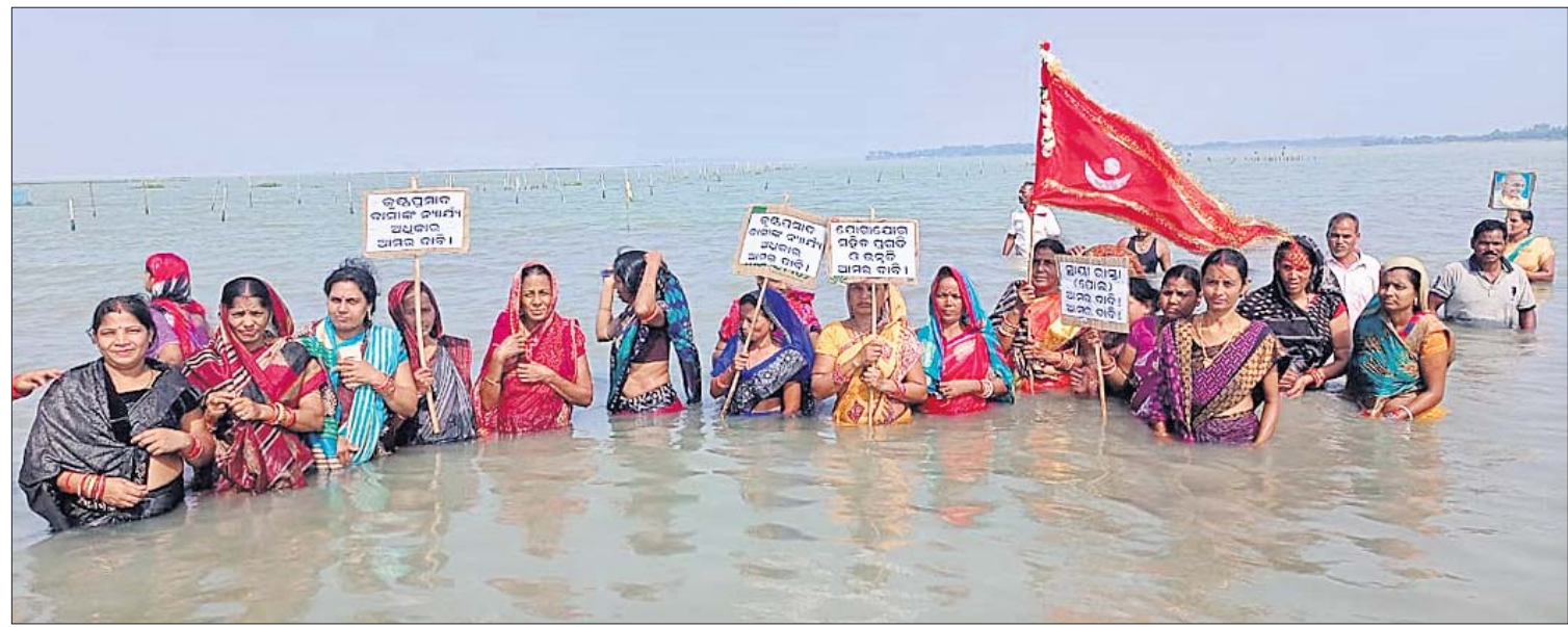
ପୁରୀ ଜିଲ୍ଲା ଜହ୍ନବନ୍ଦୁରୁ ଯାତପଡ଼ା ପର୍ଯ୍ୟନ୍ତ ଚିଲିକାରେ ଘୁଆ ପୋଲ ନିର୍ମାଣ ଦାବିରେ ଶନିବାର କୁସ୍ତ୍ରପ୍ରଦାୟ ଦ୍ୱୀପାଞ୍ଚଳ ସେତୁ ମଞ୍ଚ ପକ୍ଷରୁ ମହିଳାମାନେ ପାଣିରେ ଆନ୍ଦୋଳନ କରୁଛନ୍ତି ।