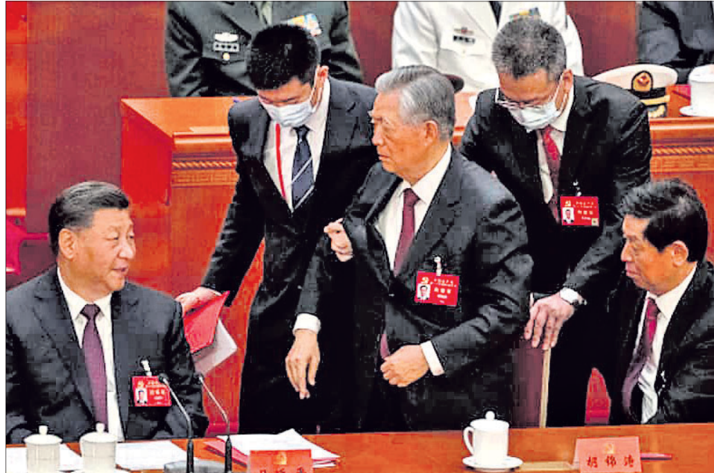
ସିପିସି ଅଧିବେଶନ ଚାଲିଥିବାବେଳେ ଚାଇନାର ପୂର୍ବତନ ରାଷ୍ଟ୍ରପତି ହୁ ଜିଂଆଓଙ୍କୁ ସୁରକ୍ଷାକର୍ମୀମାନେ ଉଠାଇ ନେଉଛନ୍ତି।

ଚାଇନା କମ୍ୟୁନିଷ୍ଟ ପାର୍ଟି(ସିପିସି)ର ଅଧିବେଶନ ଶନିବାର ଶେଷ ହୋଇଛି।