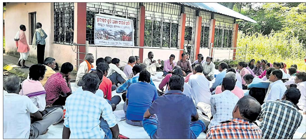
ବେହେରାଗୁଡ଼ା ପୂର୍ବ ତାଳବଜାରରେ ସଂଗ୍ରାମ ସମିତିର ବୈଠକ ।

ସମ୍ବଲପୁର ମହାନଗର ନିଗମ ଅଞ୍ଚଳକୁ ସାମାଜିକ କର୍ମୀମାନେ ଯୋଗଦେଇ ରକ୍ତଦାନ କରିଥିଲେ। ପ୍ରଦେସର ଆଦିତ୍ୟ ହୋଇଥିଲା। ପ୍ରଦେସର ଆଦିତ୍ୟ ହୋଇଥିଲା।