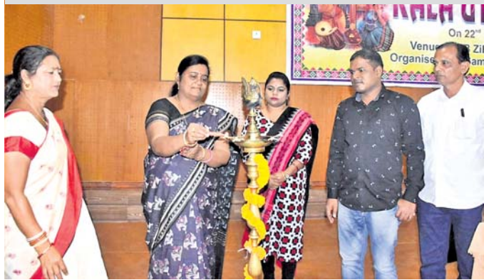
କଳା ଉତ୍ସବକୁ ଅତିଥିମାନେ ଉଦ୍‌ଘାଟନ କରୁଛନ୍ତି ।