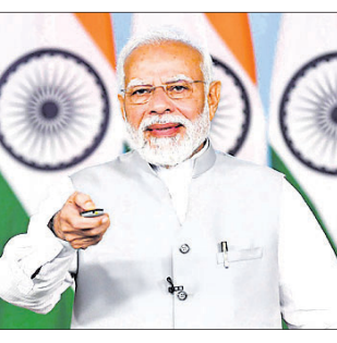
ନୂଆଦିଲ୍ଲୀ, ୨୨ ଅକ୍ଟୋବର (ପି.ଟି.)

ପୁର ହୋଇଥିବ, ଏହା କେହି ଭାବିବା ଉଚିତ ନୁହେଁ ବୋଲି ପ୍ରଧାନମନ୍ତ୍ରୀ କହିଛନ୍ତି। ଏହା ସତ୍ତ୍ୱେ ଉପରୋକ୍ତ ବ୍ୟାଲେଞ୍ଜିଂ ଆରତକୁ ପୂର୍ଣ୍ଣ ରଖିବା ଲାଗି ସରକାର ନୂଆ ଉପକ୍ରମ ହାତକୁ ନେଇଛନ୍ତି।