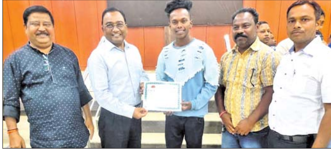
କାର୍ଯ୍ୟକ୍ରମରେ ଅତିଥିମାନେ ରକ୍ତଦାନକୁ ସାର୍ବିକ୍ଷେପ ପ୍ରଦାନ କରୁଛନ୍ତି ।