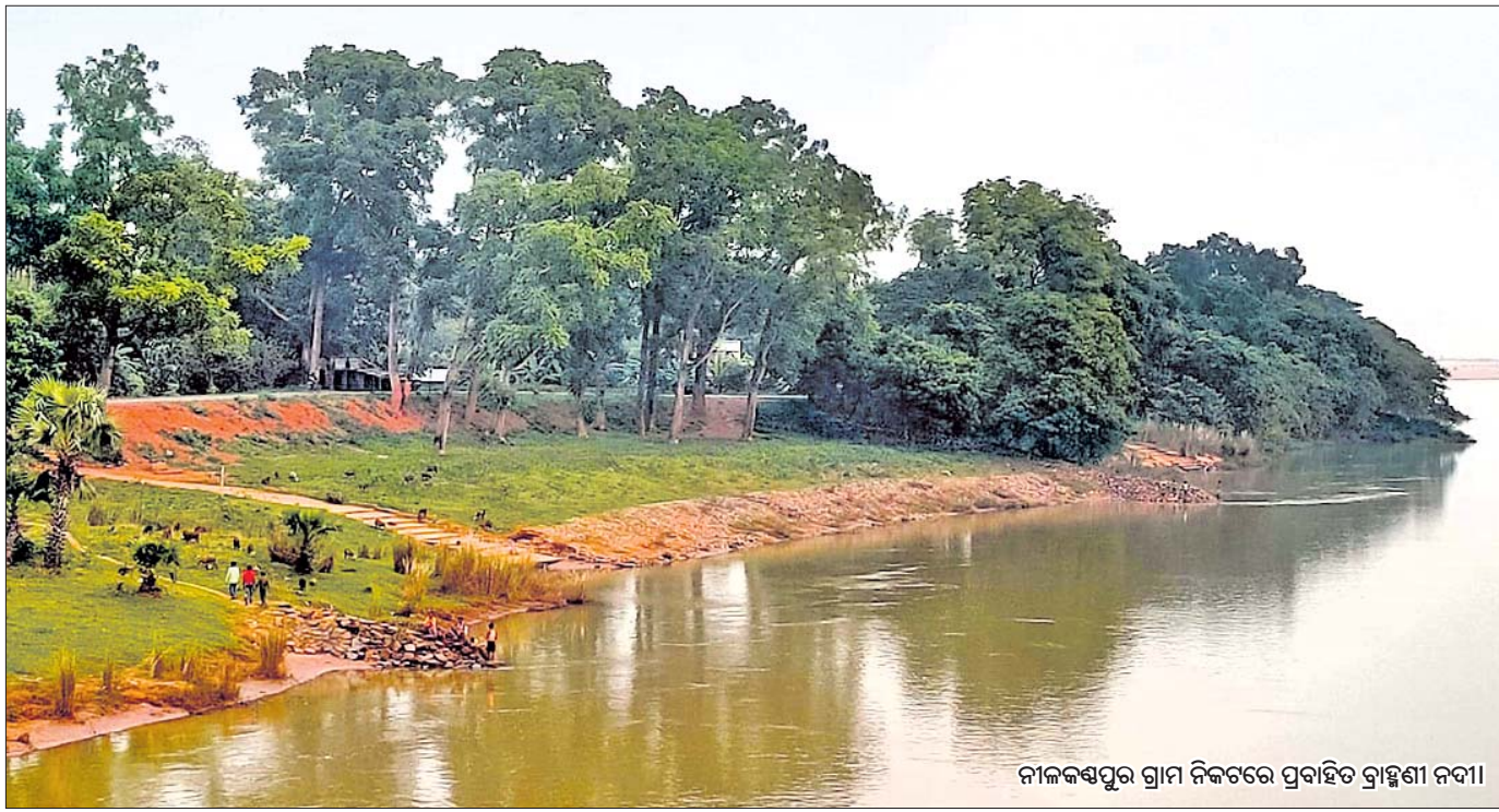
ନୀଳକଣ୍ଠପୁର ଗ୍ରାମ ନିକଟରେ ପ୍ରବାହିତ ବ୍ରାହ୍ମଣୀ ନଦୀ।