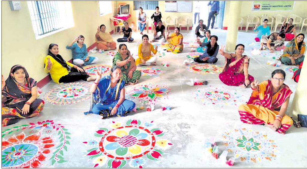
ପ୍ରତିଯୋଗିତାରେ ଭାଗ ନେଇଥିବା ମହିଳାମାନେ ।