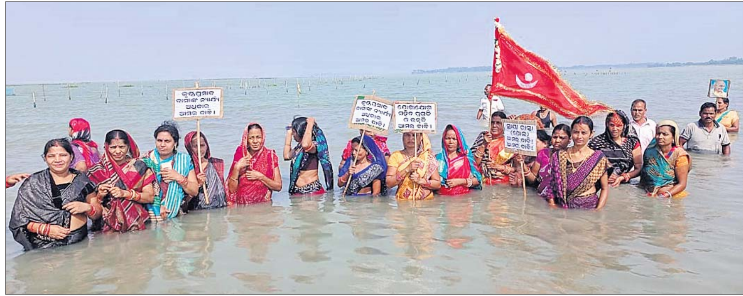
ପୁରୀ ଜିଲ୍ଲା ଜହ୍ନୁବାବୁ ସାତପଡ଼ା ପର୍ଯ୍ୟନ୍ତ ଚଳିକାରେ ଘୁାୟା ପୋଲ ନିର୍ମାଣ ଦାବିରେ ଶନିବାର କୁସ୍ତ୍ରପ୍ରଦାଦ ଦ୍ୱାପାଞ୍ଚଳ ସେତୁ ମଞ୍ଚ ପକ୍ଷରୁ ମହିଳାମାନେ ପାଣିରେ ଆନ୍ଦୋଳନ କରୁଛନ୍ତି ।