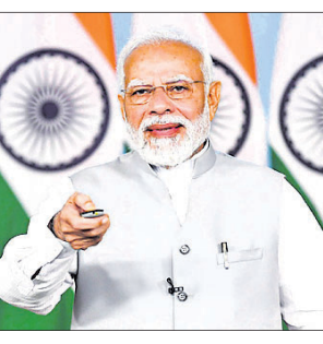
ନୂଆଦିଲ୍ଲୀ, ୨୨ ଅକ୍ଟୋବର (ପି.ଟି.)

ପ୍ରଧାନମନ୍ତ୍ରୀ ନରେନ୍ଦ୍ର ମୋଦି ଶନିବାର 'ରୋଜଗାର ମେଳା'ର ଶୁଭାରମ୍ଭ କରିଛନ୍ତି।