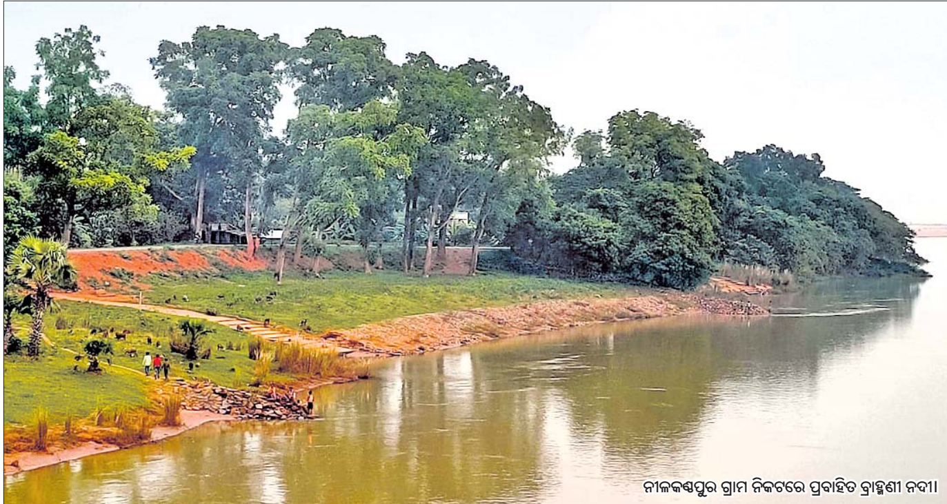
ନୀଳକଣ୍ଠପୁର ଗ୍ରାମ ନିକଟରେ ପ୍ରବାହିତ ବ୍ରାହ୍ମଣୀ ନଦୀ।

ଭାରତ ଏବେ ବିଶ୍ୱର ଦ୍ୱିତୀୟ ସର୍ବାଧିକ ପ୍ରଦୂଷିତ ରାଷ୍ଟ୍ର। ବାୟୁ ପ୍ରଦୂଷଣ ଯୋଗୁ ଦେଶବାସୀଙ୍କ ହାରାହାରି ଆୟୁଷ ୫ ବର୍ଷ ହ୍ରାସ ପାଇଲାଣି। ରାଜଧାନୀ ଦିଲ୍ଲୀ ସମେତ କେତେକ ସହରାଞ୍ଚଳରେ ଲୋକଙ୍କ ହାରାହାରି ଆୟୁଷ ୧୦ ବର୍ଷ ହ୍ରାସ ପାଇଥିବା ଜଣାପଡ଼ିଛି। ଦିଲ୍ଲୀ ବିଶ୍ୱର ସବୁଠୁ ପ୍ରଦୂଷିତ ସହରର ପରିଚୟ ହାସଲ କରିଛି। ଏହା ସତ୍ତ୍ୱେ ବାୟୁ ପ୍ରଦୂଷଣ ରୋକିବା ଦିଗରେ ସରକାରଙ୍କ କାର୍ଯ୍ୟଯୋଜନା କେବଳ କାଗଜକଲମରେ ଅଟକି ରହିଛି। ଦେଶର ୧୩୦ କୋଟି ଜନସଂଖ୍ୟାରେ ବସବାସ କରୁଥିବା ଅଞ୍ଚଳରେ ବାର୍ଷିକ ହାରାହାରି କଣିକା ପ୍ରଦୂଷଣ ପ୍ରତି ବର୍ଷ ସାଧ୍ୟ ୫୦୦୦ (ତନ୍ୟୁଏଏସ୍) ଗାଇଡ଼ଲାଇନରେ ଧାର୍ଯ୍ୟ ସ୍ତରଠାରୁ ଯଥେଷ୍ଟ ଅଧିକ ରହିଛି। ତନ୍ୟୁଏଏସ୍ ଗାଇଡ଼ଲାଇନ ଅନୁଯାୟୀ ପ୍ରତି ଘନମିଟର ବାୟୁ ୫ ମାଇକ୍ରୋଗ୍ରାମ୍ ସୁସ୍ଥ କଣିକା ପ୍ରଦୂଷଣ (ପିଏମ୍୧୦.୫)। ବାୟୁ ପ୍ରଦୂଷଣ ମାପିବାର ଏହା ବର୍ତ୍ତମାନର ସବୁଠୁ ଉଚ୍ଚତମ ମାପକାଠି। ଭାରତର ଜାତୀୟ ବାୟୁ ମାନ ଷ୍ଟାଣ୍ଡାର୍ଡ୍ ପ୍ରତି ଘନମିଟର ବାୟୁରେ ୪୦ ମାଇକ୍ରୋଗ୍ରାମ୍ ଧାର୍ଯ୍ୟ ହୋଇଥିବାବେଳେ ଏହା ପ୍ରତିଶତରୁ ଉର୍ଦ୍ଧ୍ୱ ଲୋକ ରହୁଥିବା ଅଞ୍ଚଳର ପ୍ରଦୂଷଣ ପ୍ରାୟ ଏହାଠାରୁ ଅଧିକ ରହିଛି। ବାୟୁରେ ରହୁଥିବା ସୁସ୍ଥ କଣିକା ମାନବ ସ୍ୱାସ୍ଥ୍ୟ ପାଇଁ ସବୁଠୁ ବଡ଼