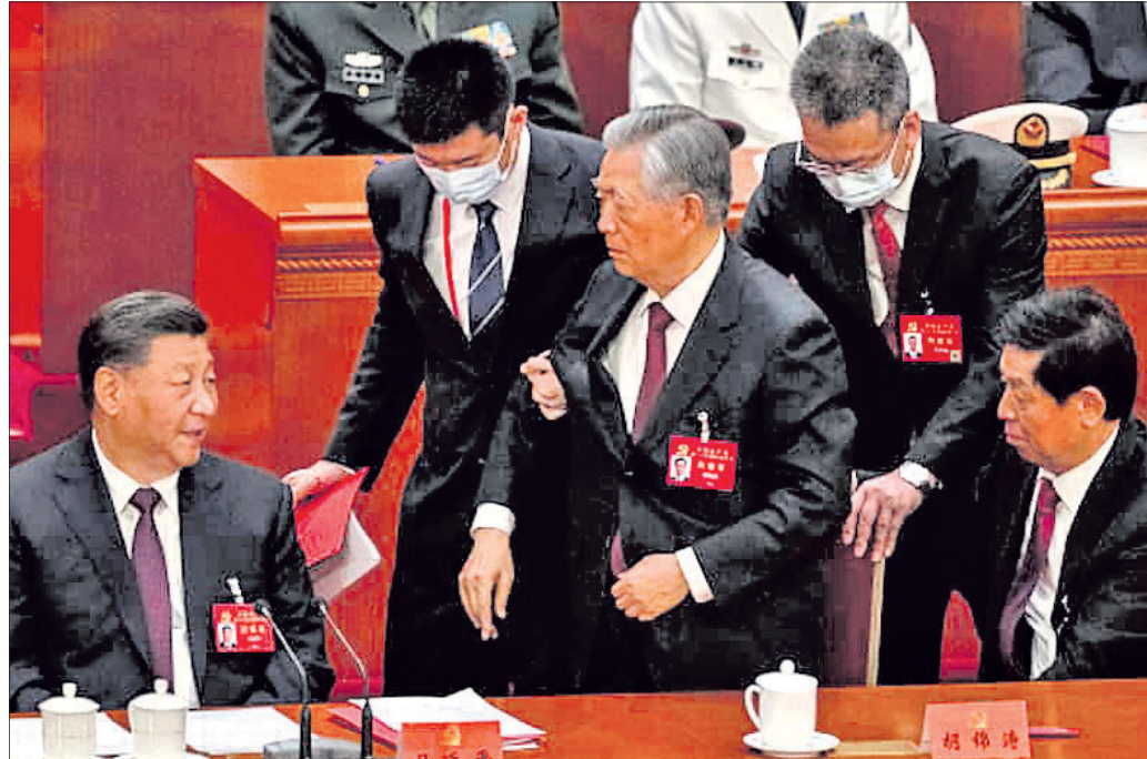
ସିପିସି ଅଧିବେଶନ ଚାଇନା ସମ୍ବଳିତ ଚାଇନା ପୂର୍ବତନ ରାଷ୍ଟ୍ରପତି ହୁ ଜିଂଆଂଙ୍କୁ ସୁରକ୍ଷାକର୍ମୀମାନେ ଉଠାଇ ନେଉଛନ୍ତି।

ଚାଇନା କମ୍ୟୁନିଷ୍ଟ ପାର୍ଟି(ସିପିସି)ର ଅଧିବେଶନ ଚାଇନା ପୂର୍ବତନ ରାଷ୍ଟ୍ରପତି ହୁ ଜିଂଆଂଙ୍କୁ ସୁରକ୍ଷାକର୍ମୀମାନେ ଉଠାଇ ନେଉଛନ୍ତି।