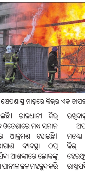
ୟୁକ୍ରେନ୍‌ରେ ରାଜଦଣ୍ଡ। ଯୁକ୍ରେନ୍‌ରେ ରାଜଦଣ୍ଡ।