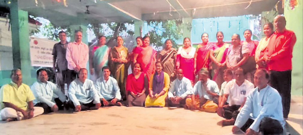
ସାହିତ୍ୟ ଆସରରେ ଯୋଗଦେଇଥିବା ସାହିତ୍ୟପ୍ରେମୀ।