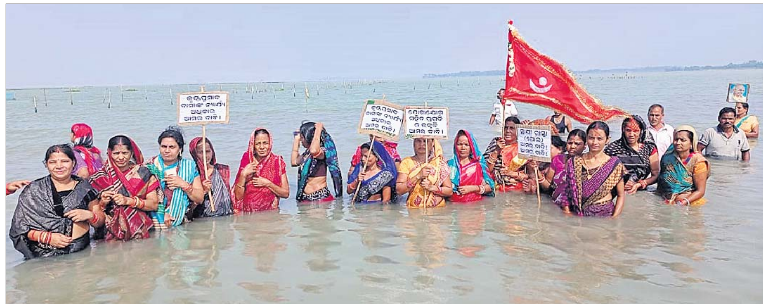
ପୁରୀ ଜିଲ୍ଲା ଜହ୍ନୁବାବୁ ସାତପଡ଼ା ପର୍ଯ୍ୟନ୍ତ ଚଳିକାରେ ଘୁାୟା ପୋଲ ନିର୍ମାଣ ଦାବିରେ ଶନିବାର କୁସ୍ତ୍ରପ୍ରସାଦ ଦ୍ଵୀପାଞ୍ଚଳ ସେତୁ ମଞ୍ଚ ପକ୍ଷରୁ ମହିଳାମାନେ ପାଣିରେ ଆନ୍ଦୋଳନ କରୁଛନ୍ତି ।