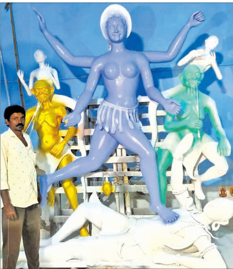
କଟକଣା ନ ଥିବାରୁ କାଳୀପୂଜା ପୂର୍ବରୁ ପୂଜାମଣ୍ଡପ ସଜେଇ ହୋଇଛି। ଆୟୋଜନ କରାଯାଇଛି। ମା'କ ଆବାହନ ପୂର୍ଣ୍ଣା ପ୍ରତିମା ନିର୍ମାଣ ଶେଷ ପର୍ଯ୍ୟନ୍ତରେ

ଦିନକ ପରେ ଧରାବତରଣ କରିବେ ମା'କାଳୀ। ଏହାକୁ ନେଇ ଚଳଚ୍ଚିତ୍ର ହୋଇଉଠିଛି ଡେକାନାଲ ଜିଲ୍ଲାର ଐତିହ୍ୟସମ୍ପନ୍ନ ସହର ଭୁବନ। ଦୀର୍ଘ ୨ବର୍ଷ ପରେ ଆଡ଼ମ୍ବର ସହକାରେ ହେଉଥିବା ମା'କ ପୂଜା ପାଇଁ ସମସ୍ତଙ୍କ ମଧ୍ୟରେ ବିପୁଳ ଇଚ୍ଛା, ଭକ୍ତାପନା ଦେଖିବାକୁ ମିଳିଥିବାବେଳେ ୩ ଦିନିଆ ସାଂସ୍କୃତିକ କାର୍ଯ୍ୟକ୍ରମରେ ଦୁର୍ଲଭ ସହର ପରିବେଶ। ଭୁବନର କାଳୀପୂଜା ଜିଲ୍ଲାରେ ସ୍ୱତନ୍ତ୍ର ଚଳଚ୍ଚିତ୍ର ଏବଂ ନୂତନ ମଣ୍ଡପ, ନୂଆହାଟ, ମଠକରଗୋଳା ଆଦି ୫ଟି ସ୍ଥାନରେ ବଡ଼ ଧରଣର ମେଡ଼ ହେଉଛି। କରୋନା ପାଇଁ ୨ବର୍ଷ ହେଲା ମେଡ଼ରେ କେବଳ ନୀତି ସମ୍ପନ୍ନ ହୋଇଥିବାବେଳେ ଏ ବର୍ଷ