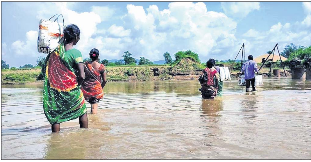
ନଦୀ ଭିତରେ ପଶି ଯାଉଛନ୍ତି ଗ୍ରାମବାସୀ ।

ହାଟ, ବଜାର ଥିବା ପର୍ଯ୍ୟନ୍ତ ପହଞ୍ଚି ପାରୁନାହାନ୍ତି । ଯଦି ନଦୀର ପ୍ରସାରଣ ହେଉଛି ତେବେ ଗ୍ରାମବାସୀଙ୍କ ଉପାଧିକାର ଉପରେ ପ୍ରଭାବ ପଡ଼ିବ ।