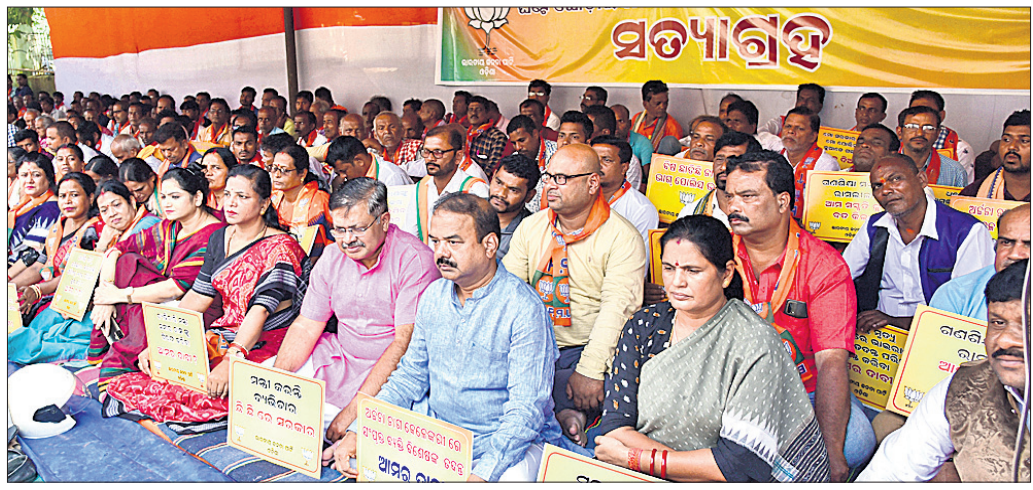
ପୋଲିସ କମିଶନରୁ ଅଫିସ ଆଗରେ ଭାଜପା ପକ୍ଷରୁ ଦିଆଯାଇଥିବା ଅହୋରାତ୍ର ଧାରଣାରେ ନେତା ଓ କର୍ମୀ।