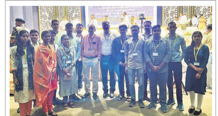
କେନ୍ଦ୍ର ଶ୍ରମ ଓ ନିୟୋଜନ ମନ୍ତ୍ରାଳୟର ସ୍ୱଚ୍ଛତା ଯୁକ୍ତ (ଇଏସ୍ଆଇସି) ମଧ୍ୟ ରାଷ୍ଟ୍ରୀୟ ରୋକିବାରେ ମୋକାରେ ଅଂଶ ଗ୍ରହଣ କରିଥିଲା। ଏହି ପରିପ୍ରେକ୍ଷାରେ ମୋକା ଜଣେ ଗୁପ୍ତ ସି ପଦବୀରେ ନିଯୁକ୍ତି ଦିଆଯିବା ସହ ନିଯୁକ୍ତିପତ୍ର ବନ୍ଧନ କରାଯାଇଥିଲା।

ଆଣ୍ଡ ଏରୋସ୍ପେସ୍ ଉନ୍ନତମାନର ସାମଗ୍ରୀ ପ୍ରଦର୍ଶନ କରିଥିବାରୁ ଆମେ ଗର୍ବିତ। ସେହିଭଳି ପରବର୍ତ୍ତୀ ପିଢ଼ିର ପ୍ରତିରକ୍ଷା ପ୍ରୟୋଗଗୁଡ଼ିକ ପାଇଁ ପାଇବର କମ୍ପୋଜିଟ୍ ମଧ୍ୟ ହେବ। ଆମେ ଦେଶର ସାମରିକ ବାହିନୀ ପାଇଁ ପରବର୍ତ୍ତୀ ପିଢ଼ିର ସୁରକ୍ଷା ପାଇଁ କାର୍ଯ୍ୟ କରିବା। ଫଳରେ ଏହାଦ୍ୱାରା ଭାରତୀୟ ସୈନ୍ୟ ବାହିନୀକୁ ଭବିଷ୍ୟତର ମୁକ୍ତ କ୍ଷମତା ଗଠନରେ ସହାୟତା ରୁହେଁ ବରଂ ଭାରତୀୟ ପ୍ରତିରକ୍ଷା ପ୍ରଣାଳୀର ଉନ୍ନତ ସିଦ୍ଧିକୁ ମଧ୍ୟ ମଜବୁତ କରିବ।