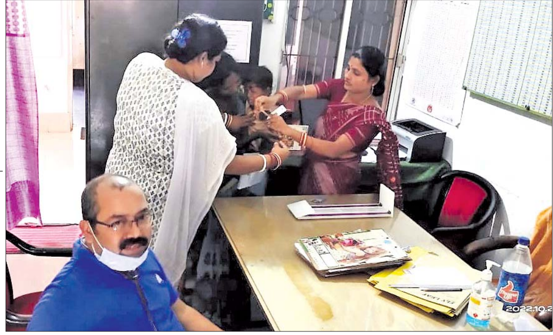
ଅପପୁଷ୍ଟିର ଶିକାର ଜଣେ ଶିଶୁଙ୍କୁ ଚିକିତ୍ସା କରାଯାଉଛି ।