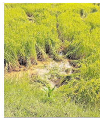
ଡେକାନାଲ ଅଫିସ, ୨୨।୧୦

ଡେକାନାଲ ସଦର ଏବଂ ରବିଆ ବୁକ ଅଞ୍ଚଳରେ ହାତୀ ଉପଦ୍ରବ ଅଞ୍ଚଳବାସୀଙ୍କ ନିଦ ହଜାଇ ଦେଇଛି। ସଦର ବୁକ ବେଳଟିକି ଗ୍ରାମରେ ଶନିବାର ହାତୀପଲ ବ୍ୟାପକ ଫସଲ ନଷ୍ଟ କରିବା ସହ ବିଲ ଛୁଡ଼ାରେ ଥିବା ଛୁଡ଼ିଆକୁ ଭାଙ୍ଗି ଦେଇଥିବା ଗଣ୍ୟ ନକ୍ତୁଳ ସେଣ୍ଟ ଏବଂ ପ୍ରଫୁଲ୍ଲ ସେଣ୍ଟ ଅଭିଯୋଗ କରିଛନ୍ତି। ହାତୀପଲ ଗୋଡାଲବାକୁ ଉଭୟ ଗଣ୍ୟ ଜୀବନ ବଞ୍ଚାଇ ଦେଇ ପଳାଇଥିଲେ। ସେହିପରି ପିଲୁଆ ଜନସମିତି ଅଞ୍ଚଳରେ ଦିନବେଳା ଏକ ଦକ୍ଷାହାତୀର ଉପଦ୍ରବ ଅଞ୍ଚଳରେ ଭୟ ଆଡ଼କର ବାତାବରଣ ସୃଷ୍ଟି କରିଛି। ବନ କର୍ମଚାରୀ ହାତୀକୁ ଘଉଡ଼ାଇ ନ ଥିବାବେଳେ ଅଭିଯୋଗ ହେଉଥିବାବେଳେ ଏହାକୁ ନେଇ ଅଞ୍ଚଳରେ ଅସନ୍ତୋଷ ପ୍ରକାଶ ପାଇଛି।