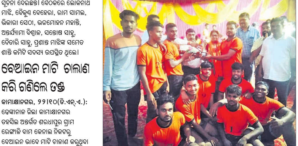
ଚାମ୍ପିୟନ ଦଳକୁ ଅଭିନୂମାନେ ଟ୍ରଫି ପ୍ରଦାନ କରୁଛନ୍ତି।