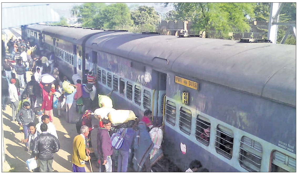
ବଲାଙ୍ଗୀର ଜିଲା ଲାଠୋର ରେଳ ଷ୍ଟେଶନରୁ ପୋଲିସ୍ ଭଙ୍ଗାର କରିଥିବା ଦାଦନ ଶ୍ରମିକ।

୧୯୮୦ ଓ ୯୦ ଦଶକର ପ୍ରାରମ୍ଭରେ ଅଧିକତମ ବଲାଙ୍ଗୀର ଦେଶର ଦରିଦ୍ରତମ ଜିଲାଗୁଡ଼ିକ ମଧ୍ୟରେ ପରିଗଣିତ ହେଉଥିଲା। ବିଗତ ୨ ଦଶନ୍ଧି ହେଲା ବଲାଙ୍ଗୀର ଓ ସୁବର୍ଣ୍ଣପୁର ଜିଲାରେ ଉନ୍ନୟନମୂଳକ କାର୍ଯ୍ୟ କରାଯାଉଥିବା ଦେଖିବାକୁ ମିଳୁଛି। ଏହାସତ୍ତ୍ୱେ ଗ୍ରାମାଞ୍ଚଳରେ ସରକାରୀ ସ୍ତରରେ ନିମ୍ନକ୍ରିୟାମୟ ସୃଷ୍ଟି କରାଯାଇପାରି ନ ଥିବା ଶ୍ରମିକଙ୍କ ଗଣପକାୟନକୁ ସ୍ୱସ୍ତ ହୋଇଛି। ପ୍ରତିବର୍ଷ ଅନେକ ହଜାର ପରିବାର ଦାଦନର କଷ୍ଟାପାତ ସହି ନ ପାରି ଆନ୍ତ୍ରପ୍ରଦେଶ, ତେଲଙ୍ଗାନା ଓ ତାମିଲନାଡୁକୁ ଦାଦନ ଖତିବାଜୁ ଯାଉଛନ୍ତି। ୨୦୨୦ରେ କୋଭିଡ-୧୯ ଜନିତ ଲକ୍ଷ୍ମଣର ବେଳେ ବଲାଙ୍ଗୀର ଜିଲାକୁ ପ୍ରାୟ ଦେଢ଼ଲକ୍ଷ ପ୍ରବାସୀ ବାହ୍ୟ ରାଜ୍ୟକୁ ଫେରିଥିଲେ। ସେମାନଙ୍କ ମଧ୍ୟରୁ ଲକ୍ଷେ ହେଉଛନ୍ତି ଦାଦନ ଶ୍ରମିକ। ଗତ ସପ୍ତାହକ ମଧ୍ୟରେ ଜିଲାର ବିଭିନ୍ନ ରେଳଷ୍ଟେଶନରୁ ପ୍ରାୟ ୪୦୦ ଦାଦନକୁ ଭଙ୍ଗାର କରାଯାଇଥିବାବେଳେ ୧୦ ସର୍ଦ୍ଦାରକୁ ଗିରଫ କରାଯାଇଛି। ଏତେ ସତ୍ତ୍ୱେ ପ୍ରଶାସନ କହୁଛି, ଲୋକେ ଦାଦନ ଖତିବାଜୁ ଯାଉନାହାନ୍ତି। ଏହା ପ୍ରଶାସନର ବିରୋଧାଭାସ ଚିତ୍ରକୁ ପ୍ରଦର୍ଶନ କରୁଥିବା ସାଧାରଣରେ ଆଲୋଚନା ହେଉଛି।