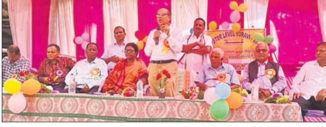
ଶିଶୁ ମହୋତ୍ସବରେ ମଞ୍ଚାସୀନ ଅତିଥି ବୃନ୍ଦ ।

ମାର୍ଗାଢ଼ାଳ ବ୍ଲକ ପିକବାଳି କପିଳପୁତ୍ର ସରକାରୀ ଉଚ୍ଚ ବିଦ୍ୟାଳୟ ପରିସରରେ ଜଗନ୍ନାଥ ଆଞ୍ଚଳିକ ସାଧନପୁରୀ ଶିଶୁ ମହୋତ୍ସବ ପୁରଭି ଅନୁଷ୍ଠିତ ହୋଇଯାଇଛି।