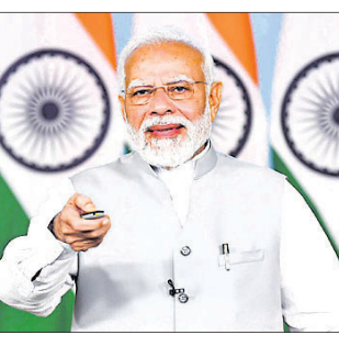
ନୂଆଦିଲ୍ଲୀ, ୨୨।୧୦ (ପି.ଟି.)

ପ୍ରଧାନମନ୍ତ୍ରୀ ନରେନ୍ଦ୍ର ମୋଦି ଶନିବାର 'ରୋଜଗାର ମେଳା'ର ଶୁଭାରମ୍ଭ କରିଛନ୍ତି। ଏହି ଯୋଜନାରେ ୧୦ ଲକ୍ଷ ମୁଦ୍ରାପତ୍ରକୁ ସରକାରୀ ନିୟନ୍ତ୍ରିତ ଯୋଗାଇ ଦିଆଯିବ। ପ୍ରଥମ ପର୍ଯ୍ୟାୟରେ ଶନିବାର ୧୫ ହଜାରରୁ ଊର୍ଦ୍ଧ୍ଵ ଲୋକଙ୍କୁ ବିଭିନ୍ନ ବିଭାଗରେ ନିୟନ୍ତ୍ରିତ ଭାବେ ନିୟନ୍ତ୍ରିତ ପ୍ରଦାନ କରାଯାଇଛି। ଏହି ଅବସରରେ ଉପସାଧାରଣ ଦେଇ ପ୍ରଧାନମନ୍ତ୍ରୀ କହିଛନ୍ତି, ଅଧିକାଂଶ ଦେଶରେ ଅତ୍ୟଧିକ ମୁଦ୍ରାମ୍ଭାତି ଓ ବେରୋଜଗାରୀ ଯୋଗୁଁ ଦେଶ ଅର୍ଥନୀତି ଚ୍ୟାଲେଞ୍ଜର ସମ୍ମୁଖୀନ ହୋଇଛି। ଏଭଳି ସ୍ଥିତିରୁ ମୁକ୍ତିଲାଭ କରିବା ପାଇଁ ଭାରତ ସବୁ ପ୍ରକାର ଉଦ୍ୟମ ଜାରି ରଖିଛି। ଏହା ସତ ଯେ, ବିଶ୍ଵର ଆର୍ଥିକ ସ୍ଥିତି ଭଲ ନାହିଁ। ଅନେକ ବୃହତ୍ ଅର୍ଥନୀତି ମାନ୍ଦିରାଣ୍ୟକୁ ମୁକ୍ତିଲାଭ କରିବା ସଂପର୍କ କରୁଛନ୍ତି। କୋଭିଡ୍ ମହାମାରୀର ପାର୍ଶ୍ଵ ପ୍ରଭାବ ୧୦୦ ଦିନରେ