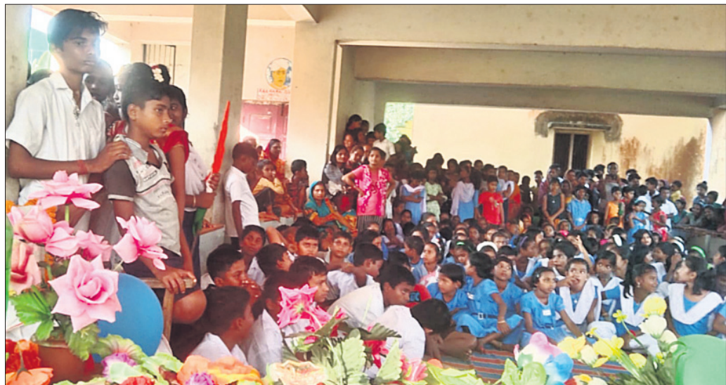
ଜଗମୋହନ ସରକାରୀ ଉଚ୍ଚ ବିଦ୍ୟାଳୟ ଶିଶୁ ମହୋତ୍ସବ ପୁରଭି-୨୦୨୨ରେ ଅଂଶ ଗ୍ରହଣ କରିଥିବା ଛାତ୍ରାଛାତ୍ରୀ ।

ରାଜନଗର, ୨୨।୧୦।୨୨ (ଡି.ଏନ୍.ଏ.): ବଜୋପାସାର ଚରବର୍ତ୍ତୀ ସାତଭାୟାବାସୀଙ୍କୁ ସମୁଦ୍ର ତେଜରୁ ରକ୍ଷା କରିବା ପାଇଁ ରାଜ୍ୟ ସରକାର ୨୦୧୧ରୁ ପ୍ରକ୍ରିୟା ଆରମ୍ଭ କରିଥିଲେ।