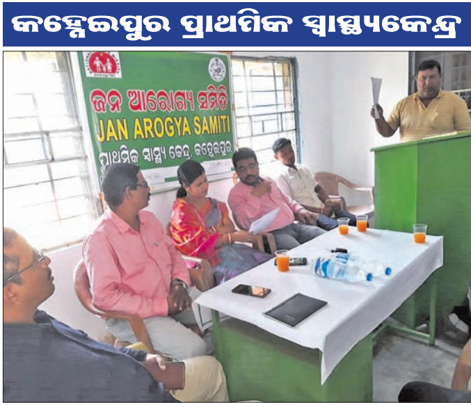
ବୈଠକରେ ଉପସ୍ଥିତ ସାମ୍ପ୍ରଦାୟିକ ଶାସ୍ତ୍ରୀଙ୍କ ସହିତ ।

ଖଲ୍ଲିକୋଟ ରୁକ୍ମିଣୀଙ୍କୁ ଚିକିତ୍ସା ପ୍ରଦାନ ପାଇଁ ଚିକିତ୍ସକ ଡାକ୍ତରୀରେ ଚିକିତ୍ସା ପ୍ରଦାନ କରାଯାଇଛି। ଚିକିତ୍ସକ ଡାକ୍ତରୀରେ ଚିକିତ୍ସା ପ୍ରଦାନ କରାଯାଇଛି।