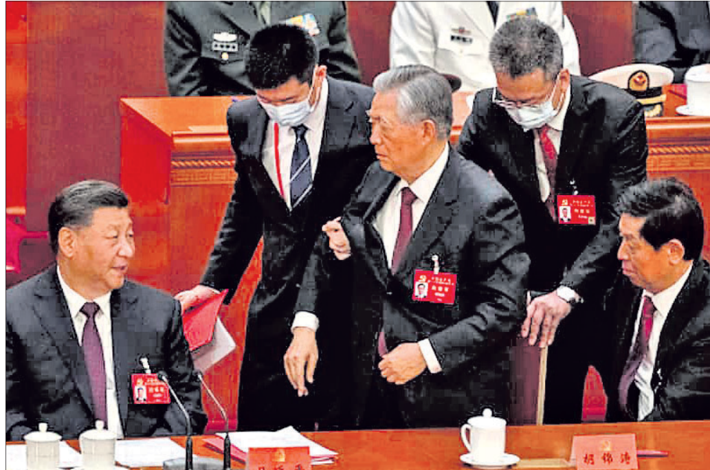
ସିପିସି ଅଧିବେଶନ ଚାଇନାବାଦେଶ ଚାଇନାର ପୂର୍ବତନ ରାଷ୍ଟ୍ରପତି ହୁ ଜିଂଆଓଙ୍କୁ ସୁରକ୍ଷାକର୍ମୀମାନେ ଉଠାଇ ନେଉଛନ୍ତି।

ବେଙ୍ଗ, ୨୨।୧୦: ଚାଇନା କମ୍ୟୁନିଷ୍ଟ ପାର୍ଟି(ସିପିସି)ର ସମ୍ପୂର୍ଣ୍ଣ କମିଟି ଏହାର ମହାସଭାରେ ପାର୍ଟିର ମୁଖ୍ୟ ରହିବା ସହ ଦେଶ ମଧ୍ୟ ଅଧିବେଶନ ଶନିବାର ଶେଷ ହୋଇଛି। ଏଥିରେ ରାଷ୍ଟ୍ରପତି ହୁ ଜିନ୍‌ପିଙ୍ଗ କମ୍ୟୁନିଷ୍ଟ ପାର୍ଟିର ଶକ୍ତିଶାଳୀ ସେଣ୍ଟ୍ରାଲ କମିଟିକୁ ନିର୍ବାଚିତ ହୋଇଛନ୍ତି। ଫଳରେ ୧୯ ବର୍ଷୀୟ ଜିନ୍‌ପିଙ୍ଗ ତୃତୀୟ ଥର ପାଇଁ ଚାଇନାର ରାଷ୍ଟ୍ରପତି ହେବା ସୁନିଶ୍ଚିତ ହୋଇଛି। ରବିବାର ସେଣ୍ଟ୍ରାଲ କମିଟିର ବୈଠକ ସଂପର୍କ ସହ ଏଥିରେ ୨୫ ଜଣ ସଦସ୍ୟ ବିଶିଷ୍ଟ ପଲିଟିକାଲ ବୁକ୍‌ସୋ ଗଠନ ହେବ। ଏଥିରେ ସେଣ୍ଟ୍ରାଲ କମିଟିର ୬ କିମ୍ବା ତତ୍ତ୍ଵମୁଖ୍ୟ ମେମ୍‌ବରଙ୍କୁ ଚୟନ କରାଯିବ। ପରେ ସେଣ୍ଟ୍ରାଲ କମିଟି ଏହାର ମହାସଭାରେ ପାର୍ଟିର ମୁଖ୍ୟ ରହିବା ସହ ଦେଶ ମଧ୍ୟ ଚଳାଇବେ। ସେଣ୍ଟ୍ରାଲ କମିଟିକୁ ଜିନ୍‌ପିଙ୍ଗ ନିର୍ବାଚିତ ହୋଇଥିବାବେଳେ ତାଙ୍କୁ ହିଁ ମହାସଭାରେ ଚୟନ କରାଯିବ ବୋଲି ପ୍ରାୟ ନିଶ୍ଚିତ। ବୈଠକ ଶେଷରେ ଜିନ୍‌ପିଙ୍ଗ କହିଥିଲେ, 'ତେୟାର ହୁ ଚାଇନାର ରାଷ୍ଟ୍ରପତି ହେବା ସୁନିଶ୍ଚିତ ହୋଇଛି। ରବିବାର ସେଣ୍ଟ୍ରାଲ କମିଟିର ବୈଠକ ସଂପର୍କ ସହ ଏଥିରେ ୨୫ ଜଣ ସଦସ୍ୟ ବିଶିଷ୍ଟ ପଲିଟିକାଲ ବୁକ୍‌ସୋ ଗଠନ ହେବ। ଏଥିରେ ସେଣ୍ଟ୍ରାଲ କମିଟିର ୬ କିମ୍ବା ତତ୍ତ୍ଵମୁଖ୍ୟ ମେମ୍‌ବରଙ୍କୁ ଚୟନ କରାଯିବ। ପରେ ସେଣ୍ଟ୍ରାଲ କମିଟି ଏହାର ମହାସଭାରେ ପାର୍ଟିର ମୁଖ୍ୟ ରହିବା ସହ ଦେଶ ମଧ୍ୟ ଚଳାଇବେ। ସେଣ୍ଟ୍ରାଲ କମିଟିକୁ ଜିନ୍‌ପିଙ୍ଗ ନିର୍ବାଚିତ ହୋଇଥିବାବେଳେ ତାଙ୍କୁ ହିଁ ମହାସଭାରେ ଚୟନ କରାଯିବ ବୋଲି ପ୍ରାୟ ନିଶ୍ଚିତ। ବୈଠକ ଶେଷରେ ଜିନ୍‌ପିଙ୍ଗ କହିଥିଲେ, 'ତେୟାର ହୁ ଚାଇନାର ରାଷ୍ଟ୍ରପତି ହେବା ସୁନିଶ୍ଚିତ ହୋଇଛି। ରବିବାର ସେଣ୍ଟ୍ରାଲ କମିଟିର ବୈଠକ ସଂପର୍କ ସହ ଏଥିରେ ୨୫ ଜଣ ସଦସ୍ୟ ବିଶିଷ୍ଟ ପଲିଟିକାଲ ବୁକ୍‌ସୋ ଗଠନ ହେବ। ଏଥିରେ ସେଣ୍ଟ୍ରାଲ କମିଟିର ୬