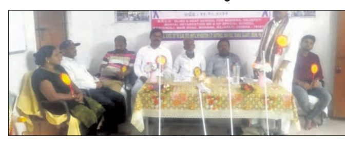
କାର୍ଯ୍ୟକ୍ରମରେ ଉପସ୍ଥିତ ଅତିଥି ।

ଆର.ଉଦୟଗିରି, ୨୨୧୧୦ (ଡି.ଏନ.ଏ.) ଆର.ଉଦୟଗିରି, ୨୨୧୧୦ (ଡି.ଏନ.ଏ.) ଆର.ଉଦୟଗିରି, ୨୨୧୧୦ (ଡି.ଏନ.ଏ.) ଆର.ଉଦୟଗିରି, ୨୨୧୧୦ (ଡି.ଏନ.ଏ.)