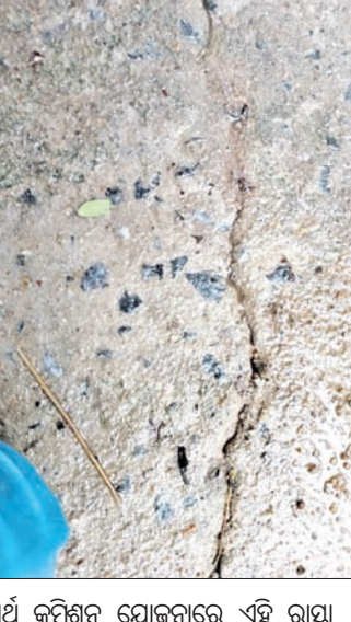
ଅର୍ଥ କମିଶନ ଯୋଜନାରେ ଏହି ରାସ୍ତା ନିର୍ମାଣ କାର୍ଯ୍ୟ କରାଯାଇଛି। ଉକ୍ତ ରାସ୍ତା

ନିର୍ମାଣ ପାଇଁ ୧ ଲକ୍ଷ ୫୦ ହଜାର ଟଙ୍କା ବ୍ୟୟ ଅଟକଳ ହୋଇଥିଲା। ୧୫୦ ଫୁଟ ଚାଷୀ ନିର୍ମାଣ ପାଇଁ ଇଣ୍ଡିମେନ୍ଟ କରା ଯାଇଥିବା ବେଳେ ପଞ୍ଚାୟତର କାର୍ଯ୍ୟ ନିର୍ମାଣ ଅଧିକାରୀ (ପିଇଓ)ଙ୍କ ନାମରେ କାର୍ଯ୍ୟାବେଶି ରହିଛି। ହେଲେ ଏହି କାର୍ଯ୍ୟରେ ସମସ୍ତ ପ୍ରକାର ସରକାରୀ ନୀତି ନିୟମ, ଇଣ୍ଡିମେନ୍ଟ ଉଲ୍ଲଙ୍ଘନ କରାଯାଇ ସ୍ଥାନୀୟ ସରପଞ୍ଚଙ୍କ ପ୍ରତିନିଧି ଜଣେ ଯୁବ ଠିକାଦାର ମନପୂର୍ଣ୍ଣ ଭାବେ ଅଧିକ ଅର୍ଥ ପାଇବା ଆଶାରେ ୧୫୦ ଫୁଟ ବଦଳରେ ୨୫୦ ଫୁଟ କାର୍ଯ୍ୟ କରିଥିବା ଅଭିଯୋଗ ହୋଇଛି। ଏହି କଂକ୍ରିଟ୍ ରାସ୍ତା ନିର୍ମାଣ କାର୍ଯ୍ୟର ଉଚ୍ଚଗୁଣାୟ ଭିତ୍ତିକାରୁ