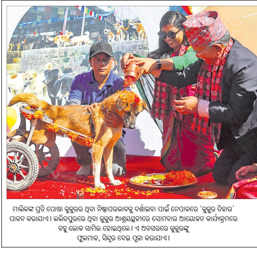
ମାଲିକଙ୍କ ପ୍ରତି ପୋଷା କୁକୁରର ଥିବା ନିଷ୍ଠାପରଭାବକୁ ଦର୍ଶାଇବା ପାଇଁ ନେପାଳରେ 'କୁକୁର ଚିହାର' ପାଳନ କରାଯାଏ। ଲାଲିତପୁରରେ ଥିବା କୁକୁର ଆଶ୍ରୟସ୍ଥଳୀରେ ସୋମବାର ଆୟୋଜନ କାର୍ଯ୍ୟକ୍ରମରେ ବହୁ ଲୋକ ସାମିଲ ହୋଇଥିଲେ। ଏ ଅବସରରେ କୁକୁରକୁ ପୂଜାମାଳା, ସିନ୍ଦୂର ଦେଇ ପୂଜା କରାଯାଏ।