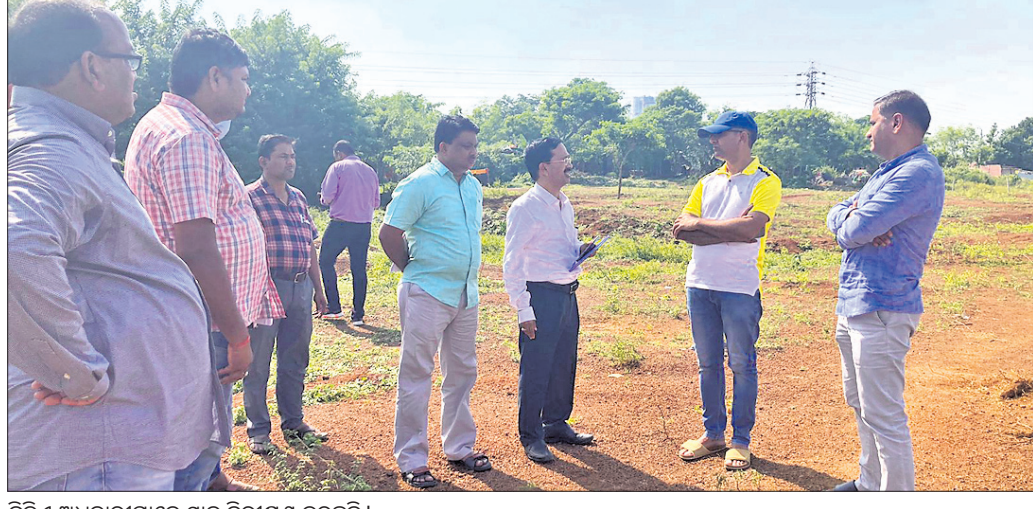
ବିଭିନ୍ନ ଅଧିକାରୀମାନେ ସ୍ଥାନ ନିରୀକ୍ଷଣ କରୁଛନ୍ତି।