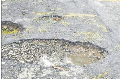
କଟାସ-ଡେଲାଇଫ ରାସ୍ତାରେ ଖାଲ ହୋଇଯାଇଛି।

କଟାସ, ୨୫।୧୦(ସ୍ୱ.ପ୍ର.) କଟାସଠାରୁ ଡେଲାଇଫ ପର୍ଯ୍ୟନ୍ତ ଯାଇଥିବା ୧୩କି.ମି ମୁଖ୍ୟ ରାସ୍ତାରେ ଅବସ୍ଥା ଶୋଚନୀୟ ହୋଇପଡ଼ିଛି। ବିଭାଗୀୟ କର୍ତ୍ତୃପକ୍ଷଙ୍କ ଏଥିପ୍ରତି ଦୃଷ୍ଟି ପଡ଼ି ନ ଥିବାରୁ ଜନଅସନ୍ତୋଷ ବୃଦ୍ଧି ପାଇଛି। ପୁରୀ ପୁଟାବକ, ରାସ୍ତା କଟରେ ଥିବା ବୁଦା ଗଛ ସବୁ ବଡ଼ି ରାସ୍ତା ଉପରକୁ ମାଡି ଆସିଛି। ସେଠାରେ ଚକ୍ରୁଣା ଗାଈଗୋରୁ, ଜେଲି-ମେଣ୍ଟା, କୁକୁର ହଠାତ୍ ବୁଦା ମଧ୍ୟରୁ ବାହାରି ରାସ୍ତା ଉପରକୁ ଆସିଯାଉଛନ୍ତି। ଫଳରେ ରାସ୍ତାରେ ବାରମ୍ବାର ଦୁର୍ଘଟଣା ଘଟୁଛି। ଚଳିତ ବର୍ଷ ପ୍ରଭାବରୁ ଉକ୍ତ ରାସ୍ତାରେ ବଡ଼ବଡ଼ ଖାଲସୃଷ୍ଟି ହୋଇଯାଇଛି। ପୂର୍ଣ୍ଣ ବିଭାଗ ପକ୍ଷରୁ ଖାଲରେ ନାଲିଗୋଟି ପକାଯାଇ ପୁରଣ କରାଯାଇଥିଲା। ପୁରଣ ସେହି ରାସ୍ତାରେ ଅନେକ ଖାଲ ହୋଇଯିବାରୁ ଦୁର୍ଘଟଣା ବୃଦ୍ଧି ପାଇଛି। ରାସ୍ତାଟି ପୂର୍ଣ୍ଣ ବିଭାଗ ଅଧୀନରେ ଥିବାବେଳେ ଅଧିକାରୀମାନେ ଧ୍ୟାନ ଦେଇ ନ ଥିବା ଅଭିଯୋଗ ହେଉଛି। ବିଭାଗୀୟ ଉଚ୍ଚ କର୍ତ୍ତୃପକ୍ଷ ଏଥିପ୍ରତି ଦୃଷ୍ଟି ଦେଇ ରାସ୍ତା ମରାମତି କରିବା ପାଇଁ କଟାସ ଓ ଡେଲାଇଫ ଅଞ୍ଚଳବାସୀ ଦାବି କରିଛନ୍ତି।