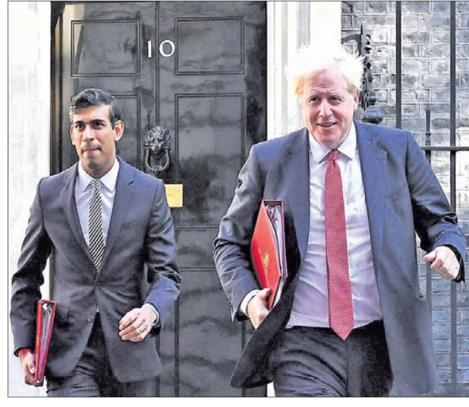
ପୂର୍ବନ ପ୍ରଧାନମନ୍ତ୍ରୀ ବୋରିସ୍ ଜନ୍ସନ୍ସନ ସହ।

ରଷି ସୁନକ ବ୍ରିଟେନ ପ୍ରଧାନମନ୍ତ୍ରୀ ହେବା ପରେ ବୈଶ୍ୱିକ ସମସ୍ୟାଗୁଡ଼ିକର ସମାଧାନ ଓ ରୋଡ୍ମାପ୍ ୨୦୩୦କୁ କାର୍ଯ୍ୟକାରୀ କରାଯିବ ନେଇ ସୁଁ ଆଶାବାଦୀ। ଆମ ଐତିହାସିକ ସମ୍ପର୍କ ଏକ ଆଧୁନିକ ସହଭାଗିତାରେ ପରିବର୍ତ୍ତିତ କରିବା ଦିଗରେ ଅଗ୍ରସର ହେଉଥିବାବେଳେ ବ୍ରିଟିଶ ଭାରତୀୟମାନଙ୍କ ଜୀବନ ସେହି ରଷିଙ୍କୁ ଦୀପାବଳୀର ଶୁଭେଚ୍ଛା। ବ୍ରିଟେନ ପ୍ରଧାନମନ୍ତ୍ରୀ ହୋଇଥିବା ରଷି ସୁନକଙ୍କୁ ଅଭିନନ୍ଦନ। ୟୁକ୍ରେନ୍ ଦୁର୍ଘ ସମର୍ଥନ ସହ ବୈଶ୍ୱିକ ସୁରକ୍ଷା ଓ ସମୃଦ୍ଧି କ୍ଷେତ୍ରରେ ଦ୍ୱିପାକ୍ଷିକ ସହଯୋଗ ବୃଦ୍ଧି ସକାଶେ ଆଶାବାଦୀ। ବ୍ରିଟିଶ ସମାଜ ତଥା ସାରା ବିଶ୍ୱ ଆଗରେ