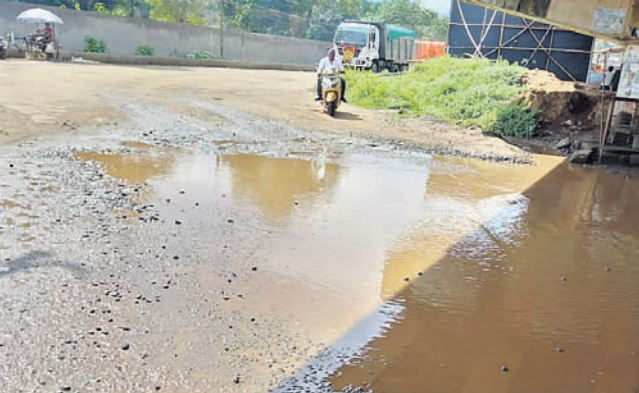
କଟଣା, ୨୫.୧୦ (ଡି.ଏନ୍.ଏ.)