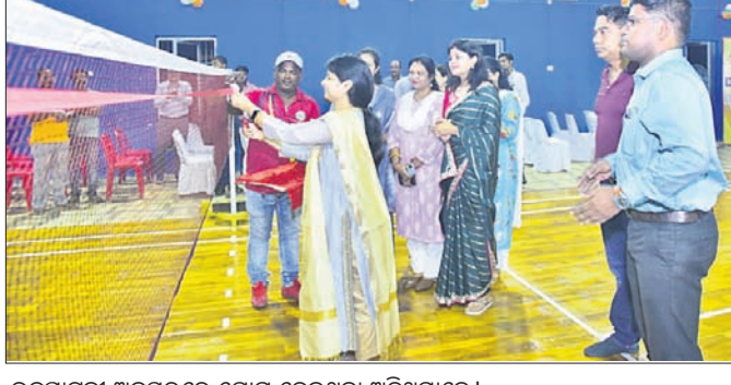
ଉଦ୍‌ଘାଟନା ଅବସରରେ ଯୋଗ ଦେଇଥିବା ଅତିଥିମାନେ।