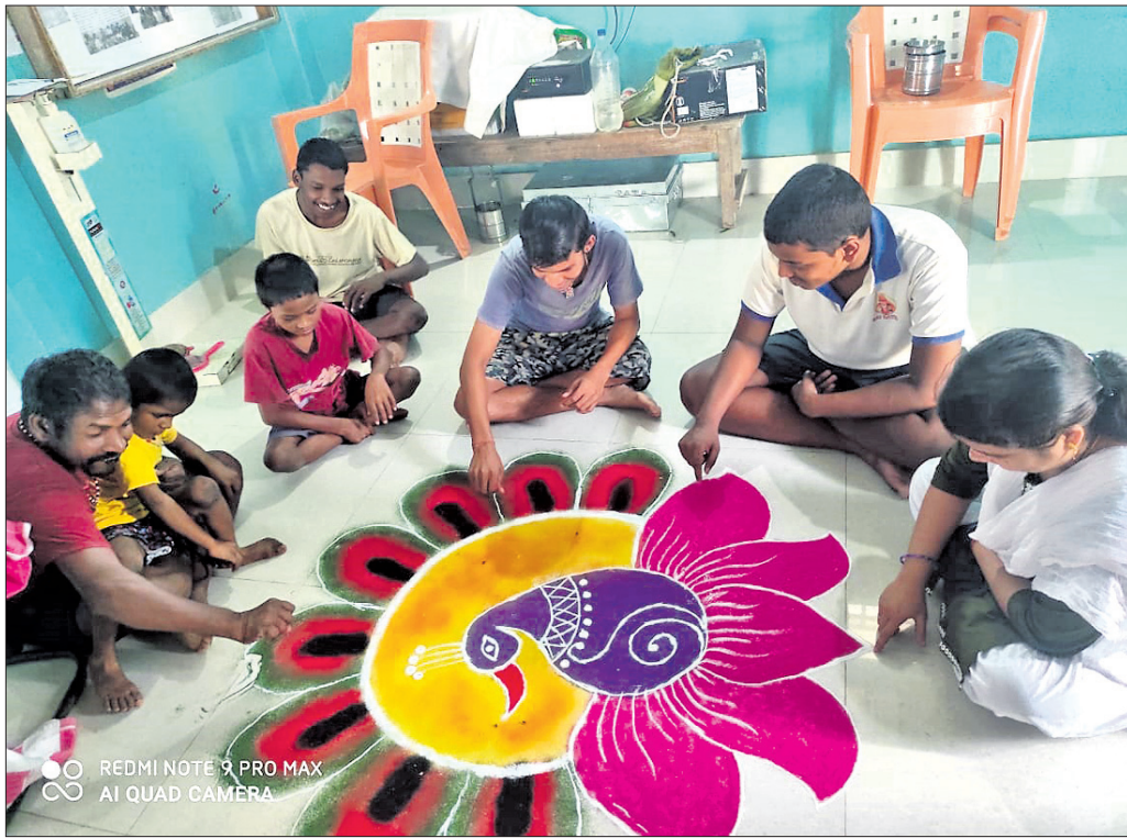
କଟାସ ବ୍ଲକ୍ ଦୟାବିହାରରେ ଥିବା ପୂର୍ଣ୍ଣବୟସିକ ସେବା କେନ୍ଦ୍ରରେ ଦିବ୍ୟାଙ୍ଗ ପିଲାମାନେ ରଙ୍ଗୋଲି ପକାଇ ଦୀପାବଳି ଉତ୍ସବ ମନାଉଛନ୍ତି।