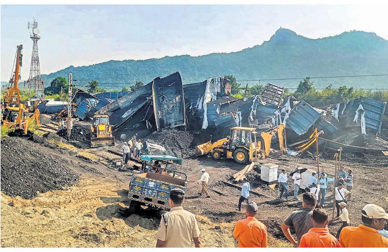
ବିହାରର ଗୟା ଜିଲ୍ଲା ଝାଡ଼ଖଣ୍ଡ ସୀମାକୁ ଗୁରୁତ୍ୱ ଦେଇ ରେଳଲାଇନ୍ ନିର୍ମାଣର ଏକ ମାଲବାହୀ ଟ୍ରେନ ରୁଧିବାର ସମ୍ପର୍କରେ ଦୁର୍ଘଟଣାଗ୍ରସ୍ତ ହୋଇଛି। ଫଳରେ ଏହାର କୋଇଲା ବୋହେଇ ୫୫ ଡବା କ୍ଷତିଗ୍ରସ୍ତ ହୋଇଛି। ଦୁର୍ଘଟଣା ଏତେ ଭୟାନକ ଥିଲା ଯେ, ଡବାଗୁଡ଼ିକ ପରସ୍ପର ସହ ଧକ୍କା ହେବାର ପ୍ରକୃତ ସ୍ୱରୂପ ଅନେକ କଲୋମିଟର ପର୍ଯ୍ୟନ୍ତ ଶୁଣାଯାଇଥିଲା। ଦୁର୍ଘଟଣା ପରେ ସମସ୍ତ ରୁଟ୍‌ରେ ଟ୍ରେନ୍ ବନ୍ଦ ହୋଇଯାଇଛି। ଟ୍ରାକ୍‌ରୁ ଅବରୋଧ ହଟାଇବା ପାଇଁ ରେଲୱେ ଓ ଅଗ୍ନିଶମ କର୍ମଚାରୀ ଉଦ୍ୟମ କରି ରଖିଛନ୍ତି।

ଧୂଳିଆ, ୨୬ ଅକ୍ଟୋବର: ବିଚାରରେ ବିଳମ୍ବ ହେବା ନେଇ ଜଣେ ବ୍ୟକ୍ତି କେରଳ ହାଇକୋର୍ଟ ବିଲ୍ଡିଂରୁ ଡେଇଁ ଆତ୍ମହତ୍ୟା ଉଦ୍ୟମ କରିଛନ୍ତି। ଦୁର୍ଘଟଣା ଘଟିବା ପୂର୍ବରୁ ସୁରକ୍ଷାକର୍ମୀ ଉକ୍ତ ବ୍ୟକ୍ତିଙ୍କୁ କାନ୍ଦୁ କରି ନେଇଥିଲେ। ବିଚାରର ମନୁ ହାଇକୋର୍ଟର ସମ୍ପ୍ରମ ମହଲାର ବାଲକୋନି ରେଲିଂରେ ବସିଥିବା ସୁରକ୍ଷାକର୍ମୀ ଦେଖୁଥିଲେ, ଯାହାପରେ ସେମାନେ ପଛପଟୁ ଯାଇ ତାଙ୍କୁ ଧରି ନେଇଥିଲେ। ଉଦ୍ଧାର ପରେ ମନୁଙ୍କୁ ପୋଲିସ୍ ଜିମା ଦିଆଯାଇଛି। ପୂର୍ବତନ ସ୍ତ୍ରୀଙ୍କ ଚଳିବା ବାବଦକୁ ଟଙ୍କା ଦେବା ଲାଗି ଉତ୍ତରାଧିକାରୀ ଏକ ସଂଘୀନି କୋର୍ଟ ମନୁ ଆଣ୍ଡୋନିକୁ ରାୟ ଶୁଣାଇଥିଲେ। କୋର୍ଟ ନିର୍ଦ୍ଦେଶକୁ ମନୁ ହାଇକୋର୍ଟରେ ଚ୍ୟାଲେଞ୍ଜ କରିଥିଲେ। ତେବେ ମାନବ ଶକ୍ତି ଶୁଣାଣିରେ ବିଳମ୍ବ ହେବା କାରଣରୁ ସେ ମାନସିକ ଭାରସାମ୍ୟ ହରାଇ ଆତ୍ମହତ୍ୟା ଉଦ୍ୟମ କରିଥିବା ଜଣାପଡ଼ିଛି।