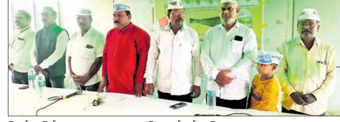
ତିର୍ତ୍ତୋଲ ନିର୍ବାଚନ ମଣ୍ଡଳୀସ୍ତରୀୟ ଏଏପି କର୍ମକର୍ତ୍ତା ସମ୍ମିଳନୀରେ ରାଜନେତାମାନେ ।