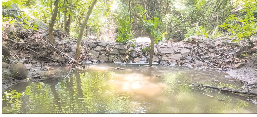
ନିର୍ମାଣ ହୋଇଥିବା ପଥରବନ୍ଧ।