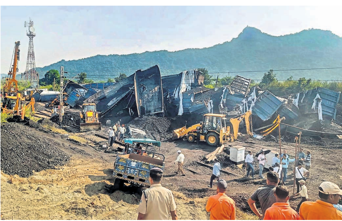
ବିହାରର ଗଢା ଜିଲ୍ଲା ଝାଡ଼ଖଣ୍ଡ ସୀମାକୁ ଗୁରୁତ୍ୱ ଦେଇ ରେଳଲାଇନ୍ ନିର୍ମାଣର ଏକ ମାଲବାହୀ ଟ୍ରେନ ରୁଧିରୀ ସମ୍ପର୍କରେ ଦୁର୍ଘଟଣାଗ୍ରସ୍ତ ହୋଇଛି। ଫଳରେ ଏହାର କୋଇଲା ବୋହେଇ ୫୫ ଡବା କ୍ଷତିଗ୍ରସ୍ତ ହୋଇଛି। ଦୁର୍ଘଟଣା ଏତେ ଭୟଙ୍କର ଥିଲା ଯେ, ଡବାଗୁଡ଼ିକ ପରସ୍ପର ସହ ଧକ୍କା ହେବାର ପ୍ରକୃତ ସ୍ୱଭାବ ଅନେକ କିଲୋମିଟର ପର୍ଯ୍ୟନ୍ତ ଶୁଣାଯାଇଥିଲା। ଦୁର୍ଘଟଣା ପରେ ସମସ୍ତ ରୁଟ୍‌ରେ ଟ୍ରେନ୍ ବନ୍ଦ ହୋଇଯାଇଛି। ଟ୍ରାକ୍‌ରୁ ଅବରୋଧ ହଟାଇବା ପାଇଁ ରେଲୱେ ଓ ଅଗ୍ନିଶମ କର୍ମଚାରୀ ଉଦ୍ୟମ କରି ରଖିଛନ୍ତି।

କୋର୍ଟ ଛାତରୁ ଡେଇଁଲେ ଯୁବକ ଥୁରୁଭାନପୁର, ୨୬/୧୦: ବିଚାରରେ ବିଳମ୍ବ ହେବା ନେଇ ଜଣେ ବ୍ୟକ୍ତି କେରଳ ହାଇକୋର୍ଟ ବିଲ୍‌କୁ ଡେଇଁ ଆତ୍ମହତ୍ୟା ଉଦ୍ୟମ କରିଛନ୍ତି। ଦୁର୍ଘଟଣା ଘଟିବା ପୂର୍ବରୁ ସୁରକ୍ଷାକର୍ମୀ ଉକ୍ତ ବ୍ୟକ୍ତିଙ୍କୁ କାଟୁ କରି ନେଇଥିଲେ। ବିଚାରର ମନୁ ହାଇକୋର୍ଟର ସପ୍ତମ ମହଲା ବାଲକୋନି ରେଲିଂରେ ବସିଥିବା ସୁରକ୍ଷାକର୍ମୀ ଦେଖିଥିଲେ, ଯାହାପରେ ସେମାନେ ପଛପଟୁ ଯାଇ ତାଙ୍କୁ ଧରି ନେଇଥିଲେ। ଉଦ୍ଧାର ପରେ ମନୁଙ୍କୁ ପୋଲିସ୍ ଜିମା ଦିଆଯାଇଛି। ପୂର୍ବତନ ସ୍ତ୍ରୀଙ୍କ ଚଳିବା ବାବଦକୁ ଟଙ୍କା ଦେବା ଲାଗି ଉଚ୍ଚମାନ୍ୟତାରେ ଏକ ସଂପାଦିତ କୋର୍ଟ ମନୁ ଆନ୍ଦୋଳନକୁ ରାୟ ଶୁଣାଇଥିଲେ। କୋର୍ଟ ନିର୍ଦ୍ଦେଶକୁ ମନୁ ହାଇକୋର୍ଟରେ ଚ୍ୟାଲେଞ୍ଜ କରିଥିଲେ। ତେବେ ମାମଲାର ଶୁଣାଣିରେ ବିଳମ୍ବ ହେବା କାରଣରୁ ସେ ମାନସିକ ଭାରସାମ୍ୟ ହରାଇ ଆତ୍ମହତ୍ୟା ଉଦ୍ୟମ କରିଥିବା ଜଣାପଡ଼ିଛି।