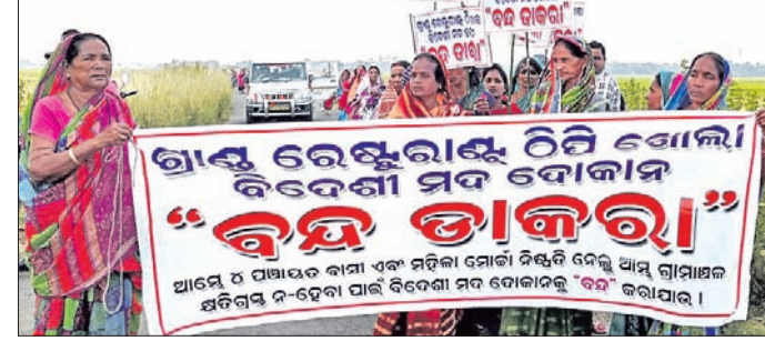
ମଦ ଦୋକାନ ନ ଖୋଲିବା ଲାଗି ମହିଳାମାନେ ଶୋଭାଯାତ୍ରାରେ ଯାଉଛନ୍ତି ।