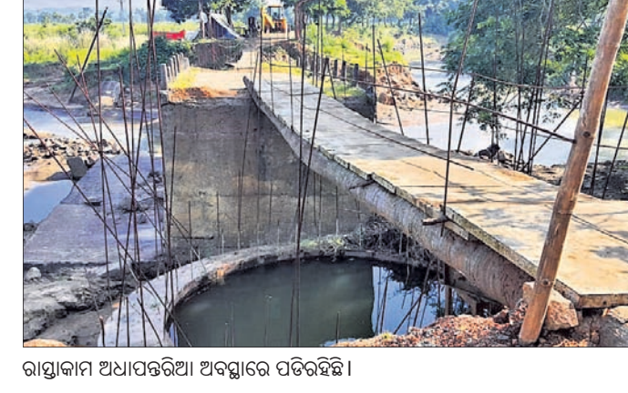
ରାସ୍ତାକାମ ଅଧାପଡ଼ିଆ ଅବସ୍ଥାରେ ପଡ଼ିଛନ୍ତି ।

ଗ୍ରାମ୍ୟ ଉନ୍ନୟନ ବିଭାଗର କାର୍ଯ୍ୟ କଳାପରେ ସାଧାରଣ ଲୋକେ ଅତିଷ୍ଠ ହୋଇ ପଡ଼ିଲେଣି । ସରକାରଙ୍କ ଅନୁଦାନରେ ଗ୍ରାମ୍ୟ ଉନ୍ନୟନ ବିଭାଗ ଦ୍ୱାରା କେଉଁଟି ନିମ୍ନମାନର କାମ ହେଲା ତ ଆଉ କେଉଁଟି କାର୍ଯ୍ୟାବେଶ ପାଇଲା ପରେ କାର୍ଯ୍ୟାବେଶ ହେଉନି । ପୁଣି ଆଉ କେଉଁଟି ଅଧାପଡ଼ିଆ କାର୍ଯ୍ୟ କରିବା ଫଳରେ ଲୋକମାନେ ନାହିଁ ନ ଥିବା ଅନୁଭବ କରୁଛନ୍ତି । କାମ ସରିବା ପରେ ୫ ବର୍ଷ ପର୍ଯ୍ୟନ୍ତ ରକ୍ଷଣାବେକ୍ଷଣ କରିବାର ସରକାରୀ ନିର୍ଦ୍ଦେଶ ରହିଥିଲେ ମଧ୍ୟ ସେଥିପ୍ରତି ବିଭାଗୀୟ ଅଧିକାରୀ ଦୃଷ୍ଟି ହେଉ ନାହିଁ । ମୋଟାମୋଟି ଭାବେ ନୟାଗଡ଼ ଜିଲ୍ଲା ନୂଆଗାଁ ବ୍ଲକ୍ରେ ଆରତି ବିଭାଗ ଏକ ପ୍ରକାର ମନପୁଣ୍ଡା କାର୍ଯ୍ୟ କରୁଥିବା ଅଭିଯୋଗ ହେଉଛି । ଖୋର୍ଦ୍ଧା-ବଲାଙ୍ଗୀର ୫୭ନଂ. ଛାତ୍ରୀୟ ରାଜପଥଠାରୁ ଗୌଡ଼ବାବେଶପାଳି