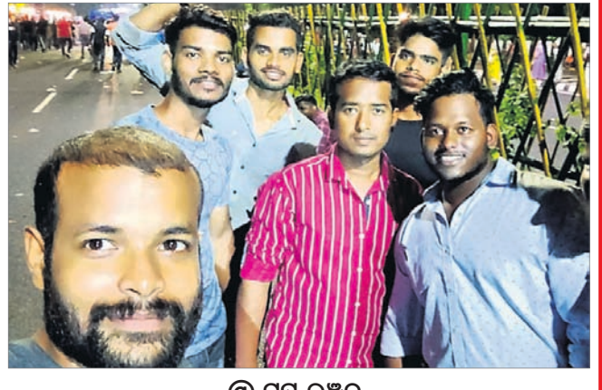
@ ଗୁପ୍ତ ରଞ୍ଜନ