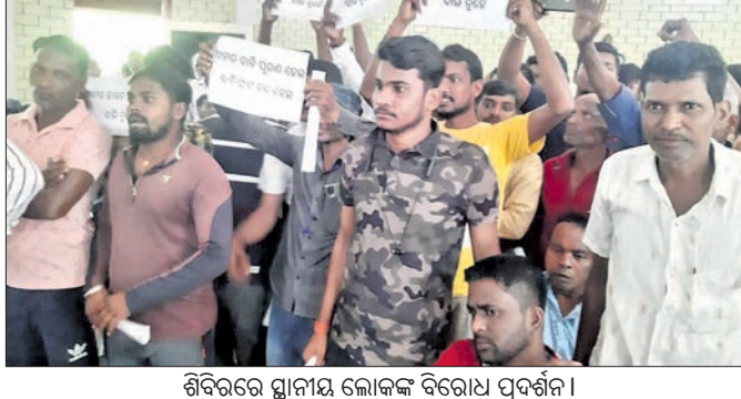
ଶିବିରରେ ସ୍ଥାନୀୟ ଲୋକଙ୍କ ବିରୋଧ ପ୍ରଦର୍ଶନ।

ଦିଆଯାଇଥିଲା। କମିଟି କାର୍ଯ୍ୟକାରୀ କରିବା, ପଞ୍ଚାୟତସ୍ତରୀୟ ଚାକ୍ଷୁର୍ଯ୍ୟ ମାତୃ ସମ୍ପର୍କ କେତେକ ରୁଜୁପୁସ୍ତକ ପ୍ରସଙ୍ଗ ଉପରେ ଆଲୋଚନା କରିଥିଲେ। କର୍ମଶାଳାରେ ବିଭିନ୍ନ ପଞ୍ଚାୟତର ସରପଞ୍ଚମାନେ ଯୋଗଦେଇ ସେମାନଙ୍କ ପଞ୍ଚାୟତରେ ଶିଶୁଙ୍କୁ ନେଇ ରହିଥିବା ସମସ୍ୟା ସମ୍ପର୍କରେ ଆଲୋଚନା କରିଥିଲେ। ପ୍ରତ୍ୟେକ ଗ୍ରାମ ପଞ୍ଚାୟତରେ ପଞ୍ଚାୟତସ୍ତରୀୟ ଶିଶୁ ସୁରକ୍ଷା କମିଟି ଗଠନ କରିବା ପାଇଁ ପ୍ରସ୍ତାବ