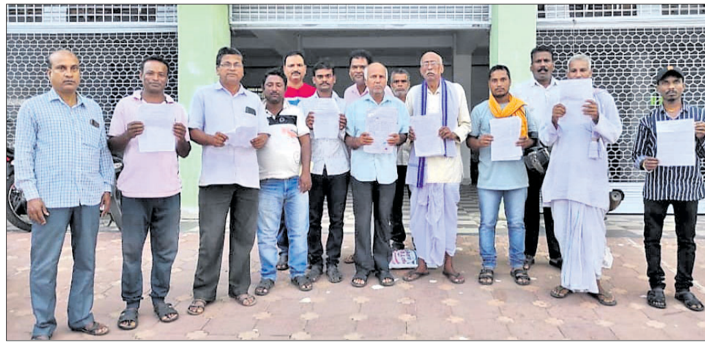
ଜିଲ୍ଲାପାଳଙ୍କୁ ଅଭିଯୋଗ କରିଥିବା ଚାଷୀମାନେ।

ଲଗାଣ ବର୍ଷା ହେଉଛି ବନ୍ୟା, ପ୍ରତିବର୍ଷ ଚାଷ ଧୋଇଯାଉଛି। ଫସଲରେ ଧାରକରକ କରି ଲକ୍ଷାଧିକ ଟଙ୍କା ଖର୍ଚ୍ଚ କରିଥିବା ଚାଷୀ ହତାଶ ହେଉଛନ୍ତି। ମାତ୍ର ଫସଲ ବୀମା କ୍ଷତିପୂରଣ ଚାଷୀଙ୍କୁ ବୀମା ଟଙ୍କା ମିଳୁନାହିଁ। ବିଜ୍ଞାନପୁର ବୁକ୍ ଅଞ୍ଚଳରେ ପ୍ରଧାନମନ୍ତ୍ରୀ ଫସଲ ବୀମା ଯୋଜନାରେ ବ୍ୟାପକ ଦୁର୍ନୀତି ହୋଇଥିବା ଚାଷୀ କହୁଥିଲେ ମଧ୍ୟ ତାଙ୍କ ରୁହାରି କେହି ଶୁଣୁ ନ ଥିବା ଅଭିଯୋଗ ହୋଇଛି। ଫସଲ ସାଇ ପାଇଁ ପ୍ରଶାସନ ସହାୟତା ପ୍ରଦାନ କରିଛି। ଲଗାଣ ବର୍ଷାରେ କ୍ଷତି ହୋଇଥିବା ରାସ୍ତା ପାଇଁ ସରକାରଙ୍କ ପକ୍ଷରୁ ଏଫଡିଆର୍ ଯୋଜନାରେ କୋଟିକୋଟି ଟଙ୍କା ଖର୍ଚ୍ଚ କରାଯାଇ ବିଭିନ୍ନ ପଞ୍ଚାୟତର ରାସ୍ତା ନିର୍ମାଣ ହୋଇଛି। ହେଲେ ବୀମା କମ୍ପାନୀ ଚାଷୀଙ୍କୁ ଅର୍ଥ ନ ଦେବା ପାଇଁ ମିଥ୍ୟା ରିପୋର୍ଟ ପ୍ରଦାନ କରି ଚାଷୀଙ୍କୁ ଫାକ୍ତା, ଯଦ୍ୱାରା ଚାଷୀଙ୍କ ଲକ୍ଷ୍ମଣସ୍ତ ବୀମା ଟଙ୍କା ଦୁର୍ନୀତି ହୋଇଛି। ଏ ନେଇ ବିଜ୍ଞାନପୁର ବୁକ୍ ଅଞ୍ଚଳ ପଞ୍ଚାୟତର ଚାଷୀମାନେ ଯାଜପୁର ଜିଲ୍ଲାପାଳଙ୍କ ନିକଟରେ ଅଭିଯୋଗ କରିଥିଲେ ମଧ୍ୟ ତାଙ୍କ ରୁହାରି ପ୍ରଶାସନ ଶୁଣୁ ନ ଥିବା ସେମାନେ କହିଛନ୍ତି।