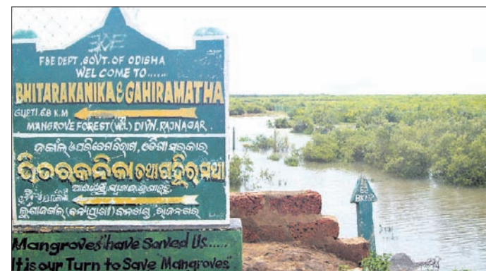
ଭିତରକନିକା ଓ ଗହୀରମଥୀ ବନଖଣ୍ଡ ରାଜନଗର ଫଳକ ଲଗାଯାଇଛି ।

ସମୁଦ୍ର ମଧ୍ୟରେ ମାଛ ହାଟ ହେଉଛି । ଚଳର ମାଲିକମାନେ ସେଠାରୁ ମାଛ ନେଇ ଯାଉଛନ୍ତି । ଗହୀରମଥୀରେ ମାଛ ମାରିବା କଟକଣା ସମୟରେ ସେଠାକୁ ଅବାଧି ପ୍ରବେଶ ଚାଲିଛି । ବନ କର୍ମଚାରୀ ଏଥିପାଇଁ ୮୦ ଲକ୍ଷ ଟଙ୍କା ବାଲେଶ୍ୱର ଜିଲ୍ଲାର ଚଳରମାଲିକଙ୍କ ସହ ଡିଲ୍ କରିଛନ୍ତି । କେନ୍ଦ୍ରାପଡ଼ା ଓ କରାଦସିଂହପୁର ଜିଲ୍ଲାର କେତେଜଣ ମତ୍ସ୍ୟକାରୀ ଏପ୍ରକାର ଅଭିଯୋଗ ଆଣିଛନ୍ତି । ଯାହାଫଳରେ ଅଲିଭା ରିଭଲେକ ଆଗମନ ହୁଏ ପାଇବା ସହ ଗହୀରମଥୀରେ ନିଷିଦ୍ଧାଞ୍ଚଳ କଟକଣା ନାମକୁ ମାତ୍ର ବୋଲି ସେମାନେ ଶୋଭା ପ୍ରକାଶ କରିଛନ୍ତି । କେନ୍ଦ୍ରାପଡ଼ା ଜିଲ୍ଲା ରାଜନଗର