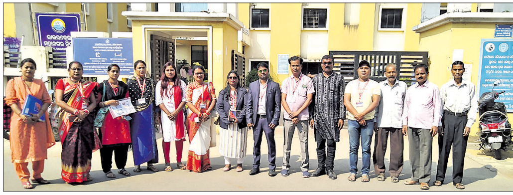
ଆରବମ୍ବି କାର୍ଯ୍ୟାଳୟ ସମ୍ମୁଖରେ ସମ୍ମାନ କର୍ମକର୍ତ୍ତାଙ୍କୁ।

ସହକର୍ତ୍ତା ସୁପରିଣ୍ଡେଣ୍ଡିଣ୍ଟ ଗୋ-ମାଡାକ ମୁଖ୍ୟମନ୍ତ୍ରୀ ରୋକିବା ପାଇଁ ଗୋରକ୍ଷକ ନିୟୁକ୍ତି ନିମନ୍ତେ ଅନ୍ତର୍ଜାତୀୟ ମାନବ ଅଧିକାର ରକ୍ଷକ (ଆଇଏଚ୍ଆରଡି) ପକ୍ଷରୁ ଗୁରୁବାର ଆରବମ୍ବି କମିଶନର ତଥା ରାଉରକେଲା ଅତିରିକ୍ତ ଜିଲାପାଳଙ୍କୁ ଏକ ସ୍ମାରକପତ୍ର ପ୍ରଦାନ କରାଯାଇଛି।