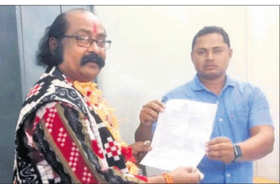
କଂସ ଚୟନ ପାଇଁ ଆବେଦନ ପତ୍ର ଦାଖଲ କରୁଛନ୍ତି ।