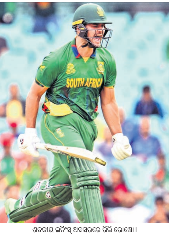
ଶତକୀୟ ଭବିଷ୍ୟ ଅବସରରେ ରିଲି ରୋଷୋ।

ମ୍ୟାଚ୍ ଫେରିଥିବା ବେଳେ ଦ୍ୱିତୀୟ ମ୍ୟାଚରେ ଯୋଗ ଦେଇଛନ୍ତି ଓଡ଼ିଶା ପୁଣ୍ୟମନ୍ତ୍ରୀ ନବୀନ ପଟ୍ଟନାୟକ। ଓଡ଼ିଶା ଏଫସି(ଓଏଫସି) ଓ ବେଙ୍ଗାଲୁରୁ ଏଫସି (ବିଏସସି) ମଧ୍ୟରେ ଖେଳା ଯାଇଥିବା ମ୍ୟାଚରେ ଯୋଗ ଦେଇଥିଲେ ପୁଣ୍ୟମନ୍ତ୍ରୀ। ଏହା ସହିତ ୫ଟି ସଚିବ ଭି. କେ. ପାଣ୍ଡିଆନ୍ ମଧ୍ୟ ଉଦ୍‌ଘାଟନା ସମାରୋହରେ ଯୋଗ ଦେଇଥିଲେ। ଉଭୟ ଖେଳାଳିଙ୍କ ସହିତ ପରିଚିତ ଗାନ କରାଯାଇଥିଲା। ଏହା ସହିତ ଗୁରୁବାର ସନ୍ଧ୍ୟାରେ ଆକର୍ଷଣ ରହିଥିଲେ ଭାରତୀୟ ଦଳର ଅଧିନାୟକ ସୁନାଲ ଛେଟ୍ରୀ। ବିଏସସିର ଅଧିନାୟକ ରହିଥିବା ଛେଟ୍ରୀଙ୍କୁ ଦେଖିବା ପାଇଁ ଷ୍ଟାଡ଼ିୟମର ଲକ୍ଷ ଲକ୍ଷ ଦର୍ଶକଙ୍କୁ ଭରପୂର ହୋଇଯାଇଥିଲା। କିଏ/କିଏ ଷ୍ଟୁଲର ବସୁ ସଂଖ୍ୟାରେ ଛାତ୍ରୀ ଛାତ୍ର ମଧ୍ୟ ବିପୁଳ ସଂଖ୍ୟାରେ ଯୋଗ ଦେଇ ମ୍ୟାଚର ମଜା ନେଇଥିଲେ। ଓଏଫସି ଦଳକୁ ଉତ୍ସାହିତ କରିବା ଲାଗି ଓଡ଼ିଶା-ଓଡ଼ିଶା ନାରୀରେ ଷ୍ଟାଡ଼ିୟମ ପ୍ରକଳ୍ପିତ ହୋଇଥିଲା।