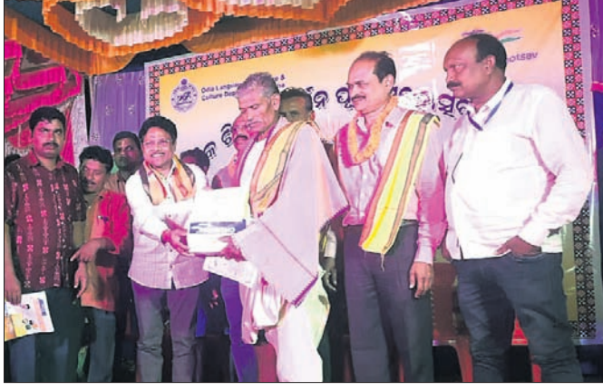
ଚାଷୀ କଚେରୀ ପଧାନଙ୍କୁ ମୁଖ୍ୟ ଅତିଥି ସମ୍ବର୍ଦ୍ଧିତ କରୁଛନ୍ତି ।