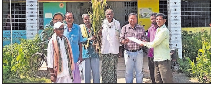
ବ୍ଲକ କୃଷି ଅଧିକାରୀଙ୍କୁ ଦାବିପତ୍ର ପ୍ରଦାନ କରାଯାଇଛି ।

କୌଣସି ପଦକ୍ଷେପ ଗ୍ରହଣ କରି ନ ଥିବା ଆୟୋଜନକାରୀ ଅଭିଯୋଗ କରିଛନ୍ତି । ଏହା ସହ ସହରରେ ଅସୁବିଧି ହେବାକୁ କାର୍ଯ୍ୟକ୍ରମ ପ୍ରମୁଖ ଦାବି ଓ ଏହାର ସମାଧାନ ଦାବିରେ ଦଳ ପକ୍ଷରୁ ଗୁରୁବାର ଉପଜିଲ୍ଲାପାଳଙ୍କ କାର୍ଯ୍ୟାଳୟ ସମ୍ମୁଖରେ ପ୍ରତିବାଦ ପ୍ରଦର୍ଶନ କରାଯାଇଥିଲା । ସେଠାରେ ଅନୁଷ୍ଠିତ ପ୍ରତିବାଦ ସଭାରେ ଦଳ ପକ୍ଷରୁ କୁହାଯାଇଥିଲା ଯେ, ସହରର ମୁଖ୍ୟ ହାତପଦା ବଜାର ସ୍ଥଳରେ ନୂତନ ପିଣ୍ଡି ନିର୍ମାଣ କରାଯିବ ବୋଲି ପୌର ପରିଷଦ ଶତାଧିକ ଦୋକାନୀଙ୍କୁ ହରାଇଥିଲା । ହେଲେ ଅଦ୍ୟାବଧି ପିଣ୍ଡି ତିଆରି ହୋଇପାରିନା ନାହିଁ । ଏନେଇ ଦୋକାନୀମାନେ କର୍ମହରା ହୋଇପଡିଛନ୍ତି । ତତ୍କାଳୀନ ଭାରପ୍ରାପ୍ତ ପୌର ନିର୍ଦ୍ଦେଶ ଅଧିକାରୀ ତଥା ବର୍ତ୍ତମାନ ଉପଜିଲ୍ଲାପାଳ ମନୋଜ ସତ୍ୟାଧୀନ ମହାଜନ ଏ ଦିଗରେ