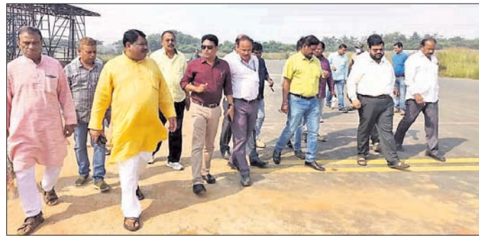
ଏମ୍ପି ଜୁଏଲ ଓରାମ ହଳି ଷ୍ଟାଡ଼ିୟମ କାର୍ଯ୍ୟ ଅନୁଧ୍ୟାନ କରୁଛନ୍ତି।