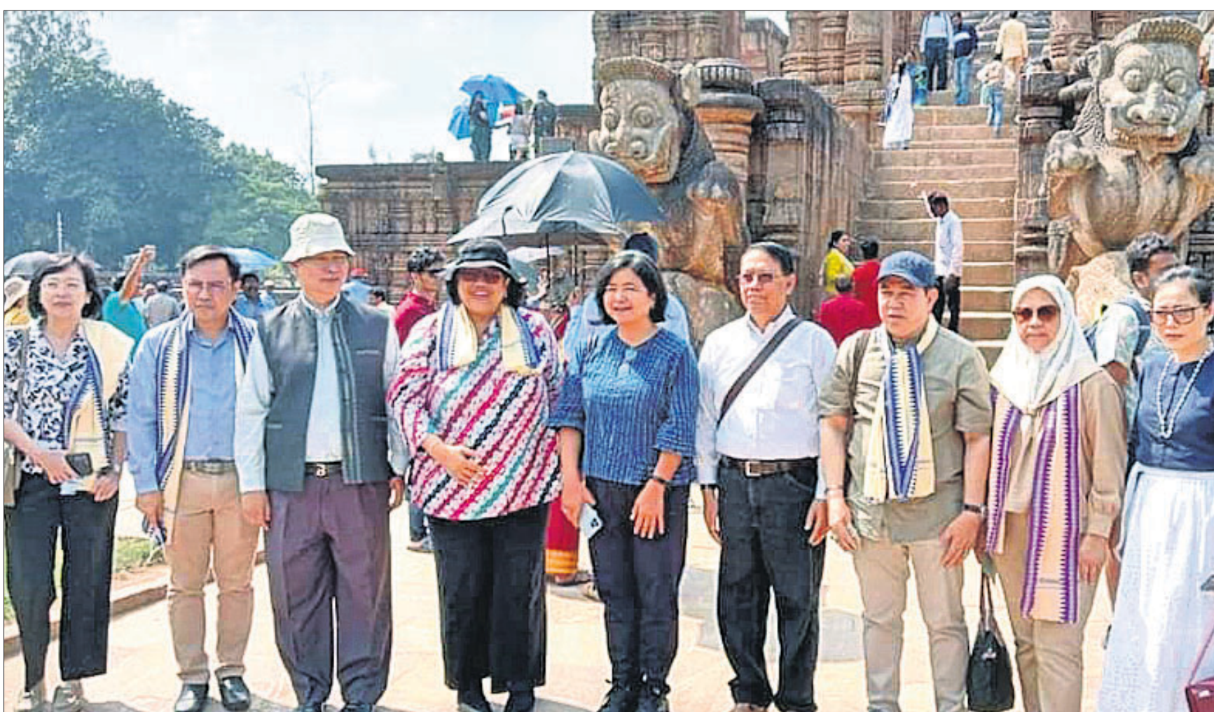
ସୂର୍ଯ୍ୟ ମନ୍ଦିର ପରିଦର୍ଶନ ଅବସରରେ ଗୁରୁବାର ଆସୋସିଏସନ ଅଫ୍ ସାଇଟ୍ ଇଣ୍ଡିଆ ନେଶନର ସଦସ୍ୟମଣ୍ଡଳୀ।