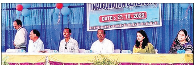
ବିନିକା ଆଦର୍ଶ ବିଦ୍ୟାଳୟ ଉଦ୍‌ଘାଟନ ଅବସରରେ ଅନୁଷ୍ଠିତ ସଭାରେ ମଞ୍ଚାସୀନ ଅତିଥି।