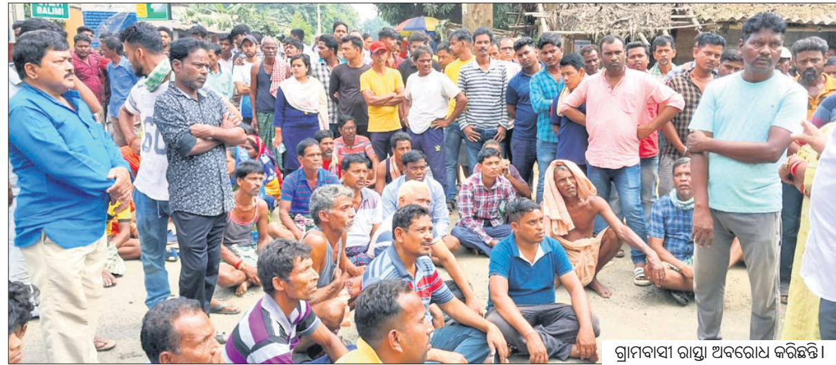
ଗ୍ରାମବାସୀ ରାସ୍ତା ଅବରୋଧ କରିଛନ୍ତି।