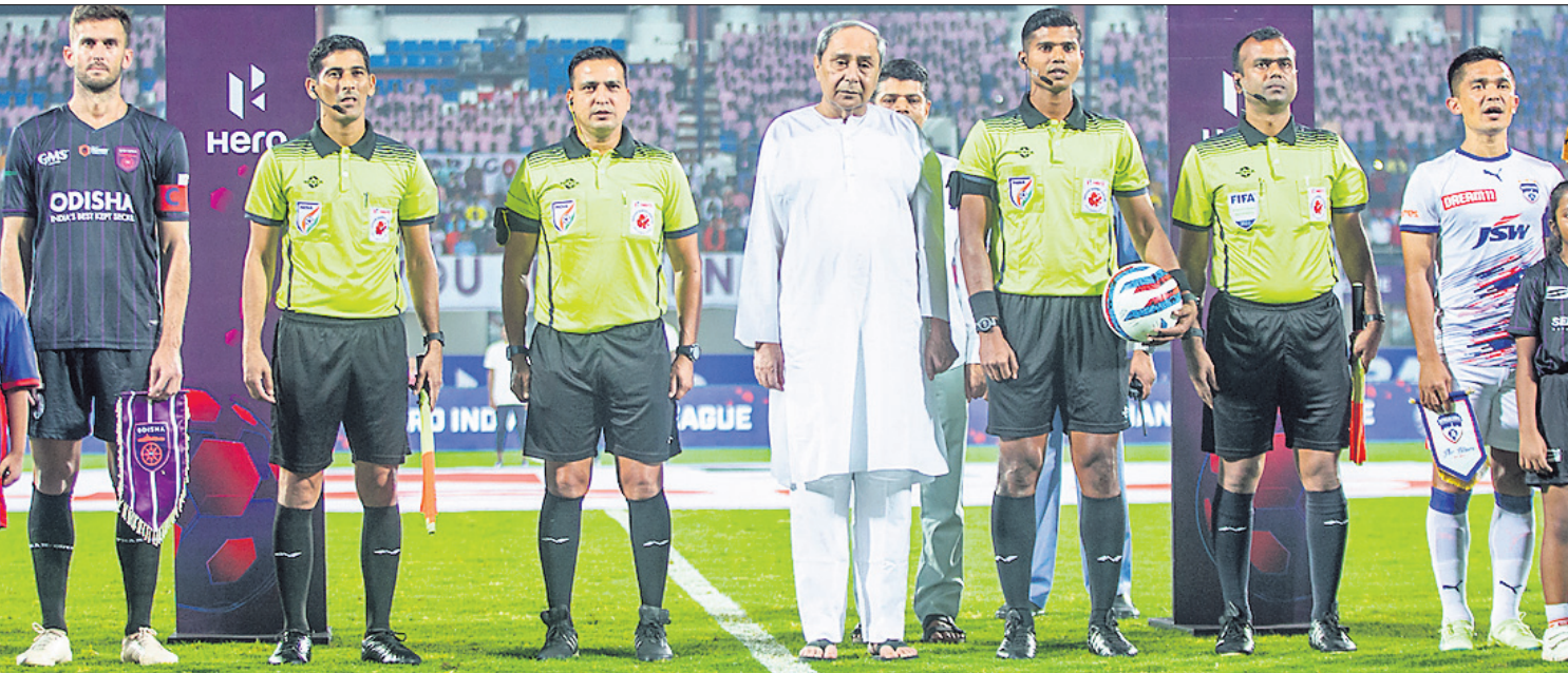
ଓଡ଼ିଶା ଏଫସି ଓ ବେଙ୍ଗାଲୁରୁ ଏଫସି ମଧ୍ୟରେ ଅନୁଷ୍ଠିତ ମ୍ୟାଚ୍ ଆରମ୍ଭ ପୂର୍ବରୁ ଜାତୀୟ ସଙ୍ଗୀତ ଗାନ ବେଳେ ଉପସ୍ଥିତ ଅଛନ୍ତି ପୁଣ୍ୟମନ୍ତ୍ରୀ ନବୀନ ପଟ୍ଟନାୟକ।