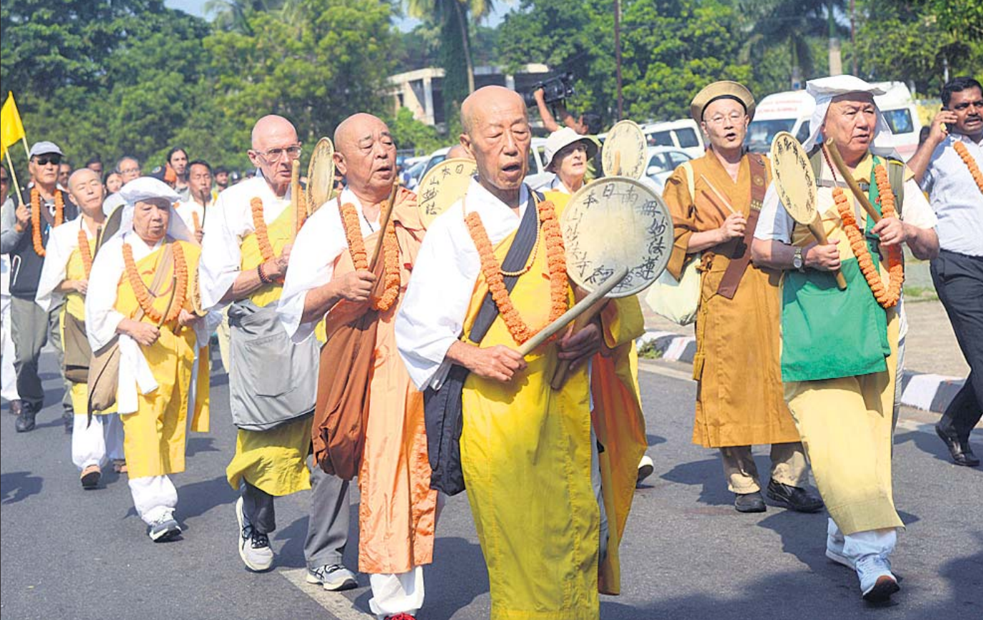
ଆଜି ଶାନ୍ତିସୂଚ ପାଠକର ସୁବର୍ଣ୍ଣ ଜୟନ୍ତୀ। ଏହି ପରିପ୍ରେକ୍ଷାରେ ଆମେରିକା, ୟୁକ୍ରେନ, କାପାନ୍ ଆଦି ଦେଶରୁ ଆସିଥିବା ବୌଦ୍ଧ ସନ୍ନ୍ୟାସୀମାନଙ୍କେ ଗୁରୁବାର ଶାନ୍ତି ପଦଯାତ୍ରାରେ ବାହାରିଛନ୍ତି।