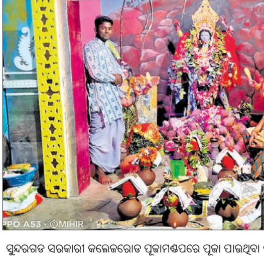
ସୁନ୍ଦରଗଡ଼ ସରକାରୀ କଲେଜରୋଡ଼ ପୂଜାମଣ୍ଡପରେ ପୂଜା ପାଉଥିବା ମା' କାଳୀ।