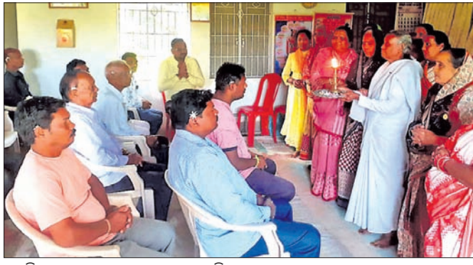
ଉପସ୍ଥିତ ଶୁଭେଚ୍ଛୁଙ୍କୁ ବନ୍ଦାପନା କରାଯାଇଛି ।