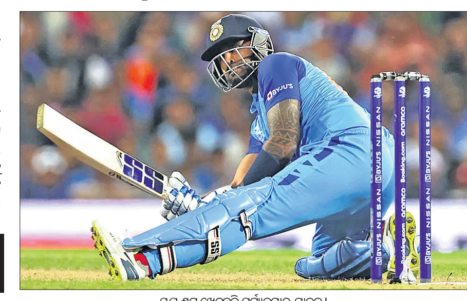
ଖୁପ୍ ଶେଢ଼ୁଛନ୍ତି ସୂର୍ଯ୍ୟକୁମାର ଯାଦବ।

ସିଡନୀ, ୨୭।୧୦ ଖାର ବ୍ୟାଟର ସୂର୍ଯ୍ୟକୁମାର ଯାଦବଙ୍କ ଧୂଆଁଧାର ବ୍ୟାଟିଂ ବଳରେ ଡି୨୦ ବିଶ୍ୱକପ୍ରେ ପ୍ରଥମ-୧୨ରେ କ୍ରମାଗତ ଦ୍ୱିତୀୟ ମ୍ୟାଚରେ ବିଜୟ ହୋଇଛି ଭାରତ। ସିଡନୀ କ୍ରିକେଟ ଗ୍ରାଉଣ୍ଡରେ ସୂର୍ଯ୍ୟକୁମାରଙ୍କ ବ୍ୟତୀତ ରୋହିତ ଶର୍ମା ଓ ବିରାଟ କୋହଲି ମଧ୍ୟ ଅର୍ଦ୍ଧଶତକ ହାସଲ କରିଥିବାବେଳେ ନେଦରଲାଣ୍ଡକୁ ୫୬ ରନରେ ପରାସ୍ତ କରିଛି ଭାରତ। ଏହା ସହିତ ଗୁପ୍ ବି'ର ପଏଣ୍ଟ ଟେବଲ ଶୀର୍ଷରେ ମଧ୍ୟ