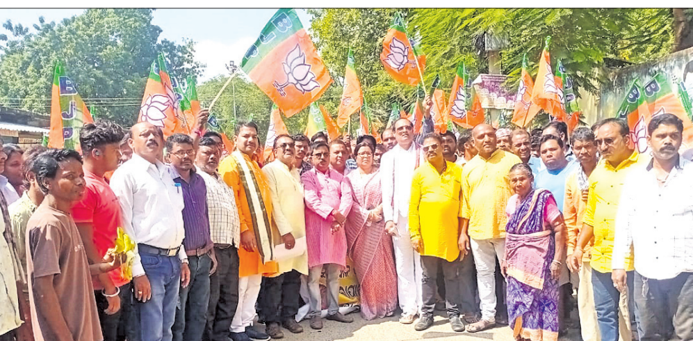
ଉପଜିଲ୍ଲାପାଳଙ୍କ କାର୍ଯ୍ୟାଳୟ ସମ୍ମୁଖରେ ବିକ୍ଷୋଭରତ୍ନ ଭାଜପା କର୍ମୀ ଓ ନେତା ।