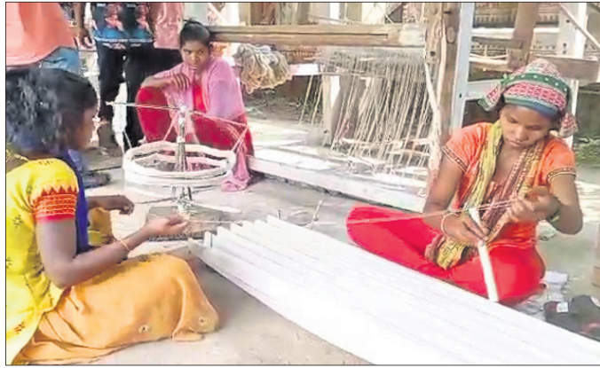
ତଙ୍ଗରିଆ ଯୁବତୀମାନେ କପଡ଼ାଗୁନ୍ଦା ତିଆରି ତାଲିମ ନେଉଛନ୍ତି ।

ନିୟମିତ ପାଦଦେଶରେ ଅବସ୍ଥିତ ଆଦିମ ଜନଜାତି ତଙ୍ଗରିଆ କନ୍ଧଙ୍କ ହାତ ତିଆରି ସାଲ(କପଡ଼ାଗୁନ୍ଦା) ଧୀରେ ଧୀରେ ଲୋକ ପାଇବାକୁ ବସିଥିବାବେଳେ ଏହାର ପୁନରୁଦ୍ଧାର ପଇଁ ପ୍ରୟାସ ଆରମ୍ଭ ହୋଇଛି।