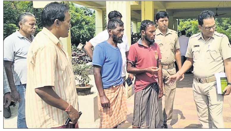
ଉଦ୍ଧାର ହୋଇଥିବା ବାଂଲାଦେଶୀ ଧୀବର ।

ପାରାଦୀପ, ୨୮.୧୦(ସ.ପ୍ର.) ବୋର୍ଡ଼ ଚୁକ୍ତିନାମା ପରଠାରୁ ୪ ଦିନ ହେବ ସମୁଦ୍ର ମଝିରେ ଅତଳ ଗଭୀରରେ ଥିବା ବାଂଲାଦେଶୀ ଧୀବର । ଚୁକ୍ତିନାମା ଦେବଦୂତ ସାଜି ବାଲେଶ୍ୱର ଜିଲ୍ଲାର କେତେକ ମତ୍ସ୍ୟଜୀବୀ ସେମାନଙ୍କୁ ଉଦ୍ଧାର କରି ଶୁକ୍ରବାର ପାରାଦୀପ ମାଛଧରା ବନ୍ଦର ପରିସରରେ ପହଞ୍ଚିଛନ୍ତି । ଚୁକ୍ତିନାମା ନାମକ ମାଛଧରା ବୋଟରେ ୨ ଓ ତ୍ରିଶକ୍ତି ନାମକ ବୋଟରେ ଜଣେ ଧୀବରଙ୍କୁ ଉଦ୍ଧାର କରାଯାଇଛି । ସେମାନେ ହେଲେ ମତ୍ସ୍ୟଜୀବୀ