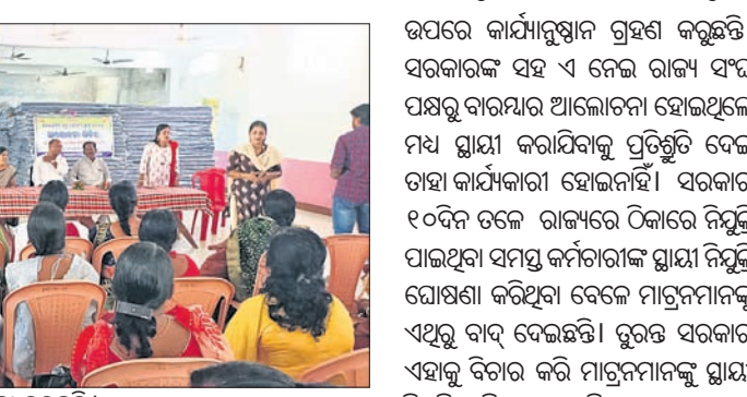
ବୈଠକରେ ଉପସ୍ଥିତ ମାଟୁନମାନେ ଆଲୋଚନା କରୁଛନ୍ତି।

ମାଲକାନଗିରି ଜିଲ୍ଲା ସଦର ମହକୁମା ମାଲ୍ୟବନ୍ତ ଛାତ୍ରାବାସ ସମିତିର ନିର୍ଦ୍ଧାରଣ କ୍ରମରେ ଜିଲ୍ଲା ମାଟୁନ ସଂଘର ଏକ ବୈଠକ ଅନୁଷ୍ଠିତ ହୋଇଛି। ମଙ୍ଗଳ ଦିନରେ ଶିକ୍ଷାନୁଷ୍ଠାନ ଗୁଡ଼ିକରେ ୨୦୦୪ରୁ ମାଟୁନ ଭାବେ କାର୍ଯ୍ୟ କରି ଆସୁଥିବା ଜିଲ୍ଲାର ୫୦୦ ଊର୍ଦ୍ଧ୍ୱ ମାଟୁନଙ୍କ ବିଭିନ୍ନ ସମସ୍ୟା ବୈଠକରେ ଆଲୋଚନା ହୋଇଥିଲା।