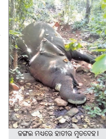
ଜଙ୍ଗଲ ମଧ୍ୟରେ ହାତୀର ମୃତଦେହ।

ଅନୁଗୋଳ ଜିଲ୍ଲା ଆଠମଲିକ ବନଖଣ୍ଡ ବାମୁର ରେଞ୍ଜ ଶାନ୍ତିପୁର ଜଙ୍ଗଲରୁ ଶୁକ୍ରବାର ଏକ ମାଛ ହାତୀର ମୃତଦେହ ବନ ବିଭାଗ ଠାବ କରିଛି। ମୃତ ହାତୀର ବୟସ ୩୦ ବର୍ଷ ହେବ ବୋଲି ବିଭାଗ ଆକଳନ କରିଥିବା ବେଳେ ମୃତ୍ୟୁର କାରଣ ସ୍ପଷ୍ଟ ହୋଇପାରି ନାହିଁ। ପ୍ରକାଶ ଯେ, ଶାନ୍ତିପୁର ଜଙ୍ଗଲରେ ଏକ ହାତୀ ମରିପଡ଼ିଥିବା କେତେଜଣ ଗାଈ ଚରାଳି ଦେଖି ବନ ବିଭାଗକୁ ଖବର ଦେଇଥିଲେ। ଖବରପାଇ ଆରୁଦିସିଏଟ୍ ଏମ୍.