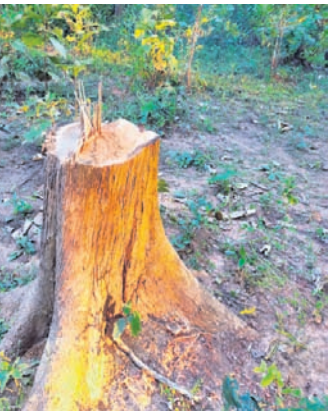
ଗଛ କାଟିବା ସମୟରେ ବନବିଭାଗ କର୍ମଚାରୀ କିପରି ଜାଣିପାରିଲେ ନାହିଁ ତାହାକୁ ନେଇ ପ୍ରଶ୍ନବାଚୀ ସୃଷ୍ଟି ହୋଇଛି।

ନବରଙ୍ଗପୁର ଜିଲ୍ଲା ଝରିଗାଁ ବ୍ଲକ୍ ଜଙ୍ଗଲ, ପାହାଡ଼ରେ ପରିପୂର୍ଣ୍ଣ ଥିଲା। ହେଲେ ବନବିଭାଗ ଅଧିକାରୀଙ୍କ ଅବହେଳା ଯୋଗୁ ଜଙ୍ଗଲରୁ ବହୁ ମୂଲ୍ୟବାନ ଗଛ ଚୋରି ହେଉଥିବା ଅଭିଯୋଗ ହୋଇଛି।