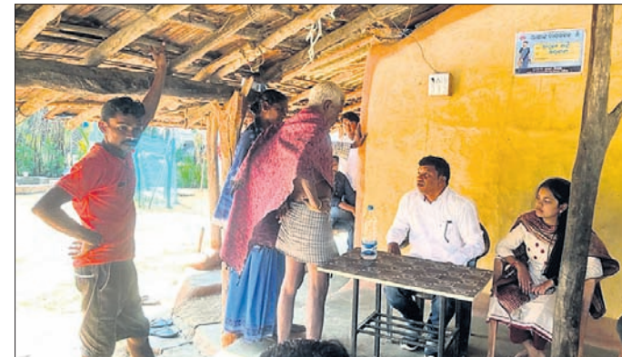
ସିଲାଇକୋଟା ଗ୍ରାମରେ ଜିଲ୍ଲା ବିକାଶ ପରିଷଦ ଅଧ୍ୟକ୍ଷ ଗ୍ରାମବାସୀଙ୍କ ସହ ଆଲୋଚନା କରୁଛନ୍ତି।

ସ୍ଥିତି ଅନୁଧ୍ୟାନ ପରେ ମେଡିକାଲ ଡିମ୍ପା ଓ ଗ୍ରାମବାସୀଙ୍କ ସହ ଆଲୋଚନା କରିଥିଲେ। ଏହି ରୋଗର ନିରାକରଣ ସମ୍ପର୍କରେ ସେ ଜିଲ୍ଲା ପୁସ୍ତକ ବିକାଶକାରୀଙ୍କ ସହ ମଧ୍ୟ ଆଲୋଚନା କରିଥିଲେ।