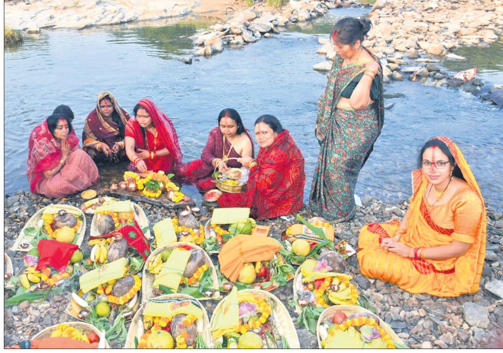
ରବିବାର ସମ୍ବଲପୁର ମହାନଦୀରେ ଭକ୍ତମାନେ ଛଟ ପୂଜା କରୁଛନ୍ତି ।