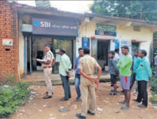
କର୍ମାତ୍ମକା, ୩୦।୧୦।୧୦ (ଡି.ଏନ.ଏ.):

ଗ୍ରାହକ ସେବା କେନ୍ଦ୍ରକୁ ଲକ୍ଷ୍ୟଭୁକ୍ତ କୋର ସାମଗ୍ରୀ ଚୋରି