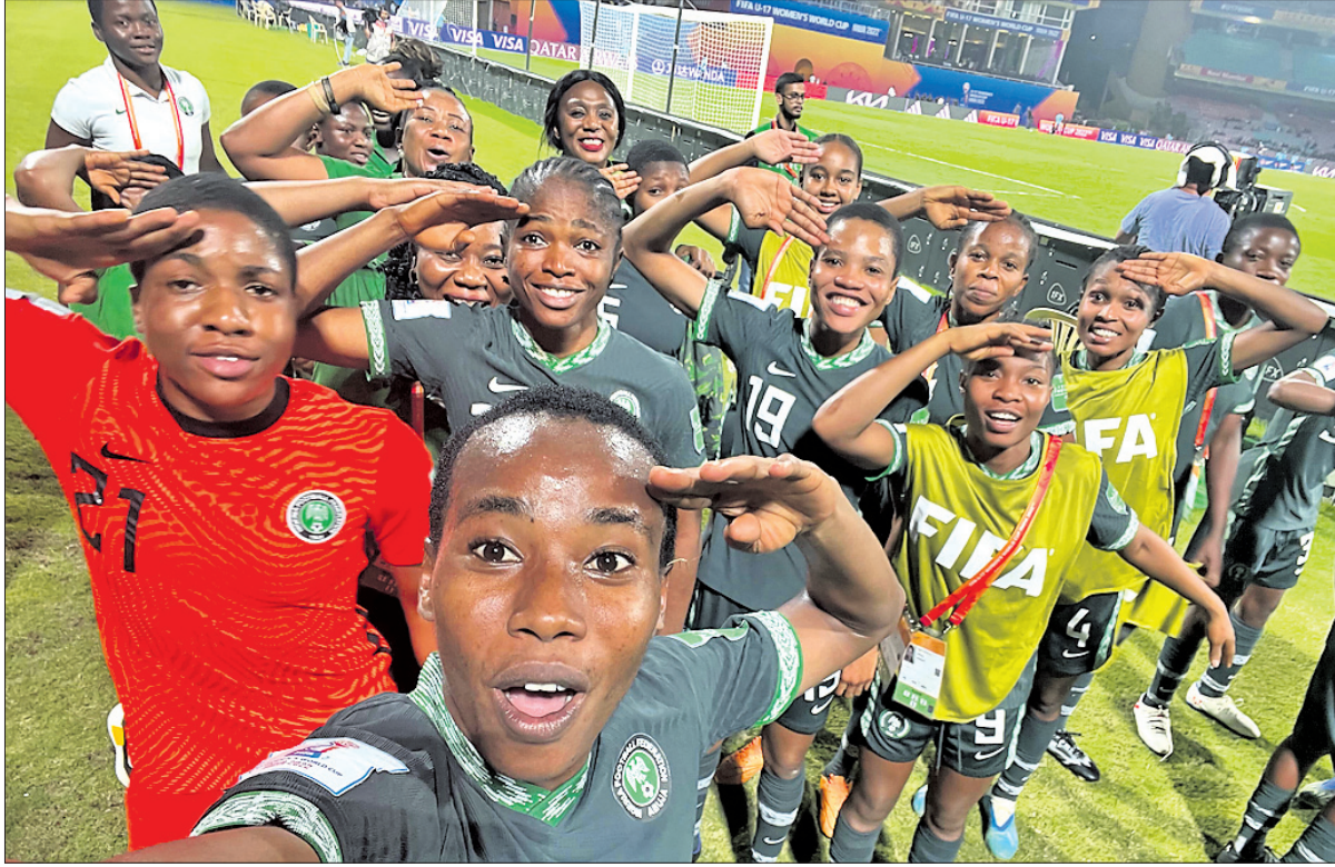
ନଭି ପୁସ୍ତକରେ ଅନୁଷ୍ଠିତ ୧୭ ବର୍ଷରୁ କମ୍ ମହିଳା ଫିଫା ବିଶ୍ୱକପର ପ୍ରେ-ଅପରେ କର୍ମୀମାନଙ୍କୁ ହରାଇବାପରେ ନାଇଜେରିଆ ଖେଳାଳିଙ୍କ ବିଜୟ ଉଲ୍ଲାସ।

ଯାଇଥିଲା। ଚୁନାମଣି ଅନୁଷ୍ଠିତ ୧୧ରେ ଆରମ୍ଭ ହୋଇଥିଲା। ଚୁନାମଣିରେ ମୋଟ ୩୨ଟି ମ୍ୟାଚ ଖେଳାଯାଇଥିବାବେଳେ ୯୫ଟି ଗୋଲ ଖୋର ହୋଇଛି। କଲମିଆର ଲିକ୍ଷା କାଲସେଡୋ, ଜର୍ମାନୀର ଲୋରେନ ବେଣ୍ଡର ଓ ଜାପାନର ମୋଖୋବା ତାନିକାଘା ୪ଟି ଲେଖାଏ ଗୋଲ ଦେଇ ମିଳିତଭାବେ ୧୨ ଖୋରର ହୋଇଛନ୍ତି।