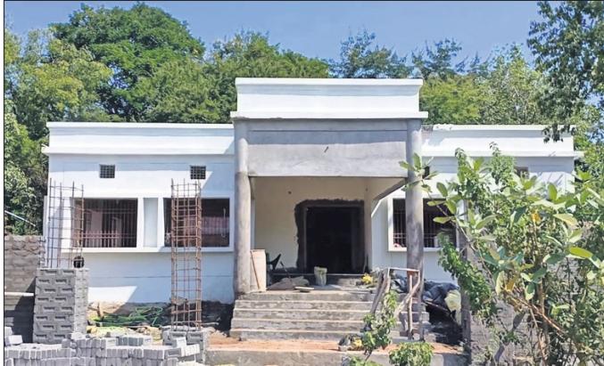
ନିର୍ମାଣାଧୀନ ନିମ୍ନଶକ୍ତି ଭବନ।

ରାଜ୍ୟର ପ୍ରତ୍ୟେକ ବ୍ଲକ୍ରେ ନିମ୍ନ ଶକ୍ତି ଭବନ ନିର୍ମାଣ ପାଇଁ ସରକାର ଲକ୍ଷ ଲକ୍ଷ ଟଙ୍କା ମଞ୍ଜୁର କରୁଛନ୍ତି। ଏହିକ୍ରମରେ କଳାହାଣ୍ଡି ଜିଲ୍ଲା କେସିଜା ବ୍ଲକ୍ରେ ୨୦୨୧-୨୨ ଆର୍ଥିକ ବର୍ଷରେ ନିମ୍ନ ଶକ୍ତି ଭବନ ନିର୍ମାଣ ପାଇଁ ଭବାନୀପାଟଣା ପିଡ଼ିବୁଡ଼ି ବିଭାଗକୁ ରାଜ୍ୟ ସରକାର ଦାୟିତ୍ୱ ଦେଇଛନ୍ତି। ଏହାର ନିର୍ମାଣ ପାଇଁ କେସିଜା ଜିଆର କମ୍ପ୍ୟୁଟର ଚେଣ୍ଡର ପକାଇଥିଲା। ହେଲେ ନିର୍ମାଣାଧୀନ ନିମ୍ନ ଶକ୍ତି ଭବନରେ ଦିନା ସୁତନ ଫଳକ, ନିମ୍ନମାନ କାର୍ଯ୍ୟ ହେଉଛି ବୋଲି କେସିଜା ବୁଦ୍ଧିଜୀବୀମାନେ ପିଡ଼ିବୁଡ଼ି ବିଭାଗର ଏସି, ଏସଡିଓ, କେଜ, ଏବଂ ନିମ୍ନ ଶକ୍ତି ବିଭାଗ ବ୍ଲକ୍ ପ୍ରୋଜେକ୍ଟ କୋର୍ଡିନେଟରଙ୍କ ନିକଟରେ ଅଭିଯୋଗ କରିଛନ୍ତି। ସୁତନା ଯେ, ଗତ ୨୬।୧।୨୦୨୧ରେ