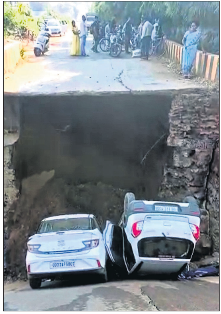
ପୋଲ ତଳକୁ ଖସିପଡ଼ିଥିବା ୨ କାର।

ଭବାନୀପାଟଣା, ୩୦.୧୦ (ସ.ପ୍ର.) କଳାହାଣ୍ଡି ଜିଲ୍ଲା ଭବାନୀପାଟଣା-ଥୁଆମୁଳ ରାମପୁର ୪୪ ନଂ ରାଜ୍ୟ ରାଜପଥର ଭାଗରେ ଏକ ନିକଟରେ ରବିବାର ଏଥିରେ ନବରଙ୍ଗପୁର ଜଣେ ଖବରଦାତାଙ୍କ ଅପରାହ୍ଣରେ ଏକ ଅଭାବନୀୟ ଘଟଣା ଘଟିଛି। ଏଠାକାର ରାଜ୍ୟ ରାଜପଥର ମୁଖ୍ୟ ରାସ୍ତାରେ ଥିବା ପୋଲ ହଠାତ ଭୁସ୍ଥିପଡ଼ିବାରୁ ୨ଟି ଚଳନ୍ତା କାର ତଳକୁ ଖସିପଡ଼ିଥିଲା। ବ୍ରିଜ୍ ଫଳରେ ୨ଟି କାରରେ ବସିଥିବା ୫ଜଣ ଅପମଳରେ ନିର୍ମୃତ ଏହି