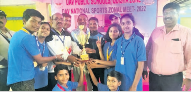
କୃତୀତ୍ୱ ହାସଲ କରିଥିବା ଖେଳାଳିମାନେ।