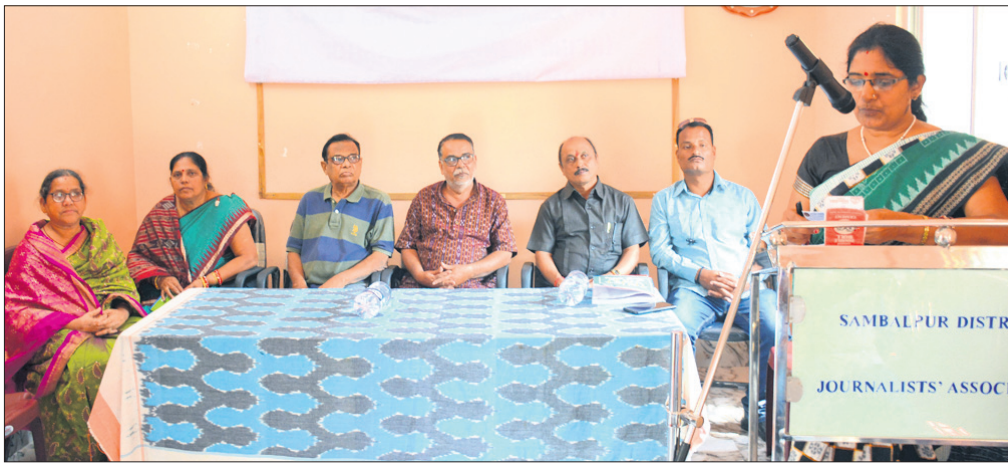
ରବିବାର ସମ୍ବଲପୁର ସାମ୍ବାଦିକ ଭବନଠାରେ ଆୟୋଜିତ ବହୁଭାଷୀ କବିତା ପାଠୋତ୍ସବରେ ଅତିଥି ଓ କବିମାନେ ।

ସାହିତ୍ୟ ଏକ ଭାବନା । ସାହିତ୍ୟ ମାଧ୍ୟମରେ ସମାଜକୁ କବିମାନେ ଦିଗଦର୍ଶନ ଦେଇଥାନ୍ତି । ଜରୁରୀକାଳୀନ ପରିସ୍ଥିତିରେ ମଧ୍ୟ କବିଙ୍କ ଉଦ୍ଦେଶ୍ୟରେ ସାହିତ୍ୟ ସୃଷ୍ଟି ସମାଜର ଦର୍ପଣ ଭାବେ କାର୍ଯ୍ୟ କରିଥାଏ । ତେଣୁ କବି ଓ ସାହିତ୍ୟିକମାନେ ସବୁ ସମୟରେ ସମାଜର ମାର୍ଗଦର୍ଶକ ଅଟନ୍ତି । ଭାରତୀୟ ସାହିତ୍ୟ ସଂସ୍କୃତି ସଂସ୍କୃତ ପଦ୍ଧତି ଆୟୋଜିତ ବହୁଭାଷୀ କବିତା ପାଠୋତ୍ସବ କାର୍ଯ୍ୟକ୍ରମରେ ଯୋଗଦେଇ ଅତିଥି ଓ ବକ୍ତାମାନେ ଉପରୋକ୍ତ ମତ ପ୍ରକାଶ କରିଛନ୍ତି ।