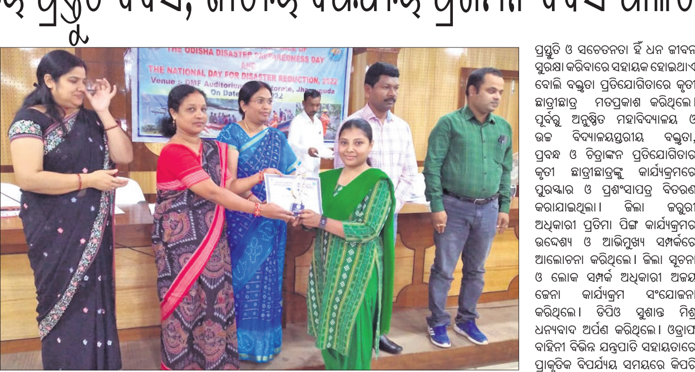
କାର୍ଯ୍ୟକ୍ରମରେ ଯୋଗ ଦେଇଥିବା ଅଧିକାରୀମାନେ କଣେ କୃତା ଛାତ୍ରୀଙ୍କୁ ପୁରସ୍କୃତ କରୁଛନ୍ତି।