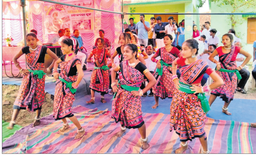
ସୁରଭି କାର୍ଯ୍ୟକ୍ରମରେ ପରିବେଷିତ ସାଂସ୍କୃତିକ କାର୍ଯ୍ୟକ୍ରମ।