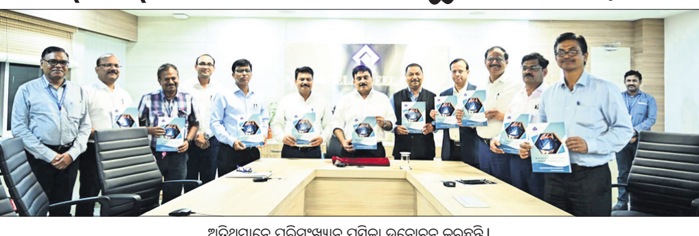
ଅତିଥିମାନେ ପରିସଂଖ୍ୟାନ ପୁସ୍ତିକା ଉନ୍ମୋଚନ କରୁଛନ୍ତି।