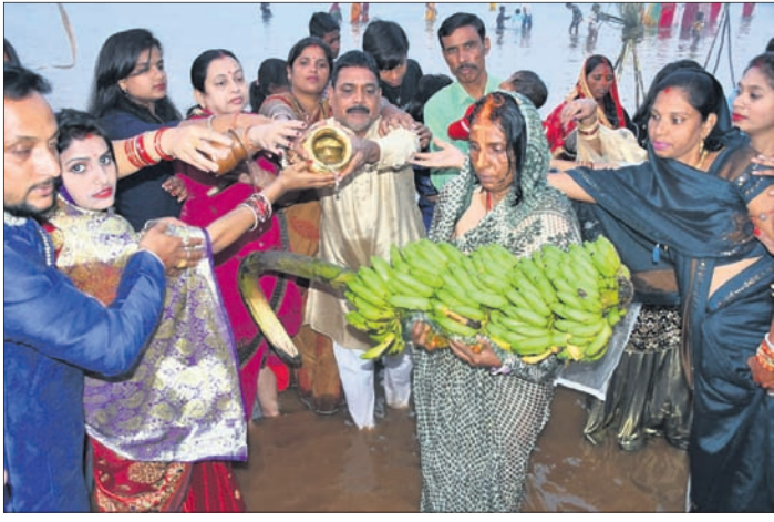
ସୁନ୍ଦରଗଡ଼ ଇବ୍ ନଦୀକୂଳରେ ବ୍ରତଧାରୀମାନେ ଅସ୍ତ୍ରଗାମୀ ସୂର୍ଯ୍ୟଙ୍କୁ ଅର୍ଘ୍ୟଦାନ କରି ପୂଜାର୍ଚ୍ଚନା କରୁଛନ୍ତି । କୁଡ଼ା ବାଲକୂବଣଠାରେ ଛତ୍ରପର୍ବ ପାଳନ ଲାଗି ଭିଡ଼ ଜମିଛି ।