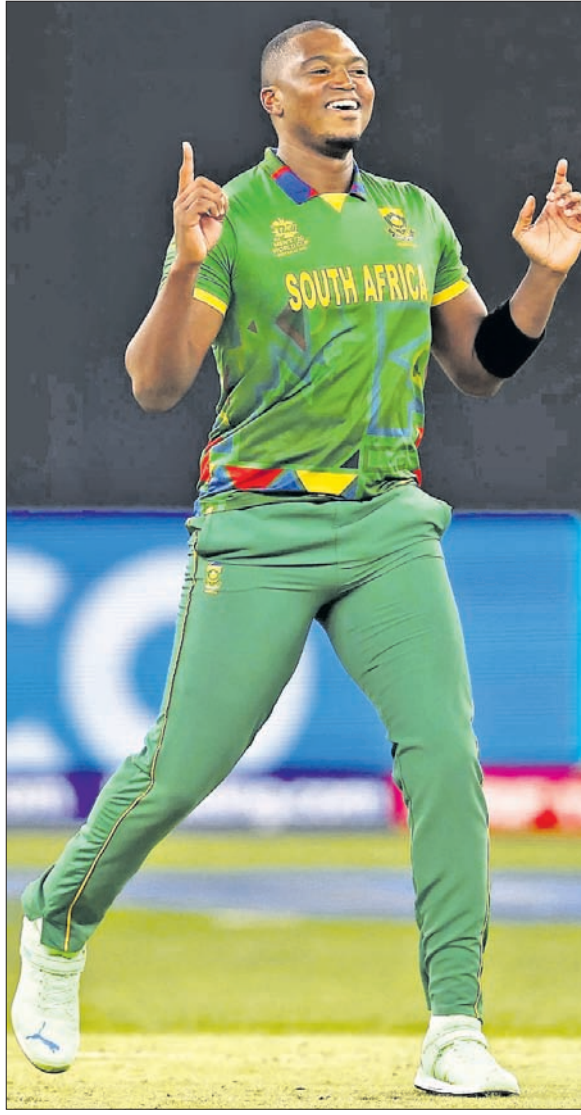
ପ୍ରେୟର ଅଫ୍ ଦି ମ୍ୟାଚ୍ ଲୁନ୍ଚି ଏନ୍ଦ୍ରିତି।

ପର୍ଥ, ୩୦।୧୦ ଚଳିତ ଟି୨୦ କ୍ରିକେଟ ବିଶ୍ୱକପରେ ରବିବାର ପ୍ରଥମ ପରାଜୟ ବରଣ କରିଛି ଚିନ୍ ମିଶ୍ର। ପୂର୍ବ ୨ଟି ମ୍ୟାଚ୍ରେ ପାକିସ୍ତାନ ଓ ନେଦରଲାଣ୍ଡକୁ ହରାଇଥିବା ଭାରତ ଏଠାରେ ଏକ ଲୋ ଷ୍ଟୋରିଂ ମ୍ୟାଚ୍ରେ ଦକ୍ଷିଣ ଆଫ୍ରିକାଠାରୁ ୫ ରନ୍ରେ ପରାସ୍ତ ହୋଇଛି। ପର୍ଥର ବାଉଣ୍ଡ ପିଚ୍ରେ ପ୍ରଥମେ ବ୍ୟାଟି କରିଥିବା ଭାରତ ୨୦ ଓଭରରେ ୯ ରନ୍ରେ କ୍ଲିଅର ହୋଇ ୧୩୩ ରନ୍ କରିଥିଲା। ଦକ୍ଷିଣ ଆଫ୍ରିକା ମାତ୍ର ୩ ରନ୍ରେ ୨ଟି ଏବଂ ୨୪ ରନରେ ତୃତୀୟ ଉଇକେଟ ହରାଇ ପ୍ରାରମ୍ଭିକ ବ୍ୟାଟି ବିପର୍ଯ୍ୟୟର ସମ୍ମୁଖୀନ ହୋଇଥିଲେ ହେଁ ଏଡେନ ମାରକ୍ରାମ ଓ ଡେଭିଡ ମିଲରଙ୍କ ଅକ୍ଷତକ ବଲରେ ୧୯.୪ ଓଭରରେ ୫ ରନ୍ରେ କ୍ଲିଅର ହୋଇ ୧୩୩ ରନ୍ ସଂଗ୍ରହ କରି ନେଇଥିଲା। ମାରକ୍ରାମ ୪୧ ବଲରୁ ୬ ଚୋକା ଓ ୧ ଛକା