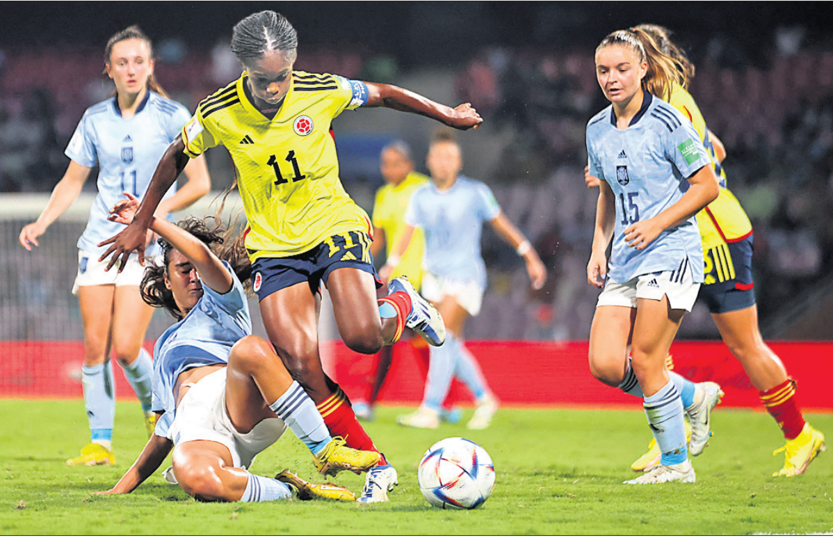
ନଭିପୁସ୍ତକରେ ରବିବାର ସ୍ନେହ ଓ କଲମିଆ ମଧ୍ୟରେ ଅନୁଷ୍ଠିତ ୧୭ ବର୍ଷରୁ କମ୍ ମହିଳା ଫିଫା ବିଶ୍ୱକପ ଫାଇନାଲ ମ୍ୟାଚ୍ରେ ଏକ ସଂଘର୍ଷପୂର୍ଣ୍ଣ ଘଟଣା।