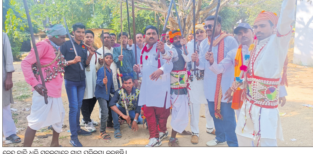
କେନ୍ଦ୍ର ବାଡ଼ି ଧରି ସୁବକମାନେ ଗ୍ରାମ ପରିକ୍ରମା କରୁଛନ୍ତି।

ପଶ୍ଚିମ ଓଡ଼ିଶାର ଗଣତନ୍ତ୍ର ନୂଆଁଖାଇ ଭାବେ ମାସ ଶୁକ୍ଳ ପଞ୍ଚମୀ ତିଥିରେ ଅନୁଷ୍ଠିତ ହୋଇଥିବା ବେଳେ କନୋଜିଆ ସ୍ୱାଧୀନ (ଅହାର) ସମାଜର ନୂଆଁଖାଇ ଦୀପାବଳିରେ ଅନୁଷ୍ଠିତ ହୋଇଥିଲା। ପ୍ରତିବର୍ଷ ଦୀପାବଳିରେ ପାରମ୍ପରିକ ବାଡ଼ିଖେଳ ହୋଇଥାଏ। ଏହି ଖେଳ ୭ ଦିନ ଧରି ଚାଲିଥିବା ବେଳେ ରବିବାର ଶେଷ ହୋଇଛି। ଦୀପାବଳିରେ ଘର ଇଷ୍ଟ ଦେବତାକୁ ପୂଜା ଅର୍ଚ୍ଚନା କରି ଏକ ପାହାଡ଼ ଘାଟକୁ ଯାଇ ଗିରି ଗୋବର୍ଦ୍ଧନ ପୂଜା କରି ନୂଆଁ ଧାନ ଗାଈ ଝିରି ଓ ଖେଳୁଡ଼ି ପ୍ରସ୍ତୁତ କରି ପ୍ରଥମେ ଗାଈ ଓ ବାଛୁରୀଙ୍କୁ ଖାଇବାକୁ ଦେଇ ପରେ ସାମଗ୍ରୀ ଏକାଠି ବସି ନୂଆଁ ଅର୍ଣ୍ଣ ଭକ୍ଷଣ କରିଥାନ୍ତି। ନର୍ଦାନ ଭକ୍ଷଣ ପରେ ପରସ୍ପରକୁ କୁହାର ଭେଟ ହୋଇ ନିମନ୍ତ୍ରଣ ବନ୍ଧୁବାନ୍ଧବଙ୍କୁ ନେଇ ସେଠାରେ ଖୁଡ଼ାର ଦେବତାକୁ