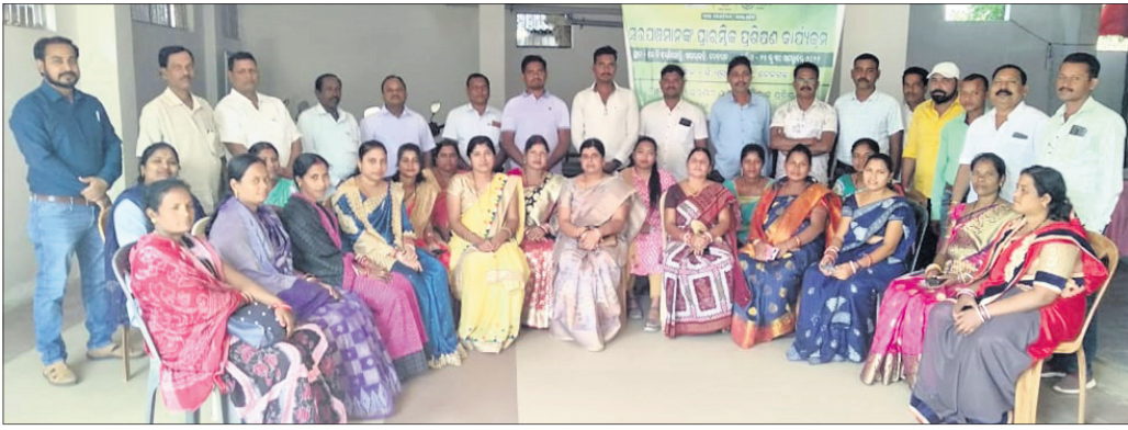
ଚାଲିମ କାର୍ଯ୍ୟକ୍ରମରେ ଅଂଶଗ୍ରହଣ କରିଥିବା ସରପଞ୍ଚ ଓ ଅନ୍ୟମାନେ ।

ଦେବଗଡ଼, ୩୦।୧୦(ଡି.ଏନ.ଏ.) ରାଜ୍ୟ ଗ୍ରାମ ଉନ୍ନୟନ ଏବଂ ପଞ୍ଚାୟତରାଜ ବିଭାଗ ଓ ଦେବଗଡ଼ ଜିଲ୍ଲା ପରିଷଦ ଆନୁକୂଲ୍ୟରେ ସ୍ଵେଚ୍ଛାସେବୀ ଅନୁଷ୍ଠାନ ସହଯୋଗରେ ସରପଞ୍ଚମାନଙ୍କୁ ନେଇ ଚାଲିଥିବା ପଞ୍ଚାୟତରାଜ ପ୍ରଶିକ୍ଷଣ ଶିବିର ରବିବାର ଉଦ୍‌ଯାପିତ ହୋଇଯାଇଛି । ସ୍ଥାନୀୟ କେବି ରେସିଡେନ୍ସ ଠାରେ ଆୟୋଜିତ ଏହି