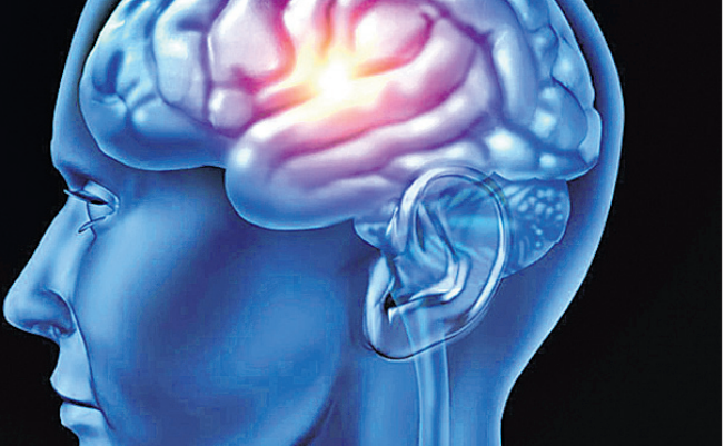
ସର୍ବୋତ୍ତମ ଭାବରେ ପ୍ରତିବନ୍ଧନ ଖାଦ୍ୟ ଚାଲିକାରେ ତତକା ପରିପରିବା ଏବଂ ଭିଟାମିନ୍‌ସୁକ୍ଷ୍ମ ଖାଦ୍ୟ ସାମିଲ କରନ୍ତୁ।

ଆମ ଶରୀର ପ୍ରମୁଖ ଅଙ୍ଗପ୍ରାଣ ମଧ୍ୟରୁ ମସ୍ତିଷ୍କ ଅନ୍ୟତମ। ଏହାର କାର୍ଯ୍ୟ ଯଦି ବାଧାପ୍ରାପ୍ତ ହୁଏ ତେବେ ଆମେ ଚାହୁଁଥିବା ସ୍ୱାସ୍ଥ୍ୟ ସମସ୍ୟାର ସମ୍ମୁଖୀନ ହୋଇଥାଉ। ଏପରି କି ଅକାଳରେ ଜୀବନ ଚାଲିଯିବା ଆଶଙ୍କା ରହିଛି। ତେଣୁ ମସ୍ତିଷ୍କ କିପରି ଠିକ୍ ଭାବରେ କାମ କରିବ ସେ ନେଇ ଆମେ ସଚେତନ ରହିବା ନିହାତି ଦରକାର। ତେବେ ଏହାର କାର୍ଯ୍ୟ କିପରି ଆହୁରି ସକ୍ରିୟ ରହିବ ତାହା ପଛରେ ସମ୍ବଳିତ ଖାଦ୍ୟର ଭୂମିକା ରହିଛି ବୋଲି ସୂନିଭୀର୍ଷି ଅଫ ବର୍ଲିନର ସ୍ନାୟୁଶାସ୍ତ୍ର ବିଶେଷଜ୍ଞମାନେ ପ୍ରକାଶ କରିଛନ୍ତି। ଯେଉଁମାନେ ନିୟମିତ ସମ୍ବଳିତ ଖାଦ୍ୟ ଖାଇଥିଲେ ସେମାନଙ୍କ ମସ୍ତିଷ୍କର କାର୍ଯ୍ୟଧାରା ସର୍ବୋତ୍ତମ ଭାବରେ ପ୍ରଖର ରହିଥାଏ ବୋଲି ସେମାନେ ଏକ ଅନ୍ୟମାନଙ୍କ ତୁଳନାରେ ପ୍ରଖର ରହିଥାଏ ବୋଲି ସେମାନେ ଏକ