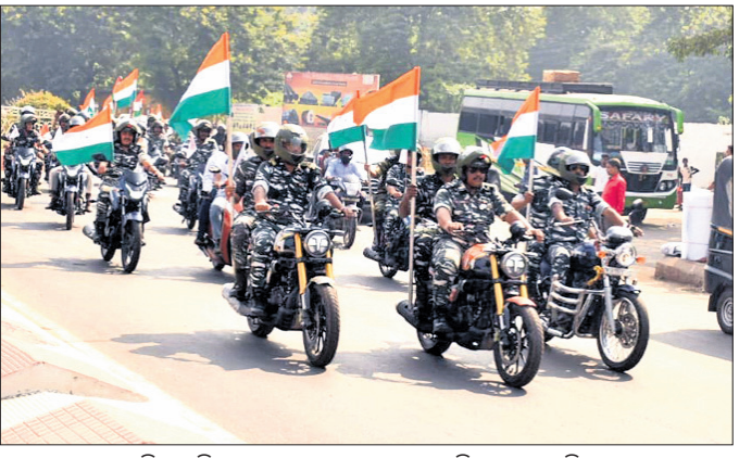
ସିଆର୍ପିଏଫ୍ ସଦାନାମନେ ବାଇକ୍ ରାଲିରେ ଯାଉଛନ୍ତି।

ରାଞ୍ଚାୟ ଏକତା ଦିବସ ପାଳନ ଅବସରରେ ରାଞ୍ଚାୟ କଲେଜର ଶିଳ୍ପାଅଞ୍ଚଳରେ ଥିବା ସିଆର୍ପିଏଫ୍-୧୯ ବାଟାଲିୟନ ପକ୍ଷରୁ ରବିବାର ଏକ ବାଇକ୍ ରାଲି ଅନୁଷ୍ଠିତ ହୋଇଛି। ଦେଶରେ ଶାନ୍ତି, ଏକତା ଓ ଅଖଣ୍ଡତାକୁ ବଜାଇ ରଖିବା ପାଇଁ ସିଆର୍ପିଏଫ୍ ପକ୍ଷରୁ ଏହି ରାଲି ଆୟୋଜିତ କରାଯାଇଥିଲା। ଏହି ରାଲି ବାଟାଲିୟନ କାର୍ଯ୍ୟାଳୟରୁ ବାହାରି