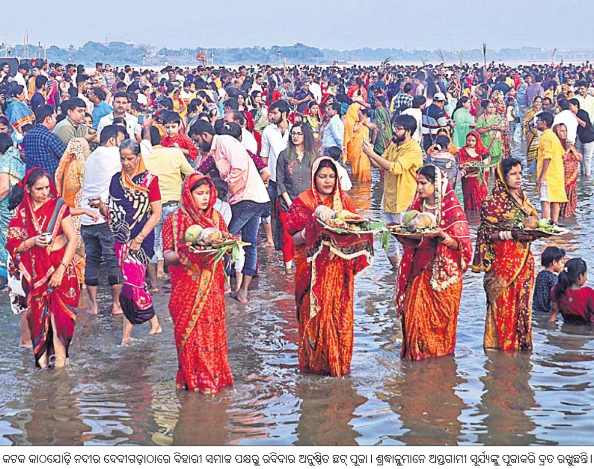
କଟକ କାଠଯୋଡ଼ି ନଦୀର ବେଦୀଗଡ଼ାଠାରେ ବିହାରୀ ସମାଜ ପକ୍ଷରୁ ଉଦ୍ଧୃତ ଅନୁଷ୍ଠିତ ହେଉଥିବା ପୂଜା। ଶ୍ରଦ୍ଧାଳୁମାନେ ଅସ୍ତରାମୀ ସୂର୍ଯ୍ୟକୁ ପୂଜାକରି ବ୍ରତ ରଖୁଛନ୍ତି।