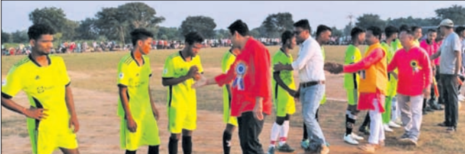
ଖେଳାଳିଙ୍କ ସହ ଅତିଥିମାନେ ପରିଚିତ ହେଉଛନ୍ତି।