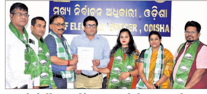
ବିଜେଡି ପ୍ରତିନିଧି ଦଳ ମୁଖ୍ୟ ନିର୍ବାଚନ ଅଧିକାରୀଙ୍କୁ ଭେଟି ଅଭିଯୋଗ ପ୍ରଦାନ କରୁଛନ୍ତି।

ଧାମନଗର ଉପନିର୍ବାଚନକୁ ନେଇ ଏବେ ରାଜ୍ୟ ରାଜନୀତି ଉଠିଛି ପଛୁଛି। ଉପନିର୍ବାଚନରେ ବିପୁଳ ଟଙ୍କା କାରବାର ହେଉଥିବା ନେଇ ଚର୍ଚ୍ଚା ଚାଲିଛି। ଏସ୍ଏଚ୍ଡି ମହିଳାମାନଙ୍କ ଉପରେ ବିଜେଡି ଟଙ୍କା କାରବାର କରୁଥିବା ନେଇ ଭାଜପା ଲଗାତର ଭାବେ ଅଭିଯୋଗ କରି ଆସୁଛି। ରବିବାର ଭାଜପାର ଏକ ପ୍ରତିନିଧି ଦଳ ସମାନ ଅଭିଯୋଗ ନେଇ ସିଲିଓକୁ ଭେଟିଥିବା ବେଳେ ବିଜେଡି ଏହାର କାର୍ତ୍ତବ୍ୟ କରୁଛି। ଭାଜପା ନେତାମାନେ ଏସ୍ଏଚ୍ଡି ମହିଳାଙ୍କୁ ଅପମାନିତ କରୁଥିବା ନେଇ ବିଜେଡି ଉଲ୍ଲଟା ଅଭିଯୋଗ ଆଣିଛି।