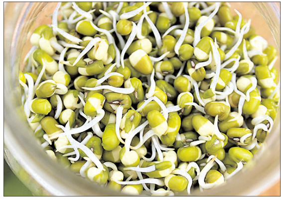
ଆମ ଶରୀର ପାଇଁ ଭିଟାମିନ୍ କେତେ ଉପକାରୀ ତାହା କହିବା ବାହୁଲ୍ୟ। ଏଥିରେ ଅନେକ ପ୍ରକାର ସାନ୍ତୋଷ୍ୟପଦାର୍ଥ ଗୁଣ ଭରି

ରହିଛି। ଠିକ୍ ସେହିପରି ଆଇରଏଡ୍ ରୋଗୀଙ୍କ ପାଇଁ ଏକ ପ୍ରକାର ଭିଟାମିନ୍ ବେଶ୍ ଲାଭପ୍ରଦ ସାବ୍ୟସ୍ତ ହୋଇଥାଏ। ତାହା ହେଲା ଭିଟାମିନ୍ 'ଇ'। ଆମ ଶରୀର ପାଇଁ ବେଶ୍ ଲାଭପ୍ରଦ ସାବ୍ୟସ୍ତ ହୋଇଥାଏ। ଏପରି ଖାଦ୍ୟ ଶରୀରରେ ଲାଲ୍ ରକ୍ତ କୋଷିକା ଗଠନରେ ମଧ୍ୟ ସାହାଯ୍ୟ କରେ। ଆମ ଶରୀରରେ ପିତ୍ତାମୟ ଗ୍ରନ୍ଥି ଏବଂ ଆଇରଏଡ୍ ଗ୍ରନ୍ଥିର କାର୍ଯ୍ୟଦକ୍ଷତା ବୃଦ୍ଧି କରିବାରେ ଏହା ସହାୟକ ମଧ୍ୟ ହୋଇଥାଏ। ଭିଟାମିନ୍ 'ଇ'ର ଆଉ ଏକ ଉପକାରୀ ଗୁଣ ରହିଛି। ଏହା ଆଲର୍ଜି ଭଳି ସମସ୍ୟାରୁ ରକ୍ଷା କରିଥାଏ। ଖାଦ୍ୟ କଥା ହେଲା ନିୟମିତ ଏପରି ଖାଦ୍ୟ ଖାଇଲେ ତାହା ଦ୍ୱାରା ଆମ ଶରୀରରେ ରୋଗ ପ୍ରତିରୋଧକ ଶକ୍ତି ବୃଦ୍ଧିଥାଏ। ଭିଟାମିନ୍ 'ଇ' ସୁକ୍ଷ୍ମ ଖାଦ୍ୟ ଆଣ୍ଡିଅକ୍ଟିଭ୍‌ସ୍‌ଟିମ୍ କାମ କରେ। ଏହା ଶରୀରରେ କୋଲେଷ୍ଟରଲ୍ ପରିମାଣକୁ ସମ୍ବଳିତ ଅବସ୍ଥାରେ ରଖିଥାଏ। ଗଜାମୁଗ, ଗଜାବୁଟ, ସୂର୍ଯ୍ୟମୁଖୀ ତେଲ, ପାଳକ ଶାଗ, ଚିନିଆବାଦାମ ଆଦିକୁ ଭିଟାମିନ୍ 'ଇ' ପ୍ରଚୁର ମାତ୍ରାରେ ମିଳିଥାଏ।