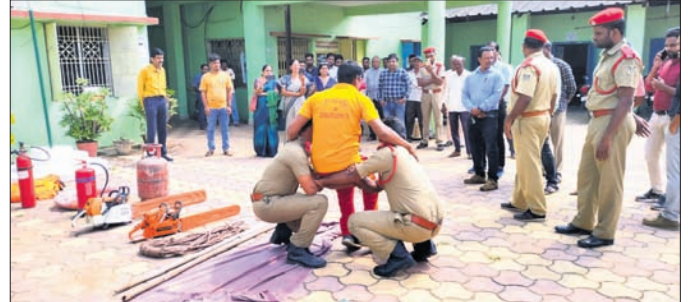
ଅଗ୍ନିଶମ ବିଭାଗ ପକ୍ଷରୁ ମକତ୍ତ୍ରିଲ କରାଯାଇଛି ।