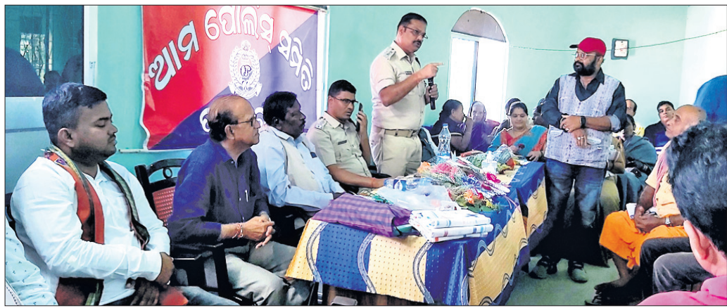
ବୈଠକରେ ଉପସ୍ଥିତ ଅଧିକାରୀ ।