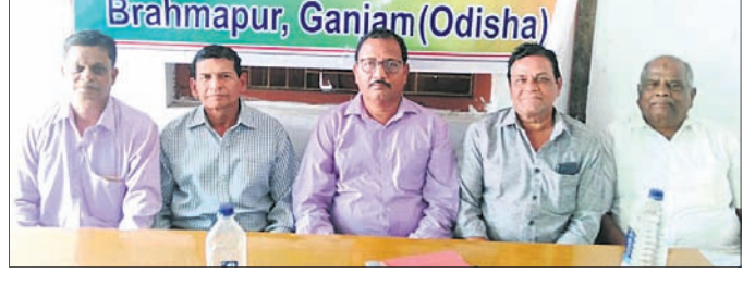
କାର୍ଯ୍ୟକ୍ରମରେ ଉପସ୍ଥିତ ପୁରାତନ ଛାତ୍ର।