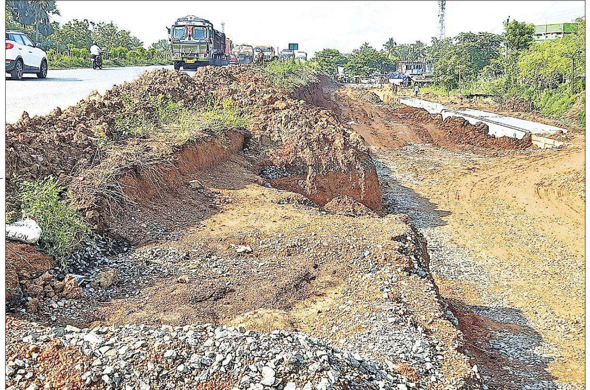
ଜାତୀୟ ରାଜପଥର ସେରଗଡ଼ ନିକଟରେ ଗୋଟିଏ ପାର୍ଶ୍ୱ ଖୋଳାଯାଇ କାର୍ଯ୍ୟ ଜାରି ରହିଛି।