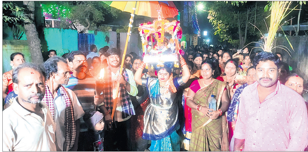
ଶିଳ୍ପାଞ୍ଚଳ କୁସାରପଲ୍ଲୀରେ ମା' ଗୌରୀଆମ୍ନାଙ୍କ ନଗର ପରିକ୍ରମା।