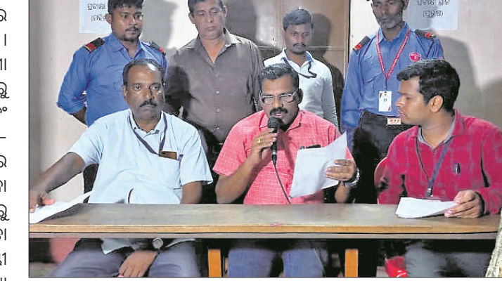
ନିର୍ବାଚନ ଅଧିକାରୀ ଫଳାଫଳ ଘୋଷଣା କରୁଛନ୍ତି ।