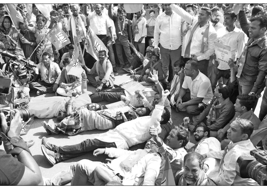
ଭାଜପା କର୍ମୀମାନେ ରାସ୍ତାରେ ଶୋକ ପ୍ରତିବାଦ କରାଉଛନ୍ତି ।