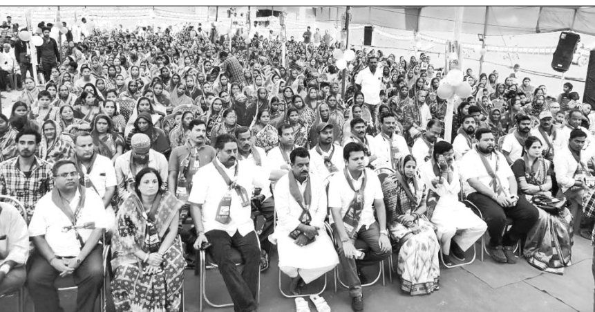
ଭଦ୍ରକ ଜିଲ୍ଲା ତିହିଡ଼ି ବ୍ଲକ ଅବଳ ପଞ୍ଚାୟତରେ ଅନୁଷ୍ଠିତ ସଭାରେ ବିଜେଡି ନେତା ଓ କର୍ମୀ ।