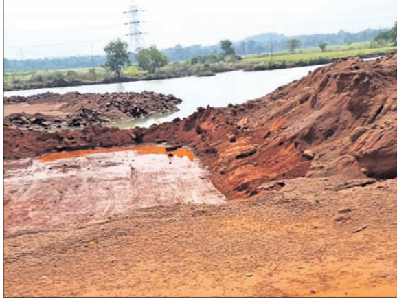
ଗଣପୁର ତହସିଲ ମୟୂରଖାଲିଆ ଅଞ୍ଚଳରୁ ଖୋଳା ଯାଇଥିବା ଖଣିକୁ ପ୍ରଶାସନିକ ଅଧିକାରୀ ଯାଞ୍ଚ କରୁଛନ୍ତି । କାଳୁ ଜଙ୍ଗଲରେ ଖୋଳା ଯାଇଥିବା ମାଙ୍କଡ଼ା ପଥର ଓ ମୋରମ ଖଣି ।