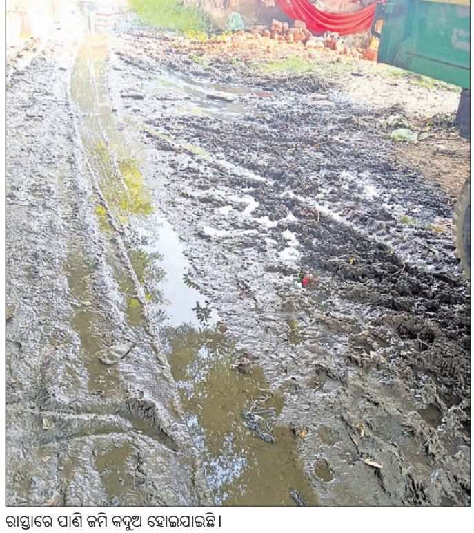
ରାସ୍ତାରେ ପାଣି ଜମି କରୁଅ ହୋଇଯାଇଛି ।