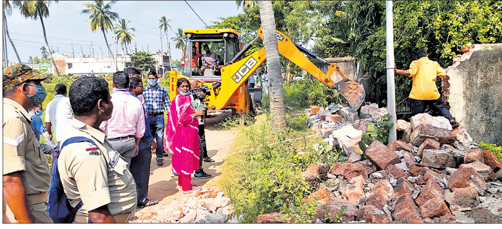
ପ୍ରଶାସନ ପକ୍ଷରୁ କରାଯାଇଥିବା କେନାଲ୍ କରାଯାଇଛି।

ନିମାପଡ଼ା ଏନ୍.ଏସ୍.ଇ. କଲୋନିଆଲ ବିଭାଗ ପ୍ରଶାସନ ପକ୍ଷରୁ ନିର୍ମିତ ଭାବେ ସୋମବାର କେନାଲ୍ କରାଯାଇଛି।