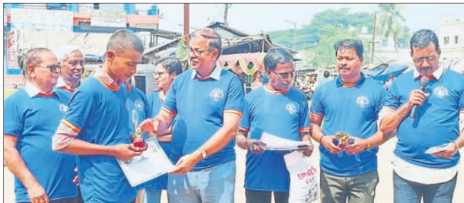
ପିପିଲିରେ ଜଣେ କୃତୀ ପ୍ରତିଯୋଗୀଙ୍କୁ ପୁରସ୍କୃତ କରାଯାଇଛି।