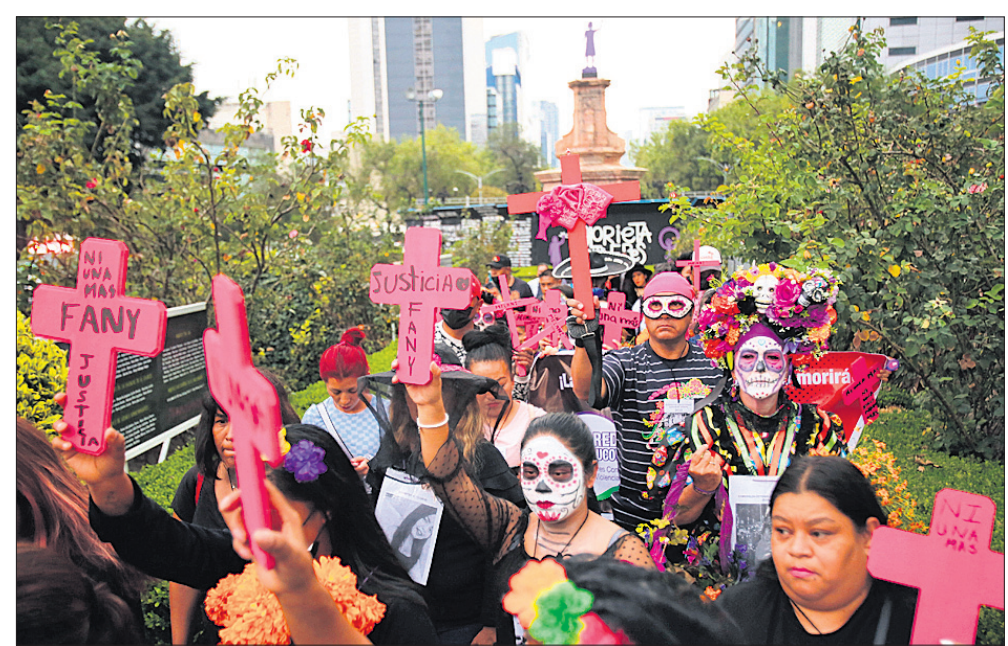
ନାରୀ ହତ୍ୟାକୁ ବିରୋଧ କରି ମେଡିକୋସିଟିରେ ମହିଳାମାନେ ତେ ଅଫ ଦ ଡେଡ୍ ପାଳନ ଅବସରରେ କଳାକ ବେଶ ହୋଇ ଶୋଭାଯାତ୍ରାରେ ବାହାରିଛନ୍ତି।