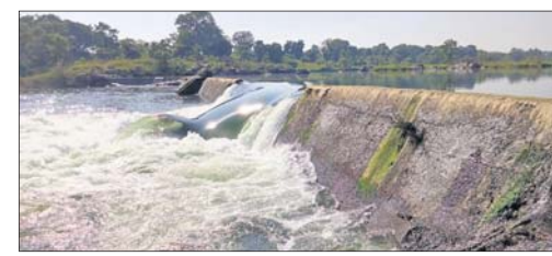
ମହାନଦୀ ନିକଟରେ ଘାଇ ଘଟିଛି।

ସମ୍ବଲପୁର, ୩୧.୧୧.୦ (ବୁଧବେଳା) ସମ୍ବଲପୁର ନିକଟ ମହାନଦୀ ଅଯୋଧ୍ୟା ସରୋବର ଆନିକଟରେ ୧୦୦୦ ଟନର ଘାଇ ଘଟିଛି।