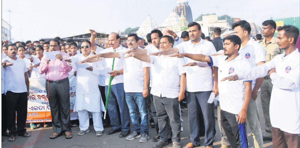
ରାଷ୍ଟ୍ରୀୟ ଏକତା ଦିବସ ଅବସରରେ ଘୋମବାର ପୁରୀ ସହରରେ ବିଭିନ୍ନ ଅନୁଷ୍ଠାନ ପକ୍ଷରୁ ଆୟୋଜିତ ସାମୁହିକ ଶପଥ ପାଠ କାର୍ଯ୍ୟକ୍ରମ।

ସାକ୍ଷୀଗୋପାଳ, ୩୧।୧୦ (ଡି.ଏନ୍.ଏ./ସ୍ୱ.ପ୍ର.): ଉତ୍କଳମଣି ଗୋପବନ୍ଧୁ ଚିତ୍ର ମହାବିଦ୍ୟାଳୟ ପରିସରରେ ଘୋମବାର ନିଶାମୁକ୍ତ ଭାରତ ଅଭିଯାନର ଦିନିକିଆ କର୍ମଶାଳା ଅନୁଷ୍ଠିତ ହୋଇଯାଇଛି।