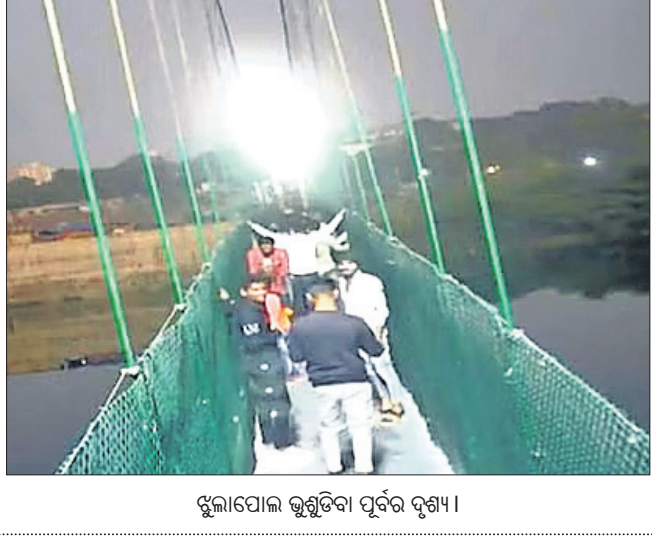
ଖୁଲାପୋଲ ଭୃଗୁକ୍ତି ପୂର୍ବରୁ ଦୃଶ୍ୟ।

ନୂଆଦିଲ୍ଲୀ, ୩୧।୧୦(ପି.ଟି.): ବ୍ରିଜ୍ ଭୃଗୁକ୍ତି ପଡ଼ିବାରୁ ୩୦ ଜଣଙ୍କ ମୃତ୍ୟୁ ହୋଇଥିଲା। ମୃତକଙ୍କ ମଧ୍ୟରୁ ଅଧିକାଂଶ ପିଲା ଥିଲେ। ଚାରି ନାମକ କାଟ୍ ପରିବା ପାଇଁ ଏକସଙ୍ଗେ ୬୩ ଜଣ ବ୍ରିଜ୍ରେ ଚଢ଼ିବାକୁ ଏହା ଭୃଗୁକ୍ତି ପଡ଼ିଥିଲା। ବିବେକାନନ୍ଦ ଘାଟଣାରେ : ଉତ୍ତର କୋଲକାତାର ଏକ ବ୍ୟସ୍ତବହୁଳ ବଜାର ଅଞ୍ଚଳରେ ନିର୍ମାଣାଧୀନ ୨.୨ କିଲୋମିଟର ଦୀର୍ଘ ବିବେକାନନ୍ଦ ବ୍ରିଜ୍ ଦୁର୍ଘଟଣା। ଦେଶରେ ୧୯୭୭ରୁ ୨୦୧୬ ମଧ୍ୟରେ ହୋଇଥିବା ବ୍ରିଜ୍ ବିଫଳତାର ଏକ ଅନୁଧ୍ୟାନ କରାଯାଇ 'ସ୍ୱଳ୍ପର ଆଖି ଇନ୍‌ଫ୍ରାସ୍ଟ୍ରକ୍ଚର ଇଞ୍ଜିନିୟରିଂ' ନାମକ ଏକ ଅନ୍ତର୍ଜାତୀୟ ପତ୍ରିକାରେ ପ୍ରକାଶ ପାଇଥିଲା। ଉକ୍ତ ରିପୋର୍ଟ ଅନୁଯାୟୀ, ଗତ ୪ ଦଶନ୍ଧି ମଧ୍ୟରେ କଲକତ୍ତ ଏବଂ ପାଦଚଳା ବ୍ରିଜ୍‌କୁ ବାଦ୍ ଦେଇ ମୋଟ ୨,୧୩୦ ବ୍ରିଜ୍ ଆବଶ୍ୟକ ସେବା ଯୋଗାଇବାର ବିଫଳ ହୋଇଛି କିମ୍ବା ବିଭିନ୍ନ ସମୟରେ ଭୃଗୁକ୍ତି ପଡ଼ିଛି। ସେଥିରୁ କେତେକ ପ୍ରମୁଖ ବ୍ରିଜ୍ ସମ୍ପର୍କରେ ନିମ୍ନରେ ଦିଆଗଲା। ଦାଲିଙ୍ଗ ବ୍ରିଜ୍: ୨୦୧୧ ଅକ୍ଟୋବର ୨୨ରେ ଦାଲିଙ୍ଗ ଜିଲ୍ଲାର ବିଜାନବାରିଠାରେ ଥିବା ଏକ ପୁରୁଣା କାଠ ମୃତ୍ୟୁ ହେବା ସହ ୨୦ରୁ ଊର୍ଦ୍ଧ୍ୱ ଆହତ ହୋଇଥିଲେ। ସେଠାରେ ଗୋଖା ଜନପୁତ୍ରି ମୋର୍ଟର ବୈଠକ ଚାଲିଥିବାବେଳେ ପ୍ରବଳ ଭିଡ଼ ଯୋଗୁ ବ୍ରିଜ୍ ଭୃଗୁକ୍ତି ପଡ଼ିଥିଲା। ଅଭୂତାଚଳପ୍ରବେଶ ସୁଚକ: ୨୦୧୧ ଅକ୍ଟୋବର ୨୯ରେ ଅଭୂତାଚଳପ୍ରବେଶର କାମେଜ ନଦୀ ଉପରେ ଥିବା ଏକ ପୁଅ