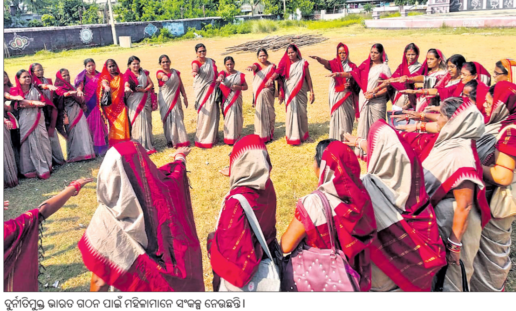
ଦୁର୍ନୀତିମୁକ୍ତ ଭାରତ ଗଠନ ପାଇଁ ପଞ୍ଜାବରେ ସଂକଳ୍ପ ନେଉଛନ୍ତି।

ଭିଜ୍ଞାନ ସଚେତନତା ସପ୍ତାହ ପାଳନ କରାଯାଉଛି, ନିଜ ବ୍ୟକ୍ତିଗତ ଆଚରଣରେ ଭୃଷ୍ଣାନ୍ତମୁକ୍ତ ସାଧୁତା ବଢ଼ାଇ ରଖି ଦେଶର ବିକାଶ ନିଗମ କୁଳ୍ପନା ପ୍ରାଥମିକ ପ୍ରଧାନ, ଲୁକ୍ଷ ଲୁକ୍ଷ ପ୍ରଶାସନ ପ୍ରମୁଖଙ୍କୁ ପ୍ରୋତ୍ସାହନ ଦେବାକୁ ପ୍ରୋତ୍ସାହନ ଦେଖାଯାଉଛି।