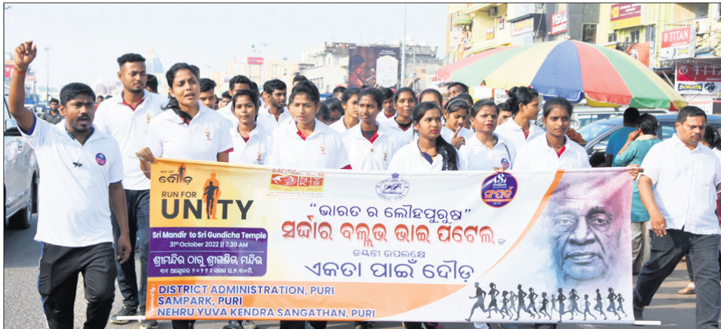
ଏକତା ଦିବସ ଅବସରରେ ସୋମବାର ପୁରୀ ସହରରେ ବାହାରିଥିବା ଏକତା ଦୌଡ଼।

ପୁରୀ ଅଫିସ, ୩୧୧୧୦: ଆଉଟ୍ ସୋର୍ସ କର୍ମଚାରୀ ମହାସଂଘ ପୁରୀ ଜିଲା ପକ୍ଷରୁ ଆଖଣ୍ଡଳମଣି ମନ୍ଦିର ପ୍ରାଙ୍ଗଣରେ ଆଉଟ୍ ସୋର୍ସ କର୍ମଚାରୀଙ୍କ ସମ୍ମିଳନୀ ଅନୁଷ୍ଠିତ ହୋଇଯାଇଛି।