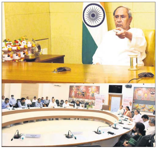
ପୁଣ୍ୟମନ୍ତ୍ରୀ ନବୀନ ପଟ୍ଟନାୟକ ସାମାଜିକ ସେବା ଯୋଜନା ଉପରେ ଗୁରୁତ୍ୱ ଦେଇଛନ୍ତି।

ଭୁବନେଶ୍ୱର, ୩୧.୧୧.୦ (ବୁଧବେଳା) ପୁଣ୍ୟମନ୍ତ୍ରୀ ନବୀନ ପଟ୍ଟନାୟକ ସାମାଜିକ ସେବା ଯୋଜନା ଉପରେ ଗୁରୁତ୍ୱ ଦେଇଛନ୍ତି।