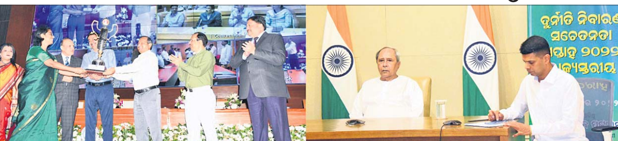
ଭୁବନେଶ୍ୱର, ୩୧.୧୧.୦ (ବୁଧବେଳା)

ଗରିବ ଓ ପଛଆବରଣ ନିକଟରେ ସରକାରଙ୍କ ସମସ୍ତ କର୍ମକ୍ରମ ଲାଗୁ କରିବା ପାଇଁ ପ୍ରୟାସ କରିବାକୁ ନିର୍ଦ୍ଦେଶ ଦିଆଯାଇଛି।