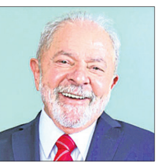
ଲୁଇଜ୍ ଜନାସିଓ ଲୁଲିଆ ତା ସିଲ୍ଭା

କେନ୍ଦ୍ର ବୋଲସୋନାରୋଙ୍କୁ ଏକ କଡ଼ା ମୁକାବିଲାରେ ହରାଇ ବାମପନ୍ଥ ନେତା ଲୁଲିଆ ଜନାସିଓ ଲୁଲିଆ ତା ସିଲ୍ଭା ରବିବାର ବ୍ରିଜାୟ ଥର ପାଇଁ ବ୍ରାଜିଲ ରାଷ୍ଟ୍ରପତି ନିର୍ବାଚିତ ହୋଇଛନ୍ତି। ୨୦ ବର୍ଷ ପୂର୍ବେ ସେ ବ୍ରାଜିଲ ରାଷ୍ଟ୍ରପତି ଭାବେ ପ୍ରଥମେ କିର୍ତ୍ତବ୍ୟ। ୯୯ ପ୍ରତିଶତ ଭୋଟ ଭୋଜର ସେମାନଙ୍କ ମତଦାନ ସାବ୍ୟସ୍ତ କରିଥିଲେ। ଲୁଲିଆଙ୍କ ସପକ୍ଷରେ ୫୦.୯ ପ୍ରତିଶତ ଭୋଟ ଯାଇଥିବାବେଳେ ବୋଲସୋନାରୋଙ୍କୁ ୪୯.୧ ପ୍ରତିଶତ ଭୋଟ ମିଳିଛି। ଏକ ଦୁର୍ଗତି ମାମଲାରେ ୨୦୧୮ରେ ୭୭