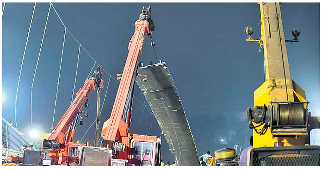
ଭାଙ୍ଗିଯାଇଥିବା ଯୋଗକୁ କ୍ରେନ୍ ସାହାଯ୍ୟରେ ଉଠାଯାଇଛି।

ନୂଆଦିଲ୍ଲୀ, ୩୧।୧୦(ପି.ଟି.): ନୂଆ ପାଲିମେଣ୍ଟ ବିଲ୍ଡିଂର କେତେକ ନିର୍ମାଣ କାର୍ଯ୍ୟ ସମାପ୍ତ। ପୂର୍ବରୁ ଶେଷ ହୋଇ ନ ଯାଇଥିବା ସେଥିପାଇଁ ଆଗାମୀ ଶୀତ ଅଧିବେଶନ ପୁରୁଣା ବିଲ୍ଡିଂରେ ଅନୁଷ୍ଠିତ ହେବା ସମ୍ଭାବନା ରହିଥିବା ଏକ ସୂତ୍ରରୁ ଜଣାପଡ଼ିଛି। ପାଲିମେଣ୍ଟର ଶୀତ ଅଧିବେଶନ ସାଧାରଣତଃ ନଭେମ୍ବର ତୃତୀୟ ସପ୍ତାହରେ ଆରମ୍ଭ ହୋଇଥାଏ। ଏହା ପୂର୍ବରୁ ନୂଆ ବିଲ୍ଡିଂ କାର୍ଯ୍ୟ ଶେଷ ହୋଇଯିବ ବୋଲି ସରକାର ଲକ୍ଷ୍ୟ ରଖିଥିଲେ। ହେଲେ ଧାର୍ଯ୍ୟ ସମୟ ମଧ୍ୟରେ ସମସ୍ତ କାର୍ଯ୍ୟ ଶେଷ ହୋଇ ନ ପାରେ ବୋଲି କୁହାଯାଇଛି। ବିଲ୍ଡିଂର ସିଲିକା କାମ ଶେଷ ହୋଇଥିବାବେଳେ ଶେଷ ସର୍ତ୍ତ, ଇଲେକ୍ଟ୍ରିକାଲ ଓ ଅନ୍ୟାନ୍ୟ କେତେକ କାର୍ଯ୍ୟ ଚଳିତ ବର୍ଷ ଶେଷ ପର୍ଯ୍ୟନ୍ତ ଚାଲି ରହିପାରେ। ଏଥିସହିତ ଆସବାବପତ୍ର, କାର୍ପେଟ, ଫ୍ଲୋ ମୁରାଲ ଓ ଅନ୍ୟାନ୍ୟ ଉପକରଣ କାର୍ଯ୍ୟ ମଧ୍ୟ ଚାଲି ରହିଛି। ତେଣୁ ବର୍ତ୍ତମାନ ସ୍ଥିତିରେ ସମ୍ପୂର୍ଣ୍ଣ ହେବାର ନିଶ୍ଚିତ ଭାବରେ କୁହାଯାଇପାରେନା।