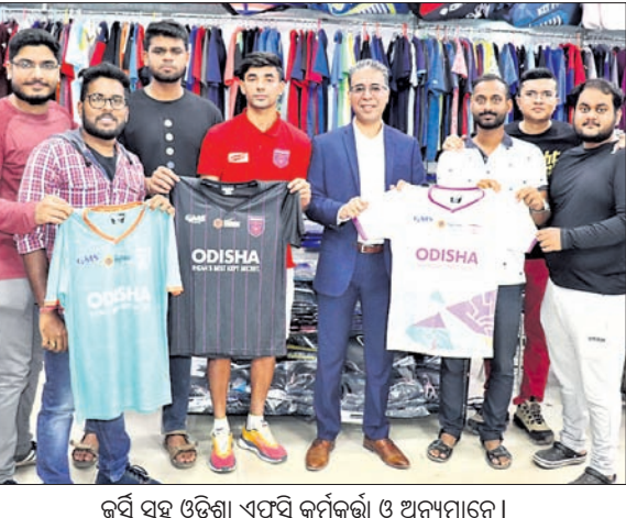
ଜର୍ସି ସହ ଓଡ଼ିଶା ଏଫସି କର୍ମଚାରୀ ଓ ଅଧିନାୟକମାନେ ।

ଭୁବନେଶ୍ୱର, ୧୧୧୧ (କ୍ରୀଡ଼ା ପ୍ରତିନିଧି): ଭୁବନେଶ୍ୱର ଏଫସିର ଲିଭ୍ (ଆଇସ୍‌ସ୍‌ଭି)ର ୨୦୨୨-୨୩ ସିଜନ୍ ପାଇଁ ଓଡ଼ିଶା ଏଫସି (ଓଏଫସି) ପ୍ରାଣୀକୃତ ପକ୍ଷରୁ ସହାର ଜର୍ସି ଅଫ୍‌ଲାଇନ୍‌ରେ ଲାଭ କରିବାକୁ ଲକ୍ଷ୍ୟ ରଖିଛନ୍ତି।