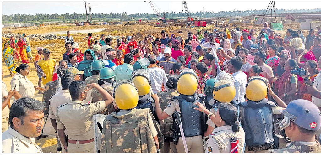
ପ୍ରକଳ୍ପ ସ୍ଥଳରେ ପୋଲିସ ଗ୍ରାମବାସୀଙ୍କୁ ଅଟକାଇଛି।

ନିର୍ମାଣ ନେଇ କୌଣସି ଜନଶୁଣାଣୀ ମଧ୍ୟ ହୋଇ ନ ଥିବା ଅଭିଯୋଗ ହୋଇଛି।