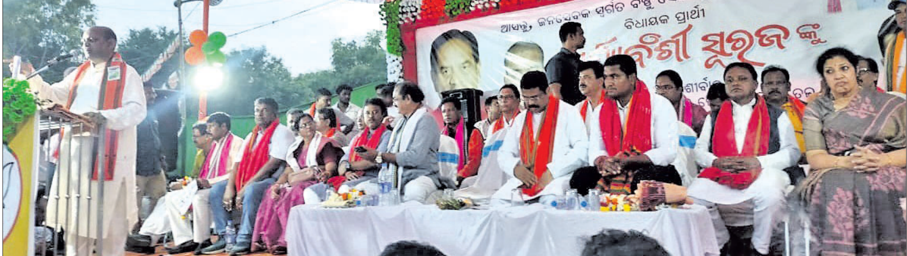
ଧାମନଗର ଧୁରୁଣାଠାରେ ଭାଜପାର ଜନସାମାଜିକରେ ଉପସ୍ଥିତ ଦଳୀୟ ପ୍ରାର୍ଥୀ ଏବଂ ନେତୃତ୍ୱ