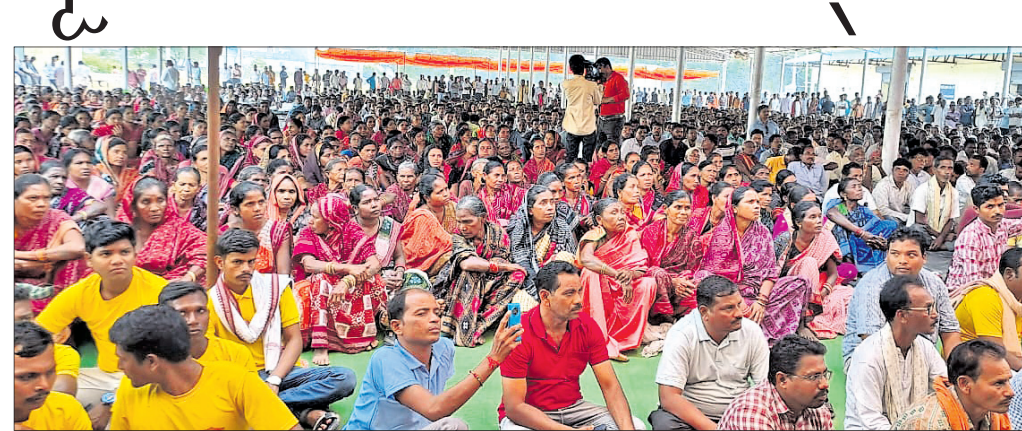
ସମାବେଶରେ ଉପସ୍ଥିତ ହଜାର ହଜାର ମହିଳା ପୁରୁଷ ଗଣ।

କୃଷକ ଚେତାବନୀ ସମାବେଶରେ ବାମାମାନଙ୍କୁ ଚେତାବନୀ ଦେବାକୁ ଅନୁରୋଧ କରାଯାଇଛି।