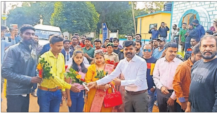
ଶିମିଳିପାଳ ବୁଲିବାକୁ ଆସିଥିବା ପର୍ଯ୍ୟଟକମାନଙ୍କୁ ସ୍ୱାଗତ କରାଯାଇଛି।

ଏସିଆ ମହାଦେଶର ବୃତ୍ତୀୟ ବୃହତ୍ତମ ଶିମିଳିପାଳ ଭାବେ ପ୍ରସିଦ୍ଧିଲାଭ କରିଥିବା ମଝରଭଞ୍ଜ ଜିଲ୍ଲା ଶିମିଳିପାଳ ଅଭୟାରଣ୍ୟ ମଝରଭଞ୍ଜରୁ ପର୍ଯ୍ୟଟକମାନଙ୍କ ପାଇଁ ଖୋଲାଯାଇଛି।