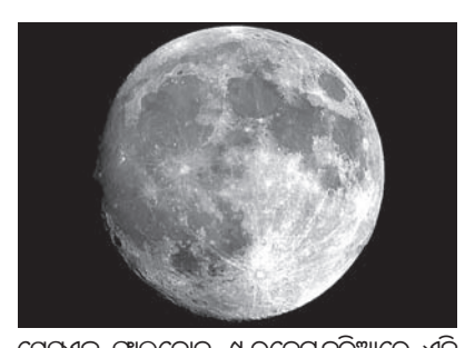
ସେନ୍‌ସର୍‌ସ୍‌ ଫାଇନୋନ-୯ ର କେନ୍ଦ୍ର କରିଆରେ ଏହି ଉପଗ୍ରହକୁ ଚନ୍ଦ୍ରକୁ ପଠାଇବା ବରଫ ଆକାରରେ ଥିବା ଜଳକୁ କିପରି ବିଶ୍ଳେଷ କରି ବ୍ୟବହାର ଉପଯୋଗୀ

ଓଶିଟର, ୧୧/୧୧ ଚନ୍ଦ୍ରପୂଷ୍ପରେ ଜୀବସତ୍ତାର ସନ୍ଧାନ ନେଇ ବହୁବର୍ଷ ଧରି ନାସା (ନ୍ୟାଶନାଲ ଏରୋନୋଟିକ୍ସ ଆଣ୍ଡ ସ୍ପେସ୍ ଆଡମିନିଷ୍ଟ୍ରେସନ୍)ର ବୈଜ୍ଞାନିକମାନଙ୍କ ଅଧ୍ୟୟନ ଚାଲି ରହିଛି। ଚନ୍ଦ୍ର ସମ୍ପର୍କରେ ଅନେକ ତଥ୍ୟ ବୈଜ୍ଞାନିକଙ୍କ ହସ୍ତରେ ହୋଇଯାଇଛି। ଜୀବଜଗତ ପାଇଁ ଜଳର ଆବଶ୍ୟକତା ଥିବାବେଳେ ଚନ୍ଦ୍ରରେ ବରଫ ଆକାରରେ ଥିବା ଜଳ ସମ୍ପର୍କିତ ଅଧିକ ତଥ୍ୟ ସଂଗ୍ରହ କରିବା ଆବେଶିକ। ନାସା ନାସା ଚନ୍ଦ୍ର ପୂଷ୍ପକୁ ଏକ ସାଟେଲାଇଟ୍ ବା ଉପଗ୍ରହ ପ୍ରେରଣ କରିବାକୁ ଯାଉଛି। ଆସନ୍ତା ୯ ଡିସେମ୍ବରରେ ନାସା