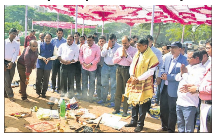
ଭୁବନେଶ୍ୱର, ୧୧/୧୧ (ବୁଧବୋ)