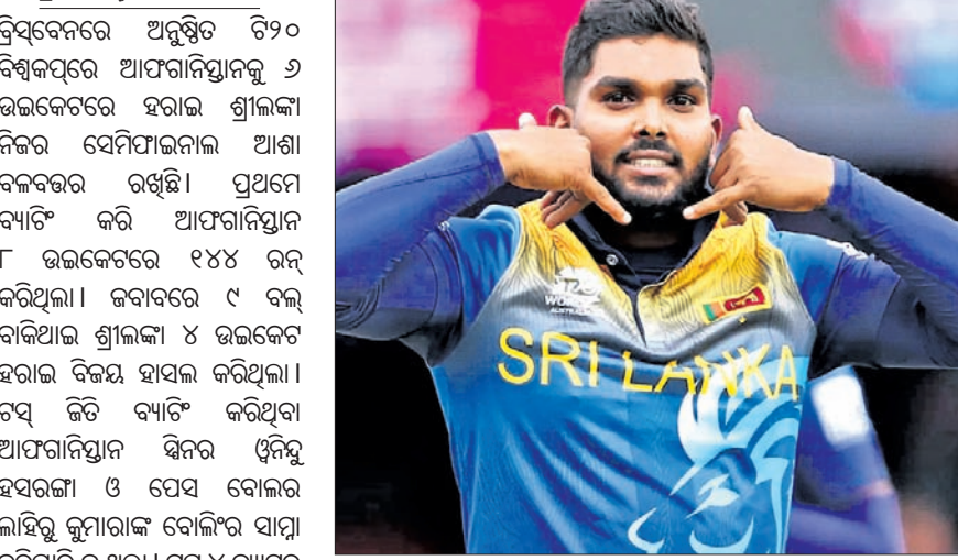
ଉଇକେଟ ନେବାପରେ ଖୁସି ହେଉଥିବା ପ୍ରତିକ୍ରିୟା ।

ଭୁବନେଶ୍ୱର, ୧୧୧୧ (ପି.ଟି.) ବିଶ୍ୱକପ୍ରେ ଆପୋନିସ୍ତାନକୁ ୬ ରନରେ ହରାଇ ଶ୍ରୀଲଙ୍କା ନିଜର ସେମିଫାଇନାଲ ଆଶା ବଳବତ୍ତର ରଖିଛି।