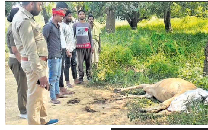
ନୂଆପଡ଼ା ଅଫିସ, ୧୧/୧୧