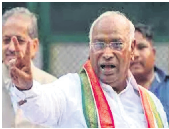
ହାଇଦ୍ରାବାଦରେ ଆୟୋଜିତ ଭାରତ ଯୋଡ଼ା ଯାତ୍ରାରେ କଂଗ୍ରେସ ଅଧକ୍ଷ ମଲ୍ଲିକାର୍ଜୁନ ଖାର୍ଚ୍ଚେ। ସୂଚନାଯୋଗ୍ୟ, ୩୨ ବର୍ଷ ପୂର୍ବରୁ ତାଙ୍କର ସଦ୍‌ଭାବନା ଯାତ୍ରା ଆରମ୍ଭ ଅର୍ଥାତ୍ ୧୯୯୦ ଅକ୍ଟୋବର ମଜଲିସ୍‌ରେ ଭାରତ ୧୯୯୦ରେ ତତ୍କାଳୀନ କଂଗ୍ରେସ ଯାତ୍ରାରେ ଅଧ୍ୟକ୍ଷମାନଙ୍କ ଅଧକ୍ଷ ରାଜୀବ ଗାନ୍ଧୀଙ୍କୁ ନିର୍ବାଚନ ପାଇଁ ପ୍ରାର୍ଥନା କରିଥିଲେ।

କଂଗ୍ରେସ ଅଧକ୍ଷ ଭାବେ ଦାୟିତ୍ୱ ଗ୍ରହଣ କରିବା ପରେ ବରିଷ୍ଠ ନେତା ମଲ୍ଲିକାର୍ଜୁନ ଖାର୍ଚ୍ଚେ ମଜଲିସ୍‌ରେ ପ୍ରଥମ ଥର ପାଇଁ ଦଳର ଭାରତ ଯୋଡ଼ା ଯାତ୍ରାରେ ସାମିଲ ହୋଇଛନ୍ତି। ଅପରାହ୍ନରେ ସେ ହାଇଦ୍ରାବାଦରେ ପହଞ୍ଚି ନେକଲେଭ୍ ରୋଡ୍‌ସ୍ଥିତ ଭକ୍ତରା ରାଜ୍ୟୀକ ପ୍ରତିମୂର୍ତ୍ତି ନିକଟରେ ଅନୁଷ୍ଠିତ ସଭାରେ ଉଦ୍‌ଘୋଷଣା ଦେଇଥିଲେ। ରାଜନୀତିରେ ଉପସାଧାରଣ ରାଜ୍ୟକୁ ଗଢ଼ାଉଁ ବଳର ଅନ୍ୟ ନେତା ଏବଂ ସମ୍ପର୍କମାନଙ୍କ ଗହଣରେ ଜାତୀୟ ପତାକା ଉଦ୍‌ଘୋଷଣା କରିଥିଲେ ଏବଂ ତାଙ୍କ ବାପା ପୂର୍ବତନ ପ୍ରଧାନମନ୍ତ୍ରୀ ରାଜୀବ ଗାନ୍ଧୀଙ୍କ ଫଟୋରେ ଶ୍ରଦ୍ଧାଘୂନ ଅର୍ପଣ କରିଥିଲେ।