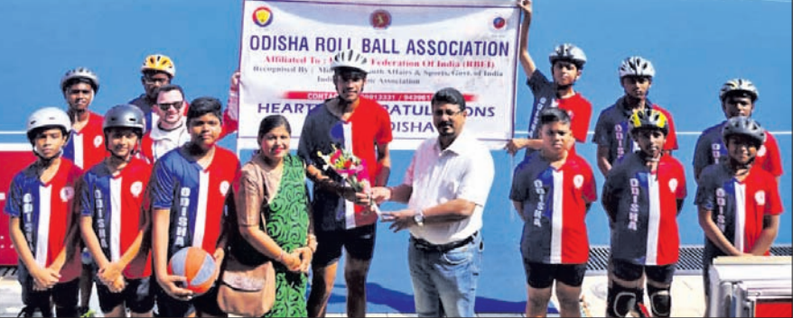
ପୂର୍ବାଞ୍ଚଳ ରୋଲ୍‌ବଲ୍ ପାଇଁ ମନୋନୀତ ଓଡ଼ିଶା ଦଳକୁ ମଙ୍ଗଳବାର ବିଦାୟ ସମ୍ବର୍ଦ୍ଧନା ଦିଆଯାଇଛି ।

ଭୁବନେଶ୍ୱର, ୧୧୧୧ (କ୍ରୀଡ଼ା ପ୍ରତିନିଧି): ବିହାର, ଛତିଶଗଡ଼, ଝାଡ଼ଖଣ୍ଡ, ଅନ୍ଧ୍ରାପ୍ରଦେଶ, ମେଘାଳୟ, ଓଡ଼ିଶା, ପଶ୍ଚିମବଙ୍ଗ ଓ ବିକିମ ଆଦି ୯ଟି ରାଜ୍ୟଦଳ ଅଂଶଗ୍ରହଣ କରିବେ।