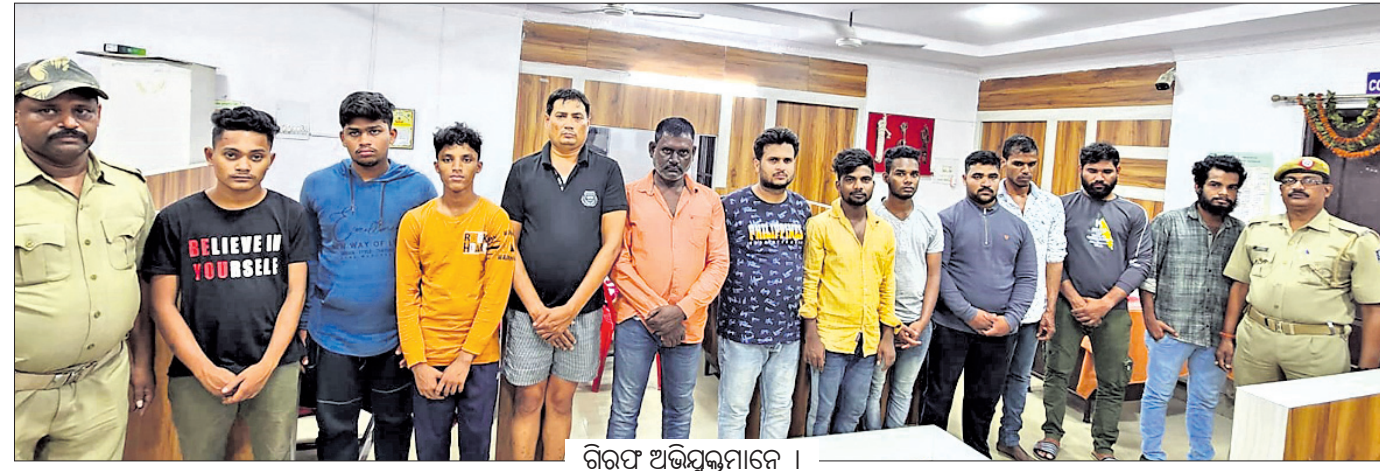
ଗିରଫ ଅଭିଯୁକ୍ତମାନେ ।