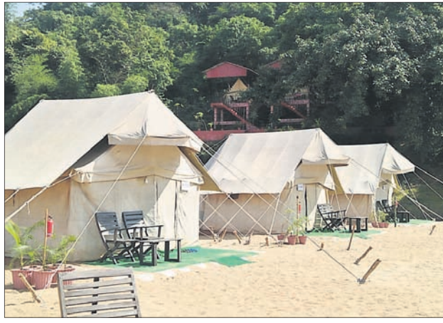
ସାତକୋଶିଆ ମହାନଦୀ ବିସ୍ତୀର୍ଣ୍ଣ ବାଲୁକା ଶଯ୍ୟାରେ ଟେଣ୍ଟ ନିର୍ମାଣ ଚାଲିଛି ।