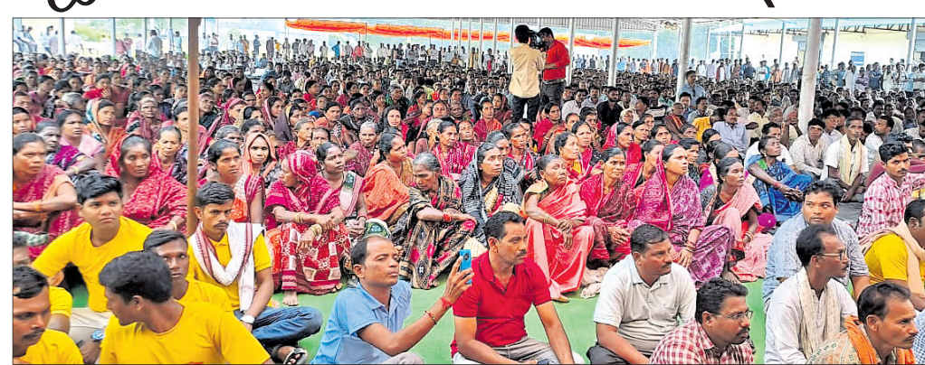
ସମାବେଶରେ ଉପସ୍ଥିତ ହଜାର ହଜାର ମହିଳା ପୁରୁଷ ଗଣ ।

କୃଷକ ଚେତାବନୀ ସମାବେଶରେ ଚାଷୀମାନେ ଉଦ୍‌ବୋଧନ ଦେଇ ସୋଭ ପ୍ରକାଶ କରିଛନ୍ତି ।