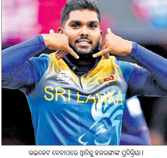
ଓଭରରେ ନେତାପରେ ଖିଲି ହସରଜାଙ୍କ ପ୍ରତିକ୍ରିୟା।

କ୍ରିସ୍ ବେନ୍, ୧୧୧୧ (ପି.ଟି.) କ୍ରିସ୍ ବେନରେ ଅନୁଷ୍ଠିତ ଟି୨୦ ବିଶ୍ୱକପ୍ରେ ଆଫଗାନିସ୍ତାନକୁ ୬ ଓଭରରେ ହରାଇ ଶ୍ରୀଲଙ୍କା ନିଜର ସେମିଫାଇନାଲ ଆଶା ବଳବତ୍ତର ରଖିଛି।