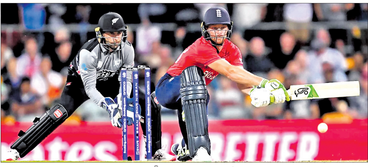
ଶର୍ ଖେଳିବା ଅବସରରେ ଚୋପ୍ ବଟଲର ।