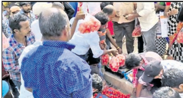
ବ୍ୟବସାୟୀମାନେ ଗଣଗୋଳ କରୁଛନ୍ତି।

ପରିପରିବା ଆଣି ଦାରିଦ୍ର୍ୟବିତ୍ତରେ ଗାଁରେ ଶସ୍ତ୍ରୀରେ ବିକ୍ରି କରୁଛନ୍ତି ଏହାକୁ ସ୍ଥାନୀୟ ପରିବା ବ୍ୟବସାୟୀ ବିରୋଧ କରୁଥିଲେ। ଦାରିଦ୍ର୍ୟବିତ୍ତ ବଜାରରେ ଟମାଟୋ କିଲୋ ପିଛା ୬୦ଟଙ୍କା ବିକ୍ରି କରୁଥିବା ବେଳେ ଭ୍ରାମ୍ୟମାନା ବ୍ୟବସାୟୀମାନେ ଗାଁରେ କିଲୋ ପିଛା ୨୫ ରୁ ୩୦ ଟଙ୍କାରେ ବିକ୍ରି କରୁଥିଲେ।