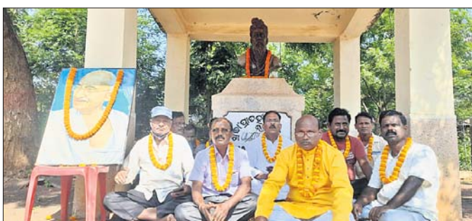
କଲେଜ ପରିସରରେ ପୁରାତନ ଛାତ୍ର ପରିଷଦ ପକ୍ଷରୁ ଧାରଣା ଦିଆଯାଇଛି।