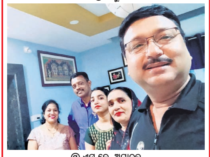
@ ଏସ୍.କେ. ଅମାନତ