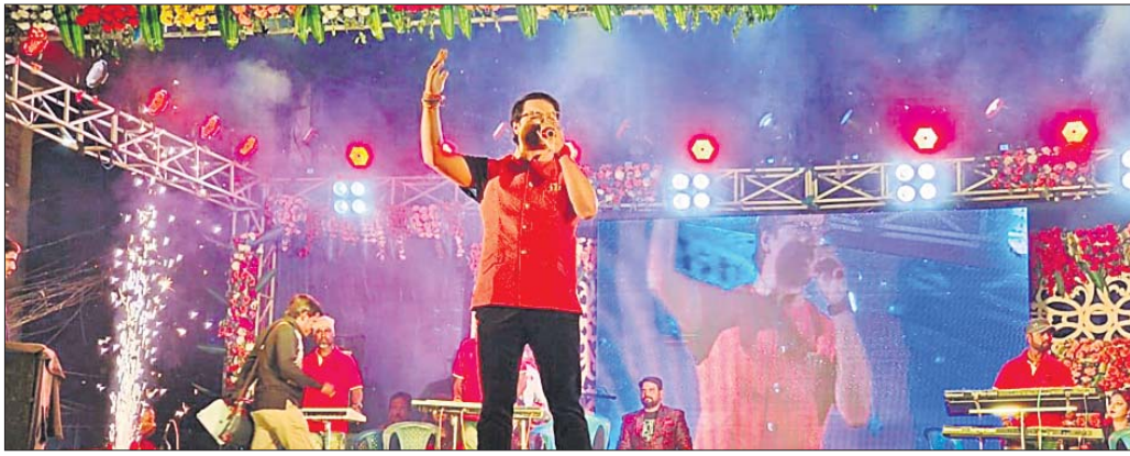
ମେଲୋଡି କାର୍ଯ୍ୟକ୍ରମରେ ଜଣେ କଳାକାର ସଙ୍ଗୀତ ପରିବେଷଣ କରୁଛନ୍ତି।

ଯାଜପୁର ସଦର, ୧୧୧ (ଡି.ଏନ.ଏ.) ଯାଜପୁରର ଗଣପତି କାଳୀପୂଜା ମଙ୍ଗଳଦୀର୍ଘ ଅଷ୍ଟମୀରେ ଦିନରେ ପହଞ୍ଚିଛି।