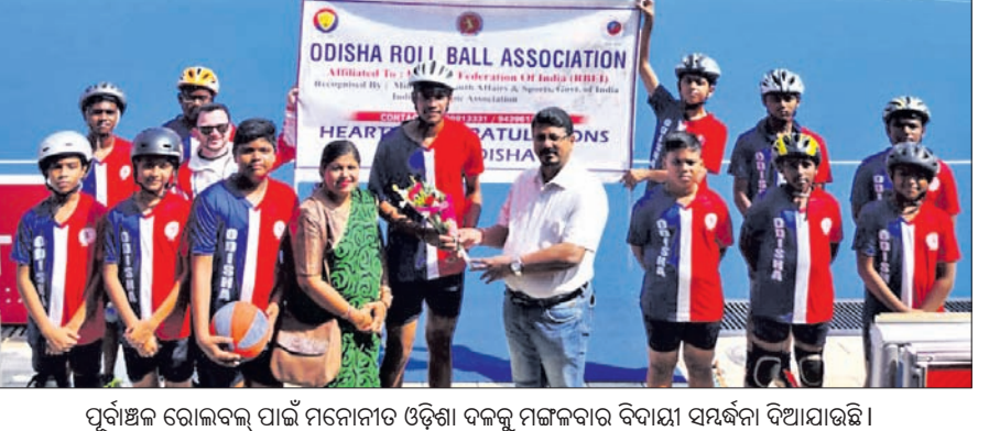
ପୂର୍ବାଞ୍ଚଳ ରୋଲ୍‌ବଲ୍ ପାଇଁ ମନୋନୀତ ଓଡ଼ିଶା ଦଳକୁ ମଙ୍ଗଳବାର ବିଦାୟ ସମ୍ବର୍ଦ୍ଧନା ଦିଆଯାଇଛି।

ଭୁବନେଶ୍ୱର, ୧୧୧୧ (କ୍ରୀଡ଼ା ପ୍ରତିନିଧି) ପୂର୍ବାଞ୍ଚଳ କାତାୟ ରୋଲ୍‌ବଲ୍ ଚାମ୍ପିୟନଶିପ୍ (୧୪ ବର୍ଷରୁ କମ୍)ର ଦ୍ୱିତୀୟ ସଂସ୍କରଣ ଆସାମର ଗୁଆହାଟୀରେ ଚଳିତ ମାସ ୪ରୁ ୬ ପର୍ଯ୍ୟନ୍ତ ଅନୁଷ୍ଠିତ ହେବ।