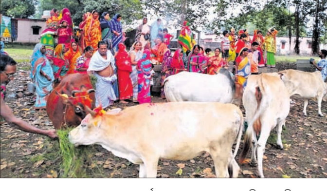
ଗୋଷ୍ଠାଷ୍ଟମୀ ଅବସରରେ ଗୋରୁଙ୍କୁ ପୂଜାର୍ଚ୍ଚନା ପରେ ଘାସ ଖାଇବାକୁ ଦିଆଯାଇଛି ।

ଖଣ୍ଡପଡ଼ା, ଖଳିଆସି, କୋସଳା, ଜଗନ୍ନାଥପ୍ରସାଦ, ବେଶାଗାଡିଆ, ସିଧାମୁଳା, ଶାଳଧରିଆ ଆଦି ଅଞ୍ଚଳରେ ମଙ୍ଗଳବାର ପବିତ୍ର ଗୋଷ୍ଠାଷ୍ଟମୀ ଉତ୍ସବ ପାରମ୍ପରିକ ରୀତିରେ ଅନୁଷ୍ଠିତ ହୋଇଯାଇଛି । ସେହିପରି କଣ୍ଠିଲୋ ଶ୍ରୀମାଳମାଧବ ଜାଉଳ ପାଠରେ ଗୋଷ୍ଠାଷ୍ଟମୀ ଉତ୍ସବ ପାରମ୍ପରିକ ରୀତିରେ ପାଳିତ ହୋଇଯାଇଛି । ଏହି ଅବସରରେ ଗ୍ଲାମୟ ରାଧାନୋହନ ଜାଉଳ ମଠରେ ଶ୍ରୀଜୀଉଙ୍କୁ ପୂଜାର୍ଚ୍ଚନା କରାଯାଇଥିଲା । ଅପରାହ୍ନ ପ୍ରାୟ ସାଢ଼େ ୪ଟାରେ ଶ୍ରୀଜୀଉଙ୍କ ବିଗ୍ରହକୁ ଏକ ଗୋଷାଘାତ୍ରାରେ ନିକଟସ୍ଥ ମାଘମେଳା ପଡିଆକୁ ବିକଳ କରାଯାଇଥିଲା । ସେଠାରେ ଗ୍ରାମର ସମସ୍ତ ଗୋରୁଙ୍କୁ ଏକାଠି କରାଯାଇ ଶ୍ରୀଜୀଉଙ୍କ ପୂଜାର୍ଚ୍ଚନା କରିବା ପରେ ଉପସ୍ଥିତ ମହିଳାମାନେ ଗୋମାତାଙ୍କୁ ବନ୍ଦୀପନା କରିଥିଲେ । ପରେ ସମସ୍ତ ଗୋରୁଙ୍କୁ ଘାସ ଓ ଖାଦ୍ୟ ପ୍ରଦାନ କରିଥିଲେ । ପୂଜାର୍ଚ୍ଚନା ପରେ ଶ୍ରୀଜୀଉ ମଠକୁ ପ୍ରତ୍ୟାବର୍ତ୍ତନ କରିଥିଲେ । ଏହି ପୂଜା ଦେଖିବାକୁ ଶ୍ରୀକାଳୀ ଓ କାର୍ତ୍ତିକ ବ୍ରତ ପାଳନ କରୁଥିବା ମହିଳାମାନଙ୍କ ସମାଗମ ହୋଇଥିଲା । ସେହିପରି ଅନୁରୂପ ଭାବେ ବାପୁଜୀ ନଗରସ୍ଥିତ ରଘୁନାଥ ଜାଉଳ ଚଳିତ ପ୍ରତିମାଙ୍କୁ ନିକଟସ୍ଥ ରାମଲୀଳାସ୍ଥଳକୁ ବିକଳ କରାଯାଇ ଗାନ୍ଧୀ ପାର୍କଠାରେ ସେ ଅଞ୍ଚଳର ଗୋରୁମାନଙ୍କୁ ଏକାଠି କରାଯାଇ ମହିଳାମାନେ ବନ୍ଦୀପନା କରି ଘାସ ଖାଇବାକୁ ଦେଇଥିଲେ । ସାମ୍ପ୍ରତିକ ପରିସ୍ଥିତିରେ ବିଭିନ୍ନ ଅଞ୍ଚଳରେ ଆବଶ୍ୟକ ଖାଦ୍ୟ ତଥା ଚାରଣ ଭୂମିର ଅଭାବ ସାଙ୍ଗକୁ ଗାଈ ଚରାଇବାକୁ ଗୋପାଳମାନଙ୍କ ଅଭାବ ଦେଖାଯାଇଛି । ଘରର ଏବେ ଲୋକ ଗାଈ ଗୋରୁ ରଖିବା ସମ୍ଭବ ହେଉନାହିଁ । ଫଳରେ ଗାଁ ଗଣ୍ଡାରେ ପୂର୍ବ ପରି ଗୋରୁ ଦେଖିବା ବିରଳ ହୋଇଗଲାଣି । ଗୋଷ୍ଠାଷ୍ଟମୀରେ ମହିଳାମାନେ ଘାସ ବିଛାଇ ରଖିଥିଲେ ମଧ୍ୟ ସେପରି ଆଖି ଦୁଃଖିଆ ଗୋରୁ ଦେଖିବାକୁ ମିଳି ନ ଥିଲା ।