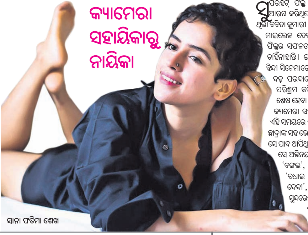
ସାନା ଫତିମା ଶେଖ