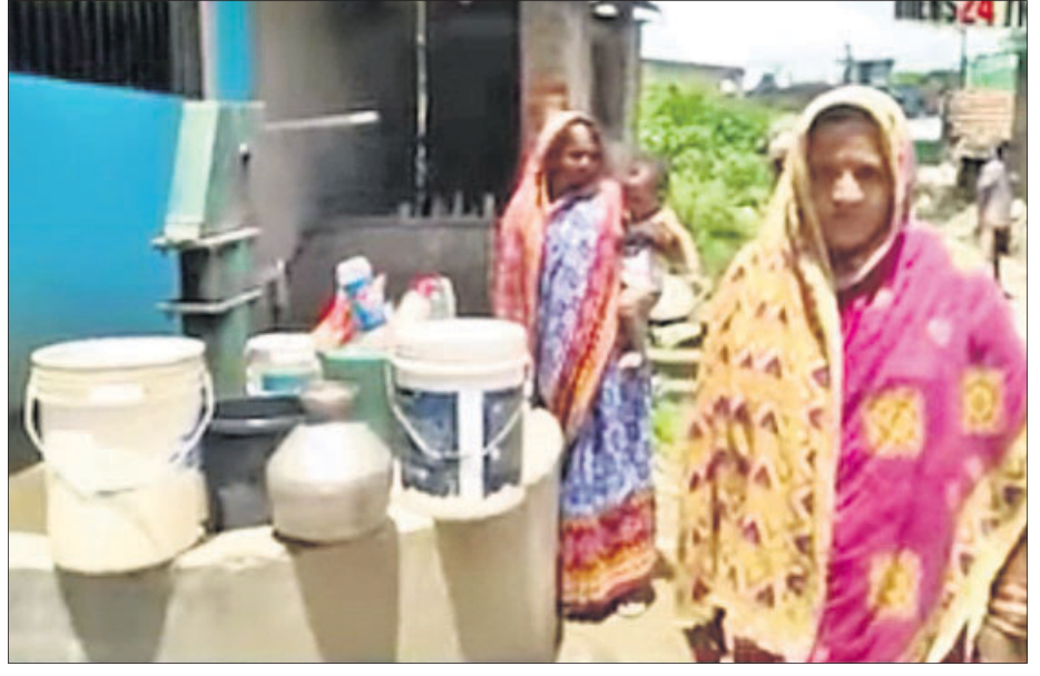
ନଳକୂପ ପାଖରେ ମହିଳାମାନେ ପାଣି ନେବାକୁ ଅପେକ୍ଷା କରୁଛନ୍ତି।

ବିଦ୍ୟୁତ୍ ବକେୟା ବିଲ ୧୦ଲକ୍ଷରୁ ଉର୍ଦ୍ଧ୍ୱ। ତା'ସାଙ୍ଗକୁ ବିଦ୍ୟୁତ୍ ଗ୍ରାହକମାନଙ୍କ ପୋଡ଼ି ଯିବାର ୭ ମାସ ହେଲାଣି । ଗ୍ରାମବାସୀ ୭ ମାସ ହେଲା ପାମାୟ ଜଳ ପାଇବାକୁ ବହୁତ ହୋଇଛନ୍ତି। ଫଳରେ ଅଶକ୍ତବାସୀ ବିଭିନ୍ନ ଜଳ ଉତ୍ସର ପାଣି ବ୍ୟବହାର କରି ନାନା ରୋଗରେ ଆକ୍ରାନ୍ତ ହେଉଥିବା ଅଭିଯୋଗ ହେଉଛି । ଏହି ସମସ୍ୟା ଖଣ୍ଡପଡ଼ା ବ୍ଲକ୍ ଅଧୀନ ବେଶାଗାଡ଼ିଆ ପଞ୍ଚାୟତ ବେଶାଗାଡ଼ିଆ ଗ୍ରାମର ୪ ଖର୍ଚ୍ଚ ବାସିନ୍ଦାଙ୍କୁ ତିନିଦିନ ପକାଇଛି । ଲୋକେ ନିକଟସ୍ଥ ନଦୀ, କୂଅ ଓ ପୋଖରୀର ଦୂଷିତ ପାଣି ବ୍ୟବହାର କରୁଛନ୍ତି । ଗ୍ରାମରେ ଥିବା ନଳକୂପର ପାଣି ଫ୍ଲୋରାଇଡ୍ ସମୃଦ୍ଧ ହୋଇଥିବାରୁ ସେହି ପାଣିକୁ ବ୍ୟବହାର କରି ଲୋକେ ବିଭିନ୍ନ ରୋଗରେ ଆକ୍ରାନ୍ତ ହେଉଥିବା ଗ୍ରାମବାସୀ କହିଛନ୍ତି । ସୂଚନା ଅନୁଯାୟୀ, ୨୪ଟି ଖର୍ଚ୍ଚ ଚଥା ୭ ମୌଜାକୁ ନେଇ ଗଠିତ ବେଶାଗାଡ଼ିଆ ପଞ୍ଚାୟତ । କେବଳ ବେଶାଗାଡ଼ିଆ ଗ୍ରାମର ୧,୨,୩ ଓ ୪ନଂ. ଖର୍ଚ୍ଚର ପ୍ରାୟ ୨ ହଜାର ଲୋକମାନଙ୍କ ପାଇଁ ନିର୍ମାଣ କରାଯାଇଥିଲା ପାମାୟ ଜଳ ଯୋଗାଣ ପ୍ରକଳ୍ପ । ହେଲେ ଗତ ୭ ମାସ ହେବ ବିଦ୍ୟୁତ୍ ଗ୍ରାହକମାନଙ୍କ