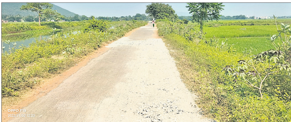
ରାସ୍ତା ନିର୍ମାଣ କରାଯାଉଛି।

ଯାଜପୁର ଜିଲ୍ଲା ବଡ଼ଚଣା ବ୍ଲକ୍ ଅନ୍ତର୍ଗତ ବୈରାଠାଠୁ ଚଣ୍ଡିଖୋଳ ପର୍ଯ୍ୟନ୍ତ ରାସ୍ତା ନିର୍ମାଣ ପାଇଁ ଚେଷ୍ଟର ପ୍ରକ୍ରିୟା ଶେଷ ହୋଇଯାଇଛି।