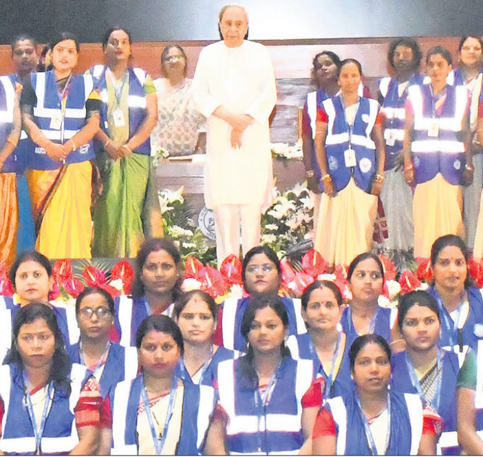
ଲୋକସେବା ଭବନ କନଭେନସନ ସେଠାରେ ଆୟୋଜିତ ଦକ୍ଷତା ବୃଦ୍ଧି କାର୍ଯ୍ୟକ୍ରମରେ ମୁଖ୍ୟମନ୍ତ୍ରୀ ନବୀନ ପଟ୍ଟନାୟକଙ୍କ ସହ କର୍ମଚାରୀ

ଭୁବନେଶ୍ୱର, ୨୧୧୧ (ବୁଧବେ) ଲୋକସେବା ଭବନ କନଭେନସନ ସେଠାରେ ଆୟୋଜିତ ଦକ୍ଷତା ବୃଦ୍ଧି କାର୍ଯ୍ୟକ୍ରମରେ ମୁଖ୍ୟମନ୍ତ୍ରୀ