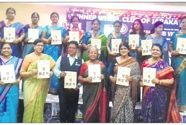
ଇନରହୁଇଲ କ୍ଲବ ମୁଖପତ୍ର 'ଅସ୍ମିତା' ଉନ୍ମୋଚିତ ହୋଇଛି।