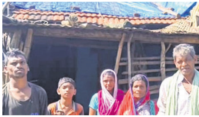
ପାଇଁ ତଳେ ରହୁଥିବା ପରିବାର। ମଞ୍ଜୁରିଆ କରି ଚଳନ୍ତି ପରିବାର। ନିଜର ବୋଲି କିଛି ଜମି ନାହିଁ। ୨୫ ବର୍ଷ ତଳେ ଖଣ୍ଡିତ ବାସସ୍ଥାନ ଦେଇଥିଲେ ସରକାର, ସେହି ଜାଗାରେ ଖାତି ମାଟିରେ ଘର ଖଣ୍ଡିତ

କରି ରହି ଆସୁଛନ୍ତି ପୂର୍ଣ୍ଣସମ୍ପତ୍ତି ପରିବାର। ହେଲେ ବର୍ଷା ଦିନ ହେଲେ ଖାତି ମାଟି ଘର ଭାଙ୍ଗି ଯାଉଛି, ଘରେ ପାଣି ଗଲୁଥିବା ଯୋଗୁଁ କିଛି ଭଙ୍ଗା ଚିଣା ପକାଇଥିବା ସହ ପାଇଁ ଗଣି ବର୍ଷା ଦାଉରୁ ରକ୍ଷା ପାଇଛନ୍ତି।