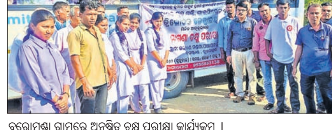
ରୁରୋପୁଣ୍ୟା ଗ୍ରାମରେ ଅନୁଷ୍ଠିତ ଚଷ୍ମା ପରୀକ୍ଷା କାର୍ଯ୍ୟକ୍ରମ ।