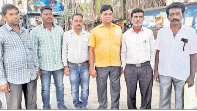
ଜିଲ୍ଲାପରିଷଦ ଅଧିକାରୀଙ୍କ ସମ୍ମୁଖରେ ପଞ୍ଚାୟତ ସମିତି ସଦସ୍ୟମାନେ।