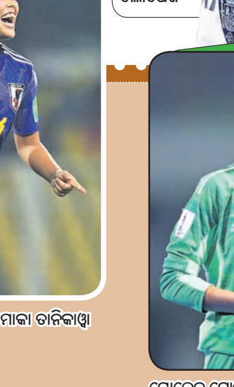
ଗୋଲ୍ଡେନ ଗ୍ଲୋବ୍ ସହ ସୋଫିଆ ପୁଏଷ୍ଟେ