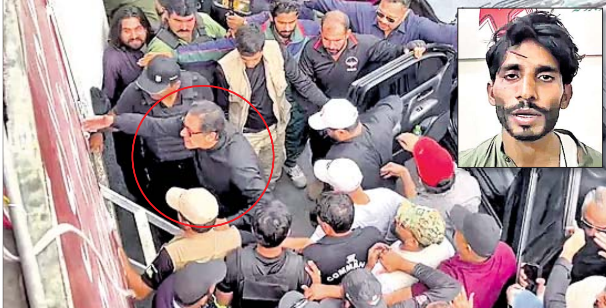
କଞ୍ଚେନଦରେ ଶୋଭାଯାତ୍ରାରେ ଯାଉଥିବାବେଳେ ପିଟିଆଇ ଅଧ୍ୟକ୍ଷ ଇମ୍ରାନ୍ ଖାନଙ୍କୁ ଗୁଳି କରି ହତ୍ୟା ଉଦ୍ୟମ। ଗୁଳି ଚକାଇଥିବା ଅଭିଯୁକ୍ତ ନାଭେବ (ଇନ୍ସପେକ୍ଟର)।