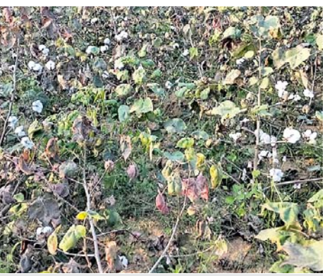
ଅମଳ ହେବାକୁ ଥିବା ବଲାଲମାନେ କିଲ ବେଳପତ୍ର ଅଞ୍ଚଳର ଏକ କପା କିଆରି।

ପଶ୍ଚିମ ଓ ଦକ୍ଷିଣ ଓଡ଼ିଶାର ବିସ୍ତୃତ ଅଞ୍ଚଳରେ ଦୀର୍ଘବର୍ଷ ହେଲା ଚାଷୀ ଉତ୍ପାଦିତ ହୋଇ ଅର୍ଥକରା କପାଚାଷ କରୁଛନ୍ତି। ଧଳାସୁନା ଅଞ୍ଚଳ ଭାବେ ପରିଚିତ ଏହି ଉତ୍ପାଦନ ଅନୁକୂଳ ଜଳବାୟୁ ଏବଂ ଭୂମିରୁପ କପାକୁ ସୁହାଇଛି। ଏଠାକାର ଉତ୍କଳ କପା ବେଶ ବିଦେଶକୁ ରପ୍ତାନି ହେଉଛି। ସମଗ୍ର ଓଡ଼ିଶାରେ ବାର୍ଷିକ ୧ ହଜାର କୋଟିରୁ ଉର୍ଦ୍ଧ୍ୱ ଟଙ୍କାର କାରବାର କେବଳ ଏହି କ୍ଷେତ୍ରରୁ ଆସୁଛି। ସାଧାରଣତଃ କପା କିଆରିରେ କୀଟ ଲାଗିଲେ କୀଟନାଶକ ସ୍ତ୍ରାଭା ଚାଷୀ ନିସ୍ତାର ପାଇଥାଏ। ମାତ୍ର ସରକାରୀସ୍ତରରେ ଉପଯୁକ୍ତ ପଦକ୍ଷେପ ଅଭାବରୁ ଅମଳ ପୂର୍ବରୁ ଧଳାସୁନାରେ ଆକ୍ରମଣ ଓ ମହାରାଷ୍ଟ୍ରର ବଲାଲମାନେ କୀଟ ଉଲ୍ଲି ଲାଗିଯାଇଛନ୍ତି।