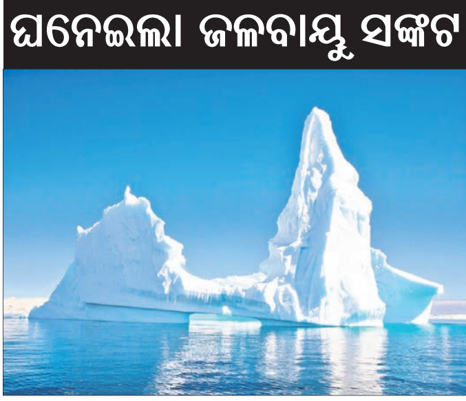
ଘନେଇଲା ଜଳବାୟୁ ସଙ୍ଗଠନ

ଝାଣ୍ଟିନ, ୩।୧୧ ଜଳବାୟୁ ପରିବର୍ତ୍ତନ ଓ ବିଶ୍ୱତାପନ ଯୋଗୁ ଆମେରିକାର ଯଲୋଷ୍ଟୋନ୍ ପାର୍କ, ଇଟାଲୀର ଡୋଲୋମାଇଟ୍ ଏବଂ ଚାଞ୍ଚାନିଆର ମାଉଣ୍ଟ କଲିମାଞ୍ଜାରୋ ସମେତ ବିଶ୍ୱର ଅନେକ ପ୍ରସିଦ୍ଧ ହିମବାହ ୨୦୪୦ ପୂର୍ବ ଚଳିଯିବ ବୋଲି ଜାତିସଂଘ ପକ୍ଷରୁ ପ୍ରକାଶିତ ଏକ ରିପୋର୍ଟରେ ଉଲ୍ଲେଖ କରାଯାଇଛି। ଜାତିସଂଘର ଶୈକ୍ଷିକ, ବିଜ୍ଞାନିକ ଓ ସାଂସ୍କୃତିକ ସଙ୍ଗଠନ (ୟୁନେସ୍କୋ) ରିପୋର୍ଟ ଅନୁସାରେ ୫୦ ବିଶ୍ୱ ଐତିହ୍ୟ ସ୍ଥଳରେ ଥିବା ପ୍ରାୟ ୧୮,୬୦୦ ଗ୍ରେସିୟର୍ସ ମଧ୍ୟରୁ ଏକତୃତୀୟାଂଶ ୨୦୪୦ ପୂର୍ବ ଉତ୍ତର ହୋଇଯିବ। ତାପମାତ୍ରା ବୃଦ୍ଧିକୁ ୧.୫ ଡିଗ୍ରୀ ସେଲସିୟସ୍ (୨.୭ ଡିଗ୍ରୀ ଫାରେନ୍‌ହାଇଟ୍) ମଧ୍ୟରେ ସୀମିତ ରଖାଯାଇପାରିଲେ ଅବଶିଷ୍ଟ ହିମବାହଗୁଡ଼ିକୁ