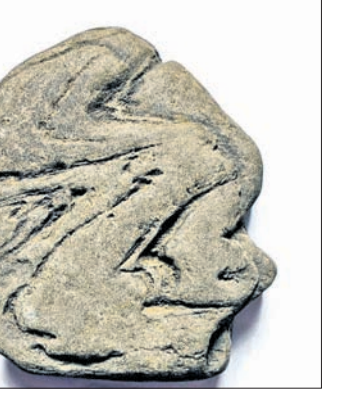
ଝୋପାଦା ନଦୀ ନିକଟ ଅଞ୍ଚଳରୁ ମିଳିଥିବା ପଥର।