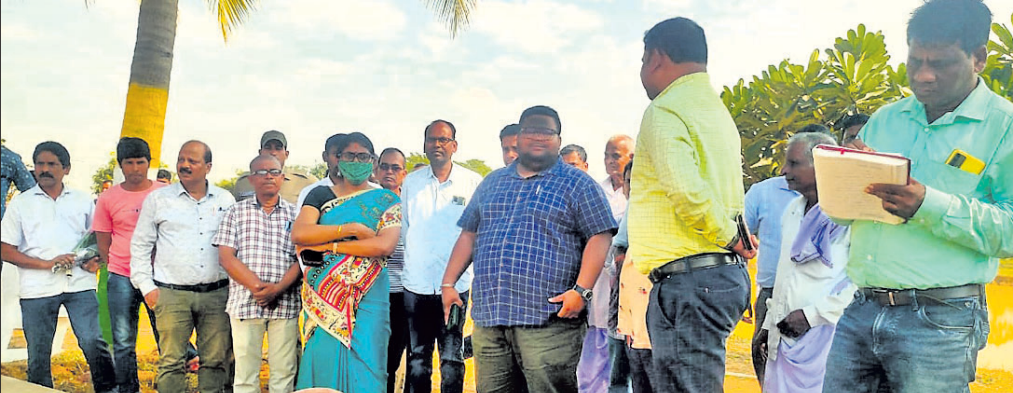
ଏନ୍ଏଚ୍ଏମ୍ ନିର୍ଦ୍ଦେଶିକାଙ୍କ ସହ ଅନୁଗୋଳ ଜିଲ୍ଲାପାଳ ବିଭିନ୍ନ ପ୍ରକଳ୍ପ ବୁଲି ଦେଖୁଛନ୍ତି।