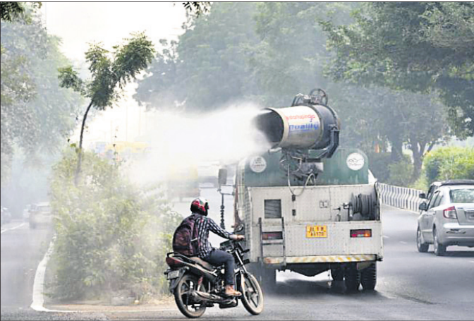
ପ୍ରଦୂଷଣ ରୋକିବା ପାଇଁ ନୂଆଦିଲ୍ଲୀର ଏକ ରାସ୍ତାରେ ପ୍ରଦୂଷଣ ପାଣି ସିଞ୍ଚନ କରାଯାଉଛି।