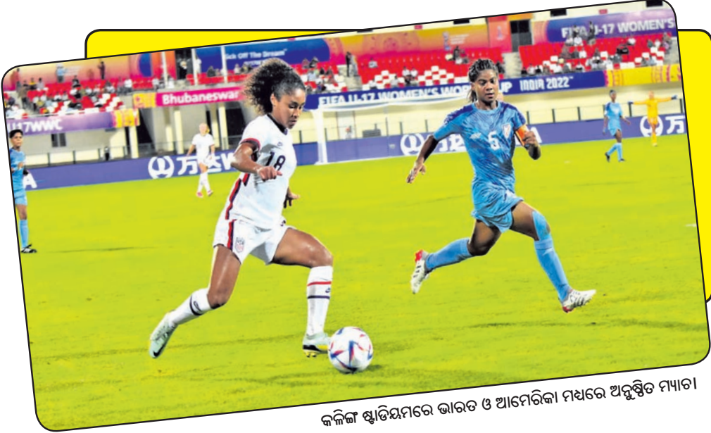
କଳିଙ୍ଗ ଷ୍ଟାଡ଼ିୟମରେ ଭାରତ ଓ ଆମେରିକା ମଧ୍ୟରେ ଅନୁଷ୍ଠିତ ମ୍ୟାଚ

ଆମେରିକା, ମରକ୍କୋ, ବ୍ରାଜିଲ, ଚିଲି ଓ ନାଇଜେରିଆ ଖେଳିଥିଲେ। ମାର୍ଗାଓସ୍ଥିତ ପଞ୍ଚିତ ଜବାହରଲାଲ ନେହେରୁ ଷ୍ଟାଡ଼ିୟମରେ ଗୁପ୍ତ ମ୍ୟାଚ ସହିତ ୨ଟି କ୍ୱାର୍ଟର ଫାଇନାଲ ଏବଂ ସେମିଫାଇନାଲ ଅନୁଷ୍ଠିତ ହୋଇଥିଲା। ନଭି ମୁୟାଲରେ ଗୁପ୍ତ ପର୍ଯ୍ୟାୟ, ୨ଟି କ୍ୱାର୍ଟର ଫାଇନାଲ ସମେତ ଅକ୍ଟୋବର ୩୦ରେ ମେଗା ଫାଇନାଲ ଖେଳାଯାଇଥିଲା। ଏଥିରେ ବିଜୟୀ ହୋଇ ସ୍ୱେଡ଼ିଶ ଇତିହାସ ରଚିଥିଲା। ସେହିପରି ନାଇଜେରିଆ ପ୍ରଥମଥରପାଇଁ ତୃତୀୟ ସ୍ଥାନ ହାସଲ କରି ବ୍ରୋଜି ପଦକ ପାଇଥିଲା। ଚୁର୍ନାମେଷ୍ଟରେ ମୋଟ ୩୨ଟି ମ୍ୟାଚ ଖେଳାଯାଇଥିବାବେଳେ