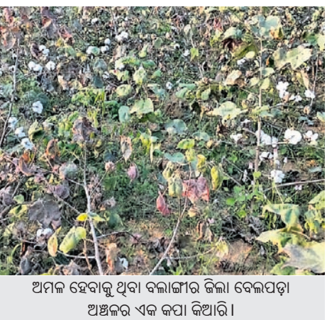
ଅମଳ ହେବାକୁ ଥିବା ବଲାଙ୍ଗୀର ଜିଲ୍ଲା ବେଳପଡ଼ା ଅଞ୍ଚଳର ଏକ କପା କିଆରି।

ପଶ୍ଚିମ ଓ ଦକ୍ଷିଣ ଓଡ଼ିଶାର ବିସ୍ତୃତ ଅଞ୍ଚଳରେ ଦୀର୍ଘବର୍ଷ ହେଲା ଚାଷ ଉତ୍ପାଦନ ହୋଇ ଅର୍ଥକରା କପାଚାଷ କରୁଛନ୍ତି। ଧଳାସୁନା ଅଞ୍ଚଳ ଭାବେ ପରିଚିତ ଏହି ଉତ୍ପାଦନ ଅନୁକୂଳ ଜଳବାୟୁ ଏବଂ ଭୂମିରୁପ କପାକୁ ସୁହାଇଛି। ଏଠାକାର ଉତ୍କଳ କପା ବେଶ ବିଦେଶକୁ ରପ୍ତାନି ହେଉଛି। ସମଗ୍ର ଓଡ଼ିଶାରେ ବାର୍ଷିକ ୧ ହଜାର କୋଟିରୁ ଉର୍ଦ୍ଧ୍ୱ ଟଙ୍କାର କାରବାର କେବଳ ଏହି କ୍ଷେତ୍ରରୁ ଆସୁଛି। ସାଧାରଣତଃ କପା କିଆରିରେ କୀଟ ଲାଗିଲେ କୀଟନାଶକ ସ୍ତ୍ରାଭା ଚାଷୀ ନିସ୍ତାର ପାଇଥାଏ। ମାତ୍ର ସରକାରୀସ୍ତରରେ ଉପଯୁକ୍ତ ପଦକ୍ଷେପ ଅଭାବରୁ ଅମଳ ପୂର୍ବରୁ ଧଳାସୁନାରେ ଆକ୍ରମଣ ଓ ମହାରାଷ୍ଟ୍ରର ବଲାଲମାନେ କୀଟ ଲାଗିଯାଇଛନ୍ତି।