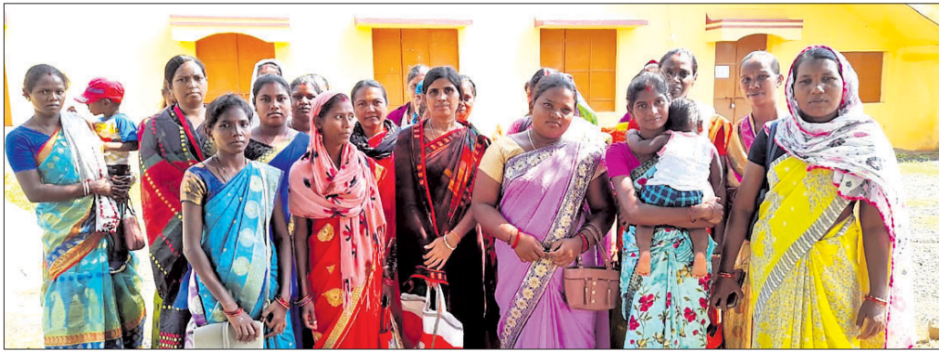
ଦାବିପତ୍ର ଦେବାକୁ ଆସିଥିବା କଳିକା କେନ୍ଦ୍ର କର୍ମଚାରୀ।

ସୁନ୍ଦରଗଡ଼ କଳିକା କେନ୍ଦ୍ର କଳିକା କେନ୍ଦ୍ର ଖେଳାଳୀମାନଙ୍କୁ ଏହି କଳିକା କେନ୍ଦ୍ରରେ ଗରିବ ମା'ବାପାମାନେ କାମ କରିବା ପାଇଁ ଗଲେ ନିଜ କୁଳି ଛୁଆକୁ କଳିକା କେନ୍ଦ୍ରରେ ଛାଡ଼ି ଦିଅନ୍ତେ। ସେଠାରେ କାର୍ଯ୍ୟରତ କ୍ରେଟ ମଦର ଓ କ୍ରେଟ ହେଲପର ଛୁଆମାନଙ୍କ ଯତ୍ନ ନେବା ସହ ଖାଇବା ପାଇଁ ଦେବେ ବୋଲି ସରକାର ଯୋଜନା କରିଛନ୍ତି। କେନ୍ଦ୍ରଗୁଡ଼ିକରେ ନିଯୁକ୍ତ ଥିବା କ୍ରେଟ ମଦର ଓ କ୍ରେଟ ହେଲପରଙ୍କୁ କୌଣସି ନିଯୁକ୍ତିପତ୍ର ଦିଆଯାଇନାହିଁ। ପାରିଶ୍ରମିକ ଟଙ୍କା କ୍ରେଟ ମଦରଙ୍କୁ ୫ ହଜାର ଥିବା ବେଳେ ୬ ହଜାର ଦିଆଯାଇଛି। କିନ୍ତୁ ୫ ହଜାର ଟଙ୍କା ନେଲେ ବୋଲି ଦସ୍ତଖତ କରିବାକୁ ବାଧ୍ୟ କରାଯାଇଛି। ସେହିପରି କ୍ରେଟ ହେଲପରଙ୍କ ଦରମା ୬ ହଜାର ଟଙ୍କା ଥିବାବେଳେ ୪ ହଜାର ଟଙ୍କା ଦିଆଯାଇଛି। ସୁପରଭାଇଜରଙ୍କୁ ଏକଥା କହିଲେ ଖରାପ ଶବ୍ଦରେ ଗାଳିଗୁଳି କରୁଛନ୍ତି। କୋମଳମତି ଶିଶୁମାନଙ୍କୁ