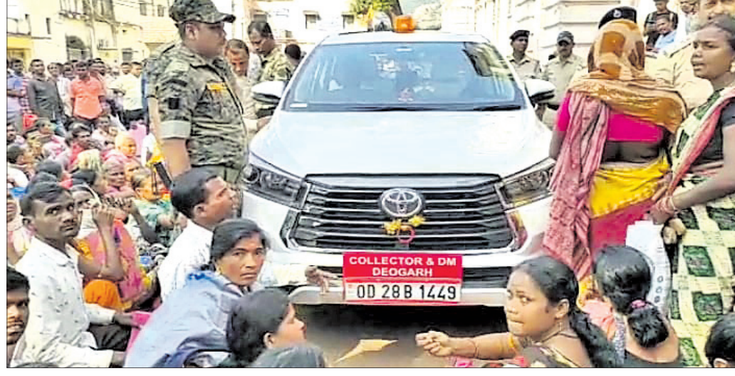
ଫସଲ ବୀମା ରାଶି ଦାବିରେ ଜିଲ୍ଲାପାଳଙ୍କୁ ଅଟକ