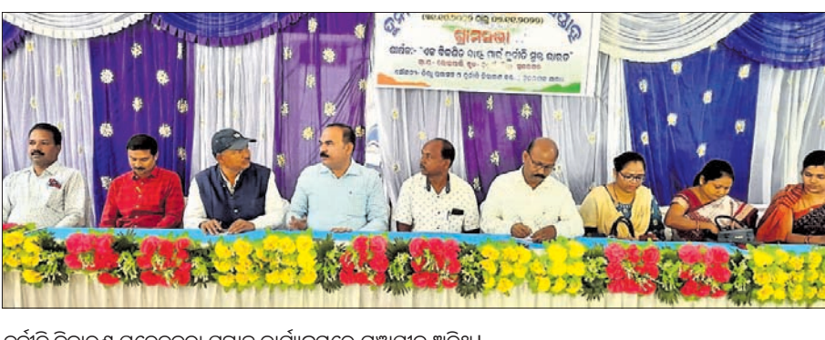
ଦୁର୍ନୀତି ନିବାରଣ ସଚେତନତା ସପ୍ତାହ କାର୍ଯ୍ୟକ୍ରମରେ ମହାସଭା ଅତିଥି।