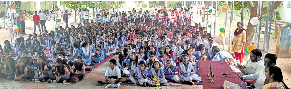
କାର୍ଯ୍ୟକ୍ରମରେ ଯୋଗଦେଇଥିବା ବିଭିନ୍ନ ସ୍କୁଲର ଛାତ୍ରଛାତ୍ରୀମାନେ।