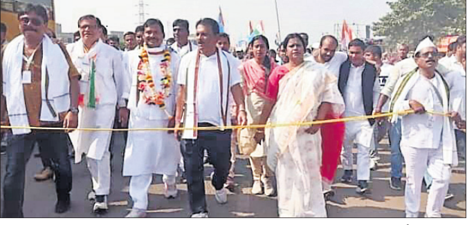
ଭାରତ ଯୋଡ଼ୋ ଯାତ୍ରାରେ ଗଣଗୋଳ ପ୍ରକଳ୍ପର ଉଦ୍ଦେଶ୍ୟ