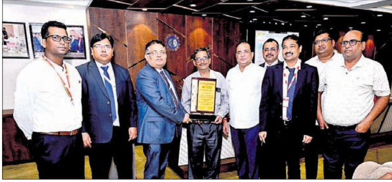
ସୁନିୟମ ବ୍ୟାଙ୍କ କର୍ମଚାରୀଙ୍କୁ ଉପସ୍ଥିତ କରିଥିବା

ସୁନିୟମ ବ୍ୟାଙ୍କ କର୍ମଚାରୀଙ୍କୁ ଉପସ୍ଥିତ କରିଥିବା ସମୟରେ ଅର୍ଥ ନେଇ ବ୍ୟବସାୟୀ ଶ୍ରେଣୀ ଆଇରନ୍ ଇଣ୍ଡଷ୍ଟ୍ରିରେ ଗ୍ରାହକମାନଙ୍କୁ ସୁବିଧା ଯୋଗାଇ ଦେବା ପାଇଁ ଏକ କର୍ମଶାଳା ଶୁକ୍ରାଦିନ ଅନୁଷ୍ଠିତ ହୋଇଛି। ଏହି କର୍ମଶାଳାରେ ସୁନିୟମ ବ୍ୟାଙ୍କ ଅଧିକାରୀଙ୍କୁ ଉପସ୍ଥିତ କରିଥିବା ସମୟରେ ଅର୍ଥ ନେଇ ବ୍ୟବସାୟୀ ଶ୍ରେଣୀ ଆଇରନ୍ ଇଣ୍ଡଷ୍ଟ୍ରିରେ ଗ୍ରାହକମାନଙ୍କୁ ସୁବିଧା ଯୋଗାଇ ଦେବା ପାଇଁ ଏକ କର୍ମଶାଳା ଶୁକ୍ରାଦିନ ଅନୁଷ୍ଠିତ ହୋଇଛି। ଏହି କର୍ମଶାଳାରେ ସୁନିୟମ ବ୍ୟାଙ୍କ ଅଧିକାରୀଙ୍କୁ ଉପସ୍ଥିତ କରିଥିବା ସମୟରେ ଅର୍ଥ ନେଇ ବ୍ୟବସାୟୀ ଶ୍ରେଣୀ ଆଇରନ୍ ଇଣ୍ଡଷ୍ଟ୍ରିରେ ଗ୍ରାହକମାନଙ୍କୁ ସୁବିଧା ଯୋଗାଇ ଦେବା ପାଇଁ ଏକ କର୍ମଶାଳା ଶୁକ୍ରାଦିନ ଅନୁଷ୍ଠିତ ହୋଇଛି।