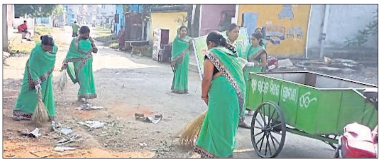
ବଡ଼ଗାଁର ଅନୁପୂର୍ଣ୍ଣା ସ୍ୱାସ୍ଥ୍ୟକେନ୍ଦ୍ର ନିହାଳମାନେ ରାସ୍ତା ସଫା କରୁଛନ୍ତି।

ବଡ଼ଗାଁ, ୪।୧୧(ଡି.ଏନ୍.ଏ.) ଧରି ବଡ଼ଗାଁ ବସ୍ତି ଓ ଲଟାପଡ଼ାର ବିଭିନ୍ନ ଗ୍ରାମକୁ ଯାଇ ପରିମଳ ସ୍ୱଚ୍ଛତା ପାଇଁ ବାହାରିଲେ ମହିଳାମାନେ। ଗାଁ ଓ ବର୍ଷାପ୍ରଭୃତିକୁ ଉଠାଇନେବ। ତେଣୁ ଘର ସମ୍ମୁଖରେ ଆବର୍ଜନା, ବର୍ଷାପ୍ରଭୃତିକୁ ଏଣେତେଣେ ନ ପକାଇ ଏକାଠି କରି ଠେଲି ଗାଡ଼ିରେ ବେବାକୁ ଘରଘର ବୁଲି ସଚେତନ କରାଉଛନ୍ତି ମହିଳା ଗୋଷ୍ଠୀ। ସୁନ୍ଦରଗଡ଼ ଜିଲା ବଡ଼ଗାଁରେ ଶୁକ୍ରବାର ସକାଳୁ ବଡ଼ଗାଁର ଅନୁପୂର୍ଣ୍ଣା ସ୍ୱାସ୍ଥ୍ୟକେନ୍ଦ୍ର ନିହାଳମାନେ ହାତରେ ଖାଲୁ, କୋଡ଼ି