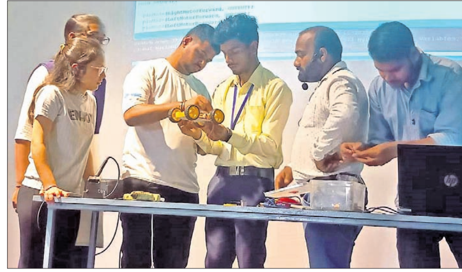
କର୍ମଶାଳାରେ ଛାତ୍ରଛାତ୍ରୀଙ୍କୁ ପ୍ରଦର୍ଶନ କରୁଛନ୍ତି ।