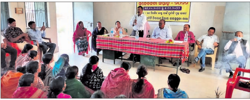
ଶପଥ ପାଠ ଉତ୍ସବ ।