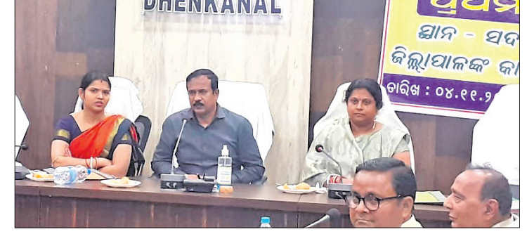
ବୈଠକରେ ପ୍ରଶ୍ନାବଳି ଅଧିକାରୀ ଏବଂ ଜନପ୍ରତିନିଧିମାନେ।

ଦେଈନାଳ ଜିଲ୍ଲା ଖାଉଡ଼ି ସୁରକ୍ଷା ପରିଷଦର ପ୍ରଥମ ବୈଠକ ଜିଲ୍ଲା କାର୍ଯ୍ୟାଳୟ ସଦ୍‌ଭାବନା ଗୃହରେ ଶୁକ୍ରବାର ଅନୁଷ୍ଠିତ ହୋଇଯାଇଛି। ପରିଷଦର ଅଧ୍ୟକ୍ଷ ତଥା ଜିଲ୍ଲାପାଳ ସରୋଜ କୁମାର ସେଠୀ ଏଥିରେ ଅଧ୍ୟକ୍ଷତା କରି ଖାଉଡ଼ିକୁ ଅଗ୍ରାଧିକାର ଦେବାକୁ ଆହ୍ୱାନ ଦେଇଥିଲେ। ବ୍ୟାପକ ସଚେତନତା ଏହାର ଉଦ୍ଦେଶ୍ୟକୁ ସଫଳ କରିବ। ପଞ୍ଚାୟତସ୍ତରରୁ ଆରମ୍ଭ କରି କୁଳ ଏବଂ ଜିଲ୍ଲାସ୍ତର ଯାଏ ଅଭିଯୋଗ ଗ୍ରହଣ କରାଯିବ। ନିୟମିତ ଯାଞ୍ଚ, ଗ୍ରାହକଙ୍କୁ ନ୍ୟାୟ ପ୍ରଦାନ ଉପରେ ଗୁରୁତ୍ୱ ଦିଆଯିବ ବୋଲି ଜିଲ୍ଲାପାଳ କହିଥିଲେ।