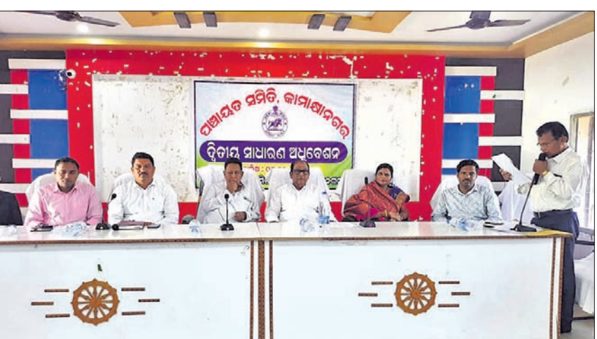
ବୈଠକରେ ମନ୍ତ୍ରୀ, ବିଧାୟକ, ବିଧିପକ୍ଷ ସମେତ ଅନ୍ୟମାନେ।