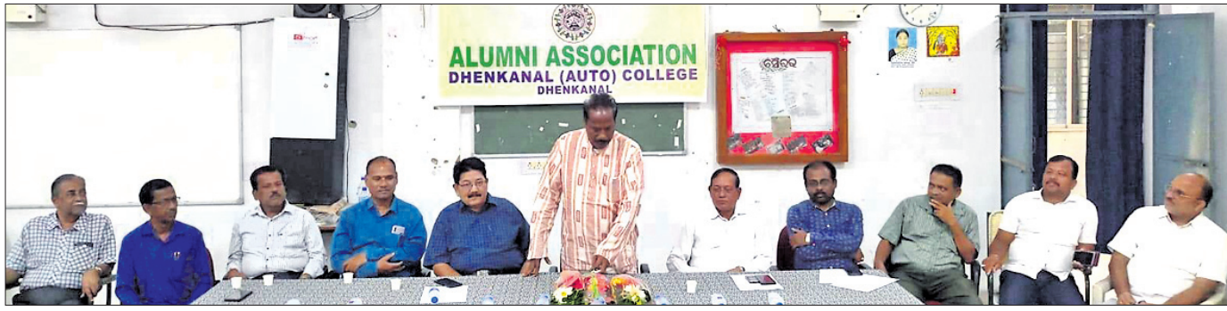
ଖବରଦାତା ସମ୍ମିଳନୀରେ ଏମ୍ପିଏସ୍ ସମେତ ଆଲୁମ୍ନି ଆସୋସିଏସନର ସଦସ୍ୟ ଓ ଅନ୍ୟମାନେ।

ରାଜ୍ୟର ଅନ୍ୟତମ ପୁରାତନ ଦେଈନାଳ ସ୍ୱୟଂଶାସିତ ମହାବିଦ୍ୟାଳୟ ସ୍ୱତନ୍ତ୍ର ପରିଚୟ ସୃଷ୍ଟି କରିଛି। ୧୯୫୯ରେ ପ୍ରତିଷ୍ଠିତ ଏହି ଶିକ୍ଷାନୁଷ୍ଠାନକୁ ୨୦୦୩ରେ ସ୍ୱୟଂଶାସିତ ମାନ୍ୟତା ମିଳିଛି। ବିଦ୍ୟାର ବିଷୟ କଲେଜର ନିକଟ ସ୍ଥାୟୀ ପଢ଼ା ଅନ୍ୟାନ୍ୟ ହୋଇପାରିନାହିଁ, ଯାହାକୁ ନେଇ ଉଦ୍ଦେଶ୍ୟ ବ୍ୟକ୍ତ କରିଛି ଆଲୁମ୍ନି ଆସୋସିଏସନ।