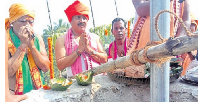
ମନ୍ଦିରର ରତ୍ନମୁଦ ପ୍ରତିଷ୍ଠା କରାଯାଇଛି।

ପୂର୍ଣ୍ଣାହୁତି କାର୍ଯ୍ୟ ସମ୍ପନ୍ନ କରିଥିଲେ। ସିଦ୍ଧେଶ୍ଵର ମିଶ୍ର ଏବଂ ତାଙ୍କ ସହଯୋଗୀ ପୁରୋଧା ବାୟୁ ଚୁଲାଇଥିଲେ।