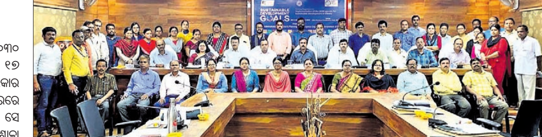
କର୍ମଶାଳାରେ ଜିଲ୍ଲାପାଳଙ୍କ ସମେତ ଅନ୍ୟମାନେ।

ଓଡ଼ିଶାର ଦୀର୍ଘସ୍ଥାୟୀ ବିକାଶ ପାଇଁ ୨୦୩୦ ପୁଞ୍ଜା ଜାତିସଂଘ ଦ୍ଵାରା ନିର୍ଦ୍ଧାରିତ ୧୭ ଲକ୍ଷ୍ୟ ହାସଲ ନିମନ୍ତେ ରାଜ୍ୟ ସରକାର ଯୋଜନା କରିଛନ୍ତି। ଏହାକୁ ଜିଲ୍ଲାସ୍ତରରେ କାର୍ଯ୍ୟକାରୀ କରିବା ପାଇଁ ଜିଲ୍ଲାପାଳଙ୍କୁ ନିର୍ଦ୍ଦେଶ ଦିଆଯାଇଛି। ଏହାପରେ ଦୀର୍ଘସ୍ଥାୟୀ ବିକାଶ ଲକ୍ଷ୍ୟ ପୂର୍ଣ୍ଣ କରିବା ପାଇଁ ଜିଲ୍ଲାପାଳଙ୍କୁ ନିର୍ଦ୍ଦେଶ ଦିଆଯାଇଛି।