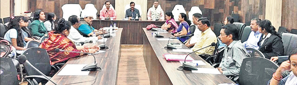
ଦୁର୍ନୀତି ନିବାରଣ ସଚେତନତା ସମ୍ପାଦକ କାର୍ଯ୍ୟକ୍ରମରେ ଜିଲ୍ଲାପାଳଙ୍କ ସମେତ ଅନ୍ୟମାନେ।