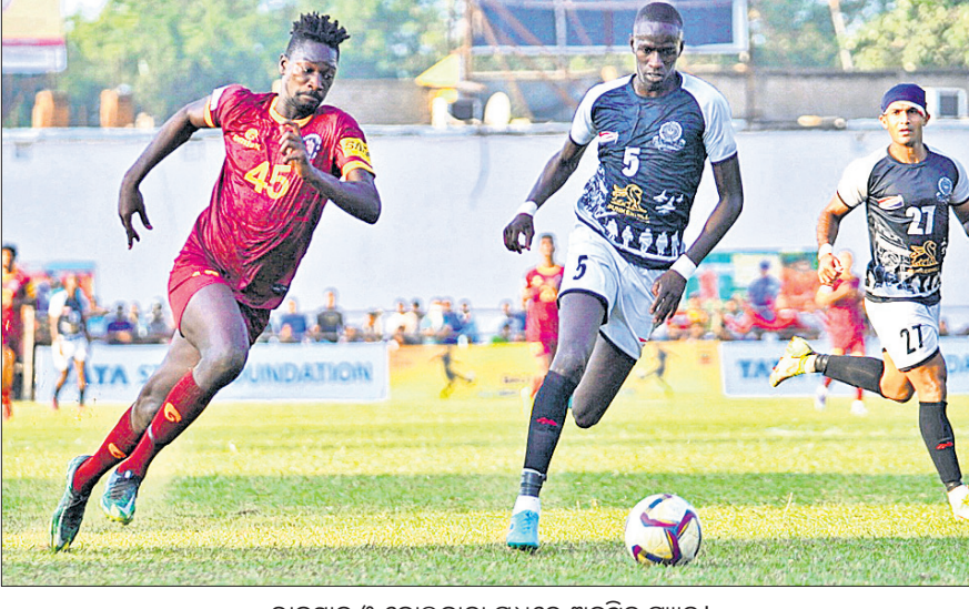
ରାଜସ୍ଥାନ ଓ କୋଲକାତା ମଧ୍ୟରେ ଅନୁଷ୍ଠିତ ମ୍ୟାଚ୍।

ଅନୁଗୋଳ ଅସିଏ, ୪।୧୧ ଅନୁଗୋଳ ସହର କଦମ୍ବ ପଡ଼ିଆଠାରେ ବାଜି ରାଉତ କପ୍ ଲାଡ଼ାୟ ଫୁଟବଲ ଚୁନାବଳରେ ୩ଟି କ୍ୱାର୍ଟର ଫାଇନାଲ ମ୍ୟାଚ୍ ଶୁକ୍ରବାର ଅନୁଷ୍ଠିତ ହୋଇଯାଇଛି। ଏଥିରେ ଚର୍ଚ୍ଚିତ ବ୍ରଦର୍ସ ଏସିଏ ଗୋଆ, ଶ୍ରୀନିଧି ଡେକାନ୍ ଏସିଏ ତେଲଙ୍ଗାନା ଓ ରାଜସ୍ଥାନ ଯୁଗାଳତେ ଏସିଏ ବିଜୟ