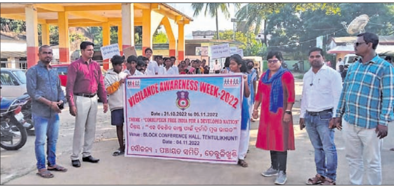
ଚେକ୍ଚୁଳିଖୁଣ୍ଟିରେ ଶୋଭାଯାତ୍ରା ସହର ପ୍ରକଳ୍ପ କରୁଛି।

ଭଲ ମଞ୍ଚ ସଂଯୋଜନା କରିଥିଲେ। ଛାତ୍ରା ଛାତ୍ର, ଅଧ୍ୟାପକ ଓ କର୍ମଚାରୀମାନେ ଦେଶରୁ ଦୁର୍ନୀତିର ମୂଳ ଉତ୍ପାଦନ ପାଇଁ ସାମୁହିକ ଶପଥ ନେଇ ଏକ ବିରାଟ ରାଲିରେ ଗ୍ରାମ ପରିକ୍ରମା କରିଥିଲେ।