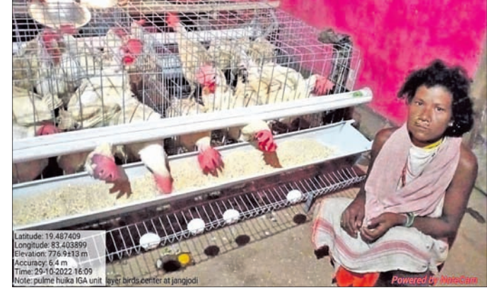
Power of Women

ରାଜ୍ୟ ସରକାରଙ୍କ ସ୍ୱତନ୍ତ୍ର ଆନୁଦାନ ଧାରା ଆଗେଇଛି। ଉଚ୍ଚ ଶିକ୍ଷିତ ତଜାରିଆ ମୁକ୍ତା ମୁକ୍ତଙ୍କୁ ଉପାଳନ ପଞ୍ଚାୟତ ଆଗକୁ ଯାଇ ୮ ତଜାରିଆ ମହିଳା ଏବଂ