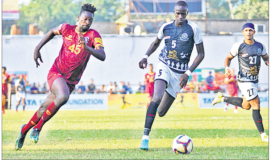
ରାଜସ୍ଥାନ ଓ କୋଲକାତା ମଧ୍ୟରେ ଅନୁଷ୍ଠିତ ମ୍ୟାଚ୍।

ଅନୁଗୋଳ ସହର କଦମ ପଡ଼ିଆଠାରେ ବାଜି ରାଉତ କପ୍ ଲାଡ଼ାୟ ପୁରବଳ ଚୁନିମେଣ୍ଟର ୩ଟି କ୍ୱାର୍ଟର ଫାଇନାଲ ମ୍ୟାଚ୍ ଶୁକ୍ରବାର ଅନୁଷ୍ଠିତ ହୋଇଯାଇଛି। ଏଥିରେ ଚର୍ଚ୍ଚିତ ବ୍ରଦର୍ସ ଏସିସି ଗୋଆ, ଶ୍ରୀନିଧି ଡେକାନ୍ ଏସିସି ତେଲଙ୍ଗାନା ଓ ରାଜସ୍ଥାନ ଯୁଦ୍ଧରେ ଏସିସି ବିଜୟ ହୋଇଥିଲା।