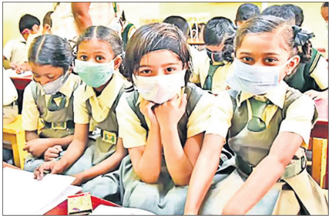
ଭୁବନେଶ୍ୱର, ୪।୧୧ (ବୁଧବେ)

କେନ୍ଦ୍ର ଶିକ୍ଷା ମନ୍ତ୍ରାଳୟ ଅଧୀନ ବିଦ୍ୟାଳୟ ଶିକ୍ଷା ବିଭାଗ ପକ୍ଷରୁ ପ୍ରକାଶିତ ପିଲିଆଇ ୨୦୨୦-୨୧ ରିପୋର୍ଟରେ ଶ୍ରେଣୀ ୧୦ ରାଜ୍ୟ ମଧ୍ୟରେ ଓଡ଼ିଶା ରହିଛି। ଏ ନେଇ ମୁଖ୍ୟମନ୍ତ୍ରୀ ନବୀନ ପଟ୍ଟନାୟକ ଶୁକ୍ରବାର ରୁଜ୍‌କର୍ମ କରି ପ୍ରଶଂସା କରିବା ସହିତ ରାଜ୍ୟ ଗଣଶିକ୍ଷା ବିଭାଗକୁ ଶୁଭେଚ୍ଛା ଜଣାଇଛନ୍ତି। ରିପୋର୍ଟ ଅନୁସାରେ, ୨୦୧୯-୨୦ ଶିକ୍ଷାବର୍ଷ ଡୁନାରେ ୨୦୨୦-୨୧ ଶିକ୍ଷାବର୍ଷରେ ଓଡ଼ିଶା ସମସ୍ତ ମାଟ୍ରିକ୍ରେ ଭଲ ପ୍ରଦର୍ଶନ କରିବା ସହ ଦେଶର ଆଗଧାଡ଼ିର ରାଜ୍ୟମାନଙ୍କ ମଧ୍ୟରେ ନିଜର ସ୍ଥିତିକୁ ସୁଦୃଢ଼ ରଖିଛି। ପିଲିଆଇ ୨୦୨୦-୨୧ରେ ୧୦୦୦ ପଦାଧିକାରୀ ଓଡ଼ିଶା ମୋଟ ୮୭୭ ପଦାଧିକାରୀ କରିଛି। ୨୦୧୯-୨୦ରେ ଓଡ଼ିଶା ଲେଭଲ ୪ (୮୦୦ରୁ ୮୪୯ ଷ୍ଟେର)ରେ ରହିଥିଲା।