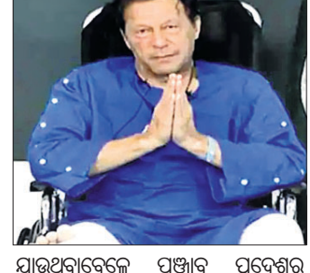
ଯାଇଥିବାବେଳେ ପଞ୍ଜାବ ପ୍ରଦେଶର ଓଡ଼ିଶାବାସୀଙ୍କୁ ଉପରକୁ ଗୁଳିମାଡ଼ ହୋଇଥିଲା। ଏହାର ପ୍ରତିବାଦରେ ଉତ୍ତରୀ ସମର୍ଥକମାନେ ବିଭିନ୍ନ ସହରରେ ବିରୋଧ କରିବା ସହ ରାସ୍ତା ଅବରୋଧ କରିଥିଲେ। ଫିକାବାଦରେ ପୋଲିସ୍ ସହ ବିରୋଧକାରୀଙ୍କ ସଂଘର୍ଷ ଘଟିଛି। ଅନ୍ୟପକ୍ଷେ ଆକ୍ରମଣ ବିଷୟରେ ପୂର୍ବରୁ ଅବଗତ ଥିବା ନେଇ ଇମ୍ରାନ୍ ଏକ ଭିଡ଼ରେ କହିଛନ୍ତି।

ପାକିସ୍ତାନର ପୂର୍ବତନ ପ୍ରଧାନମନ୍ତ୍ରୀ ଇମ୍ରାନ୍ ଖାନଙ୍କୁ ହତ୍ୟା ଉଦ୍ୟମ ଘଟଣାର ପ୍ରତିବାଦରେ ଉତ୍ତରୀ ସମର୍ଥକମାନେ ଶୁକ୍ରବାର ନମାଜ ପାଠ ପରେ ରାସ୍ତାକୁ ଓହ୍ଲାଇ ଦେଶବାସୀ ବିରୋଧ ପ୍ରଦର୍ଶନ କରିଥିଲେ। ଆକ୍ରମଣରେ ସମ୍ପୂର୍ଣ୍ଣ ଆଉ ୨ ଜଣ ସହିଷ୍ଣୁଙ୍କୁ ପାକିସ୍ତାନ ପଞ୍ଜାବ ପ୍ରଦେଶ ପୋଲିସ୍ ଗିରଫ କରିଛି। ଉକ୍ତ ସ୍ତରୀୟ ମୁଗ୍ଗ ତଦନ୍ତ କମିଟି (ଜେଆଇଟି) ଗଠନ କରି ଆକ୍ରମଣ ଘଟଣାର ପୂର୍ଣ୍ଣାବଳୀ ତଦନ୍ତ କରିବା ଲାଗି ପଞ୍ଜାବ ପ୍ରଦେଶକୁ ପାକ୍ ସରକାର ନିର୍ଦ୍ଦେଶ ଦେଇଛନ୍ତି। ଆକ୍ରମଣ ପଛରେ ସୁପରିକଳ୍ପିତ ସତ୍ୟରତ୍ନ ରହିଥିବା ଇମ୍ରାନ୍‌ଙ୍କ ଏକ ପାକିସ୍ତାନ ତେହରୀକ-ଇ-ଇନ୍‌ସାଫ (ପିଟିଆଇ) ପକ୍ଷରୁ କୁହାଯାଇଛି। ଟୁଇଟର ଇମ୍ରାନ୍ ପାକ୍ ସରକାରଙ୍କ ବିରୋଧରେ ବିରୋଧ ଶୋଭାଯାତ୍ରାରେ