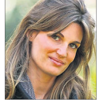
ଇମ୍ରାନ୍‌ଙ୍କ ପୂର୍ବତନ ସ୍ତ୍ରୀ ଜେନିମା ଗୋଲୁସିଥି