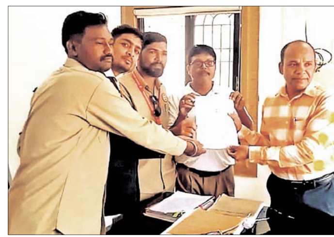
ଅତିରିକ୍ତ ଜିଲାପାଳ ଦାବିପତ୍ର ଗ୍ରହଣ କରୁଛନ୍ତି।