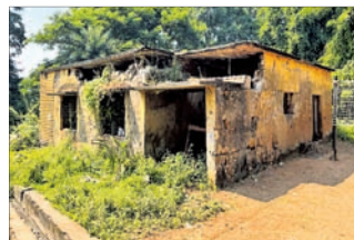
ଅବ୍ୟବହୃତ ସ୍ୱାସ୍ଥ୍ୟକେନ୍ଦ୍ର କୋଠା।

ଉଚ୍ଚ ୧୮ ଖଣ୍ଡ ଦୁର୍ଗମ ଗାଁ ଲୋକଙ୍କୁ ସ୍ୱାସ୍ଥ୍ୟ ସେବା ଯୋଗାଇଦେବା ଉଦ୍ଦେଶ୍ୟରେ ୩୦ ବର୍ଷ ତଳେ ନଦୀ ଅପରପାର୍ଶ୍ୱ ସ୍ଥାନୀୟଗୁଡ଼ାରେ ଏକ ପ୍ରାଥମିକ ସ୍ୱାସ୍ଥ୍ୟକେନ୍ଦ୍ର ପ୍ରତିଷ୍ଠା କରାଯାଇଥିଲା। ହେଲେ ପ୍ରତିଷ୍ଠାର ମାସେ ମଧ୍ୟରେ ଏହା ବନ୍ଦ ହୋଇଯାଇଥିଲା। ଏଠାରେ ନିୟୋଜିତ କର୍ମଚାରୀଙ୍କୁ ବସବାସ କରୁଥିବା ରାୟଗଡ଼ା ସଦର ବ୍ଲକ୍ ଅନ୍ତର୍ଗତ ହାଟଶେଖଣ୍ଡା ଏବଂ କେରଡ଼ା ପଞ୍ଚାୟତର ୧୮ ଖଣ୍ଡ ଗାଁରେ ଲୋକଙ୍କ ଛୁଟି ଦେଖିଲେ ଏହା ସ୍ପଷ୍ଟ ଅନୁଭବି। କେତେକ ଗାଁକୁ ରାସ୍ତା ନ ଥିବାବେଳେ ଆଉ କେତେକ ଗାଁରେ ଲୋକଙ୍କ ପାଇଁ ସ୍ୱାସ୍ଥ୍ୟସେବା ସ୍ୱପ୍ନ। ନାଗାବଳୀ ନଦୀ ଏମାନଙ୍କ ପାଇଁ ମୁଖ୍ୟରାସ୍ତା ଏବଂ ଖଡିଆ ଓ ସ୍ତେପର ରୋଗୀ ଓ ଗର୍ଭବତୀଙ୍କ ପାଇଁ