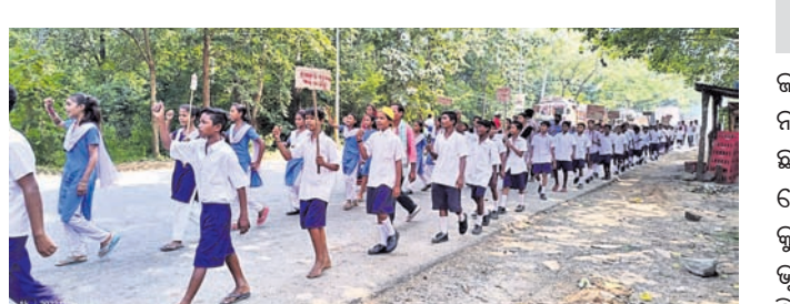
କ୍ରମିକ ଓ ପଥରକ୍ୱାଡ୍ରାଣ୍ଟର ଗାଳି ପ୍ରତିବାଦରେ ଛାତ୍ରାଛାତ୍ରୀଙ୍କ ଶୋଭାଯାତ୍ରା ।

ବୌଦ୍ଧ ଜିଲ୍ଲା ହରଭଙ୍ଗା ବ୍ଲକର ଖରବୁଲୁଆରେ ବନ୍ଦ ଥିବା କ୍ରମିକ ଓ ପଥର କ୍ୱାଡ୍ରାଣ୍ଟର ଗାଳି ପ୍ରଶାସନର ନିଷ୍ପତ୍ତି ପ୍ରତିବାଦରେ ୫ ଦିନ ହେଲା ଗ୍ରାମବାସୀ ସରାଠିଖୋଲ ରାସ୍ତାରେ ଧାରଣାରେ ବସିଛନ୍ତି।