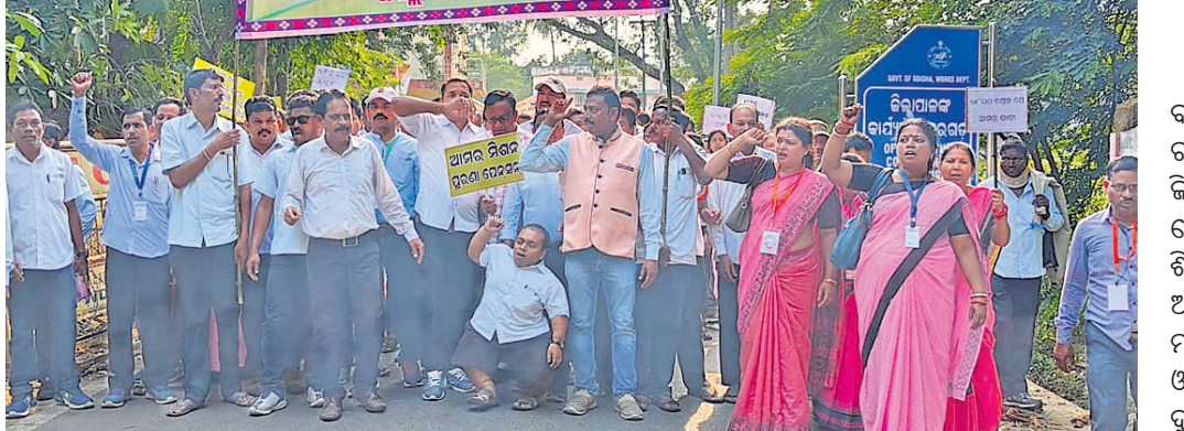
ପ୍ରାଥମିକ ଶିକ୍ଷକ ସଂଘର ଶୋଭାଯାତ୍ରା ।