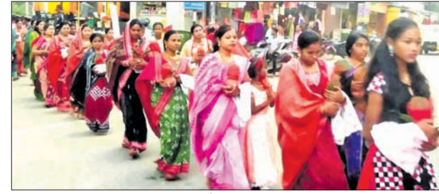
ହନୁମାନ ମନ୍ଦିର ରତ୍ନମୁଦ ସ୍ଥାପନ ପାଇଁ କଳସ ଶୋଭାଯାତ୍ରା ।

କରି ନିଜ ମନ ମୁତାବକ ସଂସ୍କୃତି ସିଦ୍ଧି ନାମକ ଏକ କମିଟି ଗଠନ କରିଛନ୍ତି। ଯାହା ବୈଧ ବୋଲି କେନ୍ଦ୍ର ସରକାର ଚିଠି କରିଥିବା ସତ୍ତ୍ୱେ ରାଜ୍ୟ ସରକାର ଗାଇତଲାଜନ ଓ ଚିଠିକୁ ଖାତିର ନ କରି ମନମାନି କରିବାକୁ ଚାଷୀ ବାମାରାଣି ପାଇବାରୁ ଏପର୍ଯ୍ୟନ୍ତ ବନ୍ଧୁତ ହୋଇଛନ୍ତି।