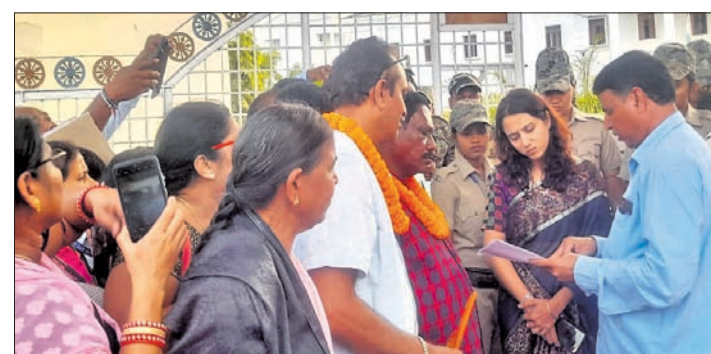
ଶିକ୍ଷକ ସଂଘ ପକ୍ଷରୁ ଜିଲ୍ଲାପାଳଙ୍କୁ ସ୍ମାରକପତ୍ର ପ୍ରଦାନ କରାଯାଇଛି ।

ସୁବର୍ଣ୍ଣପୁର ଜିଲ୍ଲା ମିଳିତ ପ୍ରାଥମିକ ଶିକ୍ଷକ ସଂଘ ପକ୍ଷରୁ ଶନିବାର ଜିଲ୍ଲା ସରକାର ମହକୁମା ସୋନପୁରରେ ରାଜି ଓ ବିରୋଧ ଅନୁଷ୍ଠିତ ହୋଇଯାଇଛି।