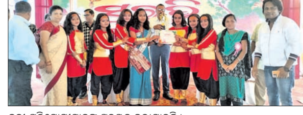
କୃତୀ ପ୍ରତିଯୋଗୀମାନଙ୍କୁ ପୁରସ୍କୃତ କରାଯାଇଛି ।