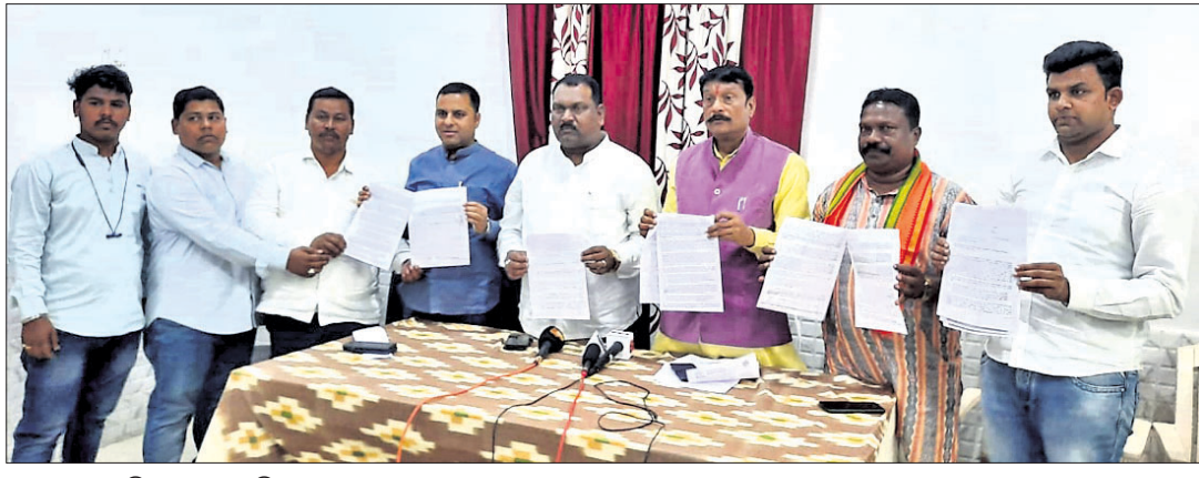
ଖବରଦାତା ସମ୍ମିଳନୀରେ ଉପସ୍ଥିତ ଭାଜପା ନେତୃମଣ୍ଡଳୀ