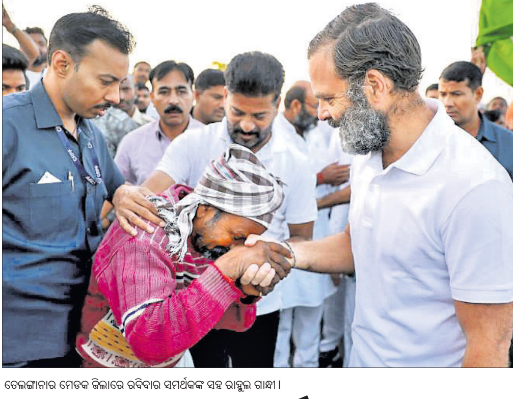
ଚେଲଙ୍ଗାନାର ମେଡିକାଲରେ ରବିବାର ସମର୍ପକ ସହ ରାହୁଲ ଗାନ୍ଧୀ।