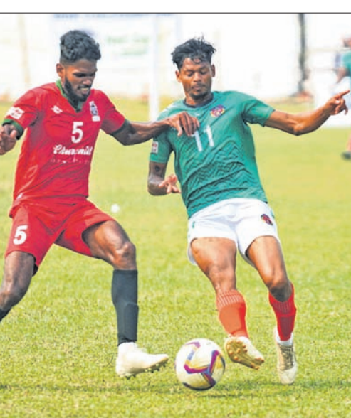
ପୁୟାଲ-ଗୋଆ ଓ ରାଜଗୁରୁ-ଡେଲ୍‌ଗାନା ମଧ୍ୟରେ ଅନୁଷ୍ଠିତ ମ୍ୟାଚ୍ରେ ଏକ ସଂଘର୍ଷପୂର୍ଣ୍ଣ ମୁହୂର୍ତ୍ତ।