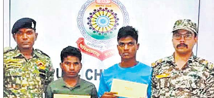
ଆତ୍ମହତ୍ୟା କରିଥିବା ୨ ମାଠବାଦୀଙ୍କୁ ପୋଲିସ୍ ପକ୍ଷରୁ ଆର୍ଥିକ ସହାୟତା ପ୍ରଦାନ କରାଯାଇଛି।