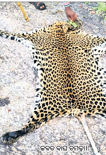
ଜବତ ବାଘ ଚମଡ଼ା।