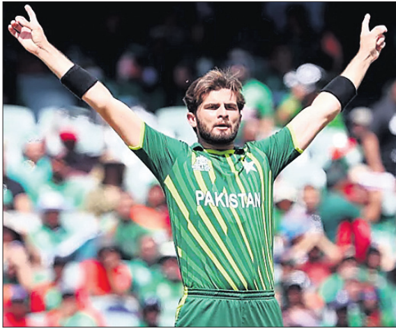
ଲିଟନ ଦାସଙ୍କ ଉଇକେଟ ନେବାପରେ ଶହିନ୍ ଶାହା ଆତ୍ମିଆ।

ଅତିଳେଖ୍ୟା ୨୧୧ (ପି.ଟି) ଅଷ୍ଟ୍ରେଲିଆରେ ଅନୁଷ୍ଠିତ ଟି୨୦ ବିଶ୍ୱକପରେ ପାକିସ୍ତାନ ଉପରେ ପ୍ରଥମ ହୋଇଛି ଭାରତଦେବ।