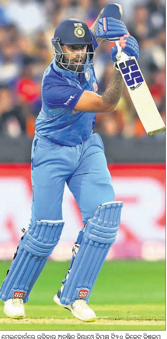
ମେଲବୋର୍ନରେ ରହିବାର ଅନୁଷ୍ଠିତ ଜିୟାଡ଼େ ବିପକ୍ଷ ୯୨୦ କ୍ରିକେଟ ବିଶ୍ଵକପ ମ୍ୟାଚରେ ଶର୍ ଖେଳିବା ଅବସରରେ ଭାରତର ପୂର୍ବଧର୍ମପୁତ୍ର ଯାଦବ।

ଭୁବନେଶ୍ଵର, ୬/୧୧ (ଗ୍ରାହ୍ୟ ପ୍ରତିନିଧି) ଦର୍ଶକମାନେ ନିଜ ମୋବାଇଲ ଲାଇଭ୍ ଚଳିତ ଏଫଆଇଏଚ୍ ହକି ପ୍ରୋ ଲିଗ ସିଜନରେ କଳିଙ୍ଗ ସ୍ଵାଭିମାନରେ ରହିବାକୁ ଅଧିକ ରଙ୍ଗୀନ କରିଥିଲେ। ବଲିଭର୍ ଏବଂ ଓଲିଭର୍ ସଙ୍ଗୀତର ତାଳେତାଳେ ଦର୍ଶକମାନେ ହୁଣ୍ଡିଥିଲେ। ଭାରତୀୟ ହକିପ୍ରମାଣୀ ଭାରତୀୟ ଦର୍ଶକ ସ୍ଵାଭିମାନରେ ଭରପୂର ଦେଖିବାର ସୁଯୋଗ ଦିଆ ଯାଇଥିଲା। ଦଳର ବିଭିନ୍ନ ମୁଭ୍ ସମୟରେ ସେମାନେ ଖେଳାଳିଙ୍କୁ କୋଲହକ ମାଧ୍ୟମରେ ଉତ୍ସାହିତ ମଧ୍ୟ କରିଥିଲେ। ଏଥିରେ ସ୍ଵେଚ୍ଛୁର ସୁଯୋଗ ଦିଆ ଯାଇଥିଲା। ଭାରତ ଓ ସ୍ଵେଚ୍ଛୁ ଶକ୍ତିଶାଳୀ ଦଳ ହୋଇଥିବାରୁ ସେମାନେ ଅନେକ କିଛି ଶିଖିବାର ସୁଯୋଗ ପାଇଥିଲେ। ବିଶେଷ କରି ହକିକୁ କ୍ୟାରିୟର କରୁଥିବା ମଧ୍ୟ ବେଶ୍ ଉତ୍ସାହପୂର୍ବ ରହିଥିଲା। ୨ ଦର୍ଶକ ଶେଷରେ ଅର୍ଥାତ୍ ପ୍ରଥମାକ୍ଷରେ ପାଇଁ ମ୍ୟାଚ ଉପାଦେୟ ହୋଇଥିଲା।