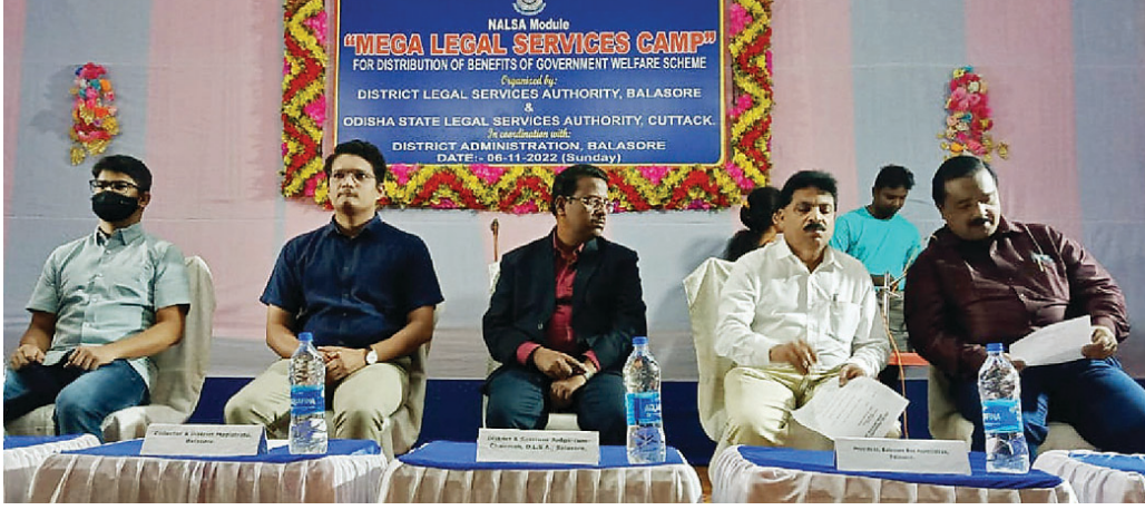
ଶିବିରରେ ମହାସାଧନ ଅତିଥିଗଣ।