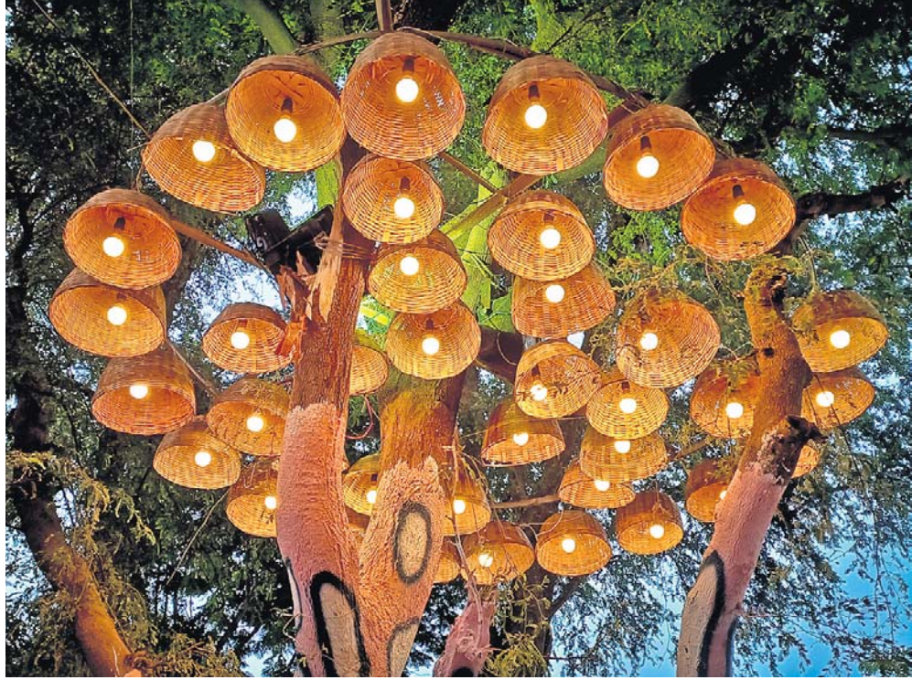
କଟକର ପ୍ରସିଦ୍ଧ ବାଲିଯାତ୍ରା ମଙ୍ଗଳବାରଠାରୁ ଆରମ୍ଭ ହେବାକୁ ଯାଉଥିବାବେଳେ ଏହାର ପ୍ରାରମ୍ଭ ଉତ୍ସବ ଆଲୋକରେ ଝଲୁଛି। ସେହିପରି ବାଲିଯାତ୍ରା ଚଳପଡ଼ିଆରେ ଥିବା ଏକ ଗଛକୁ ଆଲୋକରେ ଆକର୍ଷଣୀୟ ଭାବରେ ସଜାଯାଇଛି।