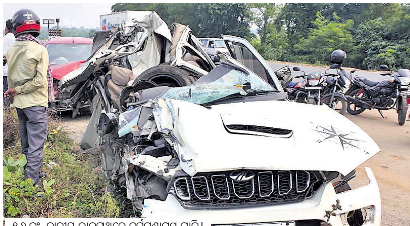
୧୬ ନଂ. ଜାତୀୟ ରାଜପଥରେ ଦୁର୍ଘଟଣାଗ୍ରସ୍ତ ଗାଡ଼ି

ଉତ୍ତରଓଡ଼ିଶାର ବାଲେଶ୍ୱର ଓ ମୟୂରଭଞ୍ଜ ଜିଲ୍ଲା ସୋମବାର ଦୁଇଟି ମର୍ତ୍ତ୍ୟୁ ଦୁର୍ଘଟଣାରେ ୫ଜଣଙ୍କ ମୃତ୍ୟୁ ହୋଇଛି। ବାଲେଶ୍ୱର ସିପୁଲିଆ ଥାନା ଅଞ୍ଚଳରେ ୩ଜଣଙ୍କ ମୃତ୍ୟୁ ହୋଇଥିବା ବେଳେ ମୟୂରଭଞ୍ଜ ଜିଲ୍ଲା ଠାକୁରମୁଣ୍ଡା-କରଞ୍ଜିଆ ରାସ୍ତାରେ ୨ ଯୁବକଙ୍କ ପ୍ରାଣହାନି ଘଟିଛି।