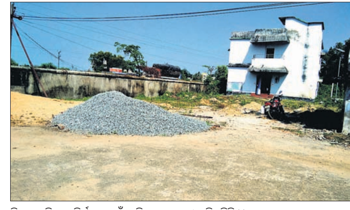
ମିଶନ ଶକ୍ତି ଗୃହ ନିର୍ମାଣ ପାଇଁ ଆସିଥିବା ସାମଗ୍ରୀ ପଡ଼ିରହିଛି।

ବାଲେଶ୍ୱର ଜିଲା ବାହାନଗା ବ୍ଲକ୍ ପରିସରରେ ନିର୍ମାଣ ହେବାକୁ ଥିବା ମିଶନ ଶକ୍ତି ଗୃହ ୧୯୯୯ରୁ ଉର୍ଦ୍ଧ୍ୱ ସମୟ ହେଲା କାମ ନ ହୋଇ ପଡ଼ିରହିଛି। ଜାତୀୟ ରାଜପଥ ସମ୍ପ୍ରଦାୟର ଶକ୍ତି ଆନ କବି ସେହି ସ୍ଥାନରୁ ଅନ୍ୟତ୍ର କରିବା ଉଦ୍ଦେଶ୍ୟରେ ନିର୍ମାଣ କାର୍ଯ୍ୟ ବନ୍ଦ ରଖାଯାଇଛି। ବ୍ଲକ୍ ପରିସରରେ ୫୦ଲକ୍ଷ ଟଙ୍କା ବ୍ୟୟରେ ହେବାକୁ ଥିବା ମିଶନଶକ୍ତି ଗୃହ ନିର୍ମାଣ ପାଇଁ ପୂର୍ବ ବିଭାଗ ପକ୍ଷରୁ ୧୯୯୯ ଟଙ୍କା ଟେଣ୍ଡର କରାଯାଇଥିଲା। ଟେଣ୍ଡର ଅନୁଯାୟୀ ଠିକାଦାର ନୂତନ ଗୃହ ନିର୍ମାଣ ପାଇଁ ସ୍ଥାନ ନିରୂପଣ କରି ବୋରିଂ କାର୍ଯ୍ୟ କରିସାରିଥିଲେ। ତେବେ କିଛି ନ୍ୟୁସ୍‌ପାପି ଗୋଷ୍ଠୀ ବ୍ଲକ୍ ସାମ୍ନାରେ ଏଭଳି ଏକ ବଡ଼ ଘର ନିର୍ମାଣକୁ ବିରୋଧ କରିଥିଲେ। ସେହି ସମୟରେ ୧୬ନମ୍ବର ଜାତୀୟ ରାଜପଥ