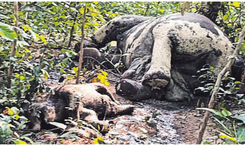
ଜଙ୍ଗଲରେ ଠାବ ମା' ଓ ଛୁଆହାତୀର ଗଳିତ ମୃତଦେହ।

କେନ୍ଦୁଝର ଜିଲ୍ଲା ତେଲକୋଇ ରେଞ୍ଜି ଚାଳପଦା ସେକ୍ସନ ଚାଳପଦା ବିଏ ଅଧୀନ କୁଳିଆପାଳ ନିକଟ କଳାପାଟ ସଂରକ୍ଷିତ ଜଙ୍ଗଲକୁ ବନ ବିଭାଗ ଏକ ମାଛ ହାତୀ ଓ ଶାବକର ଗଳିତ ମୃତଦେହ ଠାବ କରିଛି। ମା' ହାତୀକୁ ଡାକି ଦେଇ ହତ୍ୟା କରାଯାଇଥିବା ବ୍ୟବହାରକୁ ଜଣାପଡ଼ିଛି। ବ୍ୟବହାରରେ ମୃତ ମାଛ ହାତୀର ଶରୀରକୁ ଡାକି ବାହାରିଛି। ତୀରଟି ପାଳପୁରା ବେଳ ଗର୍ଭାଶୟକୁ ଭେଦ କରିଥିଲା। ସେଠାରେ ଦୁଇ ହାତୀର ଗଳିତ ମୃତଦେହ ଦେଖି ବନ ବିଭାଗକୁ ଖବର ଦେଇଥିଲେ। ପରେ ଚାଳପଦା ସେକ୍ସନ ବନ କର୍ମଚାରୀ ସଂରକ୍ଷିତ ଜଙ୍ଗଲକୁ ଯାଇ ଖୋଜାଖୋଜି କରି ମୃତଦେହ ଠାବ କରିଥିଲେ। ମାଛ ହାତୀ ମୃତଦେହର ବାମ ପଟ ପେଟରେ ତୀର ବିକ୍ଷେପ ହୋଇଥିବା ଦାଗ ଥିବାରୁ ଅନୁମାନ କରାଯାଇଛି। ଖବରପାଇ କେନ୍ଦୁଝର