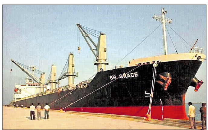
ଗୋପାଳପୁର ବନ୍ଦରରେ ଲାଗିଥିବା କଳପଥ ଜାହାଜ (ଫାଇଲ ଫଟୋ)।

କଳିଙ୍ଗ ନୌବାଣିଜ୍ୟର ପ୍ରତୀକ ବା ସ୍ମାରକୀ ଗୋପାଳପୁର ବନ୍ଦର। ଶତାଧିକ ବର୍ଷର ଇତିହାସ ଅନୁସାରେ ଦକ୍ଷିଣ ଓଡ଼ିଶାର ସାଧକ ପୁଅମାନେ ଦେବଦା ବନ୍ଧିକ ପାଇଁ ଇଚ୍ଛାନ୍ଦେଥିଆ, ଶ୍ରୀଲଙ୍କା ଓ ରେଜୁନ ଆଦି ସ୍ଥାନକୁ ଜାହାଜରେ ଯାଇ ପ୍ରଚୁର ଧନସମ୍ପତ୍ତି ଅର୍ଜନ କରି ନିଜ ଚାଳୁ ଆଣୁଥିଲେ। ସେତେବେଳେ ଗୋପାଳପୁର ବେଳାଭୂମିରେ ଲାଗୁଥିଲା ଜାହାଜ। କାର୍ତ୍ତିକ ପୂର୍ଣ୍ଣିମା ଭୋରରେ ସାଧବାଣୀମାନେ ବୋଇତ ବନ୍ଦାଣ ସହ ସାଧବାନଙ୍କୁ ବନ୍ଦାପନା କରି ବିଦେଶ ଯାତ୍ରାର ଶୁଭ କାମନା ଜଣାଉଥିଲେ। କଳ ଜାହାଜ ଯିବା ଆସିବା ବେଳେ ସମୁଦ୍ର ଭିତରକୁ ଆଲୋକ ଦେଖାଇବା ନିମନ୍ତେ ବେଳାଭୂମି ପାଖରେ ଘୁାପନ ହୋଇଥିଲା ବିରାଟ ବତୀଘର। ତାହା ଏବେ ବି ମୂଳସାକ୍ଷୀ ଭାବେ ଗୋପାଳପୁରରେ ବିଦ୍ୟମାନ। ତେବେ ପୁରାତନ ବନ୍ଦରର ସହା ହଳିଯିବା ସହ ସାଧବାଣୀ ଓ ସାଧବଙ୍କ ପ୍ରାଚୀନ ପରମ୍ପରା ଲୋପ ପାଇଛି।