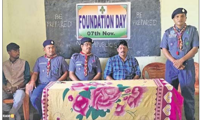
କାର୍ଯ୍ୟକ୍ରମରେ ଉପସ୍ଥିତ ଅତିଥି ।

କରିଛନ୍ତି ବୁକିବାଣୀ । ବାଲି ଉଠାଣରେ ନିୟନ୍ତ୍ରଣ କରି ଠିକ ପରିମାଣର ରାଜସ୍ୱ ଆଦାୟ ନିମନ୍ତେ ପ୍ରଶାସନ ପକ୍ଷରୁ ଖାଦାନ ସ୍ଥଳରେ ଖାଲ ଫର୍ମ ପୂର୍ଣ୍ଣ ବ୍ୟବସ୍ଥା କରାଯାଇଛି । ଯାହାର ତଥ୍ୟ ଲିଜଧାରୀ ଗ୍ଵାନୀୟ ତହସିଲଦାରଙ୍କୁ ଜମା ଦେବାକୁ ପଡ଼ିଥାଏ । ଏହି ଖାଲ ଫର୍ମରେ ପ୍ରଶାସନକୁ ହସ୍ତାନ୍ତର କରିବା ନକଲରେ ନିଆଁ ତଥ୍ୟ ଉଲ୍ଲେଖ କରାଯାଇଥିବା ବେଳେ ତହସିଲଦାର ବ୍ୟାପକ ପରିମାଣର ରାଜସ୍ୱ ଠିକ ନେଉଥିବା ଅଭିଯୋଗ ହୋଇଛି । ଆସୁଥିବା ବେଳେ ବହୁବାର ଆଲୋଚନା କରାଯାଇଛି । ଏ ନେଇ