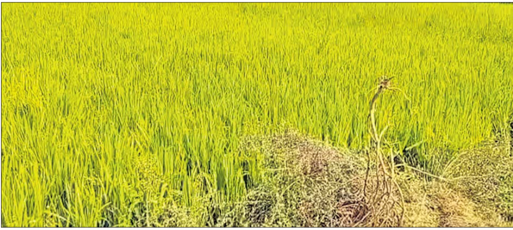
ରୋଗଯୋକ ଲାଗି ନଷ୍ଟ ହୋଇଥିବା ଧାନବିଲ।