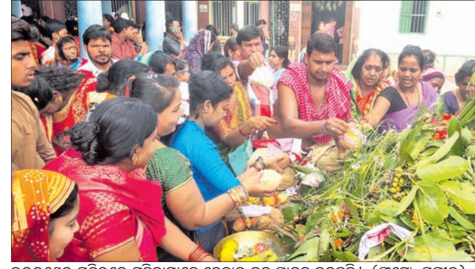
ଉତ୍ତରାଞ୍ଚଳ ମନ୍ଦିରରେ ମହିଳାମାନେ କେଦାର ବ୍ରତ ପାଳନ କରୁଛନ୍ତି।