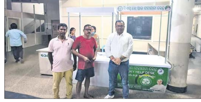
କିଡ଼ନୀ ରୋଗୀଙ୍କ ପରିବାର ସହ ଜିଲାପାଳ ଆଲୋଚନା କରୁଛନ୍ତି ।