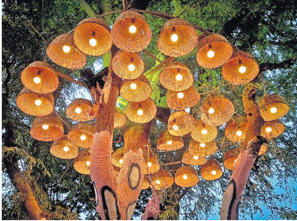
କଟକର ପ୍ରସିଦ୍ଧ ବାଲିଯାତ୍ରା ମଙ୍ଗଳବାରଠାରୁ ଆରମ୍ଭ ହେବାକୁ ଯାଉଥିବାବେଳେ ଏହାର ପ୍ଲାଇ ଚୋରଣ ରଜିନ ଆଲୋକରେ ଝଲୁଛି। ସେହିପରି ବାଲିଯାତ୍ରା ଚଳପଡ଼ିଆରେ ଥିବା ଏକ ଗଛକୁ ଆଲୋକରେ ଆକର୍ଷଣୀୟ ଭାବରେ ସଜାଯାଇଛି।