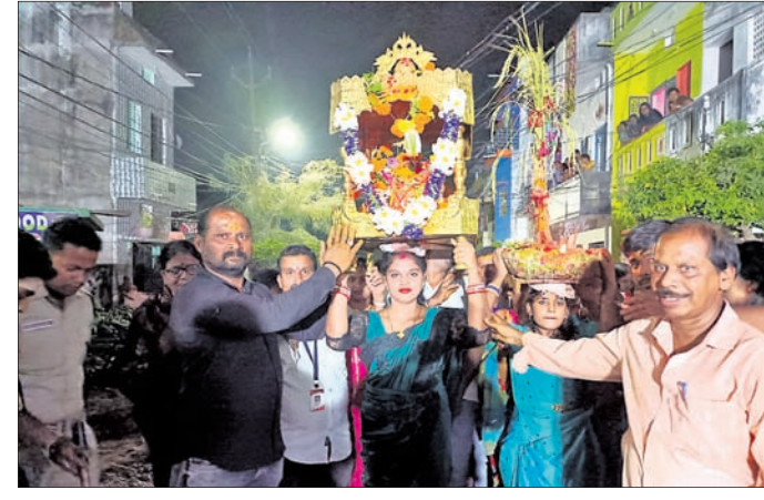
ବିଜିପୁର ଗୌରୀଆମ୍ନା ଯାତ୍ରାରେ ଘଟ ପରିକ୍ରମା

ଗଞ୍ଜାମ ଜିଲ୍ଲା ତଥା ବ୍ରହ୍ମପୁର ସହରରେ କୁମାର ପୂର୍ଣ୍ଣିମାଠାରୁ ଆରମ୍ଭ ହୋଇ କାର୍ତ୍ତିକ ପୂର୍ଣ୍ଣିମା ପର୍ଯ୍ୟନ୍ତ ଗୌରୀଆମ୍ନା ଯାତ୍ରା ଚାଲିଥିଲା। ବିଜିପୁର ଓ ଆଙ୍କୋଲି ଅଞ୍ଚଳରେ ଗୌରୀଆମ୍ନା ଯାତ୍ରା ଉଦ୍‌ଘାଟିତ ହୋଇଯାଇଛି। ଏହି ଅବସରରେ ବିଜିପୁର ଅଞ୍ଚଳରେ ନନ୍ଦି ଉପରେ ବିରାଜମାନ ହୋଇଥିବା ମାତା ପାର୍ବତୀ ମହାଦେବ ଓ ଅଗ୍ରପୁଞ୍ଜ୍ୟ ଗଣେଶଙ୍କ ପୂଜାର୍ଚ୍ଚନା ହୋଇଥିଲା। ଏହାସହ ଏକ ବିରାଟ ଶୋଭାଯାତ୍ରାରେ ମାଙ୍କ ଘଟ ପରିକ୍ରମା କରାଯାଇଥିଲା। ଏହି ଶୋଭାଯାତ୍ରାରେ ଶହ ଶହ ସଂଖ୍ୟାରେ ତେଲୁଗୁ ଯାଦବ ସମ୍ପ୍ରଦାୟ ଘଟ ସହ ନଗର ପରିକ୍ରମା କରିଥିଲେ। ବିଜିପୁର ଅଞ୍ଚଳ ବଡ଼ସାହି, କେନାଳ ସାହି, କାଳୁଆ ସାହି, ଲକ୍ଷ୍ମୀ ସାହି, ବନ୍ଧ ସାହି ଓ ରଥ ସାହିରେ ଘଟ ପରିକ୍ରମା