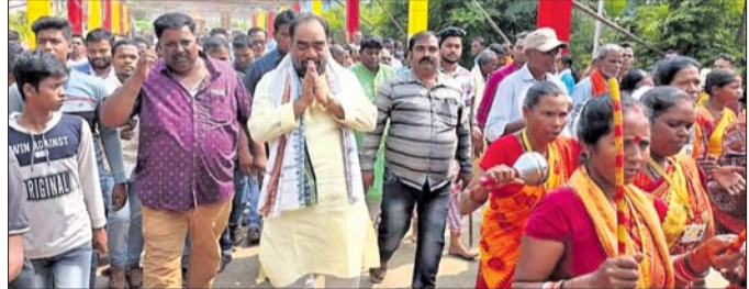
ବାଟସଡ଼ି କୁଳାଡ଼ ନାମସହ ରେ ଯୋଗ ଦେଇଛନ୍ତି।