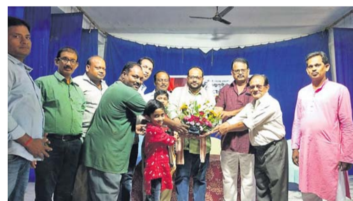
ଅତିଥିମାନେ ସାମଗ୍ରୀଗ୍ରହଣ ପୁରସ୍କୃତ କରୁଛନ୍ତି ।