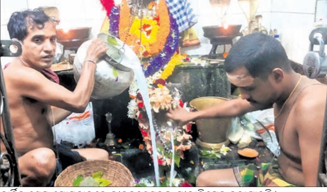
କାର୍ତ୍ତିକ ଶେଷ ସୋମବାରରେ ନାକଲଣ୍ଠେଷୁରକୁ ସ୍ଥାନାନ୍ତରଣ କରାଯାଇଛି।