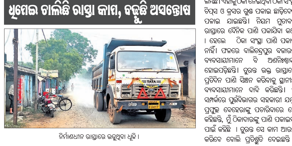
ନିର୍ମାଣଧାନ ରାସ୍ତାରେ ଉଡୁଥିବା ଧୂଳି ।