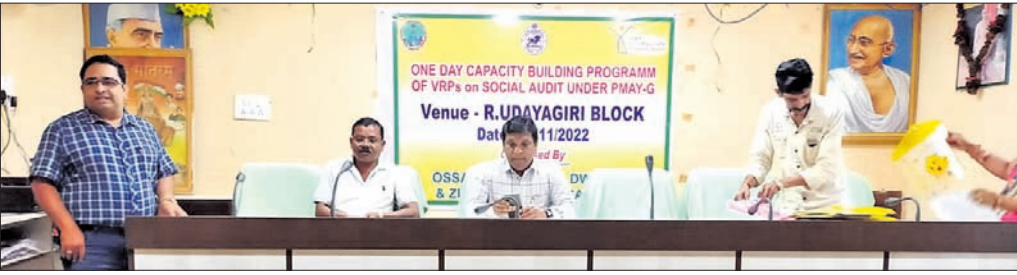
କାର୍ଯ୍ୟକ୍ରମରେ ଉପସ୍ଥିତ ଅଧିକାରୀ।