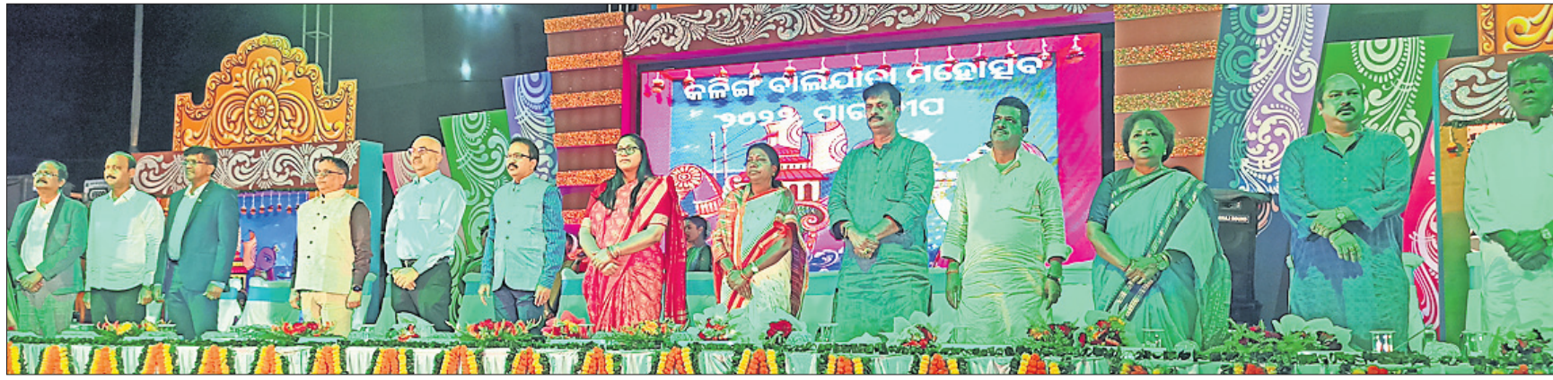
ପାରାଦୀପ ବାଲିଯାତ୍ରା ମହୋତ୍ସବ ଉଦ୍‌ଘାଟନା ଅବସରରେ ମଞ୍ଚାଧୀନ ଅତିଥିମାନେ।