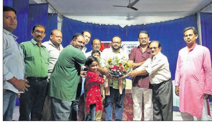
ଅତିଥିମାନେ ଛାତ୍ରଛାତ୍ରୀଙ୍କୁ ପୁରସ୍କୃତ କରୁଛନ୍ତି।