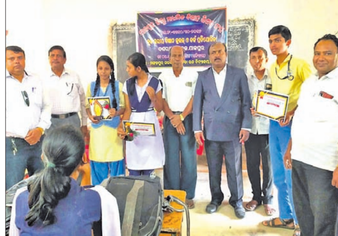
କୃତୀ ପ୍ରତିଯୋଗୀମାନଙ୍କୁ ଅତିଥି ପ୍ରମାଣପତ୍ର ପ୍ରଦାନ କରୁଛନ୍ତି ।