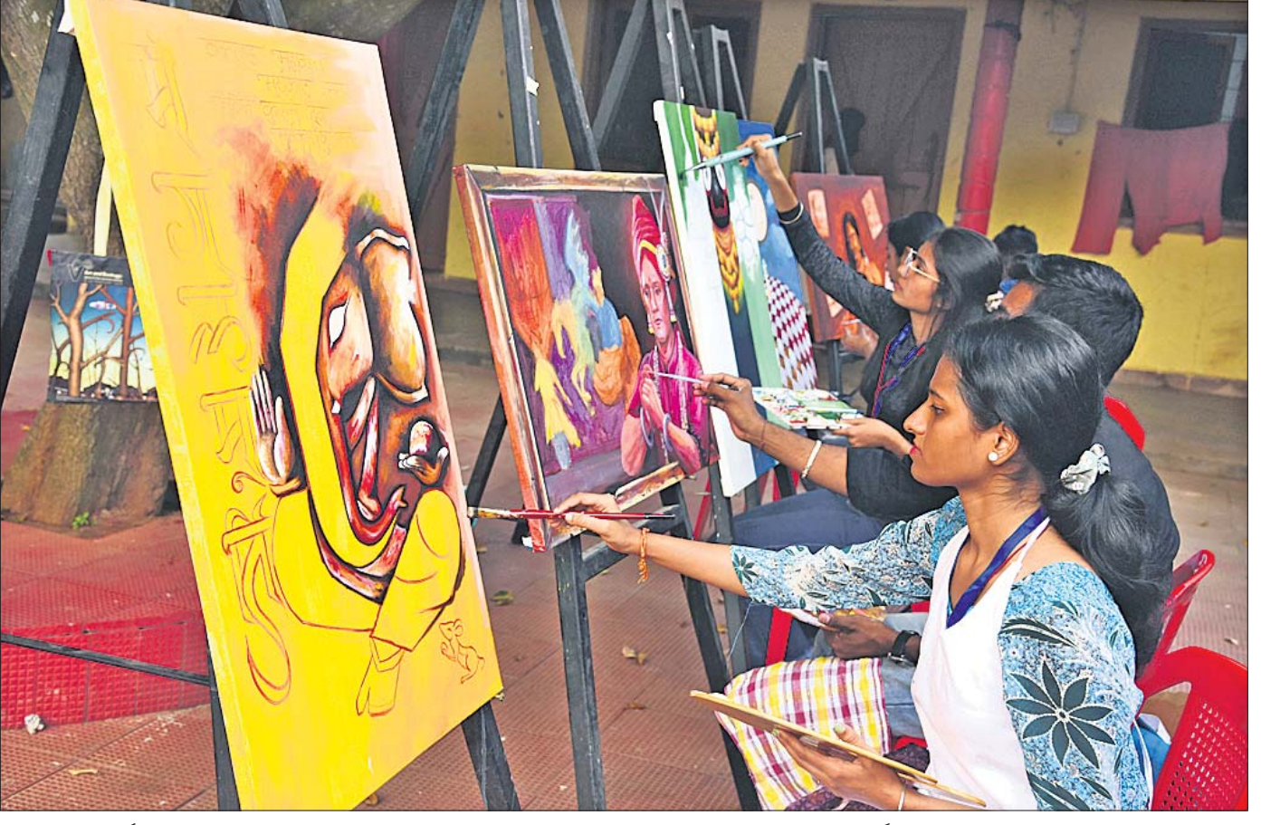
ଆର୍ଟିଷ୍ଟ ଆସୋସିଏଟସ୍ ଅଫ୍ ଓଡ଼ିଶା (ଆଓ) ପକ୍ଷରୁ ଭୁବନେଶ୍ୱର ଏକାମ୍ର ହାତଠାରେ ଚାଲିଥିବା କାତାୟ ଚିତ୍ରଶିଳ୍ପା କର୍ମଶାଳା ଓ ଚଳଚ୍ଚିତ୍ର ଉତ୍ସବ 'ଚିତ୍ରାଞ୍ଜଳି'ର ସୋମବାର ବିତୀୟ ଦିନରେ ଅଂଶଗ୍ରହଣ କରିଥିବା ଯୁବ ଚିତ୍ରଶିଳ୍ପୀମାନେ ବିତ୍ର ଅଳନ କରୁଛନ୍ତି।

ଦାରିଙ୍ଗବାଡ଼ି, ୭।୧୧ (ଡି.ଏନ.ଏ): କନ୍ୟାମାଳିକା ଦାରିଙ୍ଗବାଡ଼ି ଥାନାଠାରୁ ମାତ୍ର ଦୁଇ ଶହ ମିଟର ଦୂରରେ ନିଜ ପାଖରେ ଥିବା ଦେଶୀ ବନ୍ଧୁକରୁ ଗୁଳି ଫୁଟି ଜଣେ ଯୁବକ ଗୁରୁତର ଆହତ ହୋଇଛନ୍ତି। ସେ ହେଲେ କୋଟବାଡ଼ି ଥାନା ଅଞ୍ଚଳର ଏକ ପୁରାଣୀକା। ଏକାଧିକ ବୟସରେ ଗୁଳିଭରି ବନ୍ଧୁକଟି ଲୁଚାଇ ରଖିଥିବା ବେଳେ କୋଣାର୍କ ପ୍ରକାଶରେ ହାତ ପାଉଥିବା ଫୁଟି ଯାଇଥିଲା। ପୋଲିସ୍ ଗୁରୁତର ଅବସ୍ଥାରେ ତାଙ୍କୁ ଉଦ୍ଧାର କରି ଦାରିଙ୍ଗବାଡ଼ି ଗୋଷ୍ଠୀ ସ୍ୱାସ୍ଥ୍ୟକେନ୍ଦ୍ରରେ ଭର୍ତ୍ତି କରିଥିଲା। ସେଠାରୁ ଅଧିକ ଚିକିତ୍ସା ଲାଗି ତାଙ୍କୁ ପୋଲିସ୍ ହେପାଜତରେ ବୁଝାଇ ବଡ଼ ମେଡ଼ିକାଲକୁ ପଠାଯାଇଛି। ଅନ୍ୟପକ୍ଷରେ ଦାରିଙ୍ଗବାଡ଼ି ପଞ୍ଚାୟତ କାର୍ଯ୍ୟାଳୟ ଏବଂ ବୃଦ୍ଧ କାର୍ଯ୍ୟାଳୟ ନିକଟରେ ଏହି ଘଟଣା ଘଟିଥିବାରୁ ପୋଲିସ୍ ଏହାକୁ ଗୁରୁତର ସହ ନେଇଛି। ଏକାଧିକ ବନ୍ଧୁକ ଧରି କୋଟବାଡ଼ି ଅଞ୍ଚଳରୁ ଦାରିଙ୍ଗବାଡ଼ିକୁ କାର୍ଯ୍ୟ ଆସିଥିଲେ ତାହା ତଦନ୍ତ ପରେ ଜଣାପଡ଼ିବ ବୋଲି ଆଇଆଇସି କୋଣାର୍କ ମାଧ୍ୟମରେ କହିଛନ୍ତି। ଏ ନେଇ ପୋଲିସ୍ ନିଜ ଆଡ଼ୁ ଏକ ମାମଲା ରୁଜୁ କରି ତଦନ୍ତ କରିବ ବୋଲି ଆଇଆଇସି ସୂଚନା ଦେଇଛନ୍ତି।