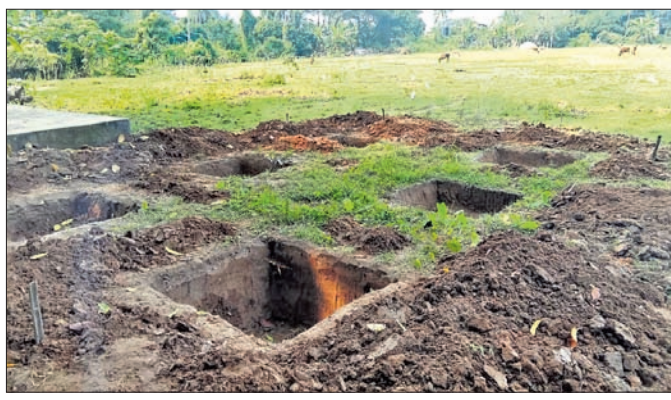
ଗୋଡ଼ର ଜମିରେ ପାଣିଟାଙ୍କି ନିର୍ମାଣ ପାଇଁ ଗାଡ଼ ଖୋଳାଯାଇଛି।

ବିଚିତ୍ରି ବ୍ଲକ ବାଗଲପୁର ପଞ୍ଚାୟତରେ ଜନସାଧାରଣଙ୍କ ପାଇଁ ଉଦ୍ଦିଷ୍ଟ ଥିବା ଗୋଡ଼ର ଜମିରେ ବେଆଇନ ପାଣିଟାଙ୍କି ନିର୍ମାଣକୁ ନେଇ କେତେଜଣ ଯୁବକ କିଲ୍ୟାଣପାଳକ ନିକଟରେ ଅଭିଯୋଗ କରିଛନ୍ତି।