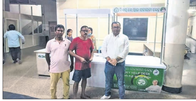
କିଡ଼ନୀ ରୋଗୀଙ୍କ ପରିବାର ସହ ଜିଲ୍ଲାପାଳ ଆଲୋଚନା କରୁଛନ୍ତି।