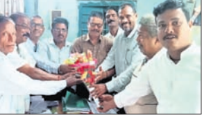
ପାରାଦୀପ, ୭୧୧ (ସ.ପ୍ର.)