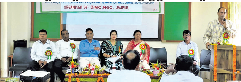
ଶିବିରରେ ଯୋଗଦେଇଥିବା ଅତିଥି ବୃନ୍ଦ ।