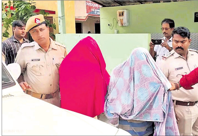
ପୋଲିସ୍ ଅଭିଯୁକ୍ତମାନଙ୍କୁ କୋର୍ଟ ଚାଲାଣ କରୁଛି ।