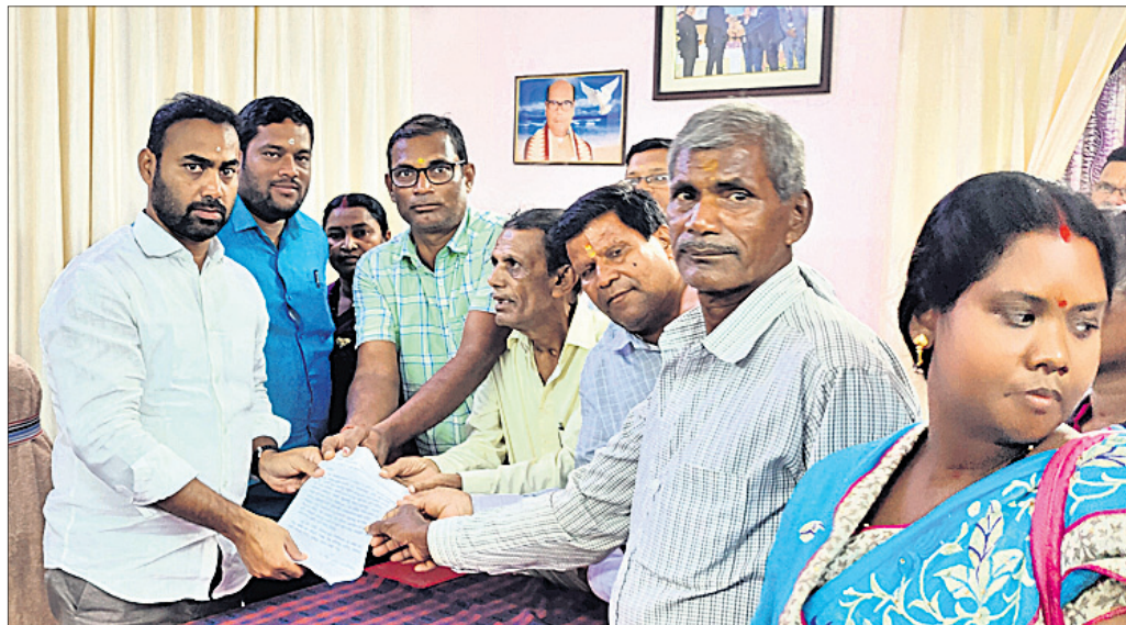
ଗାନ୍ଧୀନୀ ମନ୍ତ୍ରାଳୟ ବାବିପତ୍ର ପ୍ରଦାନ କରୁଛନ୍ତି ।