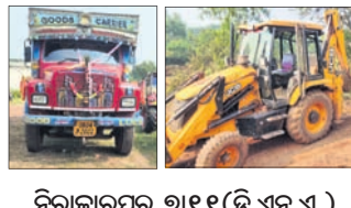
ନିରାକାରପୁର, ୭୧୧୧ (ଭୁବନେ)।

ଖୋର୍ଦ୍ଧା ଜିଲ୍ଲା ନିରାକାରପୁର ରାଜ୍ୟ ଅନ୍ତର୍ଗତ ଖଜୁରିପଡ଼ା ଅଞ୍ଚଳରେ ବେଆଇନ ଭାବେ ଚାଲିଥିବା ମାଙ୍କଡ଼ା ପଥର ଖଣିରେ ପୋଲିସ୍ ଚଢ଼ାଉ କରି ଗୋଟିଏ ଜେସିଡି, ଟ୍ରକ୍ ଜବତ କରିଛି।