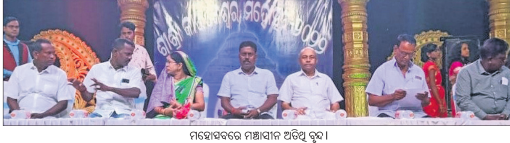
ମହୋତ୍ସବରେ ମହାସାଗ ଅତିଥି କୃତ୍ୱ।