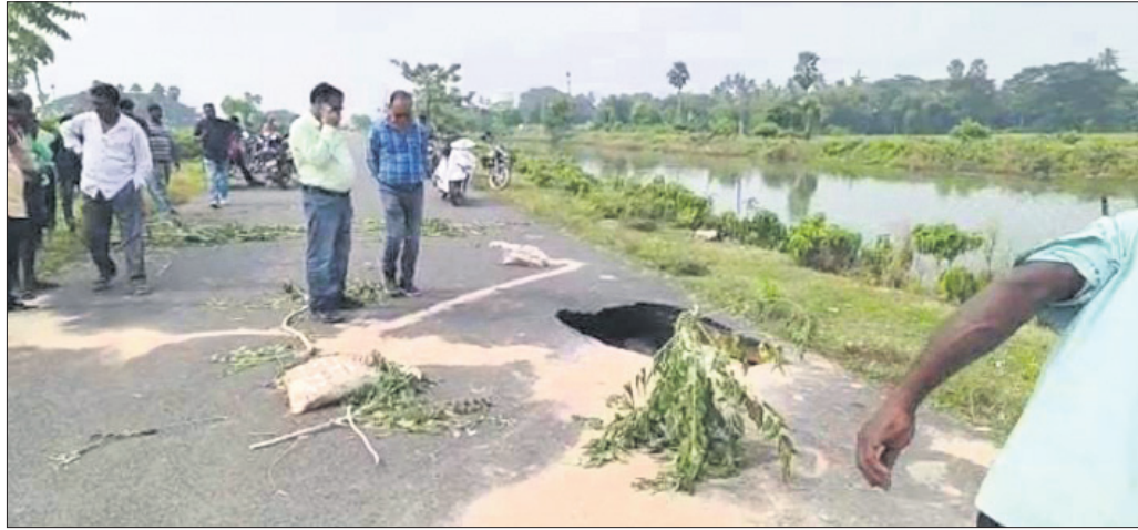
କେନ୍ଦ୍ରାପଡ଼ା କେନାଲରେ ପୃଷ୍ଠ ଘାଟକୁ ଲୋକେ ଦେଖାଉଛନ୍ତି।

କଟକ ଜିଲ୍ଲା ନିଶ୍ଚିତକୋଇଲି ବ୍ଲକ କୋଲଗପୁରଠାରେ କେନ୍ଦ୍ରାପଡ଼ା କେନାଲରେ ଯୋଗଦାନ ଏକ ଏୟାର ଘଟଣା ଘଟିଛି। ଏହା ପରେ କେନାଲର ପାଣି ଖସି ଯାଇଛି। ଏହା ପରେ କେନାଲର ପାଣି ଖସି ଯାଇଛି। ଏହା ପରେ କେନାଲର ପାଣି ଖସି ଯାଇଛି।