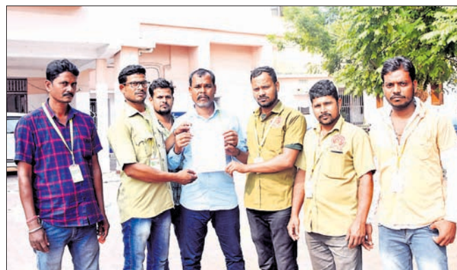
ଦାବିପତ୍ର ଦେବାକୁ ଆସିଥିବା ଅଲ୍ ଓଡ଼ିଶା ପରିବହନ ଚାଳକ ସଂଘ ପୁରୀ ଶାଖାର କର୍ମଚାରୀ

ପୁରୀ ଅପିସ, ୭।୧୧ ପୁରୀ ଓଡ଼ିଶା ପରିବହନ ଚାଳକ ସଂଘ ପୁରୀ ଶାଖା ପକ୍ଷରୁ ଯୋଗାଣ କରାଯାଇ ନଥିବା ଯୋଗାଣ ଦିଆଯାଉ ନାହିଁ ବୋଲି ଛାତ୍ରଛାତ୍ରୀମାନେ ଅସନ୍ତୋଷ ପ୍ରକାଶ କରିଛନ୍ତି। ଆବଶ୍ୟକ ଯୋଗାଣରେ ଗୃହ ନିର୍ମାଣ ପାଇଁ ଟଙ୍କା ଦେବା, ପିଲାଙ୍କ ଉଚ୍ଚ ଶିକ୍ଷା ନିମନ୍ତେ ବ୍ୟୟ କରାଯିବା, ଡ୍ରାଇଭରଙ୍କୁ କରୋନା ଯୋଗାଣ ମାନ୍ୟତା ଦେବା, ଡ୍ରାଇଭର କଲ୍ୟାଣ ପାଇଁ ବିଶ୍ୱାସ ପାଇଁ ପ୍ରତି ୧୦୦ କି.ମି. ଅନ୍ତରରେ ବିଶ୍ୱାସନୀୟ ଓ ଶୈବାଳ୍ୟ ବ୍ୟୟ କରାଯାଉ। ୫୫ ବର୍ଷ ବୟସ ପରେ ପେନସନ ପ୍ରଦାନ, ଦୁର୍ଘଟଣାରେ ପ୍ରାଣ ହରାଇଥିବା ଡ୍ରାଇଭରଙ୍କ ପରିବାର ପାଇଁ ୨୦ ଲକ୍ଷ ଟଙ୍କାର ବାମା ରାଶି ଏବଂ ଦୀର୍ଘ ବୟସରେ କର୍ମଚାରୀଙ୍କୁ ଡ୍ରାଇଭରଙ୍କୁ ପାଇଁ ୧୦ ଲକ୍ଷ ଟଙ୍କାର ବାମା ରାଶି ଦିଆଯାଉ। ନିର୍ଦ୍ଦେଶିତ ମୂଲ୍ୟାଙ୍କନ ଓ ସମୟ ସାମାଧାନ ହେଉ। ଆବଶ୍ୟକ ଯୋଗାଣରେ ଗୃହ ନିର୍ମାଣ ପାଇଁ ଟଙ୍କା ଦେବା, ପିଲାଙ୍କ ଉଚ୍ଚ ଶିକ୍ଷା ନିମନ୍ତେ ବ୍ୟୟ କରାଯିବା, ଡ୍ରାଇଭରଙ୍କୁ କରୋନା ଯୋଗାଣ ମାନ୍ୟତା ଦେବା, ଡ୍ରାଇଭର କଲ୍ୟାଣ ପାଇଁ ବିଶ୍ୱାସ ପାଇଁ ପ୍ରତି ୧୦୦ କି.ମି. ଅନ୍ତରରେ ବିଶ୍ୱାସନୀୟ ଓ ଶୈବାଳ୍ୟ ବ୍ୟୟ କରାଯାଉ। ୫୫ ବର୍ଷ ବୟସ ପରେ ପେନସନ ପ୍ରଦାନ, ଦୁର୍ଘଟଣାରେ ପ୍ରାଣ ହରାଇଥିବା ଡ୍ରାଇଭରଙ୍କ ପରିବାର ପାଇଁ ୨୦ ଲକ୍ଷ ଟଙ୍କାର ବାମା ରାଶି ଏବଂ ଦୀର୍ଘ ବୟସରେ କର୍ମଚାରୀଙ୍କୁ ଡ୍ରାଇଭରଙ୍କୁ ପାଇଁ ୧୦ ଲକ୍ଷ ଟଙ୍କାର ବାମା ରାଶି ଦିଆଯାଉ।