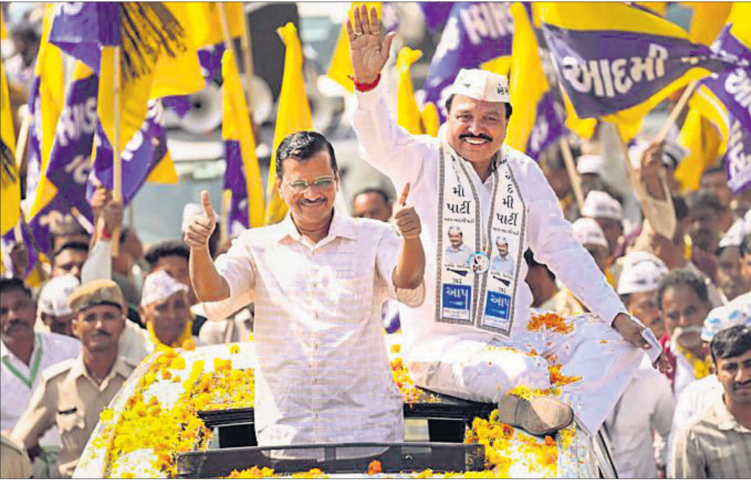
ଗୁଜରାଟ ବିଧାନସଭା ନିର୍ବାଚନ ପରିସ୍ଥିତିରେ ଯୋଗବାର ରାଜକୋଟଠାରେ ଆୟୋଜିତ ଏକ ରୋଡ୍ ଶୋ'ରେ ସାମିଲ ହୋଇଛନ୍ତି ଆମ୍ ଆର୍ଦ୍ଧନୀ ପାର୍ଟିର ରାଷ୍ଟ୍ରୀୟ ସଂଯୋଜକ ତଥା ଦିଲ୍ଲୀ ପୁଞ୍ଜ୍ୟମନ୍ତ୍ରୀ ଅରବିନ୍ଦ କେକରିଡ଼ା।

ଉପଯୁକ୍ତ ତଦନ୍ତ କରାଇବା ଲାଗି ପଶ୍ଚିମବଙ୍ଗ ବିରୋଧୀ ଦଳ ନେତା ଶୁଭେନ୍ଦୁ ଅଧିକାରୀ ଯୋଗବାର କେନ୍ଦ୍ର ଗ୍ରାମ୍ୟ ଉନ୍ନୟନ ଏବଂ ପଞ୍ଚାୟତରାଜ ମନ୍ତ୍ରୀ ଗିରିରାଜ ସିଂହଙ୍କୁ ପତ୍ର ଲେଖିଛନ୍ତି। ଶୁଭେନ୍ଦୁ ତାଙ୍କ ପତ୍ରରେ ମମତା ସରକାରଙ୍କ ନାମରେ ସାଂଘାତିକ ଅଭିଯୋଗ ଆଣିଛନ୍ତି। ସେ ଉଲ୍ଲେଖ କରିଛନ୍ତି ଯେ, ପଶ୍ଚିମବଙ୍ଗ ସରକାର ଏବେ ନକଲି ନିୟୁତ ପ୍ରସ୍ତୁତି ସହ ଭ୍ରାମ୍ୟକ ତଥ୍ୟ ପ୍ରସ୍ତୁତିରେ ଲାଗିପଡ଼ିଛନ୍ତି। ବିଶେଷଭାବେ ଗ୍ରାମାଞ୍ଚଳରେ ନକଲି ଚାକିରି ସୃଷ୍ଟି କରାଇବା ସହ ଜ୍ୱଳାନ୍ତର ଦୁରୁପଯୋଗ କରି କେନ୍ଦ୍ରକୁ ଭ୍ରାମ୍ୟକ ତଥ୍ୟ ଦେଇ ଅନୁଦାନ ପାଇଁ ଦାବି କରୁଛନ୍ତି। ଆଗକୁ ପଞ୍ଚାୟତ ନିର୍ବାଚନ ଆସୁଥିବାରୁ ପୁଞ୍ଜ୍ୟମନ୍ତ୍ରୀ ମମତା ସରକାରୀ କଳକୁ ଏଭଳି ବେଆଇନ କାର୍ଯ୍ୟରେ ଲଗାଇ ଦେଇଛନ୍ତି। ତେଣୁ ଏହି ଘଟଣାରେ ସିବିଆଇ କିମ୍ବା ଅନ୍ୟ କୌଣସି କେନ୍ଦ୍ରୀୟ ସଂସ୍ଥା ଦ୍ୱାରା ଏହାର ତଦନ୍ତ କରାଇବାକୁ କେନ୍ଦ୍ରମନ୍ତ୍ରୀ ଗିରିରାଜଙ୍କୁ ଲେଖୁଥିବା ପତ୍ରରେ ଶୁଭେନ୍ଦୁ ଅନୁରୋଧ କରିଛନ୍ତି।