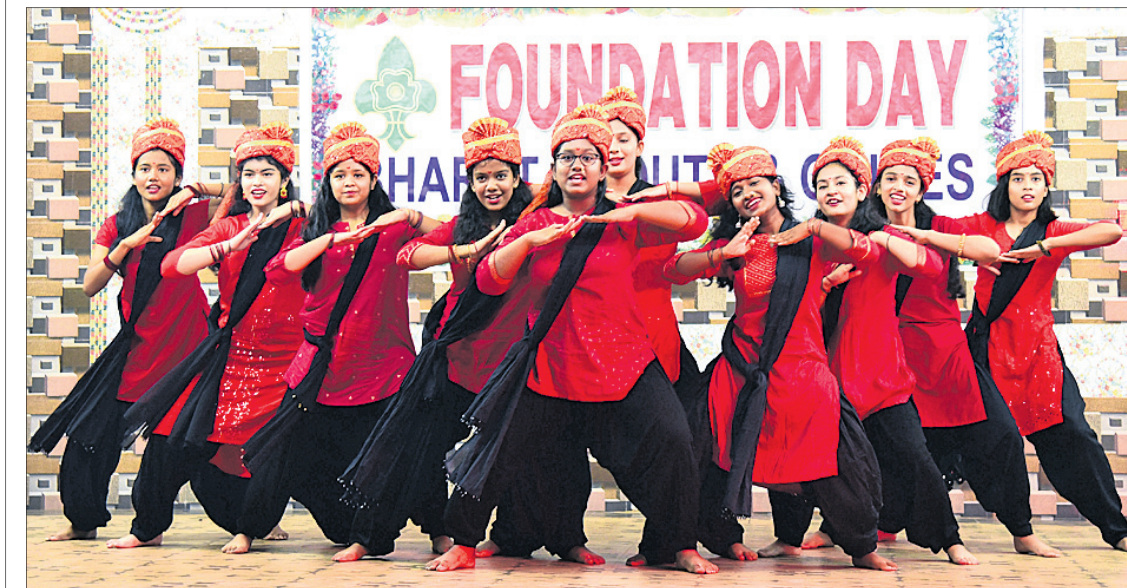
ଓଡ଼ିଶା ସ୍ୱେଚ୍ଛା ଭାରତ ସ୍ୱାଭିମୁଖୀ ଆଶ୍ୱ ଗାଳତ୍ୱର ପ୍ରତିଷ୍ଠା ଦିବସ ପାଳନ ଅବସରରେ ଯୋଗବାର ଭୁବନେଶ୍ୱରସ୍ଥିତ କାର୍ଯ୍ୟାଳୟରେ ଅନୁଷ୍ଠିତ ସାଂସ୍କୃତିକ କାର୍ଯ୍ୟକ୍ରମ।

ବାଲିପାଟଣା, ୭୧୧୧ (ଭୁବନେ): ଜନସାଧାରଣଙ୍କୁ ଭାଜପା ସହିତ ଯୋଡ଼ିବାକୁ ସମ୍ପର୍କ ଯାତ୍ରା ଚା ଖଟି ଆରମ୍ଭ ହେବ। ଏଥିପାଇଁ ନଭେମ୍ବର ୧୬ରୁ ବାଲିପାଟଣା ଛକରେ ଭାଜପା ବାଲିପାଟଣା ମଣ୍ଡଳ ପକ୍ଷରୁ ଏକ ଚା ଖଟି ଶୋଭାଯାତ୍ରା ବୋଲି ଶିଶୁ ଅନନ୍ତ ପାଠରେ ଆୟୋଜିତ ହେବ।