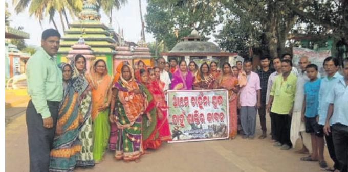
ଭୂଷିଆ-ୟୁକ୍ତେନ ମଧ୍ୟରେ ଚାଲିଥିବା ଯୁଦ୍ଧ ବନ୍ଦ ପାଇଁ ଶୋଭାଯାତ୍ରା କରାଯାଇଛି।