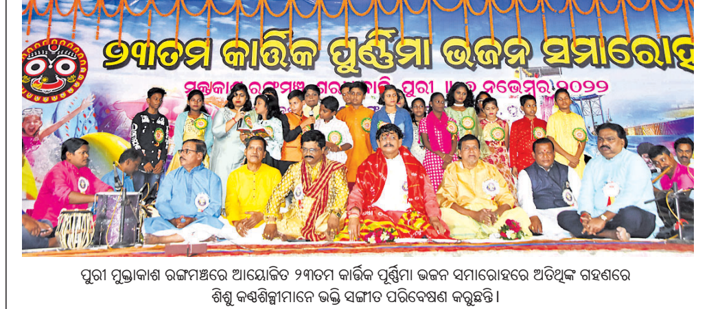
ପୁରୀ ପୁସ୍ତକାଳୟ ଉପାଧିକାରୀ ଆୟୋଜିତ ୨୩ତମ କାର୍ତ୍ତିକ ପୂର୍ଣ୍ଣିମା ଭଜନ ସମାରୋହରେ ଅତିଥିକ ଗଣଗଣରେ ଶିଶୁ କଣ୍ଠଶିଳ୍ପୀମାନେ ଭକ୍ତି ସଙ୍ଗୀତ ପରିବେଷଣ କରୁଛନ୍ତି।