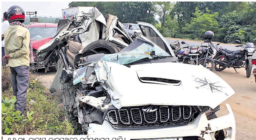
୧୬ ନଂ. ଜାତୀୟ ରାଜପଥରେ ଦୁର୍ଘଟଣାଗ୍ରସ୍ତ ଗାଡ଼ି।

ଉତ୍ତରଓଡ଼ିଶାର ବାଲେଶ୍ୱର ଓ ମୟୂରଭଞ୍ଜ ଜିଲ୍ଲାରେ ସୋମବାର ଦୁଇଟି ମର୍ଦ୍ଦକୃତ ଦୁର୍ଘଟଣାରେ ୫ଜଣଙ୍କ ମୃତ୍ୟୁ ହୋଇଛି। ବାଲେଶ୍ୱର ସିପୁଲିଆ ଥାନା ଅଞ୍ଚଳରେ ୩ଜଣଙ୍କ ମୃତ୍ୟୁ ହୋଇଥିବା ବେଳେ ମୟୂରଭଞ୍ଜ ଜିଲ୍ଲା ଠାକୁରମୁଣ୍ଡା-କରଞ୍ଜିଆ ରାସ୍ତାରେ ୨ ଯୁବକଙ୍କ ପ୍ରାଣହାନି ଘଟିଛି।