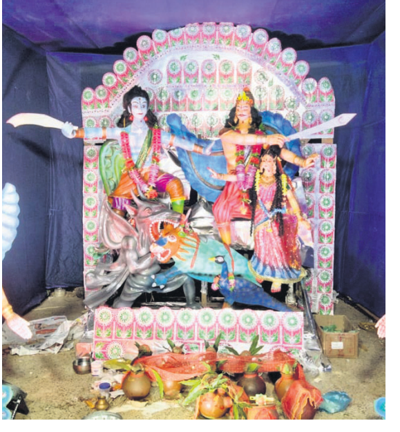
ଡେକାନାଲ ଜିଲ୍ଲା କକଡ଼ାହାଡ଼ ବ୍ଲକ ଗଡ଼ପଲ୍ଲୀ ଶୁଣା ଗ୍ରାମର ବିଭିନ୍ନ ମଞ୍ଚପରେ ପୂଜା ପାଉଥିବା ପ୍ରଭୁ ଶ୍ରୀକାର୍ତ୍ତିକେଶ୍ୱରଙ୍କ ମେଡ଼ ।