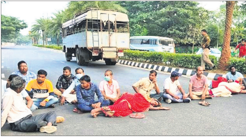
ରାସ୍ତାରୋକ୍ତ କରିଥିବା କିଡ଼ନୀ ରୋଗୀ ଓ ସେମାନଙ୍କ ସମ୍ପର୍କୀୟ।