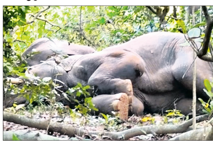
ନିସ୍ତେଜ ହୋଇ ଶୋଇ ରହିଥିବା ୨ ହାତୀ।

କେନ୍ଦୁଝର ଜିଲ୍ଲା ପାଟଣା ରେଞ୍ଜ ଅଞ୍ଚଳରେ ରନ୍ଧା ମହୁଲି ମଦ ପୋତ ପିଇ ୨ ହାତୀ ମାତାଲ ହେବା ଚର୍ଚ୍ଚାର ବିଷୟ ହୋଇଛି।