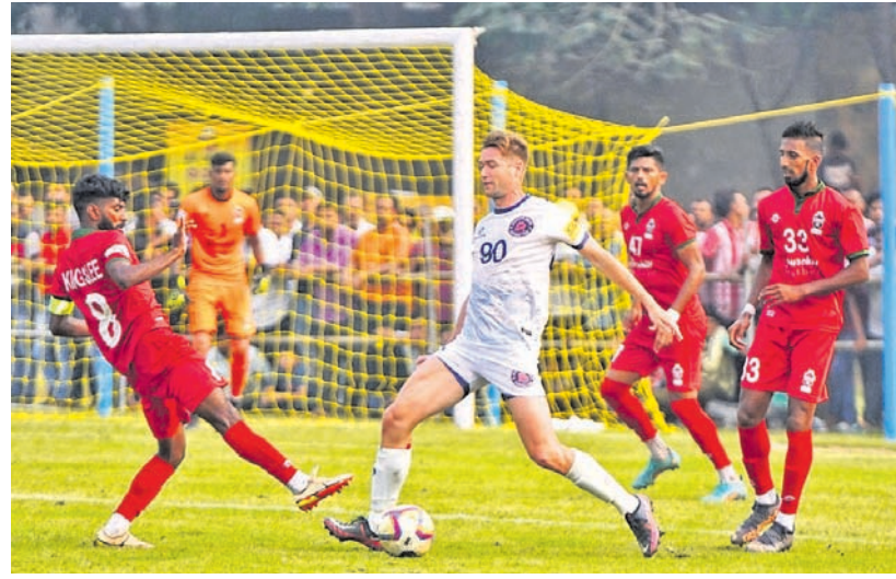
ଅନୁଗୋଳ ଜିଲା ଚାକଚେରସ୍ଥିତ ଏମ୍.ଏସ.ଏଲ୍. ସ୍କୁଲ ଡାକ୍ତରୀୟ ଷ୍ଟାଡ଼ିୟମରେ ବାଲି ରାଉଟ କପ୍ ଜାତୀୟ ଯୁବକ ଚୁନାମେଶ୍ୱର ଫାଇନାଲ ମ୍ୟାଚରେ ଗୋଆ ଓ ରାଜସ୍ଥାନ ମଧ୍ୟରେ କେଡୋଟି ସଂଘର୍ଷପୂର୍ଣ୍ଣ ମୁହୂର୍ତ୍ତ।