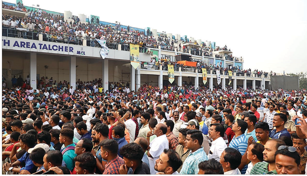
ଫାଇନାଲ ମ୍ୟାଚ ଦେଖିବାକୁ ସ୍କୁଲ ଡାକ୍ତରୀୟ ଷ୍ଟାଡ଼ିୟମରେ ଭରପୂର ଦର୍ଶକ।