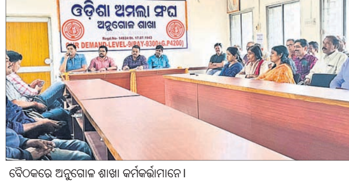
ବୈଠକରେ ଅନୁଗୋଳ ଶାଖା କର୍ମକର୍ତ୍ତାମାନେ।