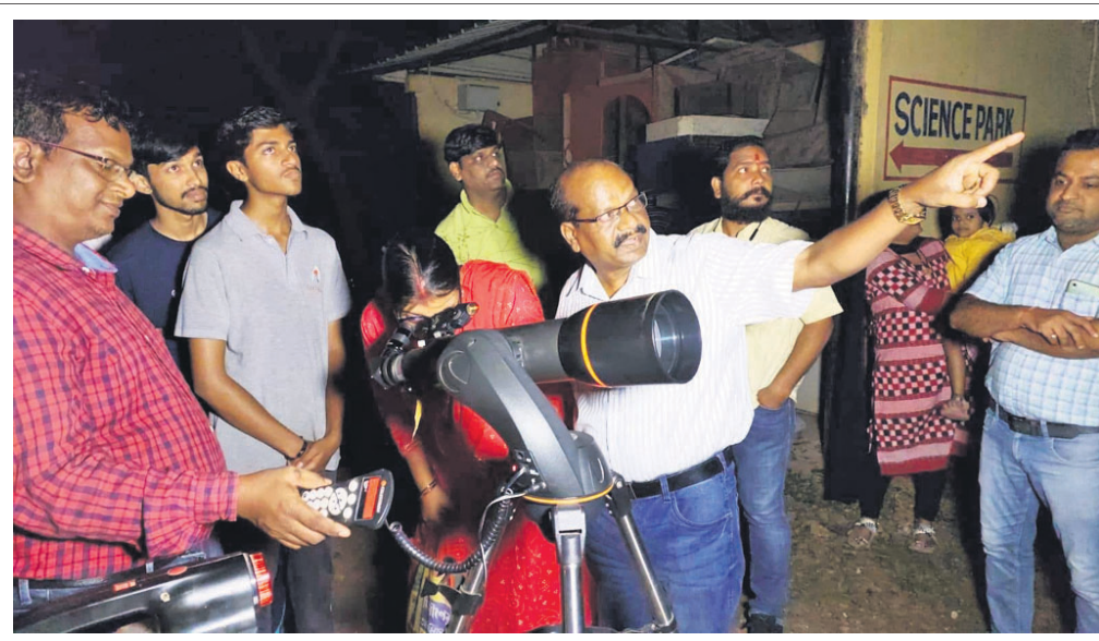
ଡେକାନାଲ ବିଜ୍ଞାନ କେନ୍ଦ୍ର ପରିସରରେ ମଙ୍ଗଳବାର ସନ୍ଧ୍ୟାରେ ଚନ୍ଦ୍ରଗ୍ରହଣ ଦେଖିବା ଲାଗି ଭିଡ଼ ଜମିଛି (ବାମ) । ଡେକାନାଲ ଆକାଶରେ ଚନ୍ଦ୍ରଗ୍ରହଣ ବେଳର ଦୃଶ୍ୟ ।