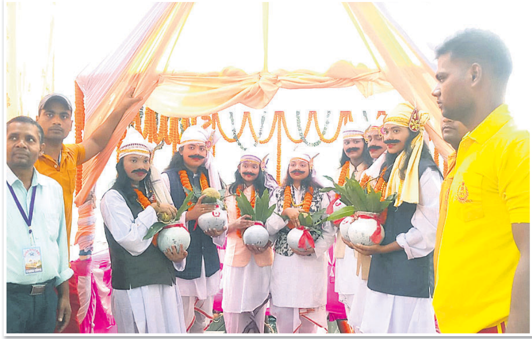
ଡେକାନାଲ 'ସନ୍ଧ୍ୟାତାରା ସାହିତ୍ୟ ସଂସଦ' ଅନୁଷ୍ଠାନ ପକ୍ଷରୁ ମଙ୍ଗଳବାର ଅନୁଷ୍ଠିତ ୪୦ତମ ବୋଇତ ବନ୍ଦାଣ ଉତ୍ସବ ଉପଲକ୍ଷେ ଆୟୋଜିତ ସାଧବବୋହୂ ଓ ସାଧବପୁଅ ପ୍ରତିଯୋଗିତାରେ ଭାଗ ନେଇଥିବା ପ୍ରତିଯୋଗୀମାନେ ।