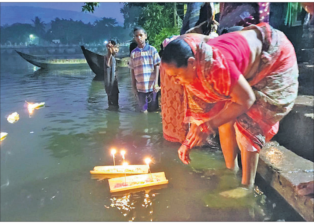
ଡେକାନାଲ ସହରସ୍ଥିତ ଭାଗରଥ ସାଗର ନୂଆ ପୋଖରୀରେ କଣେ ମହିଳା ଭୋର୍ ସମୟରେ ବୋଇତ ଭସାଇଛନ୍ତି ।