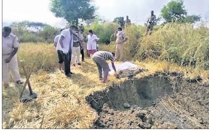
କେସିବି ସାହାଯ୍ୟରେ ମୃତଦେହ ପୋଡ଼ିଥିବା ସ୍ଥାନ ଖୋଲାଯାଉଛି।

ନୂଆପଡ଼ା ଅଞ୍ଚଳ, ୮।୧୧: ନୂଆପଡ଼ା ସଦର ଥାନା ଗାନ୍ଧୀ ପଞ୍ଚାୟତ ରତିପାଲି ଗାଁର ମୂଳ ୨ ପ୍ରଥମ ବର୍ଷ ଛାତ୍ରୀ ନିଖୋଜ ଘଟଣାର ଗୁମର ଖୋଲିଛି ବେନାମା ଚିଠି।