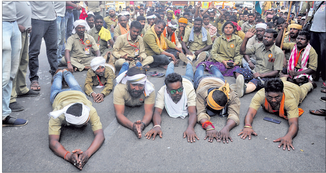
ଭ୍ରାତୃଭରତମାନେ ଦଣ୍ଡବତ ଯାତ୍ରା କରି ଲୋକ୍ଷର ପିଏମ୍‌ସି ଅଭିଯୁକ୍ତ ଯାଉଛନ୍ତି।

ଭୁବନେଶ୍ୱର, ୮।୧୧ (ବୁଧବାର) ୯ ଦିନା ଦାବି ନେଇ ଏକାଧିକ ଥର ଆନ୍ଦୋଳନ ପରେ ପ୍ରତିଷ୍ଠିତ ପୁରଣ କରା ନ ଯିବାରୁ ଶେଷରେ ରାଜ୍ୟ ଭ୍ରାତୃଭରତ ମହାସଂଘ ଆନ୍ଦୋଳନକୁ ଓହ୍ଲାଇଛି। ମହାସଂଘ ପକ୍ଷରୁ ମଙ୍ଗଳବାର ଦଣ୍ଡବତ ଯାତ୍ରା କରାଯିବା ସହ ଭୁବନେଶ୍ୱର ଲୋକ୍ଷର ପିଏମ୍‌ସିରେ ଧାରଣା ଦିଆଯାଇଛି। ଭ୍ରାତୃଭରତ ମହାସଂଘର କର୍ମକର୍ତ୍ତାମାନେ ଗତ ଅକ୍ଟୋବର ୧୮ରେ ସମ୍ବଲପୁରର ଆରାଧ୍ୟା ଠାକୁରାଣୀ ମା' ସମଲେଶ୍ୱରୀଙ୍କୁ ଦଣ୍ଡବତ କରି ଯାତ୍ରା ଆରମ୍ଭ କରିଥିଲେ। ସେମାନେ ଦଣ୍ଡବତ ଯାତ୍ରା କରିନବୀନ ନିବାସ ଅଭିଯୁକ୍ତ ଆଧିକାରୀଙ୍କୁ ଏଥିରେ ବିଭିନ୍ନ ଜିଲାର ଭ୍ରାତୃଭରତ ସଂଘର ସଦସ୍ୟମାନେ ସାମିଲ ହୋଇଥିଲେ। ମଙ୍ଗଳବାର ପୂର୍ବାହ୍ନରେ ଭୁବନେଶ୍ୱର ପଳାଶୁଣୀଠାରେ ବିଭିନ୍ନ ସ୍ଥାନରୁ ୫୦୦ରୁ ଊର୍ଦ୍ଧ୍ୱ ଭ୍ରାତୃଭରତ ଏକାଠି ହୋଇ ନବୀନ ନିବାସ ଅଭିଯୁକ୍ତ ଦଣ୍ଡବତ ଯାତ୍ରା ଆରମ୍ଭ କରିଥିଲେ। ସେମାନଙ୍କର ଦାବିକୁ ନେଇ ପୂର୍ବଦିଗର ଜୀବନ ଗଲେ ୨୦ ଲକ୍ଷ ଟଙ୍କାର ଦାମା ରାଶି ଦେବା, ଅର୍ଜନୀଙ୍କୁ ୧୦ ଲକ୍ଷ