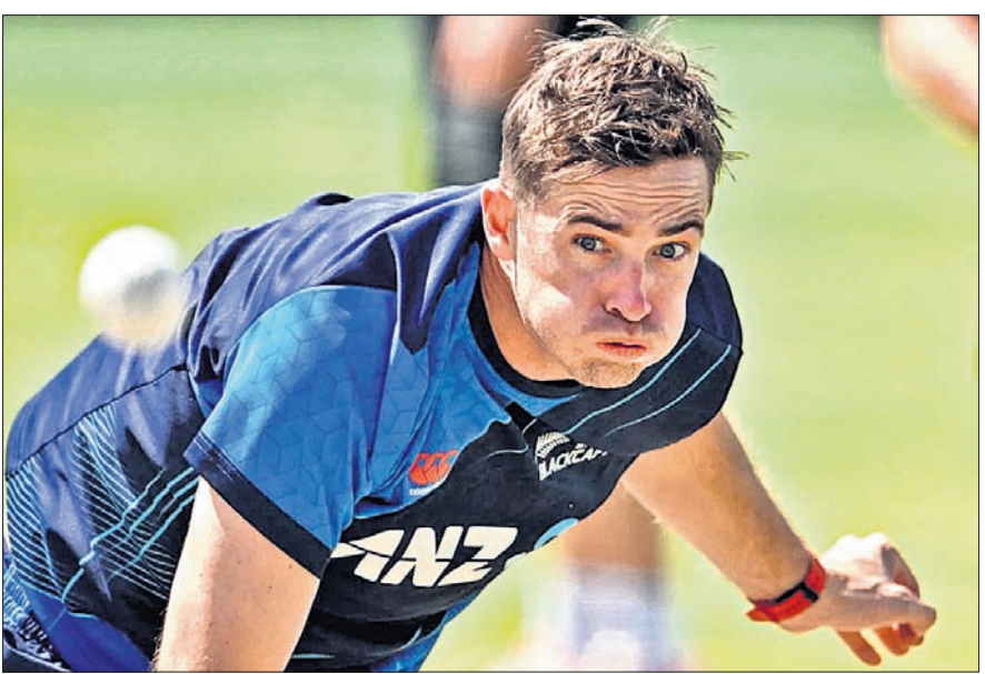
ଅଭ୍ୟାସ ଅବସରରେ ଟିମ୍ ସୌଦି।

ଉଭୟ ଦଳର ରେକର୍ଡକୁ ଦେଖିଲେ ପାକିସ୍ତାନର ପଲ୍ଲୀ ଭାରି ରହିଛି। ବିଶ୍ଵକପ୍ରେ ଉଭୟ ଦଳ ୩ ଥର ସାମ୍ନାସାମ୍ନା ହୋଇଥିବା ବେଳେ ଲୁଇଜିଆଣ୍ଡ ଥରେ ମଧ୍ୟ ଲିଟିପାରି ନାହିଁ। ପାକିସ୍ତାନର ସେମି ପ୍ରବେଶ ଅତ୍ୟନ୍ତ ନୀରବ୍ୟ ରହିଥିବା ବେଳେ ଲୁଇଜିଆଣ୍ଡ ନିଜର ଗୁପ୍ତ ମ୍ୟାଚଗୁଡ଼ିକରେ ଏକପାଖିଆ ବିଜୟ ହାସଲ କରିଛି। ଗୁପ୍ତ ବିରେ ଗ୍ଲାନ ପାଇଥିବା ପାକିସ୍ତାନ ଭାରତ ଓ ଜିମ୍ବାୱେଠାରୁ ହାରିଥିଲେ