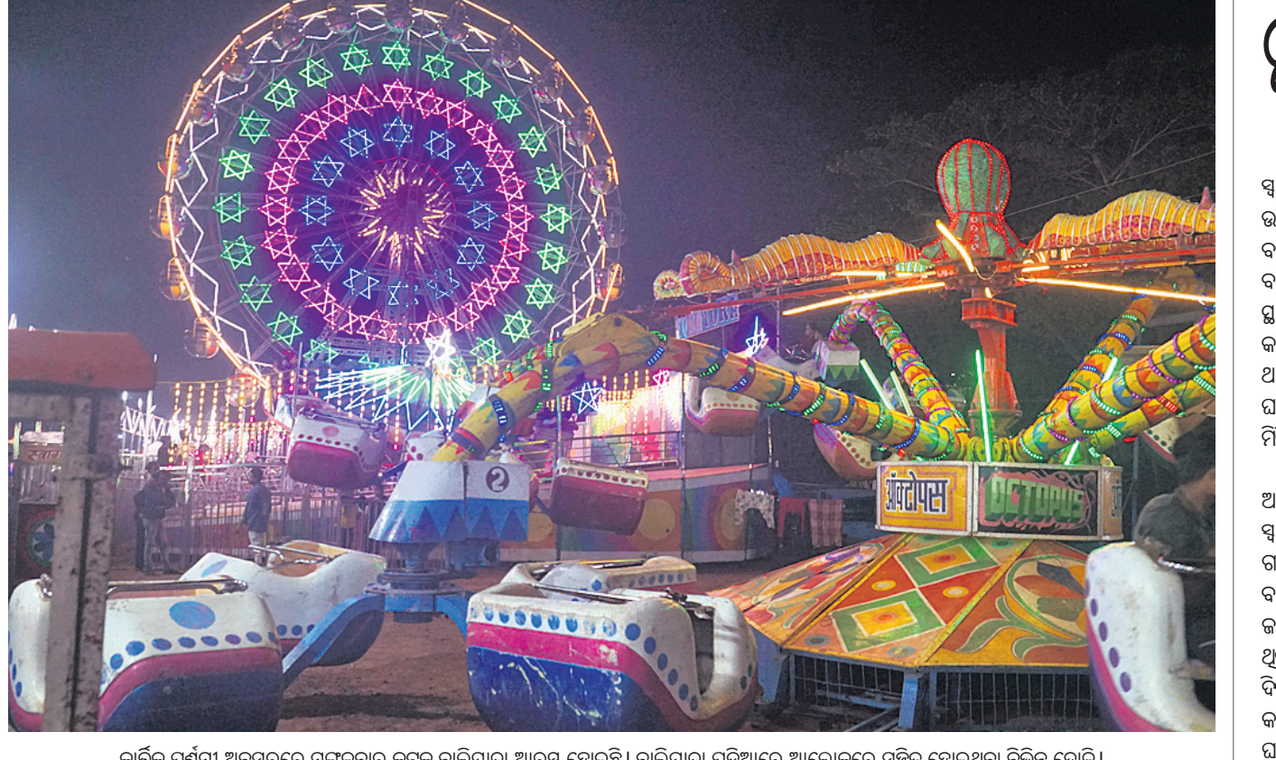
କାର୍ତ୍ତିକ ପୂର୍ଣ୍ଣମୀ ଅବସରରେ ମଙ୍ଗଳବାର କଟକ ବାଲିଯାତ୍ରା ଆରମ୍ଭ ହୋଇଛି। ବାଲିଯାତ୍ରା ପଡ଼ିଆରେ ଆଲୋକରେ ସଜଡ଼ି ହୋଇଥିବା ବିଭିନ୍ନ ବୋଲି।