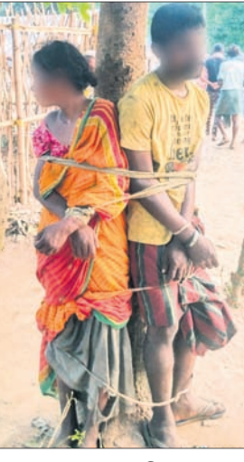
ଗଛରେ ବନ୍ଧା ହୋଇଥିବା ମହିଳା ଓ ମୁରକ। ରେପୁଟା ଅଞ୍ଚଳର ସମ୍ପୃକ୍ତ ମୁରକଙ୍କ ସହ ମିଶ୍ରିତ ଭାବେ ସ୍ୱାମୀଙ୍କୁ ହତ୍ୟା କରିଥିବା ଗ୍ରାମବାସୀ ସନ୍ଦେହ କରିଥିଲେ। ପରେ ଘରଭିତରେ ତାଙ୍କ ମୃତଦେହ ପଡ଼ିଥିବା ଦେଖିବାକୁ ମିଳିଥିଲା। ମହିଳା ଜଣକ

ବେତନଟା, ୮।୧୧ (ବୁଧବାର): ସ୍ୱାମୀଙ୍କ ସନ୍ଦେହଜନକ ମୃତ୍ୟୁ ପରେ ଉତ୍ତମ ଗ୍ରାମବାସୀ କଙ୍ଗାକୁକୋର୍ଟ ବ୍ୟାଜ ପ୍ରା ଓ ଜଣେ ମୁରକଙ୍କୁ ଗଛରେ ବାନ୍ଧି ନିମ୍ମୁକ୍ତି ମାଡ଼ ମାରିବା ଘଟଣା ସ୍ଥାନୀୟ ଅଞ୍ଚଳରେ ଆଲୋଚନା ସୃଷ୍ଟି କରିଛି। ମଧୁରଭଞ୍ଜ ଜିଲ୍ଲା ବେତନଟା ଥାନା ଅଧୀନ ଗରୁଡ଼ବସୀ ଗ୍ରାମରେ ଏହି ଘଟଣା ଘଟିଛି। ଏହାର ଭିତ୍ତି ଓ ସାବିତ୍ରୀ ଆଲି ମିଡ଼ିଆରେ ଭାଇରାଲ ହେବାରେ ଲାଗିଛି। ଗ୍ରାମବାସୀଙ୍କଠାରୁ ମିଳିଥିବା ସୂଚନା ଅନୁଯାୟୀ, ମୃତ ବ୍ୟକ୍ତିଙ୍କ ପ୍ରାଣ ବର୍ଷ ହେଲା ସ୍ୱାମୀଙ୍କଠାରୁ ଅଲଗା ରହୁଥିଲେ। ସେହି ଗରୁଡ଼ବସୀ ଗାଁରେ ଘର କରି ରହୁଥିବା ବାଲେଶ୍ୱର ଜିଲ୍ଲା ରେପୁଟା ଥାନା ଅଞ୍ଚଳର ଜଣେ ମୁରକଙ୍କ ସହ ତାଙ୍କର ସମ୍ପର୍କ ଥିଲା। ସେମାନଙ୍କ ମହିଳାଙ୍କ ସ୍ୱାମୀ ଦିନତମାମ ସ୍ୱାଭାବିକ ଭାବେ ବୁଲୁଥିଲେ କହୁଥିଲେ। ମାତ୍ର ମଙ୍ଗଳବାର ସକାଳେ ଘରଭିତରେ ତାଙ୍କ ମୃତଦେହ ପଡ଼ିଥିବା ଦେଖିବାକୁ ମିଳିଥିଲା। ମହିଳା ଜଣକ