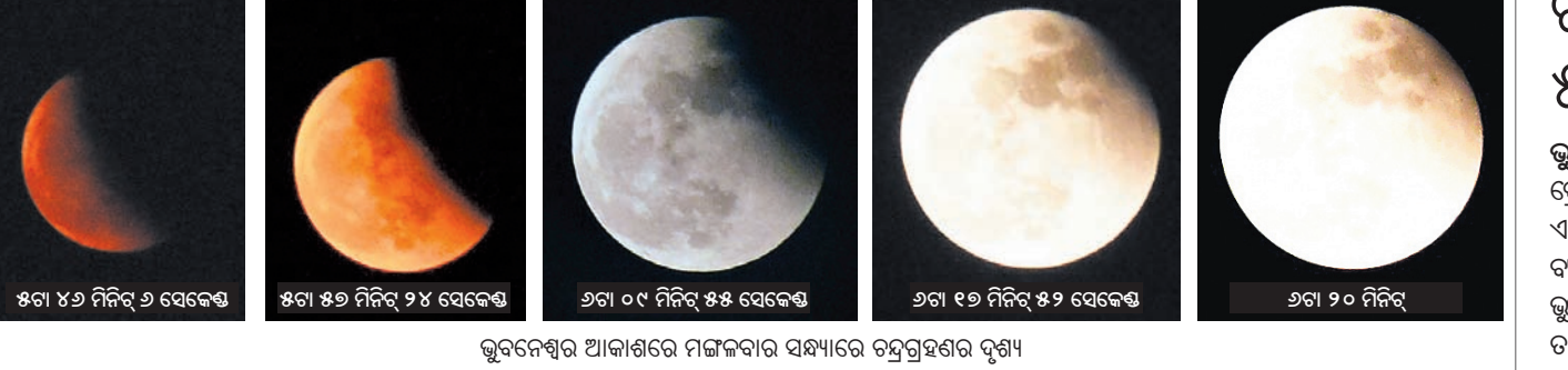
ଭୁବନେଶ୍ୱର ଆକାଶରେ ମଙ୍ଗଳବାର ସନ୍ଧ୍ୟାରେ ଚନ୍ଦ୍ରଗ୍ରହଣର ଦୃଶ୍ୟ