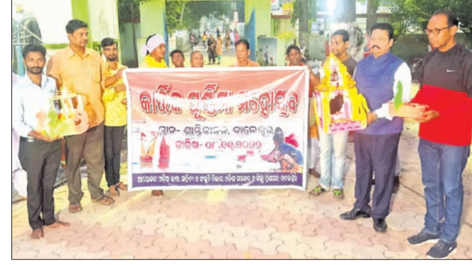
ଶାନ୍ତିକାନ୍ଦନ ପରିସରରେ ଜିଲ୍ଲା ପ୍ରଶାସନ ପକ୍ଷରୁ ଅଧିକାରୀ ବୋଇତ ଭସାଇବା ଲାଗି ଯାଉଛନ୍ତି।