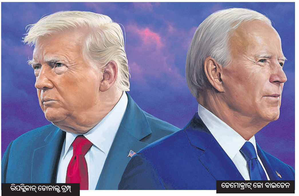
ରିପବ୍ଲିକାନ୍ ଡୋନାଲ୍ଡ ଟ୍ରମ୍ପ ଡେମୋକ୍ରାଟ୍ କୋ ବାଇଡେନ୍

ଦ୍ୱିବାର୍ଷିକ ମଧ୍ୟବର୍ତ୍ତୀକାଳୀନ ନିର୍ବାଚନ (ମିଡ୍‌ଟର୍ମ୍) ପାଇଁ ଆମେରିକା ରାଜନୀତି ଏବେ ଚଳଚଞ୍ଚଳ। କାରଣ ଶାସକ ଡେମୋକ୍ରାଟିକ୍ ପାର୍ଟି ପଞ୍ଚାଶୁ କଂଗ୍ରେସକୁ ଛଡ଼ାଇନେବା ପାଇଁ ବିରୋଧୀ ରିପବ୍ଲିକାନ୍ ପାର୍ଟି ସବୁ ପ୍ରକାର ଉଦ୍ୟମ ଚଳାଇଛି। ରାଷ୍ଟ୍ରପତି କୋ ବାଇଡେନ୍‌ଙ୍କ ପ୍ରଦର୍ଶନକୁ ଦେଖିବାପା କିପରି ଦେଖୁଛନ୍ତି ଏବଂ ତାଙ୍କ କାର୍ଯ୍ୟକାଳର ଅବଶିଷ୍ଟ ୨ ବର୍ଷ କେମିତି ରହିବ, ଏହି ନିର୍ବାଚନର ପରିଣାମ ତାହାର ପ୍ରମାଣ ଦେବ। ଏଥିସହ ରିପବ୍ଲିକାନ୍ ଡୋନାଲ୍ଡ ଟ୍ରମ୍ପ ୨୦୨୪ ରାଷ୍ଟ୍ରପତି ନିର୍ବାଚନରେ ପ୍ରାଥମିକ ହେବେ କି ନାହିଁ ତାହା ମଧ୍ୟ ଏହି ଫଳାଫଳ ନିଶ୍ଚିତ କରିବ ବୋଲି କୁହାଯାଇଛି। ଏହି ଦୃଷ୍ଟିରୁ କେବଳ ଆମେରିକା ରୁହେଁ, ସାରା ବିଶ୍ୱର ନଜର ମିଡ୍‌ଟର୍ମ୍ ରେଜଲ୍ଟ ଉପରେ କେନ୍ଦ୍ରୀଭୂତ ହୋଇଛି।