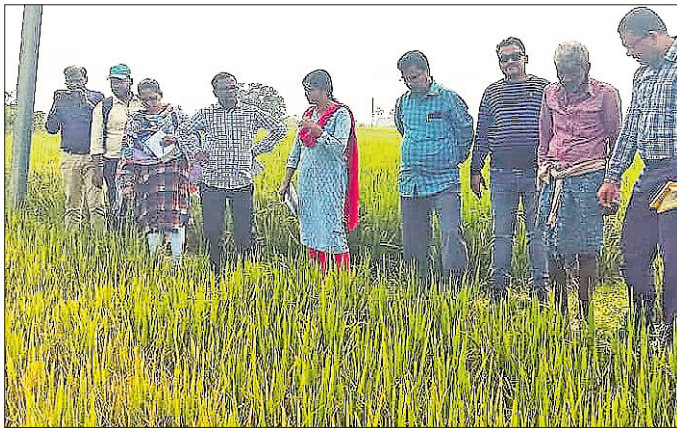
ଧାନ ଜମିରେ ଦେଖାଦେଖିବାରେ ଅନୁଧ୍ୟାନ କରୁଛନ୍ତି।

ବାଲେଶ୍ୱର ଜିଲ୍ଲା କଳେଶ୍ୱରର ବିଭିନ୍ନ ଅଞ୍ଚଳରେ ଚଳିତାବର୍ଷ ଧାନ ଚାଷରେ ଲାଭିଛି । ଏ ସମ୍ପର୍କରେ ଧରିତ୍ରୀରେ ପ୍ରକାଶ ପାଇବା ପରେ ମଙ୍ଗଳବାର ଜିଲ୍ଲା କେଭିକେ (କୃଷି ବିଜ୍ଞାନ କେନ୍ଦ୍ର)ର ଦେଖାଦେଖି କଳେଶ୍ୱର ଅଞ୍ଚଳର ବିଭିନ୍ନ ପଞ୍ଚାୟତ ବୁଲି ପରିଦର୍ଶନ ଅନୁଧ୍ୟାନ କରିଛନ୍ତି। ଅତିଶୀଘ୍ର ନିର୍ଦ୍ଦେଶ କାର୍ଯ୍ୟକ୍ରମ ଓ କେତେକ ପ୍ରଶାଳନା ଚାଷୀମାନେ ଆପଣେଇବାକୁ ସେମାନେ ପରାମର୍ଶ ଦେଇଛନ୍ତି। ଅନ୍ୟପକ୍ଷରେ ସେମାନେ ସରକାରଙ୍କୁ ସଚେତନ କରିବା ପାଇଁ ଚାଷୀଙ୍କ ପ୍ରଶ୍ନର ଉତ୍ତରରେ କହିଛନ୍ତି । ଚଳିତବର୍ଷ କଳେଶ୍ୱରରେ ୨୧ହକାର ହେକ୍ଟର ଜମିରେ ଧାନ ଚାଷ ହେବ ବୋଲି ଆକଳନ କରାଯାଇଥିଲା। କିନ୍ତୁ ପ୍ରତିକୂଳ ପାଗ ଯୋଗୁ ୧୧୫୦୦ହେକ୍ଟର ଜମିରେ ଚାଷ ଆରମ୍ଭ ହୋଇଥିଲା। ଏବେ ବାଲୁମଣ୍ଡଳରେ ଚାଷମାତ୍ର ଆଶାତୀତ ଭାବେ କମି ନ ଥିବାରୁ ତଥା ଅଧିକ