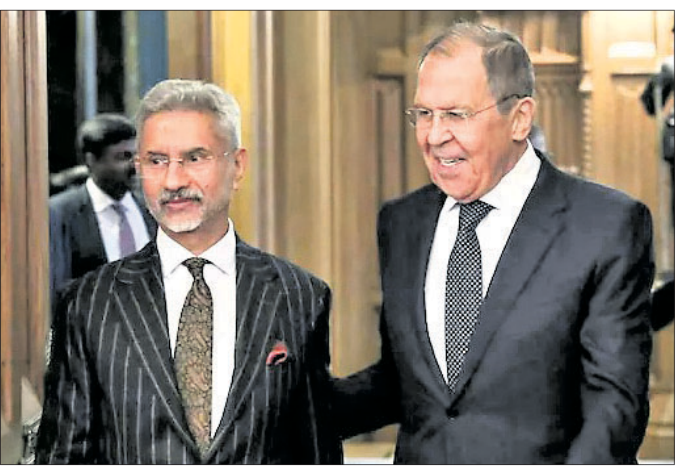
ବହିର୍ଦ୍ୱାରା ମନ୍ତ୍ରୀ ଏସ୍. ଜୟଶଙ୍କରଙ୍କ ସହ ରୁଷିଆ ପ୍ରତିପକ୍ଷ ସର୍ବନିକ୍ଷା ଲାଭରୋକ୍ଷ୍ମ। ଜୟଶଙ୍କର କହିଛନ୍ତି। ଏହା ବ୍ୟତୀତ ଆତଙ୍କବାଦ ଏବଂ କଳଦାୟ ପରିବର୍ତ୍ତନ ଭୁଲ୍‌ଟି ପ୍ରମୁଖ ଏବଂ ସ୍ଥାୟୀ ସମସ୍ୟା ହୋଇ ରହିଆସିଛି ଯାହା ବିଶ୍ୱାଳ ଓ ସମୃଦ୍ଧି ଉପରେ ଧ୍ୱଂସାତ୍ମକ ପ୍ରଭାବ ପକାଇଛି। ଆଲୋଚନା ମାଧ୍ୟମରେ ଆଞ୍ଚଳିକ ସମସ୍ୟା ସମେତ ବିଶ୍ୱ ସ୍ଥିତିର

ନୂଆଦିଲ୍ଲୀ, ୮।୧୧ ମସ୍ୟା ଗ୍ରହଣେ ଥିବା ଭାରତର ବହିର୍ଦ୍ୱାରା ମନ୍ତ୍ରୀ ଏସ୍. ଜୟଶଙ୍କର ମଜଲିସ୍‌ରେ ତାଙ୍କ ରୁଷିଆ ପ୍ରତିପକ୍ଷ ସର୍ବନିକ୍ଷା ଲାଭରୋକ୍ଷ୍ମ କେଉଁଛନ୍ତି। ଏହି ଅବସରରେ ବୁଲ୍ ନେତା ଯୁକ୍ରେନ୍ ଯୁଦ୍ଧ ସମେତ ନିର୍ଦ୍ଦିଷ୍ଟ ଆଞ୍ଚଳିକ ସମସ୍ୟା ଓ ବିଶ୍ୱ ସ୍ଥିତି ସମ୍ପର୍କରେ ଆଲୋଚନା କରିଥିଲେ। ଯୁକ୍ରେନ୍-ରୁଷିଆ ଯୁଦ୍ଧର ସମାଧାନ ନିମନ୍ତେ ମସ୍ୟା ଆଲୋଚନାକୁ ଫେରିବା ଲାଗି ଜୟଶଙ୍କର ଚାପ ପକାଇଛନ୍ତି। କୋଭିଡ୍ ମହାମାରୀ, ଆର୍ଥିକ ଚାପ ଏବଂ ବାଣିଜ୍ୟିକ ସମସ୍ୟାକୁ ନେଇ ଗତ କିଛିବର୍ଷ ହେଲା ଅନ୍ତର୍ଜାତୀୟ ସ୍ଥିତି ଉଦ୍‌ବେଗଜନକ ରହିଛି। ଏଥିପାଇଁ ବିଶ୍ୱ ଅର୍ଥନୀତି ଗୁରୁତର ପ୍ରଭାବିତ ହୋଇଛି। ଯୁକ୍ରେନ୍ ଯୁଦ୍ଧ ଏହାର ଏକ ବଡ଼ ପରିଣାମ ଭାବେ ଦେଖାଦେଇଥିବା