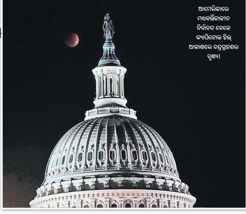
ଆମେରିକାରେ ମଧ୍ୟବର୍ତ୍ତୀକାଳୀନ ନିର୍ବାଚନ ବେଳେ କ୍ୟାପିଟୋଲ୍ ହିଲ୍ ଆକାଶରେ ଚନ୍ଦ୍ରଗ୍ରହଣର ଦୃଶ୍ୟ।

ନୂଆଦିଲ୍ଲୀ, ୮।୧୧: ଭାରତୀୟ ଦରିଶ୍ଚ ନେତା ଲାଲ୍‌କୁଶ୍ଠ ଆଡ଼ଭାନାଙ୍କ ୯୫ତମ ଜନ୍ମଦିନରେ ପ୍ରଧାନମନ୍ତ୍ରୀ ନରେନ୍ଦ୍ର ମୋଦି ତାଙ୍କୁ ବାସଭବନରେ ଭେଟି ଅଭିନନ୍ଦନ ଜଣାଇଛନ୍ତି। ଭାରତର ଅଭିଭବନେ ଆଡ଼ଭାନାଙ୍କ ଅବଦାନ ଏକ ସ୍ମାରକ। ତାଙ୍କର ଦୁର୍ଘଟଣା ଏବଂ ଚୁକ୍ତିମତ ପାଇଁ ସାରା ଦେଶ ତାଙ୍କୁ ସମ୍ମାନ ଦେଇଥାଏ। ଭାରତୀୟ ଗଢ଼ିବା ଓ ସୁଦୃଢ଼ କରିବାରେ ଆଡ଼ଭାନାଙ୍କ ଅବଦାନ ଅତୁଳନୀୟ ବୋଲି ପ୍ରଧାନମନ୍ତ୍ରୀ ଚୁକ୍ତି କରିଛନ୍ତି।