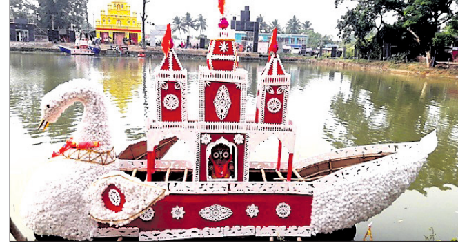
ବସନ୍ତୀଠାରେ ଭସାଇଲେ ବୋଇତ।