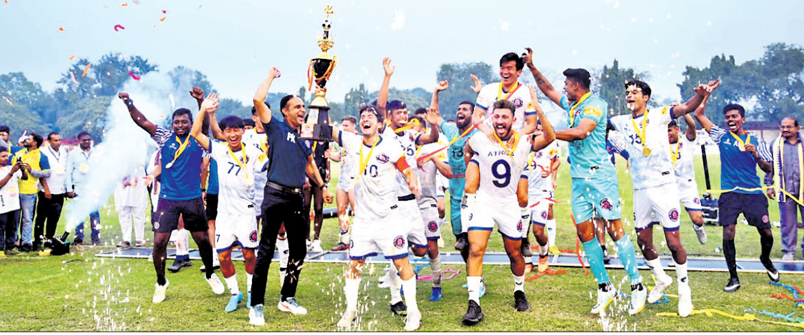
ଟ୍ରଫି ହାସଲ କରିବା ପରେ ଚାମ୍ପିୟନ ରାଜସ୍ଥାନ ଦଳର ଖେଳାଳିମାନେ ଖୁସି ମନାଉଛନ୍ତି।