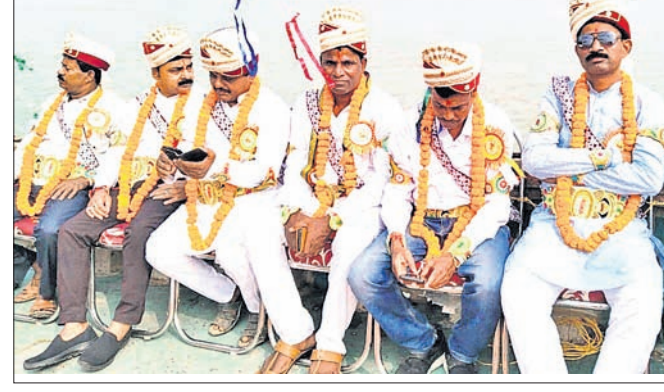
ସାଧବପୁଅ ବେଶରେ ବୋଇତ ଯାତ୍ରା।