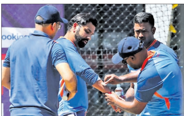
ରୋହିତ ଶର୍ମାଙ୍କ ଆହତ ଗ୍ଲାନର ଚିକିତ୍ସା କରାଯାଇଛି।