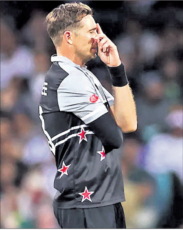
ପାକିସ୍ତାନରୁ ଚଳିଥିବା ପରାଜୟ ପରେ ମର୍ମାହତ ଟିମ୍ ସୋନା