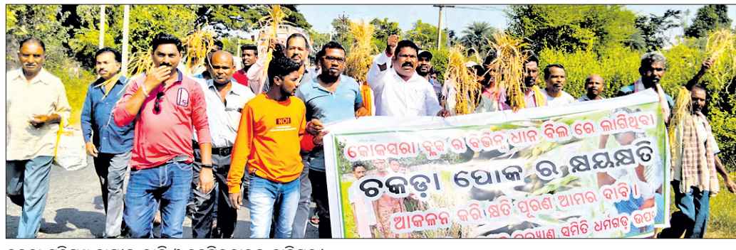
ଚକଡ଼ା କ୍ଷତିଗ୍ରସ୍ତ ଗାଈଙ୍କ ରାଲି ଓ ତହସିଲଦାରଙ୍କୁ ଦାବିପତ୍ର।