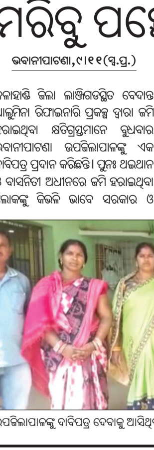
ଉପଜିଲାପାଳଙ୍କୁ ଦାବିପତ୍ର ଦେବାକୁ ଆସିଥିବା କ୍ଷତିଗ୍ରସ୍ତ ଜମିଦାର।

ଭୋଟର ତାଲିକା ସଂଗୋଧନ ବୈଠକରେ ଉପସ୍ଥିତ ଅତିଥି।