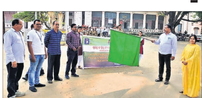
ସବୁଜ ପତାକା ଦେଖାଇ ଶୋଭାଯାତ୍ରା ଶୁଭାରମ୍ଭ କରାଯାଇଛି ।

ସହର ପରିକ୍ରମା କରିବା ସହ ଲୋକଙ୍କୁ ସଚେତନ କରିଥିଲେ । ଏହି ଅବସରରେ ୧୭ ବର୍ଷରୁ ଉର୍ଦ୍ଧ୍ୱ ସମସ୍ତ ଯୁବ ବର୍ଗଙ୍କ ପାଇଁ ଆଇନର ଅଗ୍ରାମ ଭାବେ ଅନୁଲୋଚନ ଯୋଗେ କିମ୍ବା ରୁପସ୍ତରାୟ ଅଧିକାରୀଙ୍କ ସହାୟତାରେ ନିଜକୁ ଜଣେ ଭୋଟର ଭାବେ ପଞ୍ଜୀକୃତ କରିପାରିବେ । ଏନ୍-ଏସ୍-ଏସ୍ ସେଲ୍ ସେବା ଓ ଏନ୍-ସି-ସି କ୍ୟାଡେଟମାନେ ବିଭିନ୍ନ ସଚେତନତା ମୁକ୍ତ ସ୍ଥାନରେ ସମ୍ବଳିତ ପ୍ଲାକାର୍ଡ ଧରି