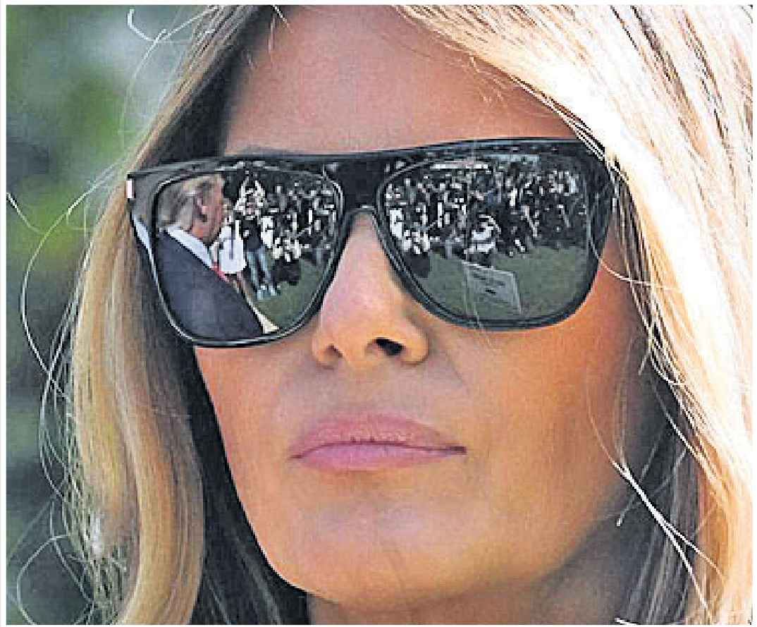
ପୂର୍ବତନ ରାଷ୍ଟ୍ରପତି ହୋନୋରାବ୍ଲ ଗ୍ରୀ ମେଲାନିଆ ଗ୍ରୀ ପୁରୁଷୋତ୍ତମ ପାଠ ବିଦ୍ୟୁତ ଏକ ମତବାନ କେନ୍ଦ୍ର ନିକଟରେ ଛିଡ଼ା ହୋଇଛନ୍ତି । ତାଙ୍କ ସମ୍ମୁଖରେ ରିପବ୍ଲିକନ୍ ଗ୍ରୀଙ୍କ ମୁହଁ ଦେଖାଯାଉଛି ।