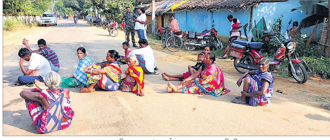
ମୃତକଙ୍କ ପରିବାର ଲୋକ ଓ ସମ୍ପର୍କୀୟ ରାତ୍ରୀ ଅବରୋଧ କରିଛନ୍ତି।