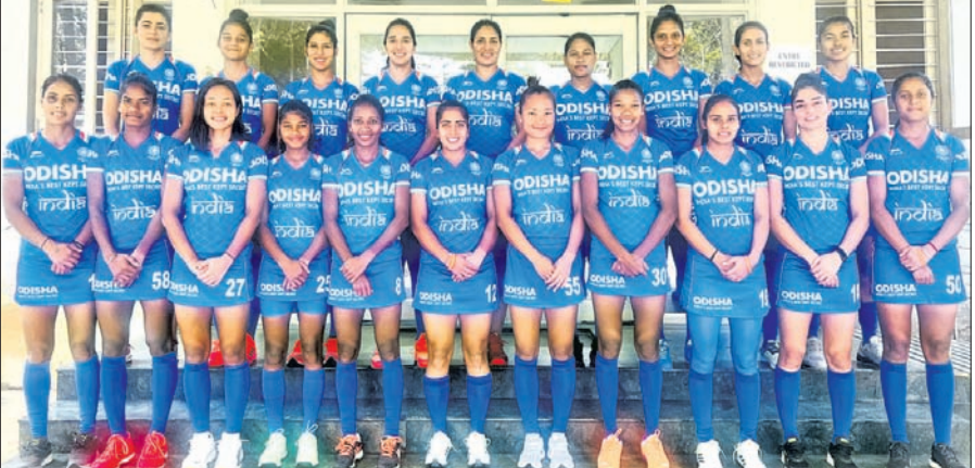
ଏସ୍ଆଇଏଚ୍ ମହିଳା ନେସନ୍ସ କପ୍ ପାଇଁ ମନୋନୀତ ଭାରତୀୟ ହକି ଦଳ

ପ୍ରଥମ ସଂସ୍କରଣରେ ରନରାଜ ହୋଇଥିବାବେଳେ ୨୦୦୯ରେ ଚାଣ୍ଡିଆ ହୋଇଥିଲା। ଏହାପରେ ୨୦୧୦, ୨୦୧୨ ଓ ୨୦୧୧ରେ ସେମିଫାଇନାଲକୁ ବିଦାୟ ନେଇଥିଲା। ଏଥର କିନ୍ତୁ ଦଳ ପାଇଁ ଦ୍ୱିତୀୟ ଥର ଲାଗି ଟ୍ରଫି ଜିତିବାକୁ ସୁଯୋଗ ଆସିଛି। ଅନ୍ୟପକ୍ଷରେ ଲୁଧିଆଣ୍ଡ ୨୦୦୭ ଓ ୨୦୧୨ ପରି ଏଥର ମଧ୍ୟ ସେମିଫାଇନାଲକୁ ଅଭିଯାନ ଶେଷ କରିଛି। କେବଳ ୨୦୧୧ରେ ଦଳ ଫାଇନାଲ ଖେଳିଥିଲା। ତେବେ ଏଥିରେ ଅଧିକାଂଶ ଠାରୁ ହାରି ରନରାଜ ହୋଇଥିଲା।