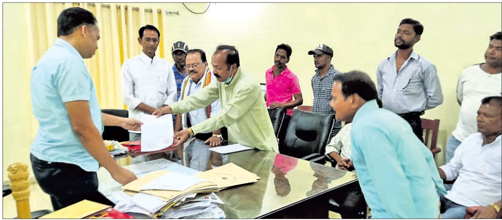
କଂଗ୍ରେସ ପ୍ରତିନିଧି ଦଳ କମିନରଙ୍କୁ ସ୍ମାରକପତ୍ର ପ୍ରଦାନ କରୁଛନ୍ତି ।