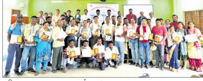
ଅତିଥିକ ଗହଣରେ ସ୍ୱାସ୍ଥ୍ୟକେନ୍ଦ୍ର କର୍ମଚାରୀ।