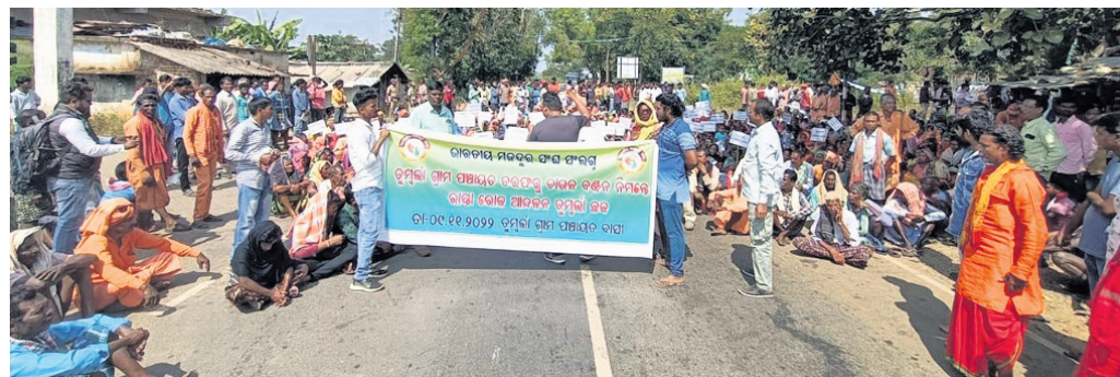
ଜାତୀୟ ରାଜପଥ ଅବରୋଧ କରିଥିବା ପଞ୍ଚାୟତବାସୀ