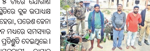
ପଡେଇରୁ ଗ୍ରାମର ଲମ୍ବୁଧର ଚୋରଙ୍କୁ ଘରେ ପମ୍ପ ଥିବା ଜାଣି ଚଢ଼ାଇ କରି ଚାକ ଘରୁ ପମ୍ପ ଜବତ କରିଥିଲା।

ଉପରକୋଟ ଥାନା ପୋଲିସ୍ ମୋଟର ପମ୍ପ ଚୋରି ଅଭିଯୋଗରେ ୩ ଚୋରଙ୍କୁ ଗିରଫ କରିବା ସହ ଚୋରି ପମ୍ପ ଜବତ କରିଛି। ଉପରକୋଟ ନିକଟସ୍ଥ ଯାମରୁଣ୍ଡା ଗ୍ରାମର ସମ୍ପୃକ୍ତ ଗ୍ରାମଠାରୁ ଅଧିକାଂଶ ଚୋର ଗିରଫ ଏକ ଧାନ ଜମି ରହିଥିଲା। ସେହି ଜମିରେ ସରକାରଙ୍କ ଯୋଜନାରେ ଏକ ବୋରଖେଲ ଖୋଳା ଯାଇଥିଲା। ଏଠାରେ ଲାଗିଥିବା ପମ୍ପ ଚୋରି ହୋଇଥିବା ୯ ଚାରିଶ ସକାଳେ ସମ୍ପୃକ୍ତ କେଶୁଥିଲେ। ସମ୍ପୃକ୍ତ ଏ ନେଇ ଉପରକୋଟ ଥାନାରେ ଲିଖିତ ଅଭିଯୋଗ କରିଥିଲେ। ତଦନ୍ତବେଳେ ନିକଟସ୍ଥ