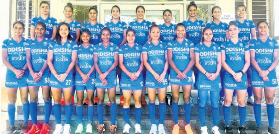
ଏସ୍‌ଆଇଏଚ୍ ମହିଳା ନେସନ୍ସ କପ୍ ପାଇଁ ମନୋନୀତ ଭାରତୀୟ ହକି ଦଳ।

ପ୍ରଥମ ସଂସ୍କରଣରେ ରନରଥକୁ ହୋଇଥିବାବେଳେ ୨୦୦୯ରେ ଚାଣ୍ଡିଆ ହୋଇଥିଲା। ଏହାପରେ ୨୦୧୦, ୨୦୧୨ ଓ ୨୦୨୧ରେ ସେମିଫାଇନାଲକୁ ବିଦାୟ ନେଇଥିଲା। ଏଥର କିନ୍ତୁ ଦଳ ପାଇଁ ଦ୍ୱିତୀୟ ଥର ଲାଗି ଟ୍ରଫି ଜିତିବାର ସୁଯୋଗ ଆସିଛି। ଅନ୍ୟପକ୍ଷରେ ନ୍ୟୁଜିଲାଣ୍ଡ ୨୦୦୭ ଓ ୨୦୧୬ ପରି ଏଥର ମଧ୍ୟ ସେମିଫାଇନାଲକୁ ଅଭିଯାନ ଶେଷ କରିଛି। କେବଳ ୨୦୨୧ରେ ଦଳ ଫାଇନାଲ ଖେଳିଥିଲା। ତେବେ ଏଥରେ ଅଷ୍ଟ୍ରେଲିଆଠାରୁ ହାରି ରନରଥକୁ ହୋଇଥିଲା।