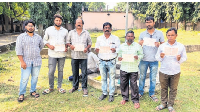
ଜିଲାପାଳଙ୍କୁ ଅଭିଯୋଗ ଜଣାଇବାକୁ ଆସିଥିବା ଚାଷୀମାନେ।

ଚାଷୀଙ୍କ ପାଇଁ ସର୍ବସିଦ୍ଧିରେ ଚାଷ ପାଇଁ ନଳକୃପ ସୁବିଧା କରାଇ ଦିଆଯିବ କହି ଉଠା ଜଳସେଚନ ବିଭାଗ ୨୦୧୧ ଡିସେମ୍ବରରୁ ଚାଷୀଙ୍କୁ ଭୁଆଁ ବୁଲାଇଛି। ଟଙ୍କା ଜମା କରିଥିଲେ ମଧ୍ୟ ନଳକୃପ ଏବଂ ଚାଷ ପାଇଁ ପାଣି ସ୍ୱପ୍ନ ପାଇନି। ରୁଧିରୀର ରାୟଗଡ଼ା ସଦର ବ୍ଲକ ଅନ୍ତର୍ଗତ ପେଣ୍ଡା ଗ୍ରାମର ଚାଷୀ ଜିଲାପାଳଙ୍କୁ ସାକ୍ଷାତ କରି ଏଭଳି ଅଭିଯୋଗ କରିଛନ୍ତି। ଚାଷୀଙ୍କ ଜମିରେ ବୋରଖେଲ ଖନନ ନିମନ୍ତେ ୨୦୧୧ରେ ସରକାରୀ ଯୋଜନା ହୋଇଥିଲା। ଏହା ଅନ୍ତର୍ଗତ ସର୍ବସିଦ୍ଧି ନଳକୃପ ଖନନ ନିମନ୍ତେ ଓଡ଼ିଶା ବର୍ଗର ଚାଷୀଙ୍କ ପାଇଁ ୨୦ ହଜାର ଟଙ୍କା ଏବଂ ଏସ୍‌ସି, ଏସ୍‌ଟି ବର୍ଗର ଚାଷୀଙ୍କ ପାଇଁ ୧୦ ହଜାର ଟଙ୍କା ଜମା କରିବା