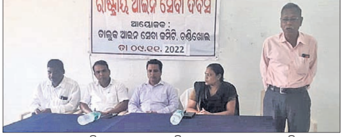
ଆଇନ ସେବା ଦିବସରେ କେବଳପୂର୍ବକ ସମେତ ଅନ୍ୟମାନେ ଉପସ୍ଥିତ।

ଚଣ୍ଡିଖୋଲ, ୯।୧୧ (ଡି.ଏନ.ଏ.): ଚଣ୍ଡିଖୋଲ କୋର୍ଟ ପରିସରରେ ରୁଧିରା ରାଷ୍ଟ୍ରୀୟ ଆଇନ ସେବା ଦିବସ ପାଳିତ ହୋଇଯାଇଛି।