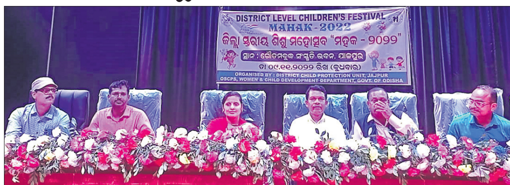
ଶିଶୁ ମହୋତ୍ସବରେ ଯୋଗ ଦେଇଥିବା ଅତିଥି।

ଯାଜପୁର ଗଞ୍ଜନ, ୯।୧୧ (ଡି.ଏନ.ଏ.): ଯାଜପୁର ଜିଲ୍ଲାସ୍ତରୀୟ ଶିଶୁ ମହୋତ୍ସବ 'ମହକ-୨୦୨୨' ଗ୍ରାମୀଣ ଗୌତମ ବୁଦ୍ଧ ସଂସ୍କୃତି ଭବନ ପରିସରରେ ରୁଧିରା ଅନୁଷ୍ଠିତ ହୋଇଯାଇଛି।