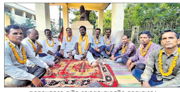
ଗଣସତ୍ୟାଗ୍ରହରେ ସାମିଲ ହୋଇଥିବା ଆଲୁମ୍ନିର ସଦସ୍ୟମାନେ।

ବ୍ୟାସନଗର ସ୍ୱୟଂଶାସିତ ମହାବିଦ୍ୟାଳୟରେ ଅର୍ଥ ହ୍ରାସ ଓ ସହଜାବଳୀ ନିୟମ ଉଲ୍ଲଙ୍ଘନ ପ୍ରତିରୋଧରେ ପ୍ରଚାର ଛାତ୍ର ପରିଷଦ (ଆଲୁମ୍ନି) ପକ୍ଷରୁ ଚାଲିଥିବା ଗଣସତ୍ୟାଗ୍ରହ ରୁଧିରା ସ୍ମୃତି ହୋଇଛି।