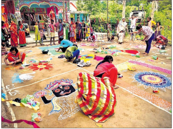
ପ୍ରତିଯୋଗୀମାନେ ମୁରୁଜ ପକାଇଛନ୍ତି।

ରଘୁଲପୁର ବ୍ଲକ ମୁରୁପାଳ ପଞ୍ଚାୟତରେ ଗ୍ରାମ ଯୁବକ ସଂଘ ପକ୍ଷରୁ ଏକ ମୁରୁଜ ପ୍ରତିଯୋଗିତା ଅନୁଷ୍ଠିତ ହୋଇଯାଇଛି।