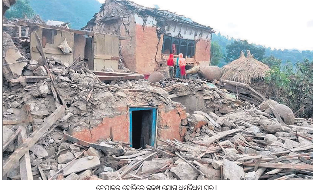
ନେପାଳର ଦେଶରେ ଭୂକମ୍ପ ହେତୁ ନଷ୍ଟ ହୋଇଥିବା ଘର।