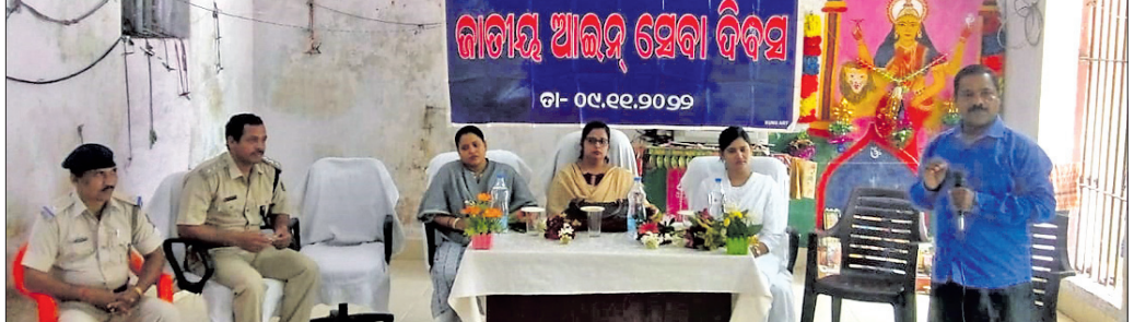
ଆଇନସେବା ଦିବସରେ ଯୋଗ ଦେଇଥିବା ବିଚାରପତି ଓ ଅନ୍ୟମାନେ।

ସମ୍ପର୍କରେ ଅବଗତ କରାଯାଇଥିଲା। ସେହିପରି ଗଞ୍ଜନ ଆଇନ ସେବା ଦିବସ ଉପଲକ୍ଷେ ପ୍ରାଧିକରଣ ତରଫରୁ ସୁକନପୁର ପଞ୍ଚାୟତ କାର୍ଯ୍ୟାଳୟ ପ୍ରାଙ୍ଗଣରେ ଏକ ସଚେତନତା ଶିବିର ଆୟୋଜନ କରାଯାଇଥିଲା।