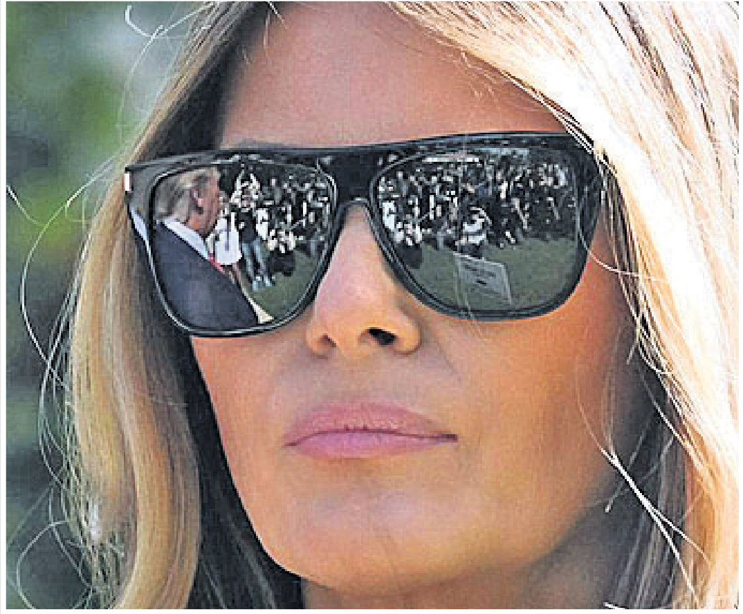
ପୂର୍ବତନ ରାଷ୍ଟ୍ରପତି ହୋନୋରାବ୍ଲ ଗ୍ରୀ ମେଲାନିଆ ଗ୍ରୀ ପୁଅ ପୁଅର ପାପ ବିଚାରଣା ଏକ ମତବାଦ କେନ୍ଦ୍ର ନିକଟରେ ଛିଡ଼ା ହୋଇଛନ୍ତି। ତାଙ୍କ ସମ୍ମୁଖରେ ରିପବ୍ଲିକନ୍ ଗ୍ରୀଙ୍କ ମୁହଁ ଦେଖାଯାଇଛି।