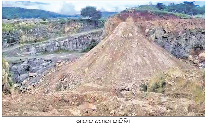
ଖାଦାନ ପୋତା ଚାଲିଛି।

ଅନୁମତିପାତ୍ର ବହୁ ଗୁଣରେ ଅଧିକ କଳାପଥର ଉତ୍ପାଦନ ଅଭିଯୋଗର ଯାଚେ ଲାଲ ଚନ୍ଦ୍ର ଚନ୍ଦ୍ରକୁ ହରାଡ଼ିତ କରିବା ପରେ ଅନ୍ୟ ଲିଜ୍ୟାତାକ ମଧ୍ୟରେ ଛନକା ପଶିଛି।