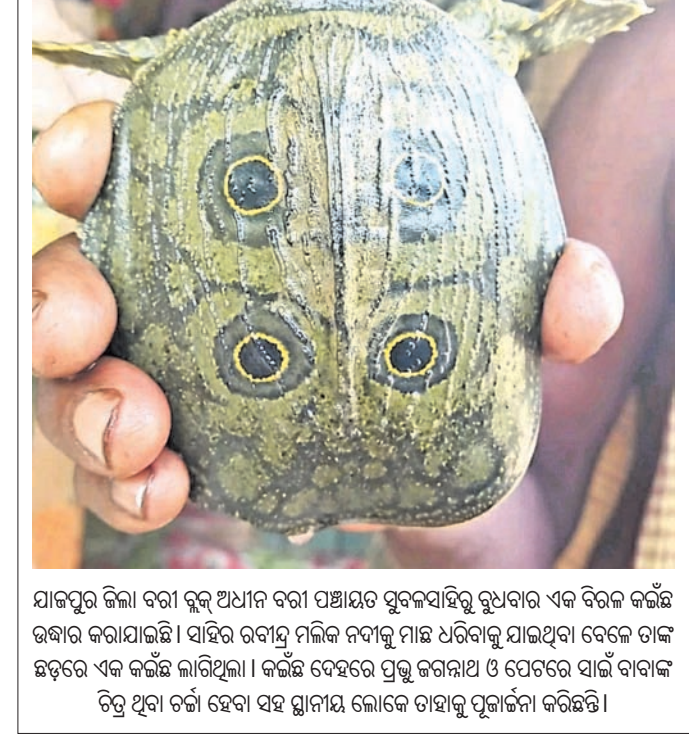
ଯାଜପୁର ଜିଲ୍ଲା ବରା ବୁଲ୍ ଅଧୀନ ବରା ପଞ୍ଚାୟତ ସ୍ତୂଳସାହିରୁ ବୁଧବାର ଏକ ବିରଳ କଇଁଛ ଉଦ୍ଧାର କରାଯାଇଛି।