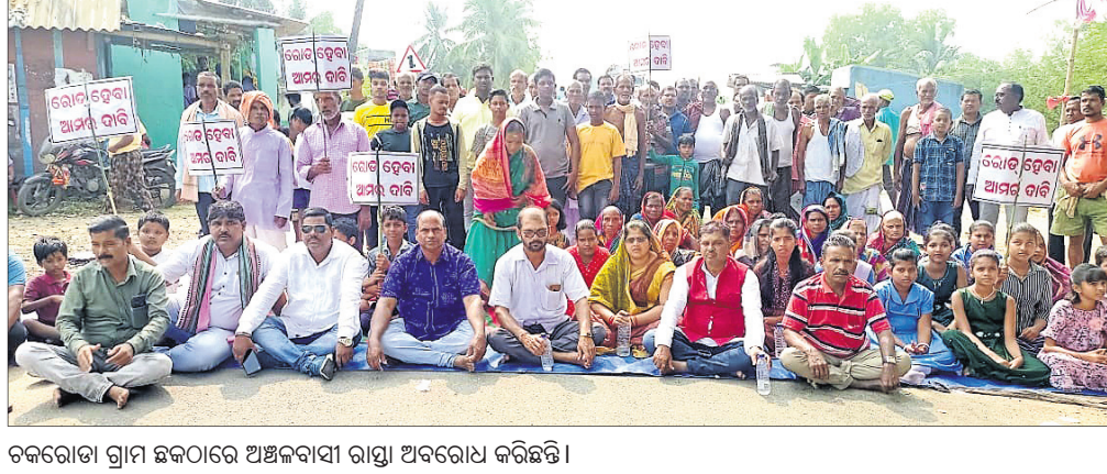
ଚକରୋଡ଼ା ଗ୍ରାମ ଛକଠାରେ ଅଞ୍ଚଳବାସୀ ରାସ୍ତା ଅବରୋଧ କରିଛନ୍ତି।