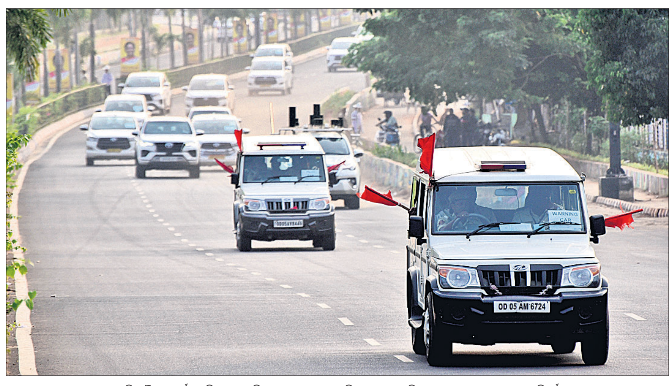
ରାଷ୍ଟ୍ରପତି ଦ୍ରୌପଦୀ ମୁର୍ମୁଙ୍କ ଓଡ଼ିଶା ଗସ୍ତ ପରିପ୍ରେକ୍ଷାରେ ବୁଧବାର କମିଶନରେଟ ପୋଲିସ୍ ପକ୍ଷରୁ ହୋଇଥିବା କାର୍ଯ୍ୟକ୍ରମ ବିହାରୀ।

ଭୁବନେଶ୍ୱର, ୯।୧୧ (ବୁଧବେ) ରାଜଧାନୀ ଭୁବନେଶ୍ୱରରେ ମା'ବାପା ନିଜ ଶିଶୁକୁ ବିକ୍ରି କରିବା ଭଳି ଅର୍ଦ୍ଧଶତାବ୍ଦୀ ଘଟଣା ବାରମ୍ବାର ଘଟୁଛି।