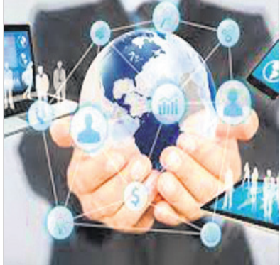
ଘର ଆଗରେ ପହଞ୍ଚି ଆପଣଙ୍କୁ ଗତବ୍ୟ ସ୍ଥାନରେ ପହଞ୍ଚାଇଦେବ। ଯେତିକି କିଲୋମିଟର ଆପଣ ଗସ୍ତ କରିଥିବେ ସେତିକି ଅର୍ଥ ଆପଣ ଅର୍ଜନକାରୀରେ ପ୍ରଦାନ କରିବେବେ। ଆପଣଙ୍କୁ କାର୍ ପାଇଁ ଭଲ ସମୟା ବେଶ୍‌ବାବୁ ପଢ଼ିବ ନାହିଁ। କାର୍ ଉପଯୋଗରେ ଏହା ଅଧିକ ସହଜ ହେବ। ନା ଗାଡ଼ି ଚଳାଇବା ପାଇଁ ଲାଇସେନ୍ସ ଦରକାର ନା କାର୍ ପାଇଁ ବାମା ଅର୍ଥ ପଇଠ। କାର୍ କିଣା ବା ଏହାର ରକ୍ଷଣାବେକ୍ଷଣ ଡିଫେନ୍ସରୁ ବି ମୁକ୍ତି। ଏହାଦ୍ୱାରା ସହରଗୁଡ଼ିକରେ ଗାଡ଼ିସଂଖ୍ୟା କମିଯିବ ଓ ପ୍ରଦୂଷଣ ବି ସେହି ଅନୁପାତରେ ହ୍ରାସ ପାଇବ। ରାସ୍ତା ଦୁର୍ଘଟଣା କମିବ ଓ ଧନ ଜୀବନ କ୍ଷୟକ୍ଷତି ହ୍ରାସ ହେବ। ବାମା କମ୍ପାନୀଗୁଡ଼ିକ ଉପରେ ଗାପ କମିବ ଓ କର୍ମଚାରୀ ହ୍ରାସ ହେବେ। ମାତ୍ର ଅନ୍ୟ ପଟରେ ଏହା ନିଯୁକ୍ତି ହ୍ରାସର ପ୍ରମୁଖ କାରଣ ହେବ। ଲକ୍ଷ ଲକ୍ଷ ଲୋକ ଗାଡ଼ିଚାଳକ ଭାବେ ପରିବାର ଭରଣପୋଷଣ ଜୀବିକାକୁ ଭୁଲି ଯିବାକୁ ବାଧ୍ୟ ହେବେ। ଆମେରିକାର ବୃହତ ବ୍ୟାଙ୍କ ଯେପରିକି ଏସ୍‌ଏସ୍‌ସି, ବ୍ୟାଙ୍କ ଅଫ୍ ଆମେରିକା ଓ ଗୋଲ୍ଡମ୍ୟାନ ସାକ ଟେଡାବନା ଦେଇ