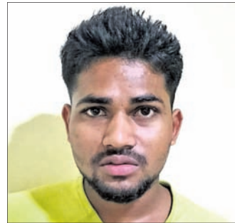
ଗିରଫ ରାଜ୍ୟ ସାମଗ୍ରୀକାରୀ

ଜଳକ କୋର୍ଟକୁ ଚାଲାଣ କରିଥିଲା। ଜାମିନ ନାମଜୁର ହେବାକୁ ଚାଲି ବିଚାର ବିଭାଗରୁ ହାଜତକୁ ପଠାଇ ଦିଆଯାଇଛି।