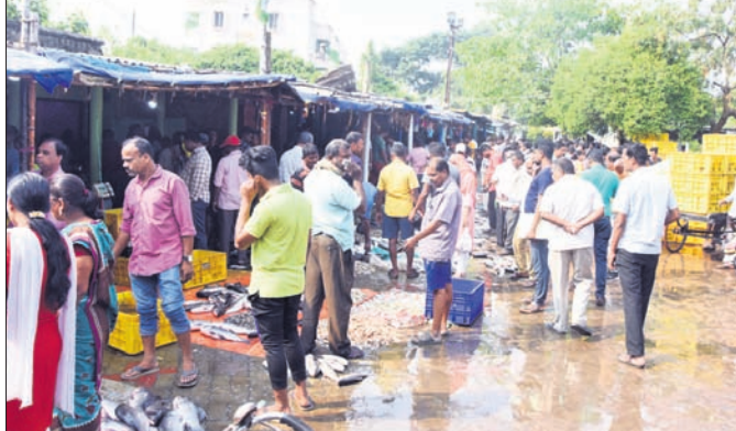
ମାଛ ଓ ମାଂସ ଦୋକାନରେ ଗ୍ରାହକଙ୍କ ଭିଡ଼ ଲାଗିଛି।

ପୁରୀ ଅଫିସ୍, ୯।୧୧ ମଙ୍ଗଳବାର ପବିତ୍ର କାର୍ତ୍ତିକ ମାସ ସରିଛି। ବୁଧବାର ଥିଲା ଛାଡ଼ଖାଇ। ପୁରୀ ସହରରେ ଛାଡ଼ଖାଇ ଜମିଲି। କାର୍ତ୍ତିକ ମାସରେ ଲୋକେ ଆମିଷ ଖାଇ ନ ଥିବାରୁ ଛାଡ଼ଖାଇରେ ଏହି ସୁଯୋଗ ହାତଛତା କରି ନ ଥିଲେ। ବୁଧବାର ଭୋଗ ପ୍ରାୟ ୪୮ଟାରୁ ଆମିଷ ଦୋକାନ ଗୁଡ଼ିକରେ ଗ୍ରାହକଙ୍କ ଭିଡ଼ ଜମିଥିଲା। ଆମିଷର ମୂଲ୍ୟ ଅଧିକ ଥିଲେ ବି ଲୋକେ ମାଛ, ମାଂସ କରି