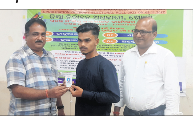
ନୂତନ ଭୋଟରଙ୍କୁ ପରିଚୟପତ୍ର ପ୍ରଦାନ କରାଯାଇଛି।