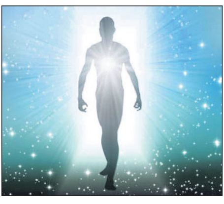
ଅନିଶ୍ଚିତତା ଧାରଣା ଦୃଢ଼ ରହିଥିଲା। ହିନ୍ଦୁମାନେ ଶଙ୍ଖରକୁ ଅନନ୍ତ କିମ୍ପା ଅସୀମ ବୋଲି କଳ୍ପନା କରୁଥିଲେବେଳେ ଖ୍ରୀଷ୍ଟିଆନମାନଙ୍କ ମତରେ ସମୟ (କାଳ)ର ଆରମ୍ଭ ଓ ଶେଷ ରହିଛି। ତେଣୁ, ବୁଦ୍ଧ ଏବଂ ହିନ୍ଦୁ ସମ୍ପ୍ରଦାୟ ଶଙ୍ଖରକୁ ଅନନ୍ଦି (ଯାହାର ଆରମ୍ଭ ନାହିଁ) ଓ ଅନନ୍ତ (ଯାହାର ଶେଷ ନାହିଁ) ବୋଲି ବିଶ୍ୱାସ କରିଥାନ୍ତି; ଯାହା ଏକ ସାମାନ୍ୟ ସଂଖ୍ୟା ରେଖାକୁ ପ୍ରତୀକ୍ଷା କରୁଥିଲା। ଆଉ ଏକ ଗୁରୁତ୍ୱପୂର୍ଣ୍ଣ ତଥ୍ୟ ଶକ୍ତିଶାଳୀ ଗଣିତିକ ଭାଗକ୍ରିୟା ଧାରଣା ଭାରତକୁ ବାହାରକୁ ପ୍ରସାରିତ ହୋଇଥିଲା। ବହୁ ସମୟରେ ନିୟନ୍ତ୍ରିତ ଜୀବନର ମନେକରୁ ଯେ ଆମେ ଜନ୍ମ ନେଇ ଥିବା ପାତ୍ର ବଞ୍ଚିବୁ କିମ୍ପା ଆମେ ହିଁ କେବଳ ଜଣେ ଅଛୁ। କିନ୍ତୁ ବାସ୍ତବତା ହେଉଛି, ସଂଖ୍ୟାଗୁଡ଼ିକର ଭାଗକ୍ରିୟା ଭଳି ସମୟକ୍ରମେ ଆମ ଜୀବନ ବିଭାଜିତ, ଅର୍ଥାତ୍ ଆମେ ଜୀବନରେ ବାରମ୍ବାର ଜନ୍ମ ନେଇପାରୁଛୁ। ଆମେ ଅନେକ ଜୀବନ ଜିଇଥାଉ ଓ ସେତେବେଳେ ଅନେକ ଅଭିଜ୍ଞତାକୁ ଅନୁଭବ କରିଥାଉ। ଆମେ କେବେ କି ଏକାନ୍ତ ରହି ନ ଥାଉ। ସବୁବେଳେ ଆମେ ଯେକୌଣସି ସମ୍ପର୍କ, ଗୋଷ୍ଠୀ କିମ୍ପା ଜାତିର ଅଂଶ ଭାବେ ରହିଥାଉ। ବିଭାଜ୍ୟ ସଂଖ୍ୟାକୁ ଭାଗ କଲାପରେ ଯେଭଳି ତା'ର ମୂଲ୍ୟ ଆସେ ଠିକ୍ ସେହିଭଳି ଆମ ବିଭାଜିତ ଜୀବନର କାର୍ଯ୍ୟ ହିଁ ଆମ ଜୀବନର ମୂଲ୍ୟ। ଏକ ସାମାନ୍ୟ ଜନସମୂହରେ ଜୀବନର ବିଭାଜନ ଅସୀମ ହୋଇଥିବାରୁ ଅର୍ଥାତ୍ ବାରମ୍ବାର ପୁନର୍ଜନ୍ମ ଲାଭ କରିଥିବାରୁ ଆମ ଜୀବନର ମୂଲ୍ୟ କିଛି ନୁହେଁ। ସଂଖ୍ୟାଗୁଡ଼ିକ ଜୀବନ ବର୍ଣ୍ଣନା ସହ ସମ୍ପର୍କିତ। ଯଦି ତୁମେ

ଶତାବ୍ଦୀରେ ଡେସିମାଲ ସିଷ୍ଟମ(ଦଶମିକ ପଦ୍ଧତି) ବ୍ୟାପକ ପ୍ରସାର ଲାଭ କରିଥିଲା। ଶୁନି ଆବିଷ୍କାରର ଅତି କମ୍ରେ ୧୦୦୦ ବର୍ଷ ପରେ ଏହା ଘଟିଥିଲା। ତେବେ ମୁରୋପୀୟ ଦେଶଗୁଡ଼ିକ ସେମାନଙ୍କ ପଦ୍ଧତିକୁ ବ୍ୟବହାର କରିବା କାହିଁକି ଅଧିକ ବର୍ଷ ଲାଗିଥିଲା? ଏହା ସେତେବେଳର ଖ୍ରୀଷ୍ଟିଆନମାନଙ୍କ ମଧ୍ୟରେ ରହିଥିବା ଦୃଢ଼ ଦର୍ଶନ ଏବଂ ଚୌରାଶିକ ବିଶ୍ୱାସ ଯୋଗୁଁ ହୋଇଛି। ରୋମୀ ସାମ୍ରାଜ୍ୟରେ ଖ୍ରୀଷ୍ଟଧର୍ମ ବୈଶ୍ୱ ଲୋକପ୍ରିୟ ହୋଇଥିଲେ ମଧ୍ୟ ଏଥିରେ ଅନେକ ଗ୍ରୀକ ବିଚାରଧାରା ରହିଥିଲା। ଗ୍ରୀକର ଅଧିକାରୀମାନେ ବିଶ୍ୱ ସମୀପ ଓ ପୂର୍ବରୁମେୟ (ଏହାର ଭବିଷ୍ୟତ କଥା କହିହେବ) ବୋଲି ବିଚାର କରୁଥିଲେ। ବିଶ୍ୱ ମଧ୍ୟ ଶଙ୍ଖରକ ନିୟନ୍ତ୍ରିତ ବୋଲି ସେମାନଙ୍କର ବିଶ୍ୱାସ ଥିଲା। ସେମାନେ ଅସୀମ କିମ୍ପା ଶୁନି ଅବଧାରଣା ଉପରେ ବିଶ୍ୱାସ କରୁ ନ ଥିଲେ। ସେମାନଙ୍କ ବିଶ୍ୱାସ ରହିଥିଲା ଏକ ପୂର୍ବରୁମେୟ ଓ କ୍ରିୟାବିଧିକ ବିଶ୍ୱ ଦୃଷ୍ଟିକୋଣ ଉପରେ। ସେମାନଙ୍କ ଭଳି ହିନ୍ଦୁମାନେ ବିଶ୍ୱାସ ରଖୁ ନ ଥିଲେ। ହିନ୍ଦୁମାନେ ସମ୍ପୂର୍ଣ୍ଣ ଅନିଶ୍ଚିତ ଅସୀମ ବିଶ୍ୱ ବିଶ୍ୱାସୀ ଥିଲେ। ଗ୍ରୀକମାନଙ୍କ ପୂର୍ବରୁମେୟ ଧାରଣାର ପ୍ରମାଣ ବାଜବେଲରୁ ମିଳେ। ବାଜବେଲ କହେ, ତୁମେ ଯେମିତି ଦିବ୍ୟ ବୁଝିବେ ସେମିତି ଅମଳ କରିବ; ଯାହା ପୂର୍ବରୁମେୟ ଯୋଗ୍ୟ ବିଚାରକୁ ସିଧା କରେ। ଅନ୍ୟପକ୍ଷରେ ଗୀତା କହେ, କର୍ମ ଉପରେ ଧ୍ୟାନ ଦିଅ, ଫଳପ୍ରାପ୍ତି ଉପରେ ବୁଝି; ଯାହା ଏକ ଅନିଶ୍ଚିତତାକୁ ସୂଚିତ କରେ। ବୌଦ୍ଧ ଧର୍ମାବଲମ୍ବୀମାନଙ୍କ ମଧ୍ୟରେ ଶୂନ୍ୟ କିମ୍ପା