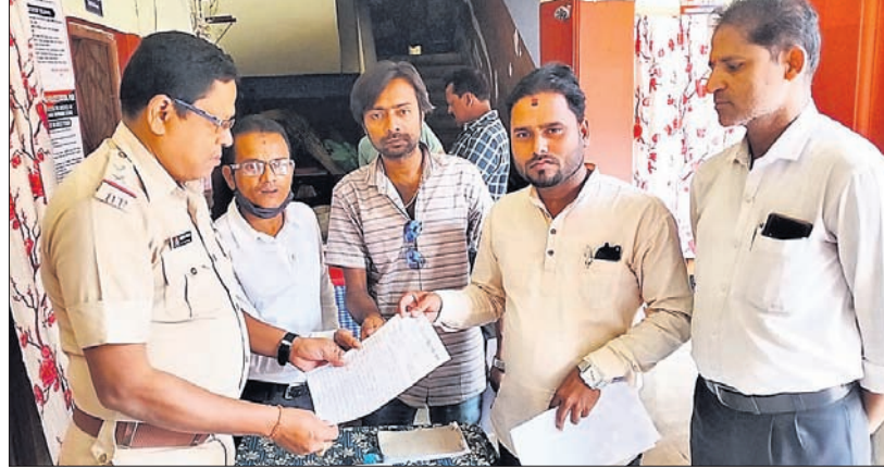
ଜିଲ୍ଲା ସୁବ ଅଧିକାରୀ ମଞ୍ଚ ପକ୍ଷରୁ ସିଂହଦ୍ୱାର ଥାନାରେ ଏତଲା ଦିଆଯାଇଛି।

ମହାପ୍ରସାଦକୁ ନେଇ ବିବାଦୀୟ ମନ୍ତବ୍ୟ ଦେଇଥିବା ହେତୁବାଦୀଙ୍କ ବିରୋଧରେ ରୁଧିରା ପୁରୀ ଜିଲ୍ଲା ସୁବ ଅଧିକାରୀ ମଞ୍ଚ ପକ୍ଷରୁ ସିଂହଦ୍ୱାର ଥାନାରେ ଏତଲା ଦିଆଯାଇଛି। ମଞ୍ଚ ପକ୍ଷରୁ ଅଭିଯୋଗପତ୍ରରେ ଦର୍ଶାଯାଇଛି ଯେ, ମଙ୍ଗଳବାର ରତ୍ନଗ୍ରହଣ ସଂସ୍କୃତି ହୋଇଥିଲା। ଏହି ଅବସରରେ କଣେ ହେତୁବାଦୀ ଗଣମାଧ୍ୟମରେ ମହାପ୍ରସାଦ ଏବଂ ମହାପ୍ରସାଦକୁ ଅପମାନିତ କରିବା ଭଳି ମନ୍ତବ୍ୟ ଦେଇଥିଲେ। ସେହିପରି ଆମ୍ବୋଇ ପ୍ରତିଷ୍ଠାତା ବି. ରାମଚନ୍ଦ୍ର ଭୋଇଙ୍କର ମଧ୍ୟ ଗଣମାଧ୍ୟମରେ ବିବାଦୀୟ ମନ୍ତବ୍ୟ ଦେଇଥିବା ଅଭିଯୋଗ ହୋଇଛି। ଏହି ବ୍ୟକ୍ତି ବୁଧ ଅଗଣିତ ଜଗନ୍ନାଥପ୍ରେମୀଙ୍କ ଭାବନାକୁ କୁଠାଭାଙ୍ଗିତ କରିବା ସହ ମହାପ୍ରସାଦକୁ ଅପମାନ କରିଥିବା ମଞ୍ଚ ଅଭିଯୋଗ ଆଣ୍ଟି। ଏଭଳି ମନ୍ତବ୍ୟ ଶ୍ରୀଜଗନ୍ନାଥ ସଂସ୍କୃତିକୁ ନଷ୍ଟ କରିବା ସହ ଅପସଂସ୍କୃତିର ପ୍ରଚାର ପ୍ରସାର ଏବଂ ନିଜର ବ୍ୟକ୍ତିଗତ ସ୍ୱାର୍ଥ ହାସଲ ପାଇଁ ଉଦ୍ଦିଷ୍ଟ। ଏହା ସମାଜର ଧର୍ମର ବିଧ୍ୟବଦ୍ଧକୁ ଅପମାନିତ କରିବା ସହ ଜଗନ୍ନାଥପ୍ରେମୀଙ୍କ ଧାର୍ମିକ ଭାବନାକୁ କୁଠାଭାଙ୍ଗିତ କରିଛି। ଏଭଳି ମନ୍ତବ୍ୟ ଦ୍ୱାରା ସମାଜରେ ଦଙ୍ଗା ସୃଷ୍ଟି ହେବାର ଆଶଙ୍କା ରହିଛି, ଯାହାକି ଗୋଟିଏ ଧର୍ମନିରକ୍ଷେପ ରାଷ୍ଟ୍ରରେ କଦାପି ଗ୍ରହଣୀୟ ନୁହେଁ। ତେଣୁ ସମ୍ପୂର୍ଣ୍ଣ ବୁଧ ହେତୁବାଦୀଙ୍କ ବିରୋଧରେ ଜାତୀୟ ଐତିହ୍ୟ ସୁରକ୍ଷା ଆଇନ ଓ ଭାରତୀୟ