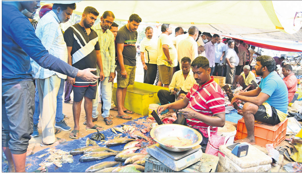
ଛାଡ଼ିଖାଇ ପାଇଁ ବୁଧବାର ପକାଣୁଣା ମାଛ ମାର୍କେଟରେ ଭିଡ଼।

କାର୍ତ୍ତିକମାସ ସରିବା ପରେ ବୁଧବାର ଥିଲା ଛାଡ଼ିଖାଇ। ସକାଳୁ ସକାଳୁ ରାଜଧାନୀର ଆମିଷ ବଜାରରେ ଲୋକଙ୍କ ଭିଡ଼ ଲାଗିଥିଲା। ଚାହୁଁ ଚାହୁଁ ୪ କୋଟି ଆମିଷ କିଣି ନେଇଥିଲେ ରାଜଧାନୀବାସୀ।