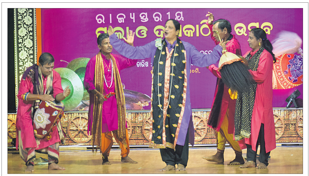
ଓଡ଼ିଆ ଭାଷା, ସାହିତ୍ୟ ଓ ସଂସ୍କୃତି ବିଭାଗ ଆନୁକୂଲ୍ୟରେ ଓଡ଼ିଶା ସଙ୍ଗୀତ ନାଟକ ଏକାଡେମୀ ପକ୍ଷରୁ ଭୁବନେଶ୍ୱର ଭଞ୍ଜକଳା ମଣ୍ଡପରେ ବୁଧବାର ଉଦ୍ଘାଟିତ ରାଜ୍ୟସ୍ତରୀୟ ପାଳା ଓ ଦାସକାଠିଆ ଉତ୍ସବରେ ପାଳା ପରିବେଷଣ କରାଯାଇଛି।

ଆନୁକୂଲ୍ୟରେ ଓଡ଼ିଶା ସଙ୍ଗୀତ ନାଟକ ଏକାଡେମୀ ପକ୍ଷରୁ ରାଜ୍ୟସ୍ତରୀୟ ପାଳା ଓ ଦାସକାଠିଆ ଉତ୍ସବ ବୁଧବାର ଭଞ୍ଜକଳାମଣ୍ଡପରେ ଉଦ୍ଘାଟିତ ହୋଇଯାଇଛି।