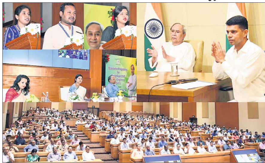
ଭୁବନେଶ୍ୱର, ୯୧୧ (ସ୍ୱାଭାବ)

ରାଜ୍ୟ ଜଳସମ୍ପଦ ବିଭାଗରେ ୨୫୭ ଜଣ କନିଷ୍ଠ ଯନ୍ତ୍ରୀ (ସିଭିଲ) କାର୍ଯ୍ୟରେ ଯୋଗ ଦେଇଛନ୍ତି। ସେମାନଙ୍କ ମଧ୍ୟରେ ୮୭ ଜଣ ମହିଳା ଅଛନ୍ତି। ଏହି ଅବସରରେ ଲୋକସେବା କର୍ମଚାରୀମାନଙ୍କ ସେକ୍ଟରରେ ଏକ ଓଡିଏସ୍‌ଏମ୍ କାର୍ଯ୍ୟକ୍ରମ ଆୟୋଜନ କରାଯାଇଥିଲା। ଏହି କାର୍ଯ୍ୟକ୍ରମରେ ଭୂମିଆଳ ମୋଡରେ ଯୋଗ ଦେଇ ମୁଖ୍ୟମନ୍ତ୍ରୀ ନବୀନ ପଟ୍ଟନାୟକ ନିଜର କର୍ତ୍ତବ୍ୟକୁ ରାଜ୍ୟର ଲୋକମାନଙ୍କ ପାଇଁ ସାଧୁତାର ସହ କରିବାକୁ ନବନିଯୁକ୍ତ ଇଞ୍ଜିନିୟରମାନଙ୍କୁ ପରାମର୍ଶ ଦେବା ସହ ସେମାନଙ୍କର ଉତ୍ତମ ଭବିଷ୍ୟତ କାମନା କରିଛନ୍ତି। ମୁଖ୍ୟମନ୍ତ୍ରୀ କହିଛନ୍ତି ଯେ ଗାଣାମାନଙ୍କୁ ଜଳସେଚନ ଯୋଗାଇବା ସହ ବନ୍ୟା ପରିଚାଳନା ଏବଂ ଲୋକମାନଙ୍କର ସମ୍ପର୍କ ଓ ଜୀବନକୁ ସୁରକ୍ଷା ଯୋଗାଇବା ଜଳସମ୍ପଦ ବିଭାଗର ପ୍ରଥମ ପଦକ୍ଷେପ। ରାଜ୍ୟରେ ୨୫୦୦ ଡ୍ୟାମ୍ ରହିଥିବା ବେଳେ ଲୋକମାନଙ୍କୁ ସୁକ୍ଷେପ, କାନୁନ ଏବଂ ଘଟକେଶ୍ୱର ଭଳି ବୃହତ୍ ଡ୍ୟାମ୍ ନିର୍ମାଣ ଚାଲିଛି। ଜଳ ସମ୍ପଦ ବିଭାଗ ରାଜ୍ୟର ବିଭିନ୍ନ ନଦୀରେ ୩୦ଟି ଇନ୍‌ସ୍ଟିମ୍ ଷ୍ଟୋରେଜ୍ ଷ୍ଟରୁ ନିର୍ମାଣ କରିଥିବା ବେଳେ ୧୨୦୦ ଅଧିକ ନିର୍ମାଣ ଅପେକ୍ଷାରେ ରହିଛି। ଏହି ନିର୍ମାଣ ନଦୀ ଜଳ ସଂରକ୍ଷଣ