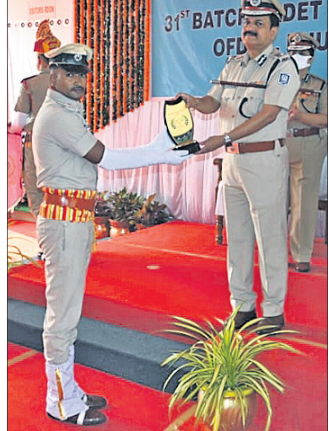
ଉଦ୍ଘାଟନ ପ୍ରସିଦ୍ଧିତ ଅଧିକାରୀଙ୍କୁ ପୁରସ୍କୃତ କରାଯାଇଛି।

ଭୁବନେଶ୍ୱର, ୯।୧୧ (ବୁଧବେ): ଓଡ଼ିଶା ଅଗ୍ନିଶମ ବିପଦନିମ୍ୱାରଣ ପ୍ରତିଷ୍ଠାନ ପକ୍ଷରୁ ବୁଧବାର ବରପୁଣ୍ୟାଠାରେ ୩୧ତମ ଅଗ୍ନିଶମ କେନ୍ଦ୍ରାଧିକାରୀ ପ୍ରଶିକ୍ଷାଧିକାରୀ ସମାବେଶର ଉଦ୍ଘାଟନ ଅନୁଷ୍ଠିତ ହୋଇଯାଇଛି।