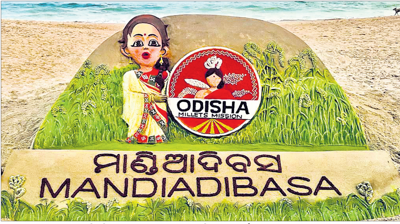
ମାଣିଆ ଦିବସ ଅବସରରେ ରୂପବାର ପୁରୀ ବେଳାଭୂମିରେ ପୂର୍ଣ୍ଣା ସୁଦର୍ଶନ ପଟ୍ଟନାୟକଙ୍କ ବାଲୁକାକଳା।