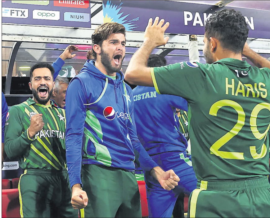
ମ୍ୟାଚ ଜିତିବାପରେ ଉଲ୍ଲାସରେ ପାକିସ୍ତାନ ଖେଳାଳି।

ଶାହିନ ଶାହା ଆଫ୍ରିକା ଆକର୍ଷଣୀୟ ବୋଲି ପରେ ଅଧିନାୟକ ବାବର ଆଜମ ଓ ମହମ୍ମଦ ରିଜ୍ୱାନଙ୍କ ଅର୍ଦ୍ଧଶତକ ବଳରେ ପାକିସ୍ତାନ ଚଳିତ ଟି୨୦ କ୍ରିକେଟ ବିଶ୍ୱକପର ଫାଇନାଲରେ ପ୍ରବେଶ କରିଛି। ରୁଧିର ଅନୁଷ୍ଠିତ ସେମିଫାଇନାଲରେ ଏହି ଦଳ ଫିଲିପାଇନ୍ସକୁ ୬ ରନରେ ହରାଇ ପ୍ରଥମ ଫାଇନାଲ ପ୍ରବେଶ କରିଛି। ଫାଇନାଲରେ ୨୦୦୯ ପରେ ଦ୍ୱିତୀୟ ଥର ପାଇଁ ପାକିସ୍ତାନ ଫାଇନାଲରେ ପ୍ରବେଶ କରିଛି। କ୍ରିକେଟ ଯେ ଏକ ଅନିଶ୍ଚିତତାର ଖେଳ ତାହା ଏହି ମ୍ୟାଚରୁ ପ୍ରମାଣିତ ହୋଇଥିଲା। ଗ୍ରୁପ୍ ପର୍ଯ୍ୟାୟରେ ଚମତ୍କାର ପ୍ରଦର୍ଶନ କରିଥିବା ଫିଲିପାଇନ୍ସ ସେମିଫାଇନାଲରେ ଏକ ବଡ଼ ମ୍ୟାଚରେ ନେତୃତ୍ୱାଧିନ ପ୍ରଦର୍ଶନ କରି ୨୦ ଓଭରରେ ୪ ରନକେତ ହରାଇ ୧୫୨ ରନ କରିଥିଲା। ଅନ୍ୟପକ୍ଷରେ ଗ୍ରୁପ୍ ମ୍ୟାଚରେ କେବଳ ୩୬ ଓଭର ଦକ୍ଷିଣ ଆଫ୍ରିକା ପରାସ୍ତ ହେବା ଯୋଗୁ ଭାଗ୍ୟ ବଳରେ ସେମିଫାଇନାଲରେ ପ୍ରବେଶ କରିଥିବା ପାକିସ୍ତାନ ୧୯.୧ ଓଭରରେ ୩ ରନକେତ ହରାଇ ବିଜୟ ଲକ୍ଷ୍ୟ ହାସଲ କରି ନେଇଥିଲା। ଫର୍ମକୁ ଶେଷ କରିଛି କେବଳ ୨୦୨୧ରେ ଦଳ ଫାଇନାଲ ଖେଳିଥିଲା। ତେବେ ଏଥରେ ଅଶ୍ରେଣୀଆଁରୁ ହରି ରନରଥ ପ୍ରସ୍ତୁତ ହୋଇଥିଲା।