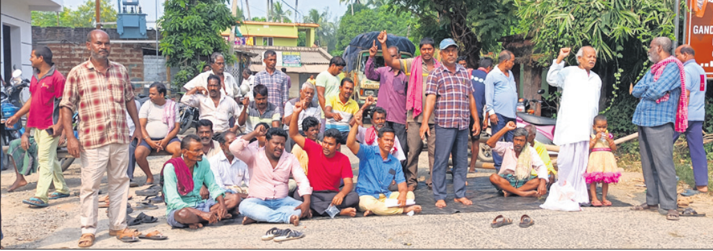
ବେରବୋଇ ଛକଠାରେ ଚାଷୀମାନେ ଧାରଣା ଦେଇଛନ୍ତି।

ଡେଲାଙ୍ଗ, ୯।୧୧(ଡି.ଏନ୍.ଏ) ପୁରୀ ଜିଲ୍ଲା ଡେଲାଙ୍ଗ ବ୍ଲକ ଅଧୀନ ବେରବୋଇ ପଞ୍ଚାୟତର ବୁଆଳି ମାଇନର କେନାଲରେ ପାଣି ନ ଆସିବାରୁ ଚାଷଜମି ଫାଟି ଥାଏ କଳାଣୀ। ଫଳରେ ଅନେକ ଚାଷୀଙ୍କ ଫସଲ ଉଚ୍ଛୃଷ୍ଟିରାଜ ଆଖାଙ୍କା ଦେଖାଦେଇଛି। ପାଣି ଅଭାବରୁ ମଦରଜା, ପୋଖରୀମୁହଁ, ଚଣାପିଢ଼ି, ଲୁଗାପଡ଼ିଆ, ସର, ଦଶଗାଡ଼ି, ବିଭୂତିଆ, ବରଡ଼ା ଗହର ସହିତ ମଣିଜିପୁର ଓ ବୋଳକଣା ଗ୍ରାମର ଦଶମୁହଁ, ବାଘମରା, ବରତଳ ଓ ବାଲିଗିଡ଼ି ଗହର ଧାନଜମି ଫାଟି ଥାଏ କହିଛନ୍ତି। ଏଥିଯୋଗୁ ଚାଷୀଙ୍କ ମୁଣ୍ଡରେ ଚଡ଼କ ପଡ଼ିଛି। ଏନେଇ