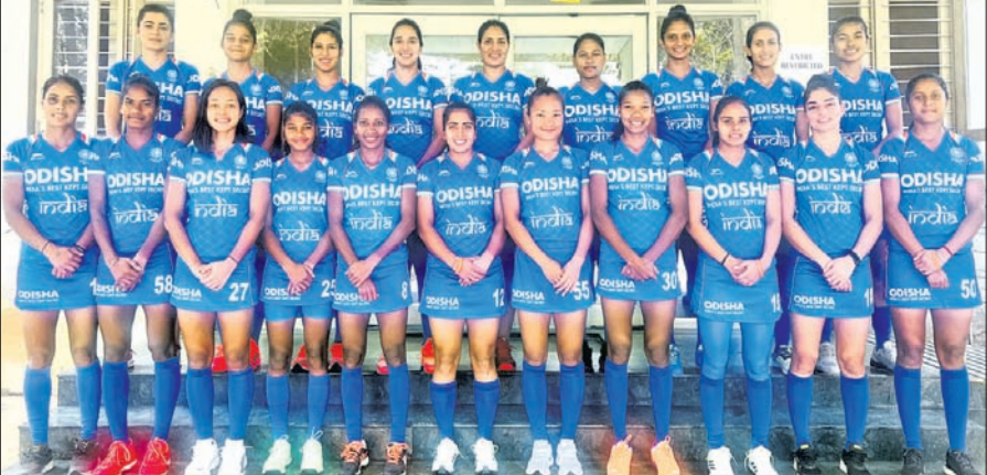
ଏସ୍‌ଆଇଏସ୍ ମହିଳା ନେସନ୍ସ କପ୍ ପାଇଁ ମନୋନୀତ ଭାରତୀୟ ହକି ଦଳ।

ପ୍ରଥମ ସଂସ୍କରଣରେ ରନରଥ ପ୍ରସ୍ତୁତ ହୋଇଥିବାବେଳେ ୨୦୦୯ରେ ଟି୨୦ କ୍ରିକେଟ ହୋଇଥିଲା। ଏହାପରେ ୨୦୧୦, ୨୦୧୨ ଓ ୨୦୧୯ରେ ସେମିଫାଇନାଲକୁ ବିଦାୟ ନେଇଥିଲା। ଏଥର କିଛି ଦଳ ପାଇଁ ଦ୍ୱିତୀୟ ଥର ଲାଗି ଟ୍ରଫି ଜିତିବାର ସୁଯୋଗ ଆସିଛି। ଅନ୍ୟପକ୍ଷରେ ନ୍ୟୁଜିଲାଣ୍ଡ ୨୦୦୭ ଓ ୨୦୧୨ ପରି ଏଥର ମଧ୍ୟ ସେମିଫାଇନାଲକୁ ଅଭିଯାନ ଶେଷ କରିଛି। କେବଳ ୨୦୨୧ରେ ଦଳ ଫାଇନାଲ ଖେଳିଥିଲା। ତେବେ ଏଥରେ ଅଶ୍ରେଣୀଆଁରୁ ହରି ରନରଥ ପ୍ରସ୍ତୁତ ହୋଇଥିଲା।