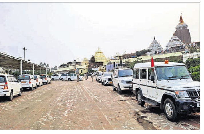
କାରକେଡ଼ ରିହରସାଳ କରାଯାଇଛି।

ପୁରୀ ଅଫିସ, ୯୧୧ ସହ ବୁଲୁଥିବା କାରକେଡ଼ ରିହରସାଳ କରାଯାଇଛି। ଓଡ଼ିଆ ଝିଆ ଝିଆ ପ୍ରତିପଦ ପୂର୍ଣ୍ଣ ରାଷ୍ଟ୍ରପତି ହେବା ପରେ ପ୍ରଥମ ଥର ପାଇଁ ଓଡ଼ିଆ ଗସ୍ତରେ ଆସୁଛନ୍ତି। ଅବସରରେ ସେ ଗୁରୁବାର ପୁରୀ ଆସି ଶ୍ରୀମନ୍ଦିରରେ ମହାପ୍ରଭୁଙ୍କୁ ଦର୍ଶନ କରିବେ। ଏହାକୁ ଦୃଷ୍ଟିରେ ରଖି ଜିଲ୍ଲା ପ୍ରଶାସନ, ଶ୍ରୀମନ୍ଦିର ପ୍ରଶାସନ ଏବଂ ପୋଲିସ ପ୍ରଶାସନ ପକ୍ଷରୁ ସମସ୍ତ ପ୍ରସ୍ତୁତି ଶେଷ ହୋଇଛି। ରାଷ୍ଟ୍ରପତି ପୁରୀରେ ପ୍ରାୟ ୪ଘଣ୍ଟା ଅତିବାହିତ କରିବାକୁ ଥିବାରୁ ଶ୍ରୀମନ୍ଦିର, ରାଜଭବନ, ତାଳବଣିଆ ହେଲିପାଠାରେ ପୁରୀ ବ୍ୟବସ୍ଥା କଡ଼ାକଡ଼ି କରାଯାଇଛି। ଏ ନେଇ ବୁଧବାର ବରିଷ୍ଠ ଅଧିକାରୀମାନଙ୍କ ପକ୍ଷରୁ ରାଷ୍ଟ୍ରପତିଙ୍କ ପୁରୀ ବ୍ୟବସ୍ଥାରେ ସମୀକ୍ଷା କରାଯିବ।