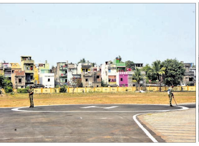
ତାଳବଣିଆରେ ନିର୍ମିତ ହେଲିପାଠା।