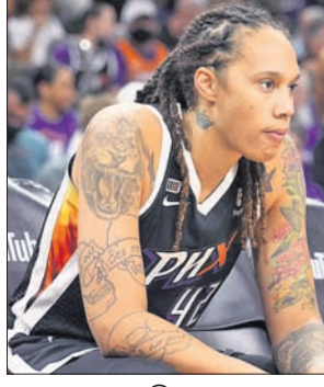
ବୋଷ ସାକାର କରିଥିଲେ। ଚରବରରେ ସେ ଏହି ଡ୍ରୁପ୍ ପାକ କରିଥିଲେ ଓ ଏହା ପଛରେ କୌଣସି ଅପରାଧକୁ ଷଡ଼ଯନ୍ତ୍ର ନଥିବା ମଧ୍ୟ ସେ କହିଥିଲେ।

ଡିଏମ୍ ଏହି ମ୍ୟାଚରେ ସୁଯୋଗ ମିଳିପାରେ। ସେହିପରି ଅକ୍ସର ପଟେଲଙ୍କ ଇକୋନୋମି ହାର ୯ ରନ୍ ଉପରେ ରହିଥିବା ବେଳେ ମାତ୍ର ୩ ଉଇକେଟ ନେଇଛନ୍ତି। ଏହି ମ୍ୟାଚଟି ପୂର୍ବରୁ ବ୍ୟବହୃତ ହୋଇ ସାରିଥିବା ପିଚରେ ଖେଳା ଯାଉଥିବାବେଳେ ଅଧିକ ଘାତକ ସାବ୍ୟସ୍ତ ହୋଇପାରନ୍ତି। ମାର୍କ ଉଡ୍ ପିଚରେ ଆପାତ କାରଣରୁ ବାଦ୍ ପଡିପାରନ୍ତି। ଟାଇମିଙ୍ଗ୍ ମିଳୁ ଓ କ୍ରିସ୍ କୋର୍ଟନ ତାଙ୍କର ବିକେଟ୍ ଭାବରେ ସାମିଲ ହେବେ। ସାମ୍ କୁରାନ୍ ଓ ବେନ ଷ୍ଟୋକ୍ସ ଚମତ୍କାର ଫର୍ମରେ ରହିଥିବା ବେଳେ ଭାରତ ପାଇଁ ସମସ୍ୟା ସୃଷ୍ଟି କରିପାରନ୍ତି। ଆଲେକ୍ସ ହେଲ୍ସ, ଲିଆମ ଲିଭିଙ୍ଗ୍‌ଷ୍ଟୋନ୍ ଏବଂ କୋସ୍ ବଟଲର ଯେକୌଣସି ବୋଲିଂ ଲାଲନଅପ୍‌କୁ ଧୂସ୍ତ କରିପାରନ୍ତି। ଆତିଥେତ ପିଚରେ ୧୭୦ ରନ୍ ହାରାହାରି ଷ୍ଟୋର ରହିଛି। ଗ୍ରୁପ୍ ପର୍ଯ୍ୟାୟରେ ଭାରତ ୪ଟି ଓ ଇଂଲଣ୍ଡ ୩ଟି ମ୍ୟାଚ ଜିତିଥିଲା। ଦୁଇ ଦଳ ଗୋଟିଏ ଲେଖାଏଁ ମ୍ୟାଚରେ ପରାଜିତ ହୋଇଥିଲେ।