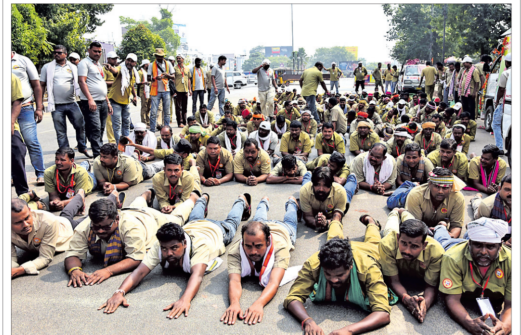
ଏବଂ ଦାବି ନେଇ ରାଜ୍ୟ ଟ୍ରାଫିକ୍ ଡିଭିଜନର ମହାସଂସ୍ଥାପକ ସମସ୍ତ ଭୁବନେଶ୍ୱର ଲୋକଙ୍କୁ ବିଏମସିରେ ଯୋଗଦେଇ ପ୍ରତିରୋଧ କରିବାକୁ ଅନୁରୋଧ କରାଯାଇଛି।

ଭୁବନେଶ୍ୱର ମହାନଗର ନିଗମ (ବିଏମସି) ପକ୍ଷରୁ ମୁକ୍ତା ଯୋଜନା ଅଧୀନରେ ସହରର ବିଭିନ୍ନ ସୌନ୍ଦର୍ଯ୍ୟକରଣ କାର୍ଯ୍ୟ କରାଯିବ। ଏ ନେଇ ବୁଧବାର ବିଏମସି କାର୍ଯ୍ୟାଳୟରେ ଏକ ଗୁରୁତ୍ୱପୂର୍ଣ୍ଣ ବୈଠକ ଅନୁଷ୍ଠିତ ହୋଇଯାଇଛି।