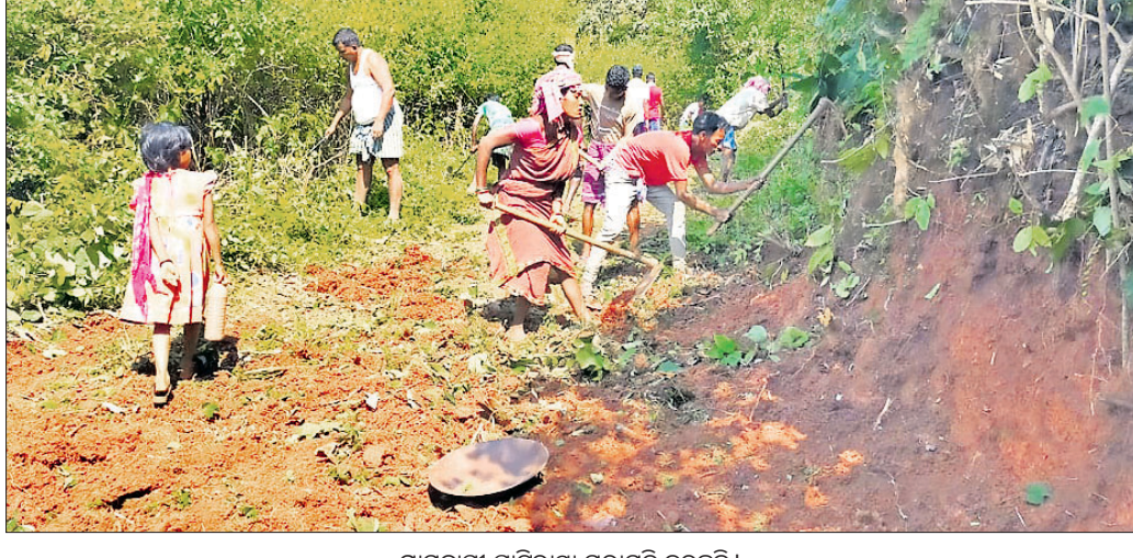
ଗ୍ରାମବାସୀ ଘାଟିରାସ୍ତା ମରାମତି କରୁଛନ୍ତି। ବନ୍ଧନ ଏବଂ ଲ୍ୟାମ୍ପସ କାର୍ଯ୍ୟକ୍ରମକୁ ଯିବାକୁ ହେଲେ ୩୦/୪୦ ଜି.ମି. ଦୂର ବୁଲି ଯାଉଛନ୍ତି।

ବନ୍ଧନଗୁଡ଼ା, ୯।୧୧ (ଡି.ଏନ.ଏ.) ଶୁଣିଲାନ୍ତି ପ୍ରଶାସନ। ବାରମ୍ବାର ଜଣାଇବା ପରେ ବାଧ ହୋଇ ଏବେ ଗ୍ରାମବାସୀ ଶ୍ରମ ଦାନକରି ୬ ଜି.ମି. ଘାଟିରାସ୍ତା ମରାମତି କରି ନିର୍ମାଣ କରିଛନ୍ତି।