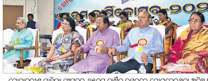
ଗୋଦାବରୀଶ ସାହିତ୍ୟ ସଂସଦର ୬୫ତମ ବାର୍ଷିକ ଉତ୍ସବରେ ଯୋଗଦେଇଥିବା ଅତିଥି।

ଗୋଦାବରୀଶ ସାହିତ୍ୟ ସଂସଦର ୬୫ତମ ବାର୍ଷିକୋତ୍ସବ ବୁଧବାର ଗାତରୋଦିୟ ସଦନଠାରେ ଅନୁଷ୍ଠିତ ହୋଇଯାଇଛି।