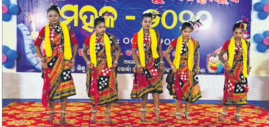
ଜିଲାପ୍ରଧାନ ଶିଶୁ ମହୋତ୍ସବ 'ମହକ' ରେ ପିଲାମାନଙ୍କ ଦ୍ୱାରା ପରିବେଷିତ ସଂସ୍କୃତିକ କାର୍ଯ୍ୟକ୍ରମ।