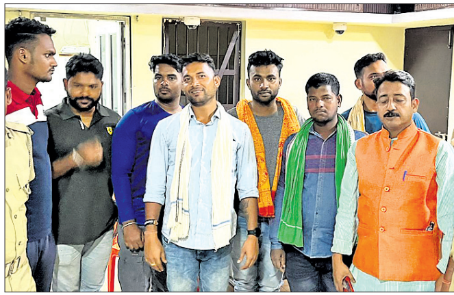
ଗୀରଫ ହୋଇଥିବା ଗୀରଫ ଅଭିଯୁକ୍ତ।