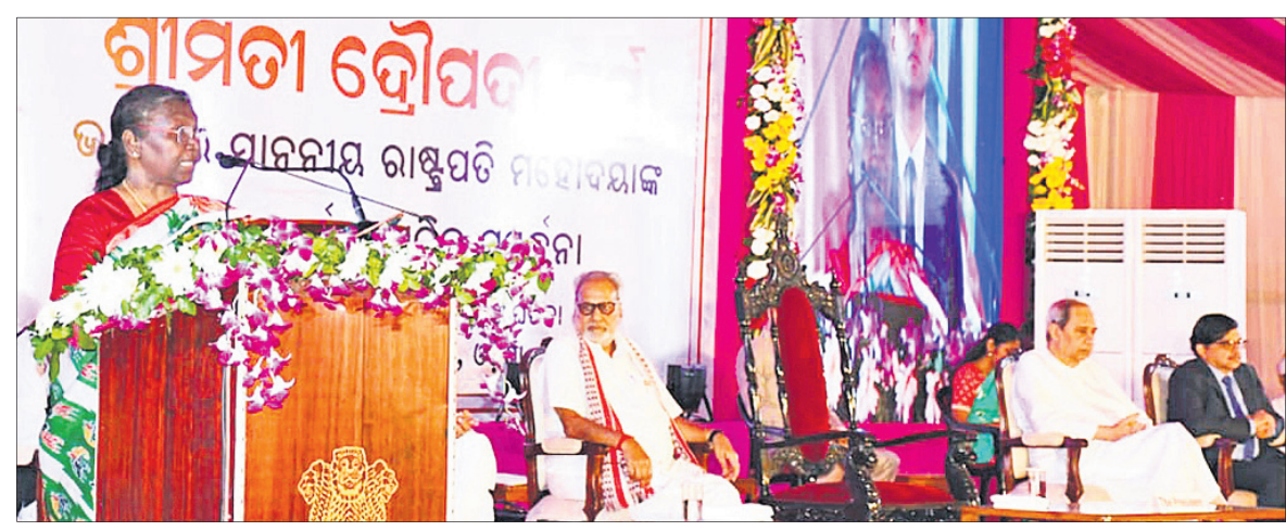
ରାଜଭବନ ପରିସରରେ ଆୟୋଜିତ କାର୍ଯ୍ୟକ୍ରମରେ ରାଷ୍ଟ୍ରପତିଙ୍କୁ ନାଗରିକ ସମ୍ବନ୍ଧନା ଦିଆଯିବା ଅବସରରେ ମହାସାଥୀ ଅଭିଭୂତ।

ଭୁବନେଶ୍ୱର, ୧୦।୧୧(ବୁଧବେଳା) ପଞ୍ଚିତ ଉତ୍କଳମଣି ଗୋପବନ୍ଧୁଙ୍କ ଆଦର୍ଶ ମୋଡେ ଅନୁସାରିତ କରିଛି। ସେଠାରୁ ଥିଲେ ମଧ୍ୟ ନିଜ ମାଟିର ମହକରେ ସ୍ୱତନ୍ତ୍ରତା ରହିଛି। ତଥାପି ନିଜ ଅଞ୍ଚଳର ବିରଦିଗତର ଚୈତନ୍ୟ ନିଆରା। ଓଡ଼ିଶା ଆସି ଯୁଁ ଅତ୍ୟନ୍ତ ଆନନ୍ଦିତ ବୋଲି ରାଷ୍ଟ୍ରପତି ଡ୍ରୌପଦୀ ମୁର୍ମୁ କହିଛନ୍ତି। ଗୁରୁବାର ସନ୍ଧ୍ୟାରେ ରାଜଭବନ ପରିସରରେ ଆୟୋଜିତ ନାଗରିକ ସମ୍ବନ୍ଧନା ଉତ୍ସବରେ ଯୋଗଦେଇ ରାଷ୍ଟ୍ରପତି କହିଛନ୍ତି ଯେ ଭାରତବର୍ଷର ଭୂଗୋଳ ଓ ଇତିହାସରେ ଓଡ଼ିଶା ନିଜର ସ୍ୱତନ୍ତ୍ର ସ୍ଥାନ ବଜାୟ ରଖିଛି। ଚିଲିକା ପରି ହ୍ରଦ, ଶିମିଳିପାଳ ପରି ଶୈବବିଧିତା ଓ ଭିତରକନିକା ପରି ଜାତୀୟ ଉଦ୍ୟାନ ଆମ ପାଖରେ ରହିଛି। ଓଡ଼ିଶାର ଗୌରବନାୟକ ଇତିହାସ ଓ ସଂସ୍କୃତି ଭାରତକୁ ମହାନ କରୁଛି। ଭାରତବର୍ଷର ନୌବାଣିଜ୍ୟରେ ଓଡ଼ିଶାର ଦାନ ଅପୂରଣୀୟ। ଓଡ଼ିଶା ଭାରତର ପ୍ରଥମ ଭାଷାଭିତ୍ତିକ ରାଜ୍ୟ। ଦେଶୀୟ ରାଜ୍ୟ ମିଶ୍ରଣରେ ଓଡ଼ିଶାର ଅବଦାନ ସର୍ବଗ୍ରୋ। ଉତ୍କଳକଳେଶରୀ ହରେକୃଷ୍ଣ ମହତାବଙ୍କ ଭୂମିକା ଯୋଗୁ ଓଡ଼ିଶାରେ ଦେଶୀୟ ରାଜ୍ୟ ମିଶ୍ରଣ ସମ୍ଭବପଦ ହୋଇପାରିଥିଲା। ଓଡ଼ିଶାରୁ ଭାରତର ପ୍ରଗତି ଆରମ୍ଭ ହେଉ ବୋଲି ରାଷ୍ଟ୍ରପତି କହିଛନ୍ତି। ବିକାଶର ସୁଫଳ ସମାଜର ସବୁ ବର୍ଗର ଲୋକଙ୍କ ପାଖରେ ପହଞ୍ଚିବା ଦରକାର। ବିଶେଷକରି ସମାଜର ଶେଷ ଧାଡ଼ିରେ ଠିଆ ହୋଇଥିବା ଲୋକ ପାଖରେ ଯୋଜନା ପହଞ୍ଚି ପାରିଲେ ହିଁ ବିକାଶ ଲକ୍ଷ୍ୟ ପୂରଣ ହୋଇପାରିବ। ରାଜ୍ୟଗୁଡ଼ିକର ବିକାଶରେ ଦେଶର ବିକାଶ। ତେଣୁ