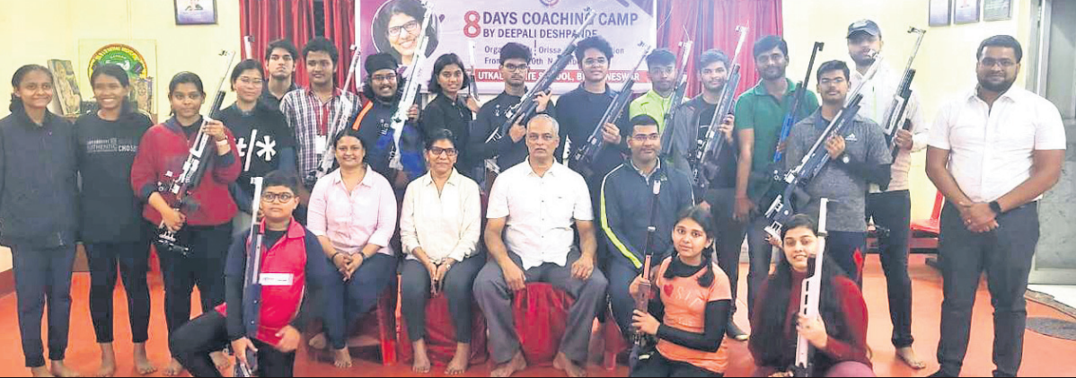
ଉତ୍କଳ କରାତେ ସ୍କୁଲରେ ଅନୁଷ୍ଠିତ ବନ୍ଧୁକ ତାଳନା ଶିବିରର ଉଦ୍‌ଘାଟନୀ ପରେ କର୍ମକର୍ତ୍ତାଙ୍କ ସହ ପ୍ରଶିକ୍ଷଣୀ।

ଅଭିଳେଖ, ୧୦।୧୧ (ପି.ଟି): ଭାରତୀୟ ଦଳର ସେମି ଫାଇନାଲ ପରାଜୟ ପାଇଁ ପୂର୍ବକ ବୋଲିକୁ ଦୋଷ ଦେଇଛନ୍ତି ଭାରତୀୟ ଦଳ ଅଧିନାୟକ ରୋହିତ ଶର୍ମା। ଭାରତୀୟ ଦଳ ସେମି ଫାଇନାଲ ମ୍ୟାଚର ଚାପ ଆଗରେ ପୁଣି ଚୁଆଁଇବା ସହିତ ପରାଜିତ ହୋଇଥିଲା। ୧୬୯ ରନ୍ ଲକ୍ଷ୍ୟର ପିଛା କରୁଥିବା ଇଂଲଣ୍ଡ ପକ୍ଷରୁ ଦୁଇ ଓପେନର ଆଲେକ୍ସ ହେଲ୍ସ ଓ କୋଶ ବଟଲର ପ୍ରଥମ ଉଲ୍ଲେଖରେ ୧୭୦ ରନ୍ ଯୋଡ଼ି ଦଳକୁ ସହଜ ବିକୟ ପ୍ରଦାନ କରିଥିଲେ। ୪ ଓଭର ପୂର୍ବରୁ ଇଂଲଣ୍ଡ ବିକୟ ହୋଇଥିବା ବେଳେ ଭାରତୀୟ ବୋଲି ପ୍ରଦର୍ଶନ ଅତ୍ୟନ୍ତ ସାଧାରଣ ରହିଥିଲା। ଗୁରୁବାର ଭାରତୀୟ ଦଳର ପ୍ରଦର୍ଶନକୁ ନେଇ ନିରାଶା ବ୍ୟକ୍ତ କରିଛନ୍ତି ରୋହିତ। ଶେଷ ଆଡ଼କୁ ଆମେ ଚମତ୍କାର ବ୍ୟାଟି କରିଥିଲେ ହେଁ ଅତ୍ୟନ୍ତ ସାଧାରଣ ବୋଲି କାରଣରୁ ଆମେ ପରାଜିତ ହେଲୁ ବୋଲି ସେ କହିଛନ୍ତି। ନକ୍ ଆଉଟ୍ ମ୍ୟାଚକ ରୂପରେ ଯେଉଁ ଦଳ ଚାପକୁ ସହଜରେ ଗ୍ରହଣ କରିଥାଏ ସେହି ଦଳ ସହଜରେ ବିଜୟୀ ମଧ୍ୟ ହୋଇଥାଏ। ବ୍ୟକ୍ତିଗତ ଭାବରେ ମଧ୍ୟ ସମାନ ନିୟମ ପ୍ରଯୁଜ୍ୟ। କିଭଳି ଚାପର ମୁକାବିଲା କରିବାକୁ ହୁଏ ତାହା କେହି ମଧ୍ୟ ଶିଖାଇପାରିବ ନାହିଁ। ଖେଳାଳି ଆଇପିଏଲରେ ଚାପ ମଧ୍ୟରେ ଭଲ ପ୍ରଦର୍ଶନ କରୁଛନ୍ତି ତେଣୁ ଚାପରେ ପ୍ରଦର୍ଶନ କରିବା ଏମାନଙ୍କ ପାଇଁ ନୂଆ ନୁହେଁ। ଗୁରୁବାର ପ୍ରଥମ ଓଭରରୁ ହିଁ ଭାରତୀୟ ବୋଲର ନର୍ଦ୍ଦିପ ଲାଗୁଥିଲେ। ହେଲ୍ସ ଓ ବଟଲର କୌଣସି ଭୁଲ୍ କରିନଥିଲେ। ଉଭୟ ଖେଳାଳି ବେଶ୍ ପ୍ରଶଂସାଯୋଗ୍ୟ ଇନିଂସ ଖେଳିବା ସହିତ ଭାରତ ହାତରୁ ମ୍ୟାଚ ଛତାଇ ନେଇଥିଲେ।