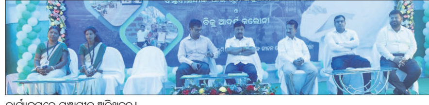
କାର୍ଯ୍ୟକ୍ରମରେ ମଞ୍ଚାସୀନ ଅତିଥିମାନଙ୍କୁ