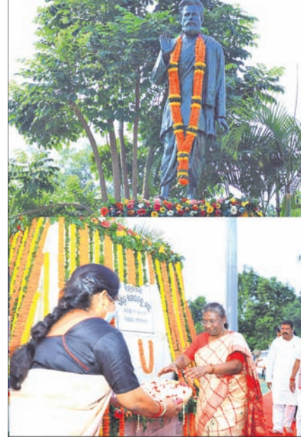
ଭୁବନେଶ୍ୱରରୁ ଗୋପବନ୍ଧୁଙ୍କ ପ୍ରତିମୂର୍ତ୍ତିରେ ମାଲ୍ୟାର୍ପଣ କରୁଛନ୍ତି ରାଷ୍ଟ୍ରପତି।

ଲୋକନୃତ୍ୟ, ପାରମ୍ପରିକ ବାଦ୍ୟ ସାଜକୁ ଶଙ୍ଖ ଧ୍ୱନିରେ ପରିବେଶ ମୁଖରିତ ହୋଇଉଠିଥିଲା। ରାଷ୍ଟ୍ରପତି ପ୍ରଥମେ ରାଜ୍ୟ ସଂଗ୍ରହାଳୟ ଛକଠାରେ ପାଇକ ବିଦ୍ରୋହର ମହାନାୟକ ବକ୍ସ ଜଗବନ୍ଧୁଙ୍କ ପ୍ରତିମୂର୍ତ୍ତିରେ ପୁଷ୍ପାର୍ଚ୍ଚ୍ୟ ପ୍ରଦାନ କରିଥିଲେ। ଏହାପରେ ରାଜଭବନ ଛକରେ ଉତ୍କଳଗୌରବ ମଧୁସୂଦନ ଦାସ, ଗୋପବନ୍ଧୁ ଛକଠାରେ ଉତ୍କଳମଣି ପଣ୍ଡିତ ଗୋପବନ୍ଧୁ ଦାସ, ପାଖର ହାତ୍ତ୍ୟ ଛକଠାରେ ମହାରାଜା ଶ୍ରୀରାମଚନ୍ଦ୍ର ଔଷଦେଓ, କଳିଙ୍ଗ ହର୍ଷସିଂହାଳ ଛକଠାରେ ସ୍ୱଭାବକବି ଗଙ୍ଗାଧର ମେହେର ଓ ଶହୀଦ ଲକ୍ଷ୍ମଣ ନାଏକ, ମେଟ୍ରୋବିହାରଠାରେ ଭଗବାନ ବିର୍ସା ମୁଣ୍ଡା ଏବଂ ଗୁରୁ ଗୋପାଳେ ପଣ୍ଡିତ ରଘୁନାଥ ମୁର୍ମୁଙ୍କ ପ୍ରତିମୂର୍ତ୍ତିରେ ରାଷ୍ଟ୍ରପତି ଶ୍ରଦ୍ଧାସ୍ମରଣ ଅର୍ପଣ କରିଥିଲେ। ସେଠାରେ କେନ୍ଦ୍ର ବିକାଶମନ୍ତ୍ରୀ ଧର୍ମେନ୍ଦ୍ର ପ୍ରଧାନ ଓ ରାଜ୍ୟ ବିଜ୍ଞାନ ଓ କାରିଗରି, ସାଧାରଣ ଉଦ୍ୟୋଗ, ସାମାଜିକ ସୁରକ୍ଷା ଓ ଭିକ୍ଷୁମାନ ସମଶ୍ରାବଣ ମନ୍ତ୍ରୀ ଅଶୋକ ଚନ୍ଦ୍ର ପଣ୍ଡା ମଧ୍ୟ ଶ୍ରଦ୍ଧାସ୍ମରଣ ଅର୍ପଣ କରିଥିଲେ। କେତେକ ସ୍ଥାନରେ ମହାମହିମ ରାଷ୍ଟ୍ରପତିଙ୍କୁ ସାଗତ ଜଣାଇ ଲୋକନୃତ୍ୟ ଓ ଜନକାତି ନୃତ୍ୟ ପରିବେଷିତ ହୋଇଥିଲା। ସରୁଠାରେ ହର୍ଷଧ୍ୱନି, ଛୁଲୁଛୁଲି ସହିତ ମହାମହିମ ରାଷ୍ଟ୍ରପତିଙ୍କୁ ଦେଖିବା ପାଇଁ ବହୁ ଜନସମାଗମ ହୋଇଥିଲା।