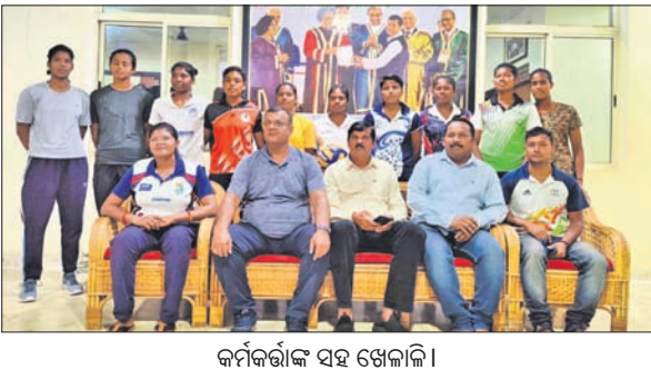
କର୍ମକର୍ତ୍ତାଙ୍କ ସହ ଖେଳାଳି।