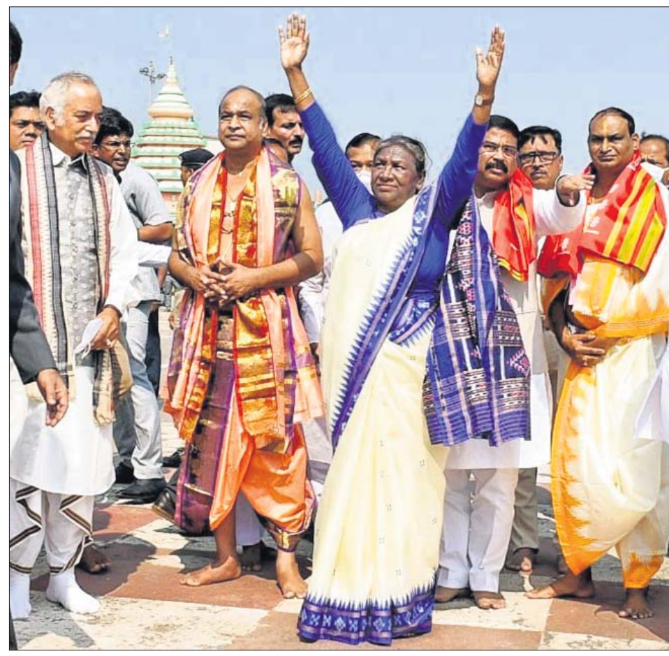
ମହାପ୍ରଭୁଙ୍କୁ ଦର୍ଶନ କରିବା ପୂର୍ବରୁ ଶ୍ରୀମନ୍ଦିର ସିଂହଦ୍ୱାର ସମ୍ମୁଖରେ ଗୁରୁବାର ରାଷ୍ଟ୍ରପତି ଶ୍ରୀପଦା ମୁର୍ତ୍ତି ନିକଟରେ ଅଛନ୍ତି ଗଜପତି ମହାରାଜା ଦିବ୍ୟସିଂହ ଦେବ, କେନ୍ଦ୍ରମନ୍ତ୍ରୀ ଧର୍ମେନ୍ଦ୍ର ପ୍ରଧାନ ଏବଂ ସେବାୟତ।