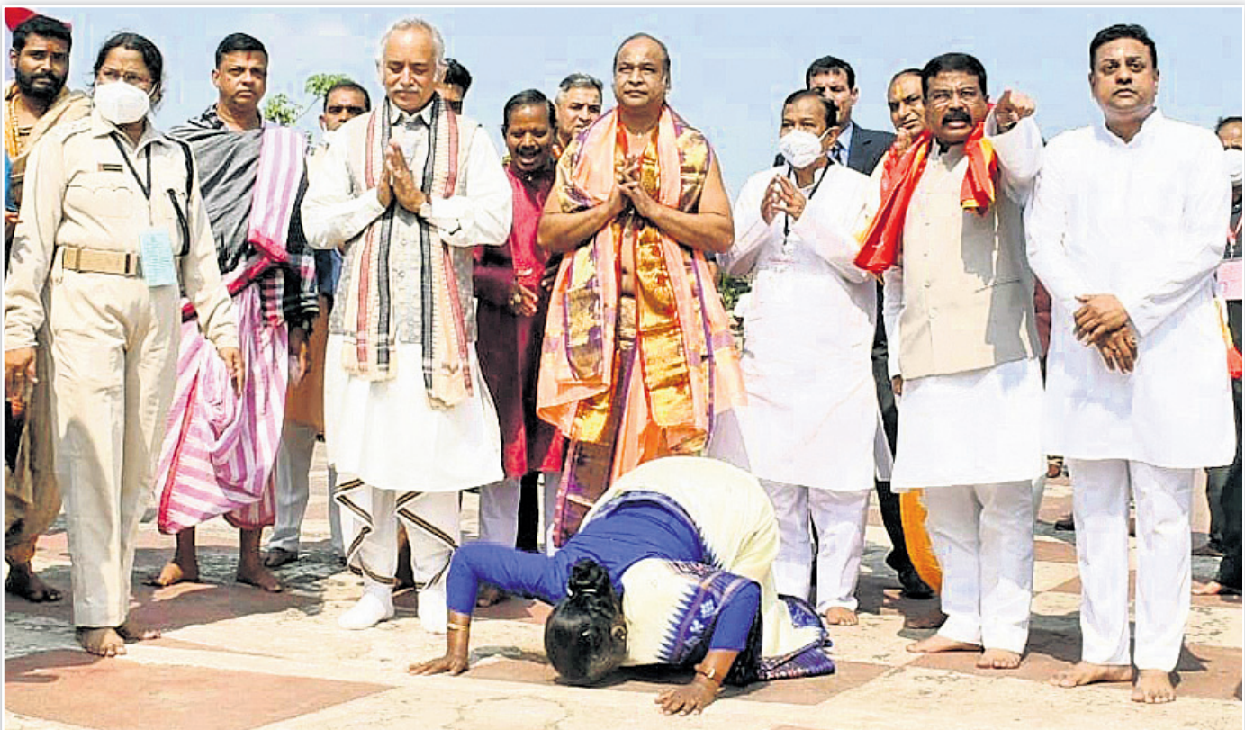
ବଡ଼ବାଣରୁ ମହାବାହୁଙ୍କୁ ପୂଜିଆ ମାରି ଆଶିଷ ଲିକ୍ଷା କରୁଛନ୍ତି।