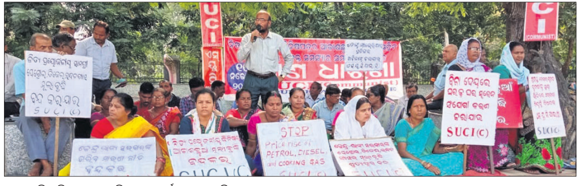
ଆରମ୍ଭରେ ବିଶ୍ୱ ଗୁଣବତ୍ତା ଦିବସ ପାଳିତ