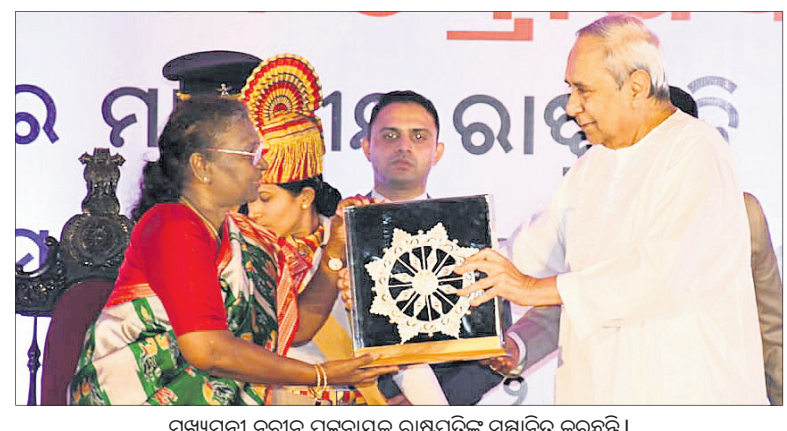
ପୁଖ୍ୟମନ୍ତ୍ରୀ ନବୀନ ପଟ୍ଟନାୟକ ରାଷ୍ଟ୍ରପତିଙ୍କୁ ସମ୍ମାନିତ କରୁଛନ୍ତି।