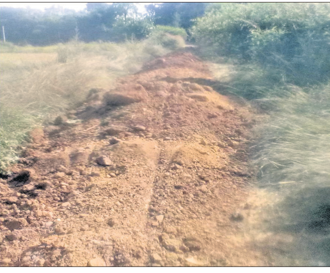
ସମ୍ବଲପୁର ଜିଲ୍ଲାସମାପ୍ତ ପଞ୍ଚାୟତର ଏକ ରାସ୍ତାରେ ଅଭିଯୋଗ ପରେ ମାଟି ପକାଯାଇଛି ।

ସମ୍ବଲପୁର ଜିଲ୍ଲା ପଞ୍ଚାୟତର ଏକ ରାସ୍ତାରେ ଅଭିଯୋଗ ପରେ ମାଟି ପକାଯାଇଛି । ଆରମ୍ଭ କରାଯାଇଥିଲା । ଅପରପକ୍ଷରେ ଠିକାଦାର ଓ ସ୍ଥାନୀୟ ଜନପ୍ରତିନିଧିଙ୍କୁ କାମ କରିବା ପାଇଁ ବୃକ୍ଷ ପ୍ରଶାସନ ସହଯୋଗ କରିଥିଲା । ତେଣୁ ସେମାନେ କେସି, ଟ୍ରାକ୍ଟର ଲଗାଇ ରାତିଅଧିଆ ରାସ୍ତାର କେତେକ ସ୍ଥାନରେ ମାଟି ପକାଇ ଦେଇଛନ୍ତି । ତେବେ ଯେତେ ତପାଇବାକୁ ଉଦ୍ୟମ କଲେ ମଧ୍ୟ ଦୁର୍ଗତିକୁ ଯଥାସମ୍ଭବ ପରିଚାଳି ନାହିଁ । ଏଠିକି ରିପୋର୍ଟ ଦାଖଲ