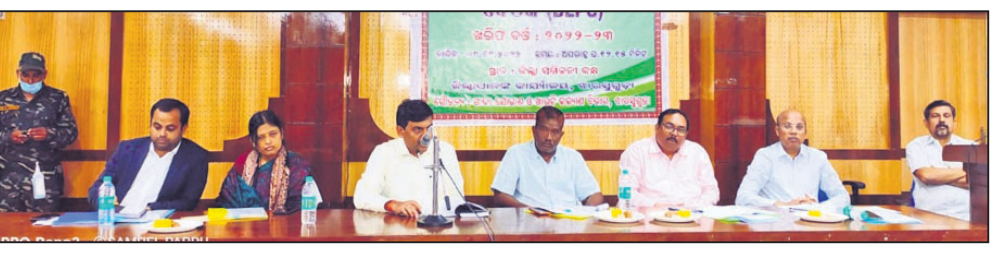
ଡିଏଲପିସି ବୈଠକରେ ମଞ୍ଚାସୀନ ଅଧିକାରୀ ଓ ଜନପ୍ରତିନିଧି ମାନେ ।

ଟଙ୍କା ଓ ମୋରମ ବିଛାଇବା ନାମରେ ୬୯,୯୯୮ ଟଙ୍କା ମୋଟ ୯୯,୭୭୯ ଟଙ୍କା ଚଳୁ କରାଯାଇଛି । ସେହିପରି ପ୍ରଧାନପାଲି ଗ୍ରାମର ତଳପଡ଼ାକୁ ରାସ୍ତା ଉନ୍ନତକରଣ ନାମରେ ପ୍ରକଳ୍ପ କରାଯାଇଛି । ବାସ୍ତବରେ କାମ କରାଯାଇ ନାହିଁ ଓ ୯୯,୯୦୮ ଟଙ୍କା ବିଲ୍ କରି ଉଠାଇ ନିଆଯାଇଛି । ଝରଘାଟି ପଡ଼ା ଗ୍ରାମର ନାଗରାପଡ଼ା ରାସ୍ତା ନିର୍ମାଣ ନ କରି ନିଆଁ ବିଲ୍ କରି ୧ ଲକ୍ଷ ୧୭ ହଜାର ୭୬୦ ଟଙ୍କା ଉଠାଇ ନିଆଯାଇଛି । ସେହିପରି ସାଲେକିନ୍ତା ଗ୍ରାମରେ ଟ୍ରେଞ୍ଚି ଖୋଲା କାମରେ ମଧ୍ୟ ଅନିୟମିତତା କରାଯାଇଛି । ବନ ବିଭାଗ ପକ୍ଷରୁ ଏଠାରେ ଟ୍ରେଞ୍ଚି ଖୋଲା ଯାଇଥିଲା । ହେଲେ ଉକ୍ତ ଟ୍ରେଞ୍ଚିକୁ ଦେଖାଇ ପୁଣି ଥରେ ସୂଚନାଯୋଗ୍ୟ, ପଞ୍ଚାୟତ ସୁରକ୍ଷା ସମିତି ସଦସ୍ୟମାନେ ଜିଲ୍ଲା ପରିଷଦ କାର୍ଯ୍ୟନିର୍ବାହୀ ଅଧିକାରୀଙ୍କ ପାଖରେ ଅଭିଯୋଗ କରିଥିଲେ । ବଡ଼ ପ୍ରଧାନପାଲି ଉଦ୍ୟମ କଲେ ମଧ୍ୟ ଦୁର୍ଗତିକୁ ଯଥାସମ୍ଭବ ପରିଚାଳି ନାହିଁ । ଏଠିକି ରିପୋର୍ଟ ଦାଖଲ