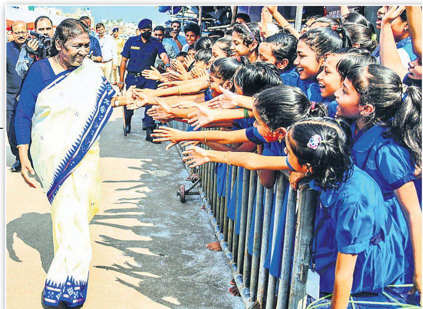
ବଡ଼ବାଣରେ ଯିବା ସମୟରେ ରାଷ୍ଟ୍ରପତି ଛୋଟ ଛୋଟ ପିଲାଙ୍କ ସହ ହାତ ମିଳାଇ ଭାବ ବିନିମୟ କରୁଛନ୍ତି।