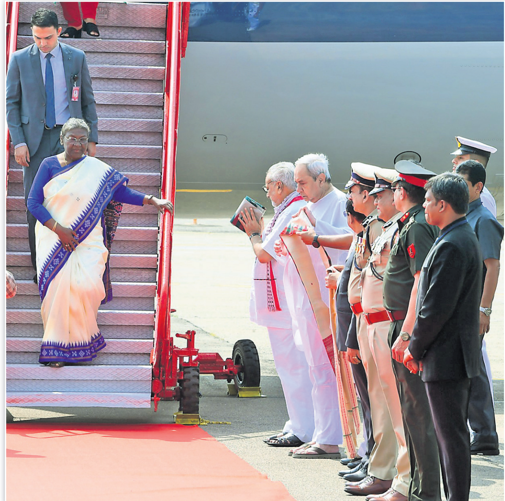
ଭୁବନେଶ୍ୱର ବିମାନବନ୍ଦରରେ ରାଷ୍ଟ୍ରପତି ଡ୍ରୌପଦୀ ମୁର୍ମୁଙ୍କୁ ରାଜ୍ୟପାଳ ପ୍ରଫେସର ଗଣେଶୀ ଲାଲ, ପୁଖ୍ୟମନ୍ତ୍ରୀ ନବୀନ ପଟ୍ଟନାୟକ ଓ ଅନ୍ୟ ବରିଷ୍ଠ ଅଧିକାରୀମାନେ ସାଗତ କରୁଛନ୍ତି।