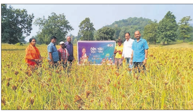
ସମ୍ବଲପୁର ଜିଲ୍ଲା କବଳୀପାଳରେ ମାଣ୍ଡିଆ ଦିବସ ପାଳନ ଅବସରରେ ଚାଷୀଙ୍କ ସହ ଅତିଥି ।

ଉତ୍ତମ ପୋଷଣ ଯୁକ୍ତ ଖାଦ୍ୟ ହେଉଛି ମାଣ୍ଡିଆ । ଜୀବଦାନ ସହ କ୍ୟାଲସିୟମ, ଆଇରନ ଭଳି ଭିତାମିନ ଏଥିରେ ଭରି ରହିଛି । ଆଜିର ଖାଦ୍ୟ ସାମଗ୍ରୀରେ ଯେଉଁ ଭାବେ ରାସାୟନିକ ସାର ବ୍ୟବହାର କରାଯାଉଛି ଏହା ରୋଗର କାରଣ ପାଇଛି । ନିୟମିତ ଭାବେ ମାଣ୍ଡିଆ ବ୍ୟବହାର କଲେ ଏଥିରେ ଥିବା ରୋଗ ପ୍ରତିରୋଧକ ଶକ୍ତି ଶରୀରରେ ଥିବା ରୋଗକୁ ପ୍ରତିରୋଧ କରିବେ ବୋଲି ସମ୍ବଲପୁର ଜିଲ୍ଲା କବଳୀପାଳରେ ରୁକ୍ଷବାର ମାଣ୍ଡିଆ ଦିବସ ପାଳନ ଅବସରରେ ଅନୁଷ୍ଠିତ ବୈଠକରେ ଅତିଥିମାନେ ମତ ପ୍ରକାଶ କରି ଚାଷୀମାନଙ୍କୁ ସଚେତନ କରିଥିଲେ । ସେମାନେ ଆହୁରି କହିଥିଲେ ଯେ, ଆମର ପୂର୍ବଜମାନେ ମାଣ୍ଡିଆ ସମେତ ଧାନ, ଗାଈର ଖାଦ୍ୟ ଶସ୍ୟ ଭାବେ ବ୍ୟବହାର କରୁଥିଲେ । ଏହାଫଳରେ ଶରୀର ସ୍ତୃଣ୍ଣ ଓ ମିଥୁକ୍ଷ ଶାନ୍ତ ରହୁଥିଲା । ତେବେ