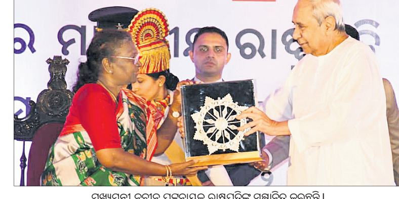
ମୁଖ୍ୟମନ୍ତ୍ରୀ ନବୀନ ପଟ୍ଟନାୟକ ରାଷ୍ଟ୍ରପତିଙ୍କୁ ସମ୍ମାନିତ କରୁଛନ୍ତି ।

ପକ୍ଷରୁ ତାଙ୍କୁ ଭବ୍ୟ ସାଗତ କରାଯାଇଥିଲା । ଏହି ଅବସରରେ ରାଜଭବନରେ ରାଷ୍ଟ୍ରପତିଙ୍କ ପାଇଁ ନାଗରିକ ସମ୍ବନ୍ଧନା ଉତ୍ସବ ଆୟୋଜନ କରାଯାଇଥିଲା । ରାଜ୍ୟବାସୀଙ୍କ ଚେତନା ମୁଖ୍ୟମନ୍ତ୍ରୀ ନବୀନ ପଟ୍ଟନାୟକ ରାଷ୍ଟ୍ରପତିଙ୍କୁ ସାଗତ ଜଣାଇଥିଲେ । ଏହି ଅବସରରେ ରାଜ୍ୟପାଳ ପ୍ରଫେସର ଗଣେଶୀଲାଲ, ହାଇକୋର୍ଟ ମୁଖ୍ୟ ବିଚାରପତି ଏସ୍. ପୁରୁଲୀଧର ମଧ୍ୟ ରାଷ୍ଟ୍ରପତିଙ୍କୁ ସାଗତ କରିଥିଲେ । ଏହି ଅବସରରେ ମୁଖ୍ୟମନ୍ତ୍ରୀ କହିଛନ୍ତି ଯେ ମହାମହିମ ସମାଜର ଭିତରେ ପ୍ରତ୍ୟେକ ଓଡ଼ିଆ ନିଜ ସଫଳତା ଦେଖୁଛନ୍ତି । ପ୍ରଥମଥର ପାଇଁ ଓଡ଼ିଶାକୁ ଜଣେ ମହିଳା ଦେଶର ପ୍ରଥମ ନାଗରିକ ହୋଇଛନ୍ତି । ରାଜରାଜ୍ୟପୁରୁରୁ ରାଜସିନା ହିଲୁକୁ ତାଙ୍କ ଯାତ୍ରା ପାଇଁ ପ୍ରତ୍ୟେକ ଓଡ଼ିଆ ଆଜି ଗର୍ବିତ । ଜୀବନରେ ବଡ଼ ସ୍ୱପ୍ନ ପାଇଁ ରାଷ୍ଟ୍ରପତି ପ୍ରେରଣା ଦେଉଛନ୍ତି । ଓଡ଼ିଶା ଆଜି ଆପଣଙ୍କ ପାଇଁ ଗର୍ବିତ ବୋଲି ମୁଖ୍ୟମନ୍ତ୍ରୀ କହିଛନ୍ତି ।