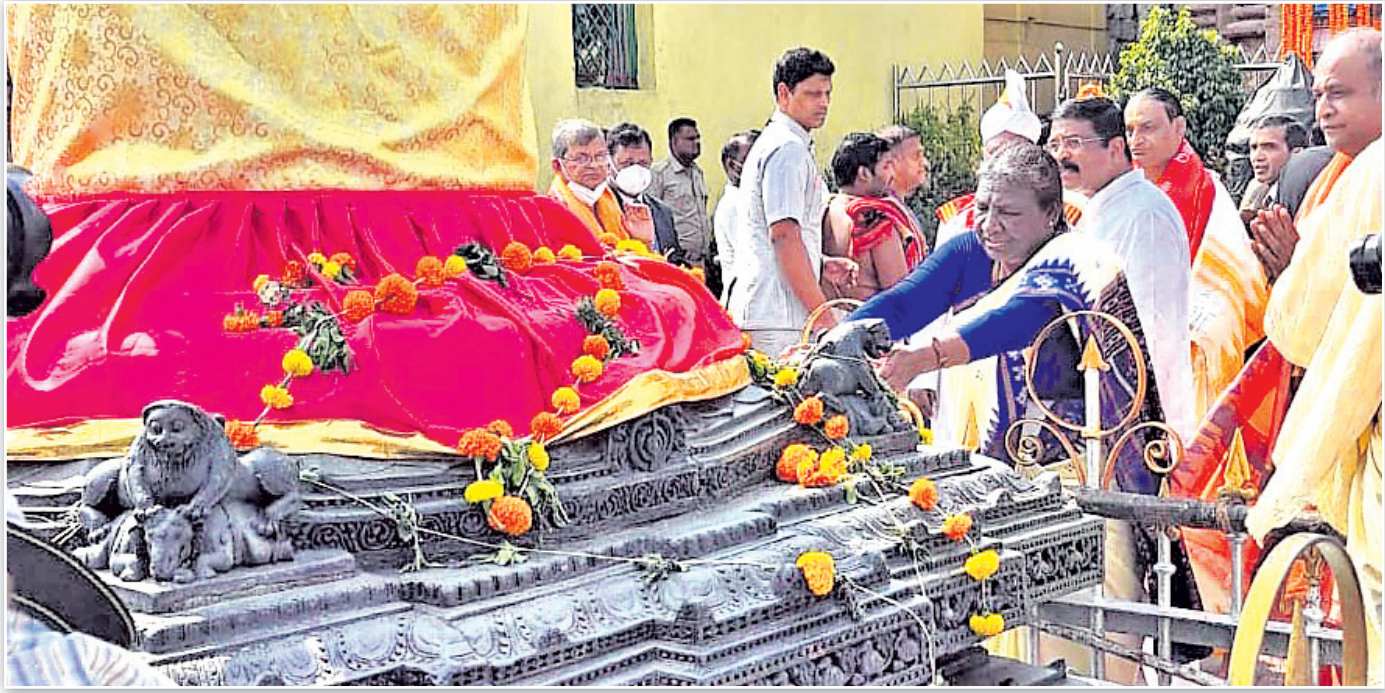
ପୁରୀ ଶ୍ରୀମନ୍ଦିର ଦର୍ଶନ ଅବସରରେ ଅରୁଣ ସ୍ତମ୍ଭ ଛୁଇଁ ମହାପ୍ରଭୁଙ୍କୁ ପ୍ରଣାମ ଜଣାଇବାକୁ ରାଷ୍ଟ୍ରପତି ।