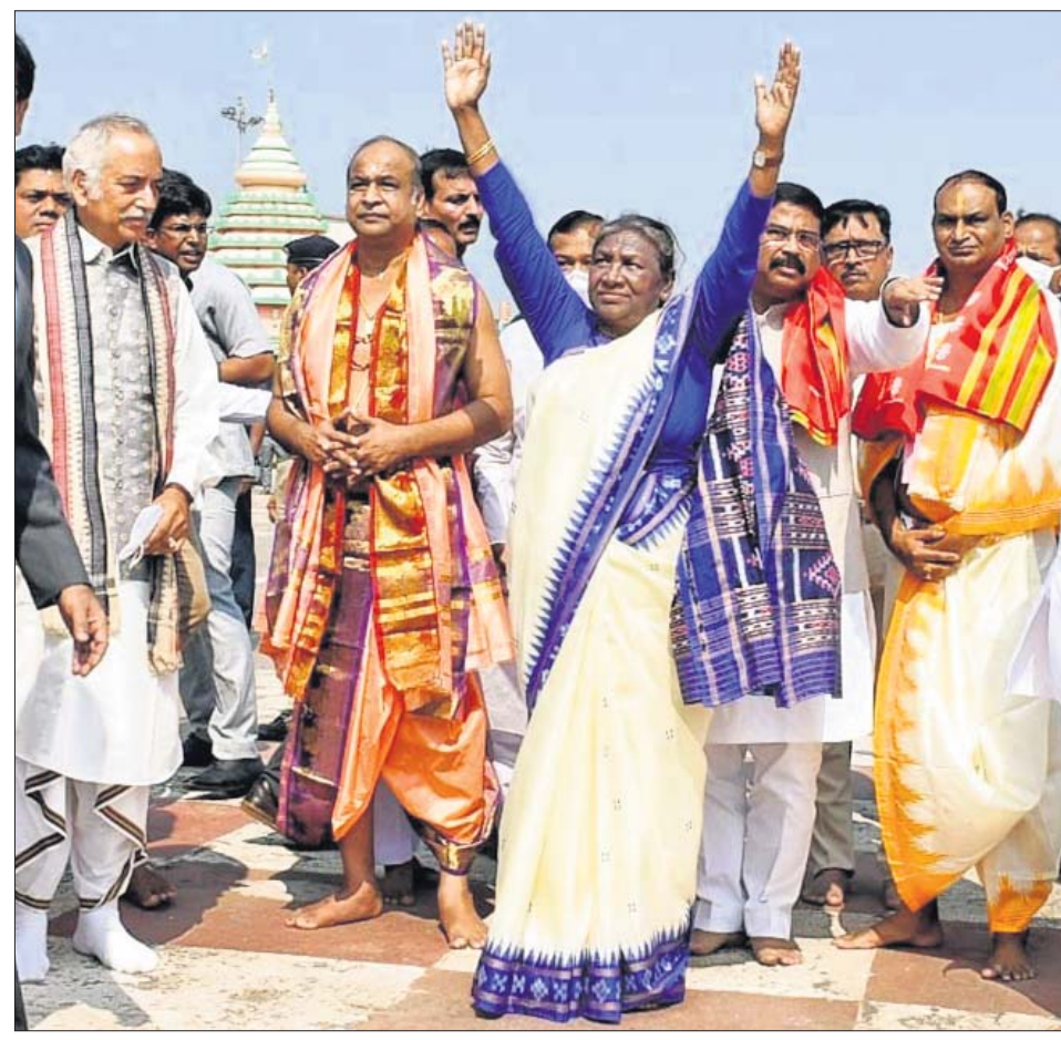
ମହାପ୍ରଭୁଙ୍କୁ ଦର୍ଶନ କରିବା ପୂର୍ବରୁ ଶ୍ରୀମନ୍ଦିର ସିଂହଦ୍ୱାର ସମ୍ମୁଖରେ ଗୁରୁବାର ରାଷ୍ଟ୍ରପତି ଶ୍ରୀମତୀ ମୁର୍ତ୍ତୀ ନିକଟରେ ଅଛନ୍ତି ଗଜପତି ମହାରାଜା ଦିବ୍ୟସିଂହ ଦେବ, କେନ୍ଦ୍ରମନ୍ତ୍ରୀ ଧର୍ମେନ୍ଦ୍ର ପ୍ରଧାନ ଏବଂ ସେବାୟତ।