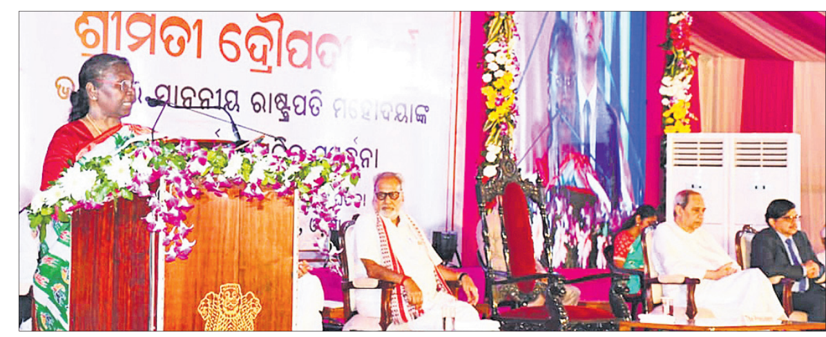
ରାଜଭବନ ପରିସରରେ ଆୟୋଜିତ କାର୍ଯ୍ୟକ୍ରମରେ ରାଷ୍ଟ୍ରପତିଙ୍କୁ ନାଗରିକ ସମ୍ବନ୍ଧନା ଦିଆଯିବା ଅବସରରେ ମହାସାଥୀ ଅଭିଭୂତ ।

ଭୁବନେଶ୍ୱର, ୧୦/୧୧ (ଭୁବନେଶ୍ୱର) ପଞ୍ଚିତ ଉତ୍କଳମଣି ଗୋପବନ୍ଧୁଙ୍କ ଆଦର୍ଶ ମୋଡେ ଅନୁସାରିତ କରିଛି । ସେଠାରୁ ଥିଲେ ମଧ୍ୟ ନିଜ ମାଟିର ମହକରେ ସ୍ୱତନ୍ତ୍ରତା ରହିଛି । ତଥାପି ନିଜ ଅଞ୍ଚଳର ବିରଦିଗତର ଚୈତନ୍ୟ ନିଆରା । ଓଡ଼ିଶା ଆସି ଯୁଁ ଅତ୍ୟନ୍ତ ଆନନ୍ଦିତ ବୋଲି ରାଷ୍ଟ୍ରପତି ଡ୍ରୌପଦୀ ମୁର୍ମୁ କହିଛନ୍ତି । ଗୁରୁବାର ସନ୍ଧ୍ୟାରେ ରାଜଭବନ ପରିସରରେ ଆୟୋଜିତ ନାଗରିକ ସମ୍ବନ୍ଧନା ଉତ୍ସବରେ ଯୋଗଦେଇ ରାଷ୍ଟ୍ରପତି କହିଛନ୍ତି ଯେ ଭାରତବର୍ଷର ଭୂଗୋଳ ଓ ଇତିହାସରେ ଓଡ଼ିଶା ନିଜର ସ୍ୱତନ୍ତ୍ର ସ୍ଥାନ ବଜାୟ ରଖିଛି । ତିଳିକା ପରି ହୃଦ, ଶିମିଳିପାଳ ପରି ଶୈବବିଧିତା ଓ ଭିତରକନିକା ପରି ଜାତୀୟ ଉଦ୍ୟାନ ଆମ ପାଖରେ ରହିଛି । ଓଡ଼ିଶାର ଗୌରବନାୟକ ଇତିହାସିକ କହିଛନ୍ତି । ବିକାଶର ସୁଫଳ ସମାଜର ସବୁ ବର୍ଗର ଲୋକଙ୍କ ପାଖରେ ପହଞ୍ଚିବା ଦରକାର । ବିଶେଷକରି ସମାଜର ଶେଷ ଧାଡ଼ିରେ ଠିଆ ହୋଇଥିବା ଲୋକ ପାଖରେ ଯୋଜନା ପହଞ୍ଚି ପାରିଲେ ହିଁ ବିକାଶ ଲକ୍ଷ୍ୟ ପୂରଣ ହୋଇପାରିବ । ରାଜ୍ୟଗୁଡ଼ିକର ବିକାଶରେ ଦେଶର ବିକାଶ । ତେଣୁ