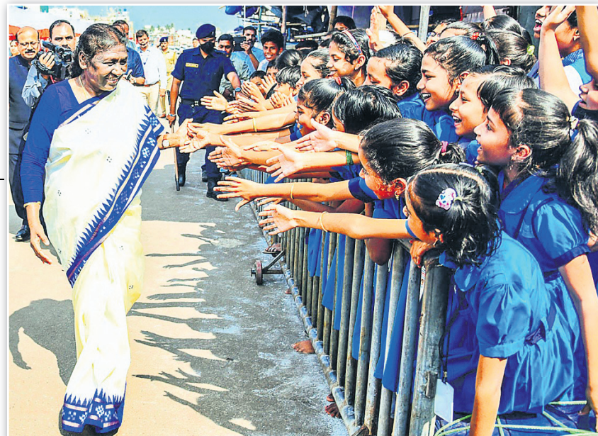
ବଡ଼ବାଣରେ ଯିବା ସମୟରେ ରାଷ୍ଟ୍ରପତି ଛୋଟ ଛୋଟ ପିଲାଙ୍କ ସହ ହାତ ମିଳାଇ ଭାବ ବିନିମୟ କରୁଛନ୍ତି ।