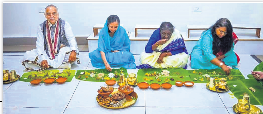
ପୁରୀ ରାଜଭବନରେ ରାଷ୍ଟ୍ରପତି ଡ୍ରୌପଦୀ ମୁର୍ମୁ ଗଜପତି ମହାରାଜ ବିଦ୍ୟସିଂହ ଦେବ, ମହାରାଣୀ ଲାଳାବତୀ ପାଟମହାଦେଈ ଏବଂ ଝିଅ ଇତିଶ୍ରୀଙ୍କ ସହ ମହାପ୍ରସାଦ ସେବନ କରୁଛନ୍ତି ।