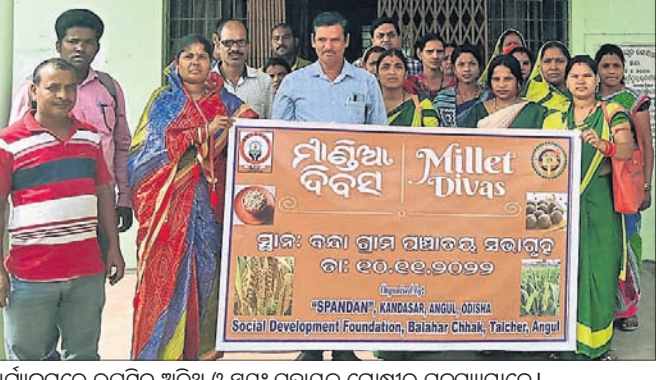
କାର୍ଯ୍ୟକ୍ରମରେ ଉପସ୍ଥିତ ଅତିଥି ଓ ସ୍ୱଳ୍ପ ସହାୟକ ଗୋଷ୍ଠୀର ସଦସ୍ୟମାନେ।

ଦେବା ସହ ଅତିଥି ପରିଚୟ ପ୍ରଦାନ କରିଥିଲେ। ସେହିପରି ଅନ୍ୟତମ ଅତିଥି ଭାବେ ସୋସିଆଲ ଡେଭଲପମେଣ୍ଟ ଫାଉଣ୍ଡେଶନର ସମ୍ପାଦକ ବ୍ଲକ୍‌ସ୍ତର ବାସ ଯୋଗଦେଇ ଦୈନିକ ଜୀବନରେ ମାଣ୍ଡିଆକୁ କିପରି ଖାଦ୍ୟ ପ୍ରସ୍ତୁତ କରାଯାଇପାରିବ ଏବଂ ମା'ମାନେ ସଫଳ