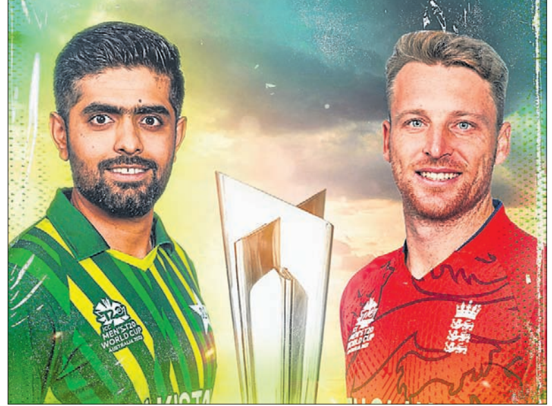
ବୁଲ ଅଧିନାୟକ ବାବର ଆଜମ ଓ କୋଏ୍ ବଟଲର।

ଚଳିତ ଟି୨୦ କ୍ରିକେଟ ବିଶ୍ୱକପ୍ ଫାଇନାଲରେ ଇଂଲଣ୍ଡ ଓ ପାକିସ୍ତାନ ମଧ୍ୟରେ ପ୍ରକାଶିତ ହେବ। ଆସନ୍ତା ରବିବାର ଫାଇନାଲ ଖେଳାଯିବ। ରେକର୍ଡ ଅନୁସାରେ ୩୦ ବର୍ଷ ପରେ ଉଭୟ ଦଳ କୌଣସି ଏକ ବିଶ୍ୱକପ୍ ଫାଇନାଲରେ ପରସ୍ପରକୁ ଭେଟିବେ। ଶେଷଥର ପାଇଁ ୧୯୯୨ ଦିନିକିଆ କ୍ରିକେଟ ବିଶ୍ୱକପ୍ରେ ଉଭୟ ଦଳ ଫାଇନାଲ ଖେଳିଥିଲେ। ଏଥିରେ ଇଂଲଣ୍ଡକୁ ୨୨ ରନରେ ହରାଇ ପାକିସ୍ତାନ ଫାଇନାଲରେ ଲଢ଼ିବାକୁ ସୁଯୋଗ ଦେଇଥିଲେ।