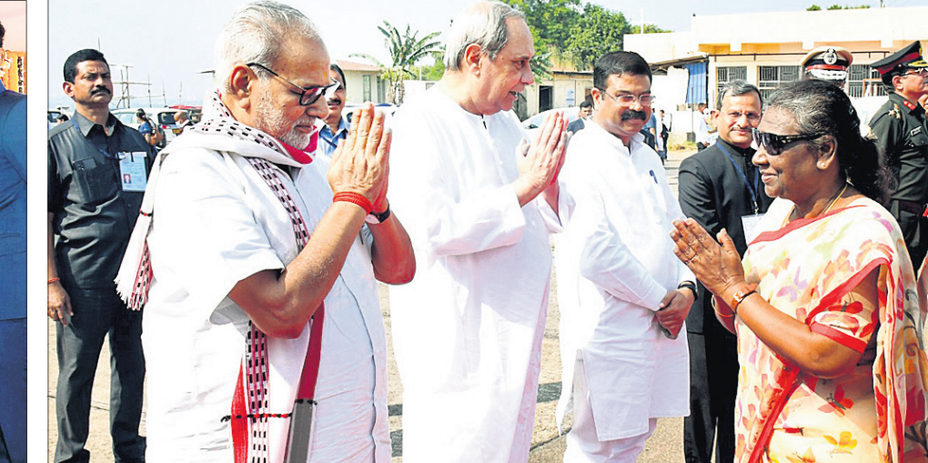
ବିଜୁ ପଟ୍ଟନାୟକ ବିମାନ ବନ୍ଦରରେ ରାଷ୍ଟ୍ରପତିଙ୍କୁ ରାଜ୍ୟପାଳ ଓ ମୁଖ୍ୟମନ୍ତ୍ରୀ ବିବାଇ ଜଣାଉଛନ୍ତି।