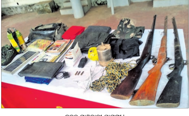
ଜବତ ମାଓବାଦୀ ସାମଗ୍ରୀ।

■ ମାଲିପଡର ଜଙ୍ଗଲରେ ମାଓବାଦୀ-ଏସ୍‌ଓଜି ଗୁଳିବିନିମୟ ■ ୩ ଦେଶୀ ବନ୍ଧୁକ, ବିସ୍ଫୋରକ, ୧୦ ବସ୍ତ୍ରା ଗଞ୍ଜେଇ ଜବତ