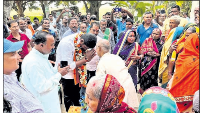
ଧ୍ୟାନରେ ନବନିର୍ବାଚିତ ବିଧାନସଭା ସୂର୍ଯ୍ୟବଂଶୀ ପୁରକ ଲୋକଙ୍କୁ କୃତଜ୍ଞତା ଜଣାଇଛନ୍ତି।