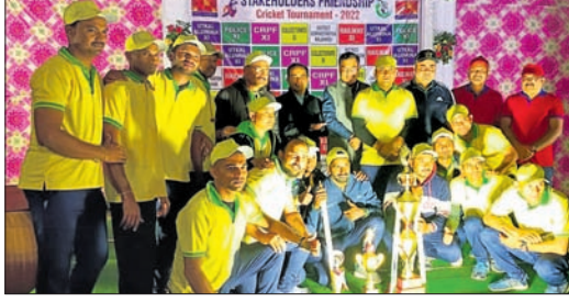
ଅତିଥିଙ୍କ ସହ ଖେଳାଳିମାନେ ।