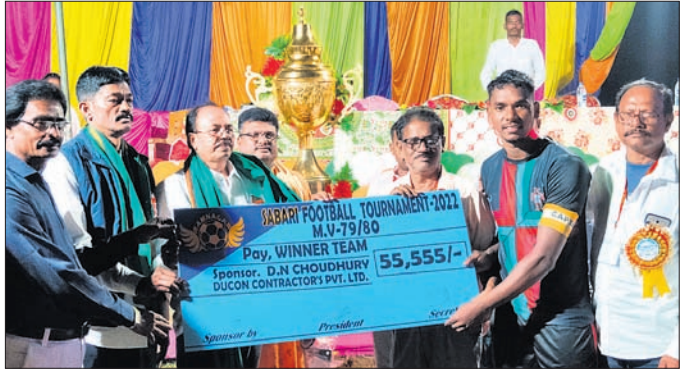
ଅତିଥିମାନେ ଚାମିୟନ ଦଳକୁ ପୁରସ୍କୃତ କରୁଛନ୍ତି।

ଆନ୍ତଃରାଜ୍ୟ ଫୁଟବଲ ଚୁର୍ଣ୍ଣାମେଣ୍ଟ ଯୋଗଦାନ ଉଦ୍‌ଯାପିତ ହୋଇଯାଇଛି। ପାଇନାଲ ମ୍ୟାଚରେ ଜଗେଶ-୧୧ ଦଳ ସହ କୋପରଲିକା ଦଳର ମୁକାବିଲା