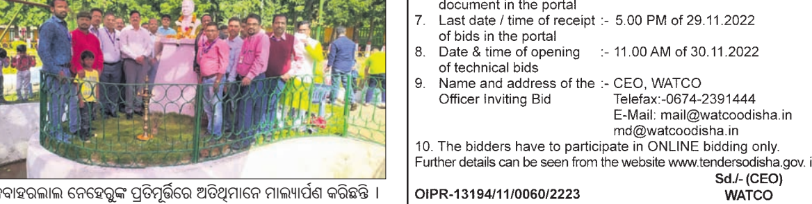
କବାହରଲାଲ ନେହେରୁଙ୍କ ପ୍ରତିମୂର୍ତ୍ତିରେ ଅତିଥିମାନେ ମାଲାପର୍ଯ୍ୟ କରିଛନ୍ତି ।