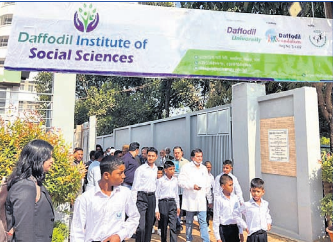
ଡିସ୍ ଢାଆଁରେ କିସ୍ ପ୍ରତିଷ୍ଠା ଅନୁଷ୍ଠାନ ସାମଗ୍ରୀ

ଭୁବନେଶ୍ୱର, ୧୪।୧୧ (ଭୁବନେ) ବିଶ୍ୱର ସର୍ବବୃହତ ଆବାସିକ ଜନଜାତି ବିଦ୍ୟାଳୟ ଭୁବନେଶ୍ୱରସ୍ଥିତ 'କିସ୍' ଢାଆଁରେ ବାଂଲାଦେଶରେ ଖୋଲିଛନ୍ତି ତାପୋଡିଲି ଇନଷ୍ଟିଚ୍ୟୁଟ ଅଫ ସୋସିଆଲ୍ ସାଇନ୍ସେସ୍ (ଡିସ୍)। ଡାକାଠାରେ କିସ୍ ଓ କିସ୍ ପ୍ରତିଷ୍ଠା ଅନୁଷ୍ଠାନ ସାମଗ୍ରୀ ସହର ଉଦ୍ଘାଟନ କରିଛନ୍ତି। ତାପୋଡିଲି ଇନ୍ଷ୍ଟିଚ୍ୟୁଟ ହେଉଛି