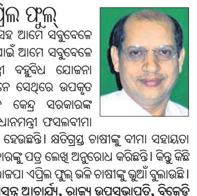
ପ୍ରସବ ଆଚାର୍ଯ୍ୟ, ରାଜ୍ୟ ଉପସଭାପତି, ବିଜେଡି

ଚାଷୀଙ୍କୁ ଭାଜପାର ଏପ୍ରିଲ ଫୁଲ୍ ଆମ ଦଳ ଚାଷୀଙ୍କ ବଳ। ଚାଷୀଙ୍କ ସହ ଆମେ ସବୁବେଳେ ଅଛୁ। ଚାଷୀଙ୍କ ସମସ୍ୟା ଏବଂ ହକ୍ ପାଇଁ ଆମେ ସବୁବେଳେ ଲଢ଼ୁଛୁ। ଚାଷୀଙ୍କ ପାଇଁ ପୁଣ୍ୟମନ୍ତ୍ରୀ ବହୁଦିନ ଯୋଜନା ମଧ୍ୟ ହାତକୁ ନେଇଛନ୍ତି। ଚାଷୀମାନେ ସେଥିରେ ଉପକୃତ ହେଉଛନ୍ତି। ଭାଜପା ନେତୃତ୍ୱାଧୀନ କେନ୍ଦ୍ର ସରକାରଙ୍କ ଅପାରଗତା ଯୋଗୁ ଚାଷୀମାନେ ପ୍ରଧାନମନ୍ତ୍ରୀ ଫସଲବାମା ଯୋଜନାର ସୁଫଳ ପାଇବାକୁ ବଞ୍ଚିତ ହେଉଛନ୍ତି। କ୍ଷତିଗ୍ରସ୍ତ ଚାଷୀଙ୍କୁ ବାମା ସହାୟତା ପ୍ରଦାନ ପାଇଁ ପୁଣ୍ୟମନ୍ତ୍ରୀ କେନ୍ଦ୍ର ସରକାରଙ୍କୁ ପତ୍ର ଲେଖି ଅନୁରୋଧ କରିଛନ୍ତି। କିନ୍ତୁ କିଛି ସୁଫଳ ମିଳିନାହିଁ। ଉପନିର୍ବାଚନରେ ଭାଜପା ଏପ୍ରିଲ ଫୁଲ୍ ଭଳି ଚାଷୀଙ୍କୁ ଭୁଆଁ ବୁଲାଇଛି।