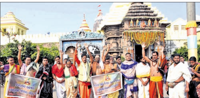
ହେତୁବାଦୀଙ୍କ ବିରୋଧରେ ୩ ଏତଲା ଦିଆଯାଇଛି।

ଓଡ଼ିଶା ମନ୍ଦିର ସେବାୟତ ସଂଘ, ଶ୍ରୀମନ୍ଦିର ସେବାୟତ ଏବଂ ବ୍ରାହ୍ମଣ ସମାଜ ତରଫରୁ ସୋମବାର ହେତୁବାଦୀଙ୍କ ବିରୋଧରେ ପୁରୀ ସିଂହଦ୍ୱାର ଥାନାରେ ଏତଲା ଦିଆଯାଇଛି। ହେତୁବାଦୀମାନେ ହିନ୍ଦୁପରମ୍ପରା ଭଙ୍ଗ କରିବା, ହିନ୍ଦୁ ଦେବଦେବୀଙ୍କୁ କଳ୍ପ ମତବ୍ୟ ଦେବା ସହ ମହାପ୍ରଭୁ ଶ୍ରୀଜଗନ୍ନାଥଙ୍କୁ ଆକ୍ଷେପ କରିବା ନେଇ ସେମାନଙ୍କ ବିରୋଧରେ କାର୍ଯ୍ୟାନୁଷ୍ଠାନ ଦାବିରେ ଏହି ଏତଲା ଦିଆଯାଇଛି। ଆଗାମୀ ସପ୍ତାହକ ମଧ୍ୟରେ କାର୍ଯ୍ୟାନୁଷ୍ଠାନ ନିଆ ନ ଗଲେ ଓଡ଼ିଶା ମନ୍ଦିର ସେବାୟତ ସଂଘ ଏବଂ ଛତିଶା ନିର୍ଯୋଗର ସେବାୟତଙ୍କ ପକ୍ଷରୁ ବିଶାଳ ବିରୋଧ ପ୍ରଦର୍ଶନ କରାଯିବ ବୋଲି ଚେତାବନୀ ଦିଆଯାଇଛି। ଉପରୋକ୍ତ ୩ ଏତଲା ପକ୍ଷରୁ ଶ୍ରୀମନ୍ଦିର ସିଂହଦ୍ୱାର ସମ୍ମୁଖରେ