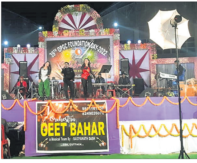
ପ୍ରତିଷ୍ଠା ଦିବସ ଉପଲକ୍ଷେ ଅନୁଷ୍ଠିତ ସାଂସ୍କୃତିକ କାର୍ଯ୍ୟକ୍ରମ