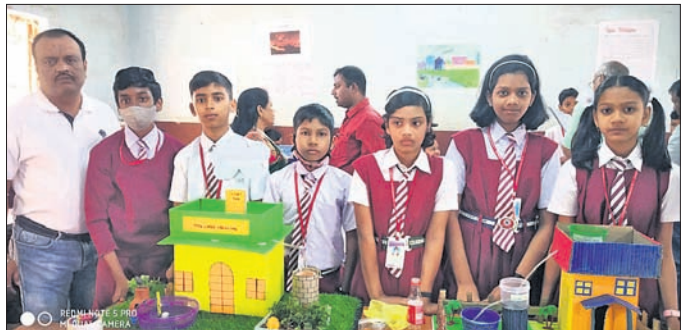
ଜଣେ ଛାତ୍ର ବିଜ୍ଞାନମେଳାରେ ପ୍ରକଳ୍ପ ପ୍ରଦର୍ଶନ କରୁଛନ୍ତି।