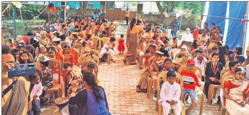
ଶିଶୁ ଦିବସରେ ଛାତ୍ରାଛାତ୍ରୀମାନେ ବିଭିନ୍ନ ବେଶରେ ସଜିତ ହେଉଛନ୍ତି।

ସରପଞ୍ଚଙ୍କ ଦ୍ୱାରା ନିର୍ମିତ ରାସ୍ତା। ନେବାକୁ ହେଲେ ଗ୍ରାମଠାରୁ ୫ କି.ମି. ଦୂରରେ ଥିବା ଉତ୍ତରାଧିକାରୀଙ୍କୁ ବୋହି ନେଇ ସେଠାକୁ ଦଶମଶତାବ୍ଦୀ ବୋହୂ ସାହାଯ୍ୟକ୍ଷେତ୍ର ନିଆଯାଇଥିଲା। ନିର୍ବାଚନରେ ବିଜୟ ହେବା ପରେ ଏବେ ସରପଞ୍ଚ ଚଞ୍ଚଳା ଏନଆରକିଏସରେ ୫ଲକ୍ଷ ଟଙ୍କା ବ୍ୟୟ ଅଟକକରେ କୁଦାଲଆଟାଳ ଗ୍ରାମକୁ ରାସ୍ତା ତିଆରି କରିଛନ୍ତି ବୋଲି ଗ୍ରାମବାସୀ ଧନ୍ୱା ଦେବି ନେଇ ସେଠାକୁ ଦଶମଶତାବ୍ଦୀ ବୋହୂ ସାହାଯ୍ୟକ୍ଷେତ୍ର ନିଆଯାଇଥିଲା। ନିର୍ବାଚନରେ ବିଜୟ ହେବା ପରେ ଏବେ ସରପଞ୍ଚ ଚଞ୍ଚଳା ଏନଆରକିଏସରେ ୫ଲକ୍ଷ ଟଙ୍କା ବ୍ୟୟ ଅଟକକରେ