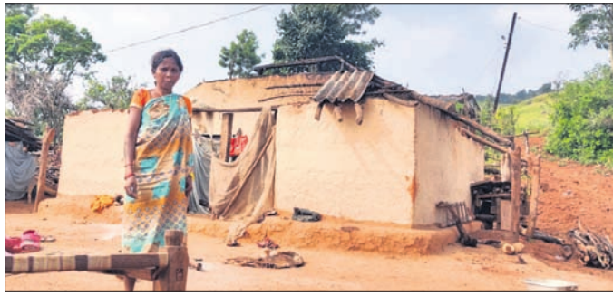
ଗ୍ରାମକୁ ଫେରିଥିବା ପରିବାର।

ଓଡିଶା ସାମାଜିକ ଅଞ୍ଚଳରେ ଲୋକଙ୍କୁ ଆକୃଷ୍ଟ କରିବା ଲାଗି ଆନ୍ଧ୍ର ସରକାରଙ୍କ ପକ୍ଷରୁ ଭଣ୍ଡା, ଆଧାର କାର୍ଡ, ଭୋଟର କାର୍ଡ ପ୍ରଦାନ କରି ବିଭିନ୍ନ ଯୋଜନା କାର୍ଯ୍ୟକାରୀ କରାଯାଇଛି। ମାଲକାନଗିରି ଜିଲ୍ଲା ଚିତ୍ରକୋଣ୍ଡାରେ ଥିବା ସ୍ୱାଧିନୀ ଅଞ୍ଚଳର ଧୂଳିପୁଟ ପଞ୍ଚାୟତ ଅଧୀନ ଜୁମାତଙ୍ଗ ଗ୍ରାମ ଆନ୍ଧ୍ର ବିଭିନ୍ନ ଯୋଜନା କରି ଲୋକଙ୍କୁ ନିଜ ସମ୍ପର୍କରେ ନେବା ଲାଗି ଉଦ୍ୟମ କରୁଥିଲା। ଏହି ଖବର ପାଇ ଜିଲ୍ଲା ପ୍ରଶାସନ ପକ୍ଷରୁ ସମ୍ପୃକ୍ତ ଅଞ୍ଚଳରେ ବିଭିନ୍ନ ଉନ୍ନୟନମୂଳକ