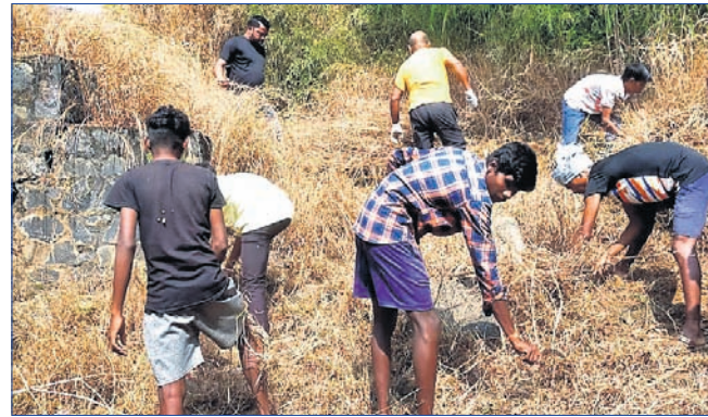
କୁଦୋପାଳି ଶିଳ୍ପାଞ୍ଚଳ ସଫେଇ କରୁଥିବା ଅନୁଷ୍ଠାନ କର୍ମଚାରୀ।