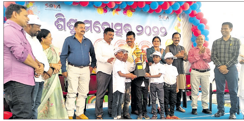
ଅତିଥିମାନେ କୃତି ପ୍ରତିଯୋଗୀଙ୍କୁ ପୁରସ୍କୃତ କରୁଛନ୍ତି ।