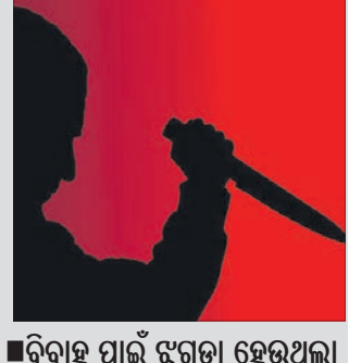
ବିବାହ ପାଇଁ ଝଗଡ଼ା ହେଉଥିଲା

ଜଣେ ବାହୁବା ଗତ ସେପ୍ଟେମ୍ବରରେ ତାଙ୍କ ଭାଇଙ୍କୁ ଜଣାଇଥିଲେ। ସେହି ଅବସ୍ଥା ମଧ୍ୟରେ ଶ୍ରଦ୍ଧା ସୋସିଆଲ ମିଡିଆରେ ମଧ୍ୟ ଗୋଟିଏ ହେଲେ ପୋଷ୍ଟ କରି ନ ଥିବା ପରିବାର ଲୋକେ ଯାଞ୍ଚ କରି ଜାଣିବାକୁ ପାଲଟେ।