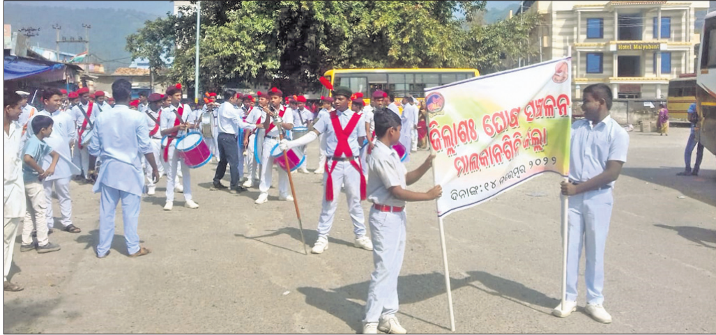
ଶିଶୁ ଦିବସ କାର୍ଯ୍ୟକ୍ରମରେ ଅଂଗ୍ରହଣ କରିଥିବା ଛାତ୍ରାଛାତ୍ରୀମାନେ ସହର ପରିକ୍ରମା କରୁଛନ୍ତି।