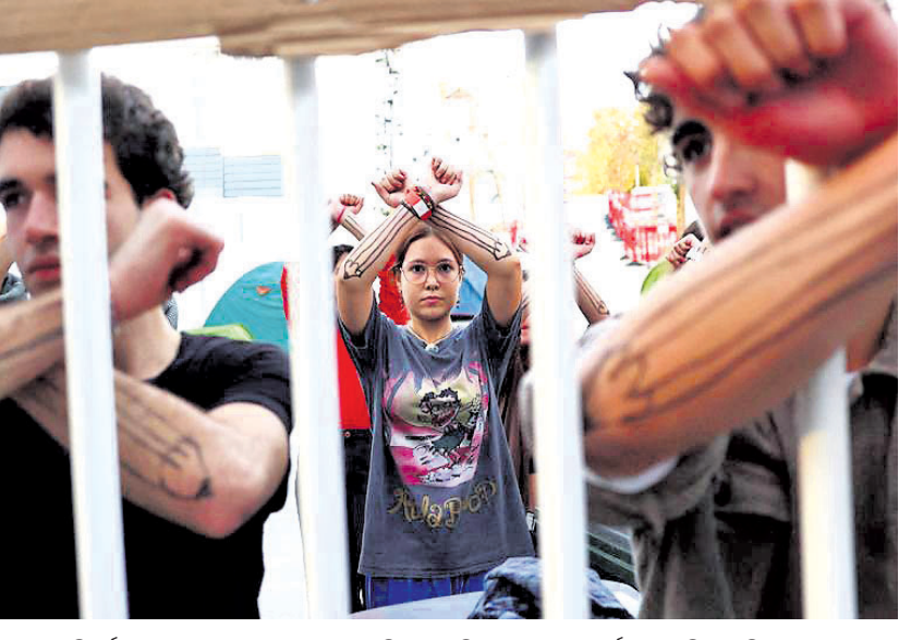
ଜଳବାୟୁ ପରିବର୍ତ୍ତନ ଏବଂ ଜୀବାଣୁ କ୍ଷୟ ବ୍ୟବହାର ବିରୋଧୀ ବିକ୍ଷୋଭକେ ପର୍ଯ୍ୟୁତ୍ତାଳର ଲିଭାବେଳିତ ଏକ ସ୍ଥଳରେ ବ୍ୟାରିକେଡ଼ କରାଯାଇଛି।

ଶର୍ମ ଏଲ୍-ଶେଖ୍, ୧୪।୧୧: ଇତିପୂର୍ବ ଶର୍ମ ଏଲ୍-ଶେଖ୍‌ରେ ଇତିସଂଘ ପକ୍ଷରୁ ଚାଲିଥିବା ଜଳବାୟୁ ପରିବର୍ତ୍ତନ ସଂକ୍ରାନ୍ତ ୨୭ତମ ସମ୍ମିଳନୀରେ ବିଶ୍ୱନେତାମାନେ ବିଭିନ୍ନ ପ୍ରସଙ୍ଗ ଉପରେ ଆଲୋଚନା କରୁଛନ୍ତି।