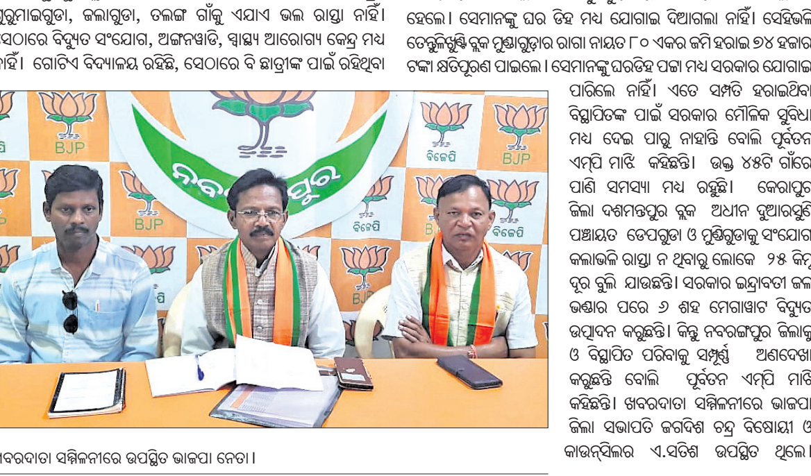
ଖବରଦାତା ସମ୍ମିଳନୀରେ ଉପସ୍ଥିତ ଭାଗ୍ୟା ନେତା ।