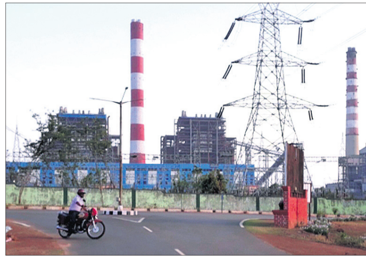
ବନ୍ଦ ଥିବା ପ୍ରକଳ୍ପର ଘାଟ ଓ ଧର୍ଯ୍ୟ ଯୁକ୍ତ