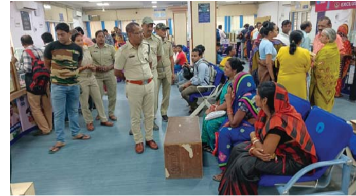
ଆଜ୍ଞାପ ସ୍ଵାସ୍ଥ୍ୟକେନ୍ଦ୍ର ଅନୁଧ୍ୟାନ କରୁଛନ୍ତି ।