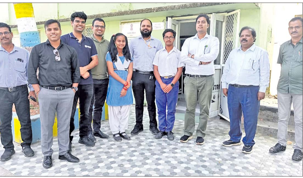
୪ ଶିକ୍ଷାନବିସଙ୍ଗ ସୋରଡ଼ାରେ ବିଦ୍ୟାଳୟ ପରିଦର୍ଶନ କରୁଛନ୍ତି ।