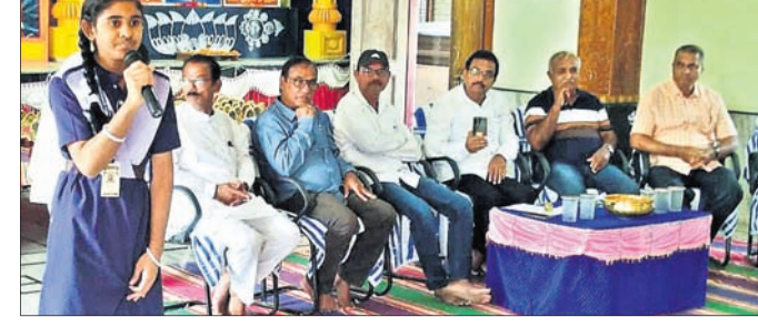
ଶିଶୁ ଦିବସରେ ଉପସ୍ଥିତ ଅତିଥି ।

ଗୋଷାଣୀନୁଆଁ ସରସ୍ବତୀ ଶିଶୁ ବିଦ୍ୟାଳୟରେ ଶିଶୁ ଦିବସ ପାଳିତ ହୋଇଥିଲା।