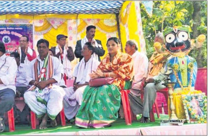
ସମ୍ପର୍କିତ ବ୍ୟକ୍ତି ।