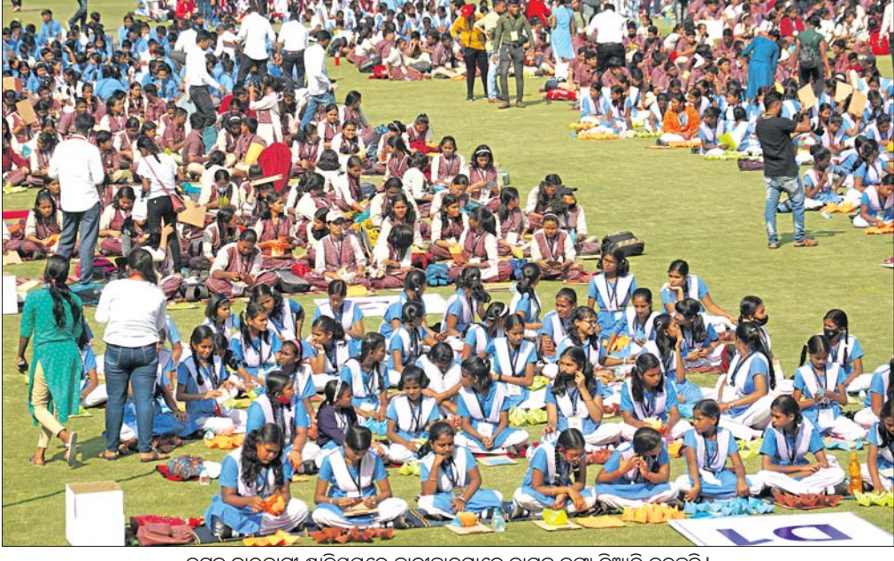
କଟକ ବାରବାଟୀ ଷ୍ଟାଡ଼ିୟମରେ ଛାତ୍ରାଛାତ୍ରୀମାନେ କାଗଜ ତଜା ତିଆରି କରୁଛନ୍ତି ।