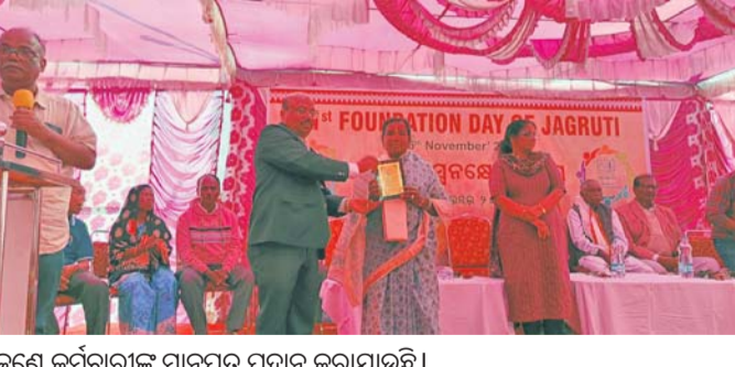
କଣେ କର୍ମଚାରୀଙ୍କୁ ମାନପତ୍ର ପ୍ରଦାନ କରାଯାଇଛି ।

ବାରିଜବାଡ଼ି ବ୍ଲକ ଜାଗୃତି ଅନୁସ୍ଥାନର ୪୦ବର୍ଷ ପୂର୍ଣ୍ଣ ଏବଂ ୪୯ ବର୍ଷରେ ପର୍ଯ୍ୟନ୍ତ କରିଥିବାରୁ ତାହା ପ୍ରତିଷ୍ଠା ଦିବସ ଜାଗୃତି କାର୍ଯ୍ୟକ୍ରମ ସମ୍ବନ୍ଧରେ ପାଳନ ହୋଇଯାଇଛି ।