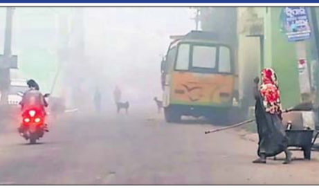
ଲୁହୁଟିରେ ଆଛାଦିତ ଅଞ୍ଚଳର ଦୃଶ୍ୟ। ଲୁହୁଟି ଯୋଗୁ କଳିଙ୍ଗା ଘାଟିରେ ଗାଡି ଚଳାଚଳ ଅସୁବିଧା ହେଉଛି। ଅନ୍ୟପକ୍ଷରେ ଶୀତର ମଜା ନେବା ସହ ପ୍ରାକୃତିକ ପରିବେଶର ଉପଭୋଗ ପାଇଁ ପର୍ଯ୍ୟଟକମାନଙ୍କ ଗହଳି ଲାଗିବ। ଏଥିପାଇଁ ହୋଟେଲଗୁଡ଼ିକ ପ୍ରସ୍ତୁତ ହୋଇଛନ୍ତି।