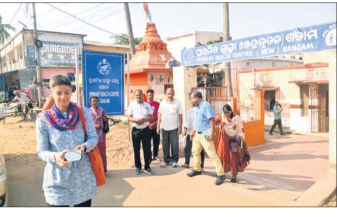
ଗଞ୍ଜାମ ସ୍ଵାସ୍ଥ୍ୟକେନ୍ଦ୍ର ପରିଦର୍ଶନ କରୁଛି ପ୍ରତିନିଧି ଦଳ ।

ଭୂବନେଶ୍ଵର ଇଣ୍ଟର ନ୍ୟାଶନାଲ ସଂସ୍ଥା ଜାପାଲର ଏକ ତାରି ଜଣିଆ ପ୍ରତିନିଧି ଦଳ ମଙ୍ଗଳବାର ଗଞ୍ଜାମ ସ୍ଵାସ୍ଥ୍ୟକେନ୍ଦ୍ର ପରିଦର୍ଶନ କରିଥିଲେ ।