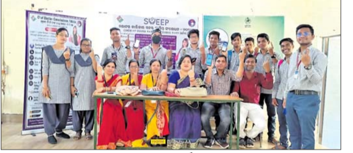
ସିଡି ମହାବିଦ୍ୟାଳୟରେ ଭୋଗର ସଚେତନତା କାର୍ଯ୍ୟକ୍ରମ ।