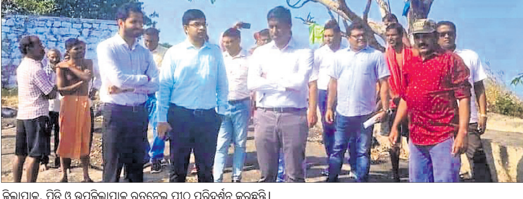
ଜିଲାପାଳ, ପିତି ଓ ଉପଜିଲ୍ଲାପାଳ ରତନେଇ ପୀଠ ପରିଦର୍ଶନ କରୁଛନ୍ତି।

ଶେରଗଡ଼, ୧୫୧୧୧ (ଡି.ଏନ୍.ଏ.): ଶେରଗଡ଼ ଡିପ୍ୟୁଟି ମ୍ୟାଗିଷ୍ଟ୍ରେଟ୍ ଅଫିସରେ ଡାକ୍ତରୀ ପରେ ମୃତଦେହକୁ ଜବତ କରାଯାଇଛି।