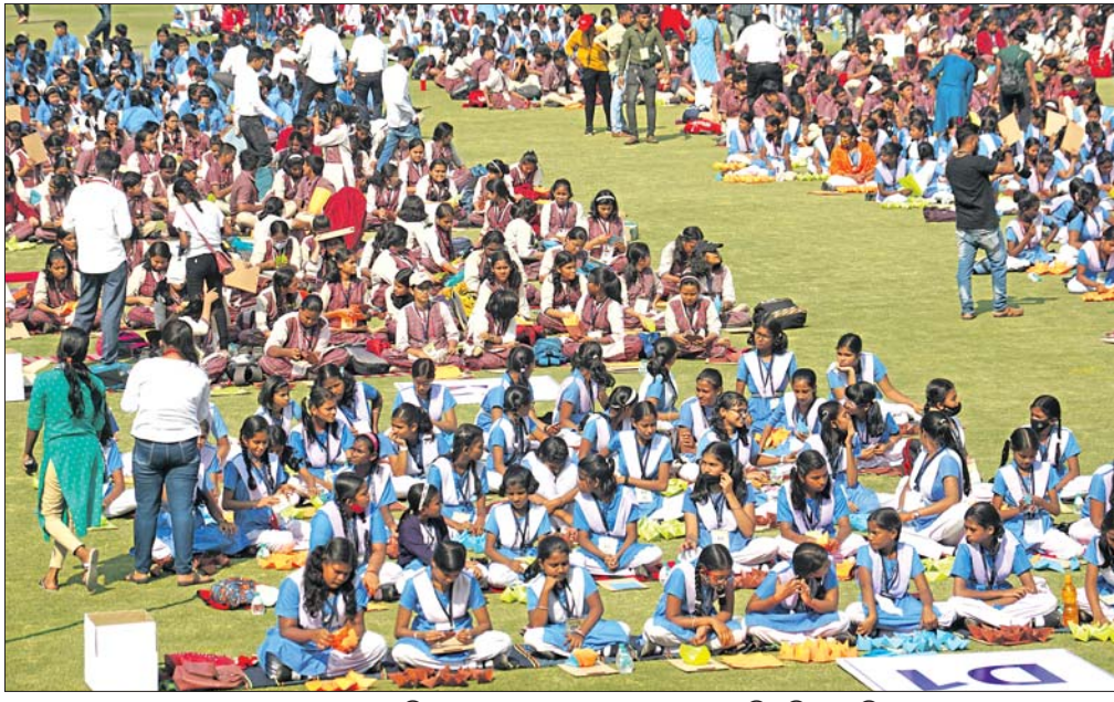
କଟକ ବାରବାଟୀ ଷ୍ଟାଡ଼ିୟମରେ ଛାତ୍ରାଛାତ୍ରୀମାନେ କାଗଜ ତଳା ତିଆରି କରୁଛନ୍ତି।