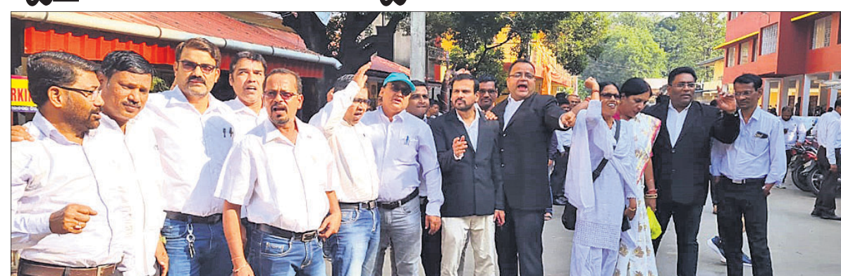
ସଂଘ କାର୍ଯ୍ୟାଳୟ ସମ୍ମୁଖରେ ଆଇନଜୀବୀମାନେ।