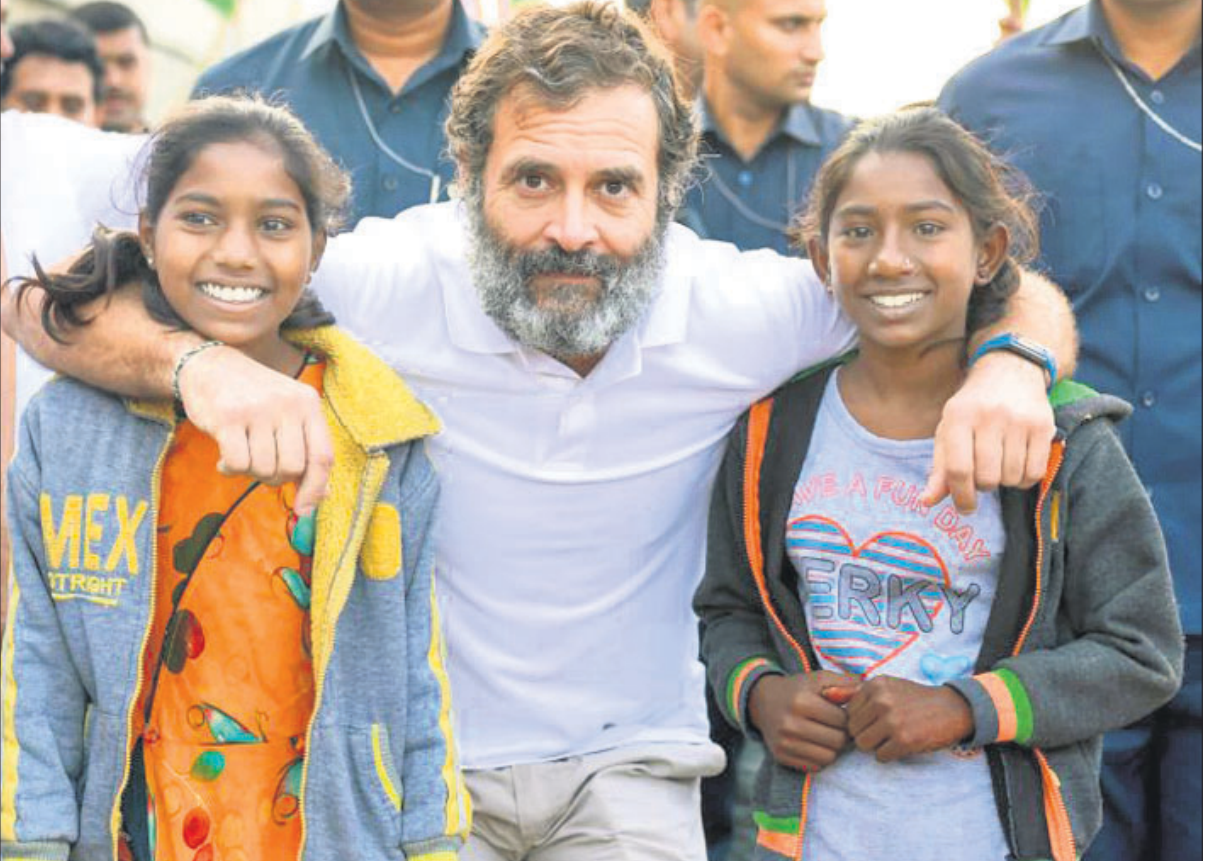
ଭାରତ ଯୋଡ଼ୋ ଯାତ୍ରା ଅବସରରେ ମଙ୍ଗଳବାର ମହାରାଷ୍ଟ୍ରର ହିଜୋଲି ଜିଲ୍ଲାରେ ସମର୍ଥକଙ୍କ ସହ କଂଗ୍ରେସ ନେତା ରାହୁଲ ଗାନ୍ଧୀ ।